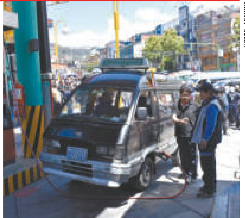
Una estación de servicio en La Paz.

El miércoles, el INE informó que la Actualización Cartográfica Estadística (ACE) llegó al 99,2% y solo resta el trabajo en los departamentos de Cochabamba y Santa Cruz, además la tarea concluirá en agosto, según establece el cronograma.