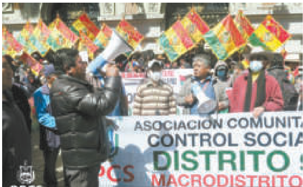
Líderes del OCPS durante las protestas de 2022.