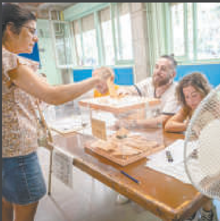
Jornada de votación.

Sánchez, pese al segundo puesto, celebró que mejoró los resultados de hace cuatro años y que el bloque de derechas no alcanzó la mayoría necesaria para gobernar.