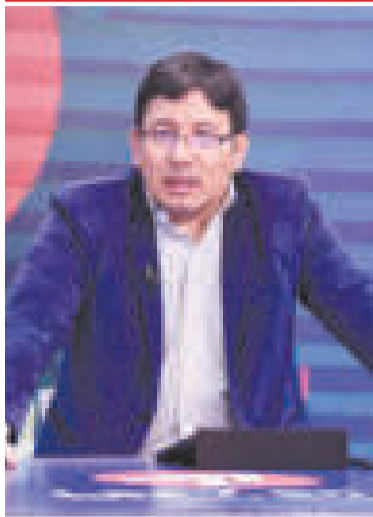
El ministro Franklin Molina.