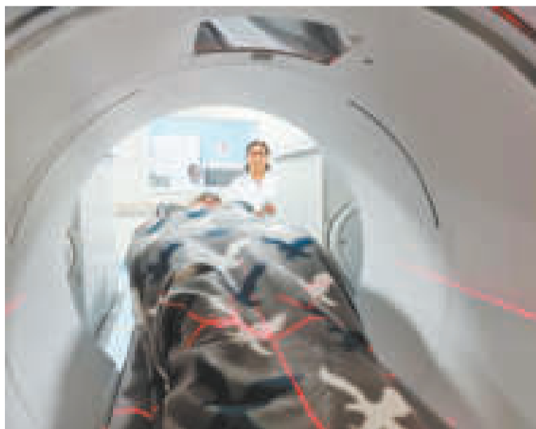
El personal está capacitado para el manejo de tecnología nuclear de punta.

En la segunda parte, que es más funcional, los inspectores preguntaron a los usuarios, tecnólogos, físicos y médicos