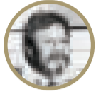
Armando Aquino Huerta

Revisando los actos gubernamentales de nuestra Patria Bolivia, resultan estar plagados de hechos antipatrióticos, de corrupción y delictivos —salvando excepciones—, relacionados con la definición de “Incapaz: que no tiene capacidad o aptitud para algo...” que nos da el Diccionario de la Lengua Española (RAE), se ve claramente que tuvimos GOBERNANTES INCAPACES con aires de intelectuales, demócratas y salvadores de la Patria —para engañar al pueblo—, porque no demostraron capacidad para solucionar los problemas del país ni para satisfacer las necesidades del pueblo boliviano; en otras palabras, puede decirse que fueron GOBERNANTES INÚTILES si tenemos presente la definición de: “Útil: que trae o produce provecho, comodidad, fruto o interés. Que puede servir y aprovechar en alguna línea”, conforme la RAE.