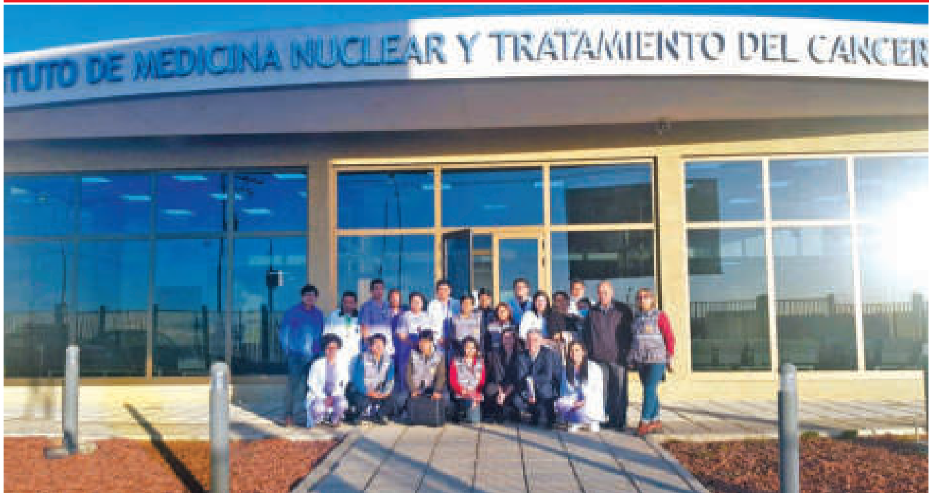
Personal y funcionarios de la OIEA, durante la inspección.