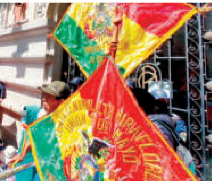
Protesta de los representantes del control social por el POA 2023.