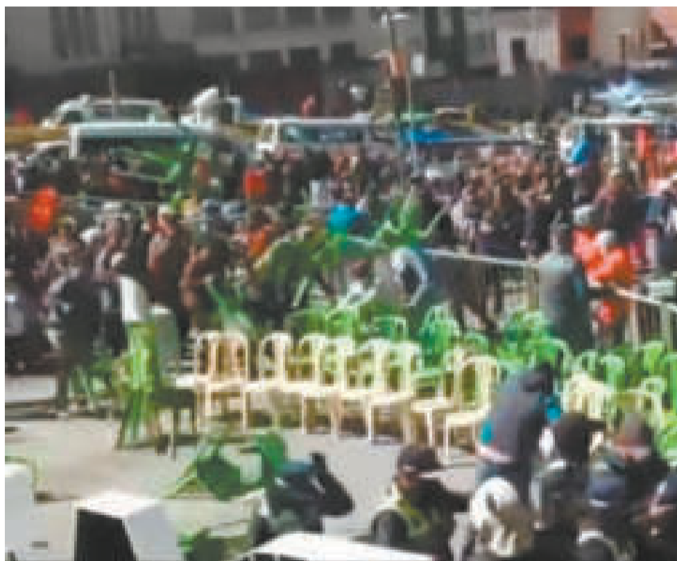
Enfrentamiento de comerciantes y funcionarios ediles durante la Verbenas paceña.