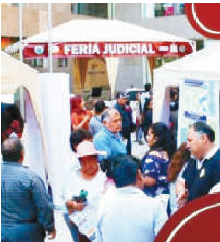
Una feria acerca el sistema judicial a la población.