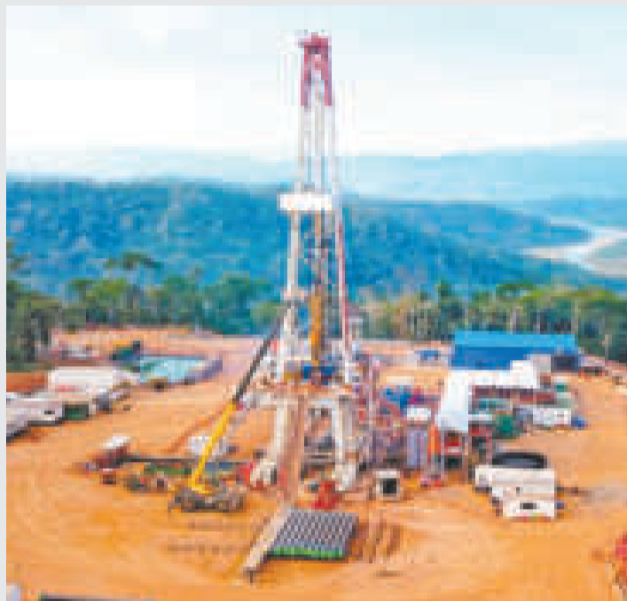
El pozo Yope-X1 está ubicado en Yapacaní, Santa Cruz.

del pozo Yope-X1, ubicado en Yapacaní, Santa Cruz, que aportará con petróleo crudo, “y que nos ha dado una importante noticia al país”.