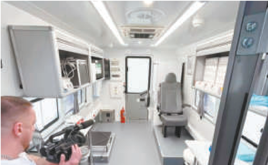
Moderna unidad médica móvil.