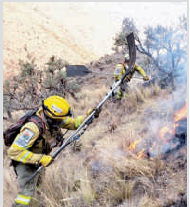
Bomberos combaten el incendio del sábado en Cochabamba.

“Después del 31, si la ABT suspende el periodo de autorización por quemas, toda quema será una actividad ilegal. Ya se comenzó con los patrullajes aéreos, hemos pasado nuestra información a la ABT para la verificación de los permisos correspondiente”, detalló el viceministro, quien afirmó que si bien aún está en evaluación una posible ampliación es muy probable que el periodo de autorización culmine en la fecha prevista.