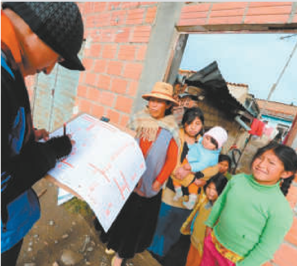
Personal del INE en labores de actualización cartográfica.

Dichas normas tienen el fin de luchar contra el desvío de combustibles y permiten a los sectores productivos, como el agro, la minería y el transporte, adquirir mayores volúmenes de carburantes a precio nacional, y al Estado ahorrar en la subvención.