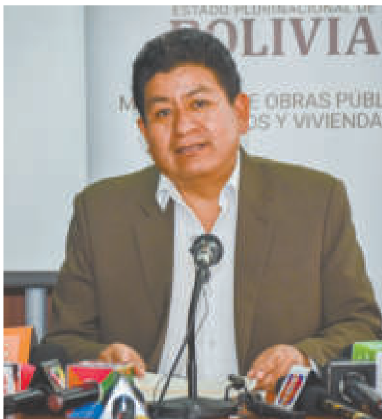
El ministro de Obras Públicas, Édgar Montaña, durante la entrevista.