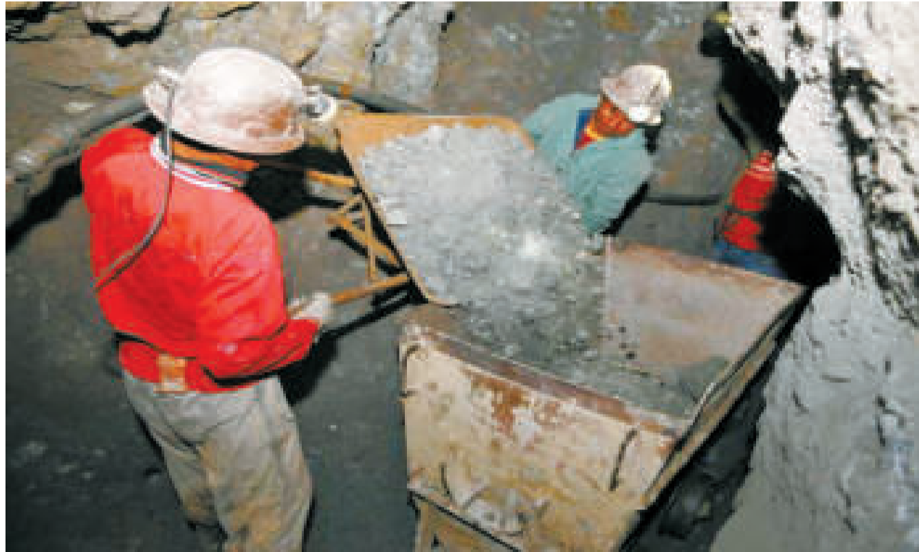
Dos trabajadores en el interior de una mina en el Cerro Rico de Potosí.