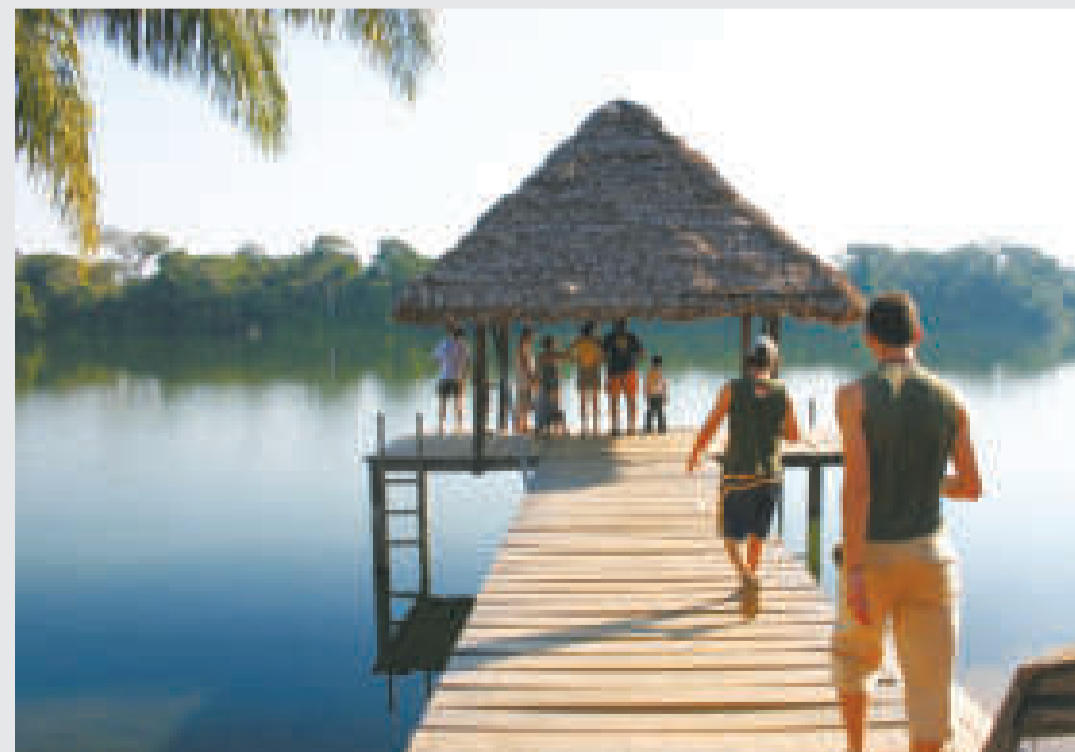
Un grupo de personas en un destino turístico de Bolivia.

||||||||||||||||||||||||||||||||||||||||