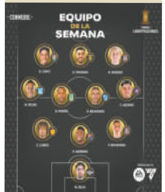
El equipo ideal que armó la Conmebol.