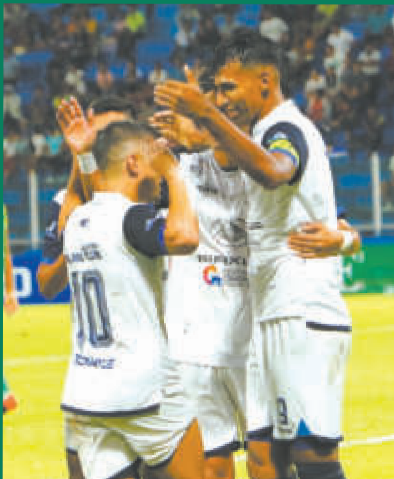
Jugadores de Palmaflor celebran la goleada sobre el equipo beniano.