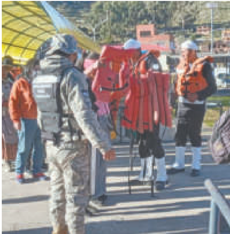
Soldados controlan el uso de salvavidas en las personas que cruzan el estrecho de Tiquina.