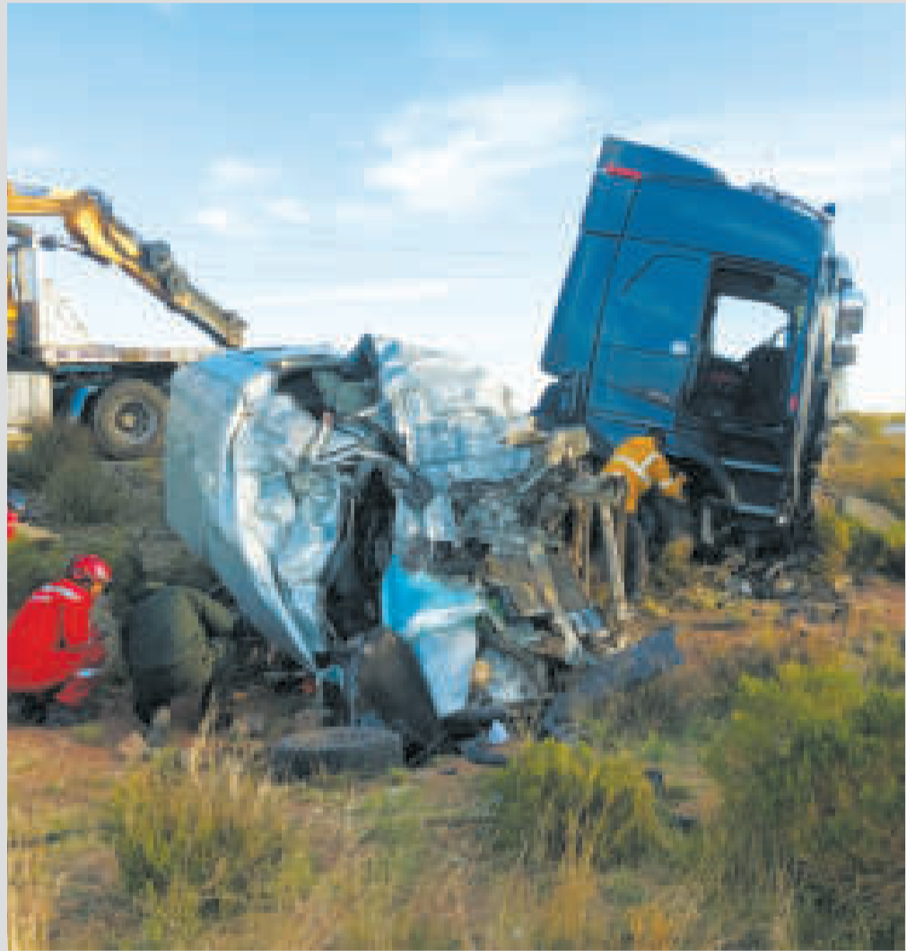
El siniestro que se suscitó en la carretera Pisiga-Oruro.