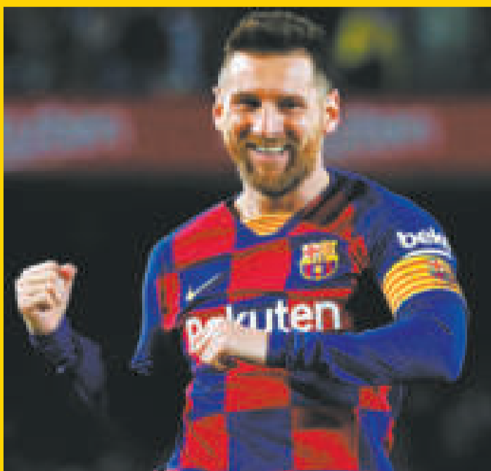
La vuelta de Messi al Barcelona está cada vez más cerca.