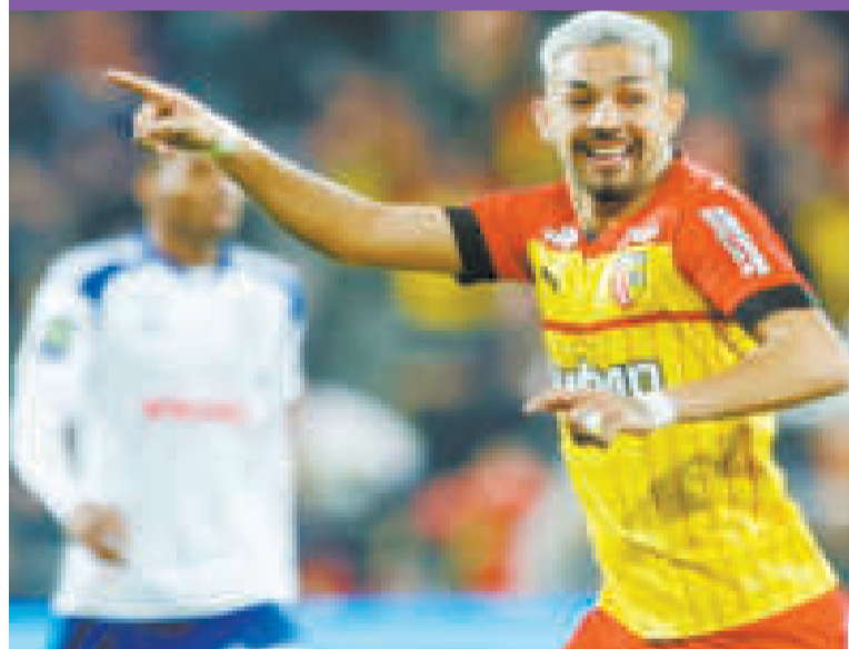
Facundo Medina celebra su gol que le dio el triunfo al Lens.

Lo hizo en los minutos finales, gracias a un remate de Kevin Gameiro desde fuera del área que redujo distancias para meter el miedo a los hombres de Franck Haise. En los últimos instantes, el Estrasburgo pidió un penal que el VAR no concedió.