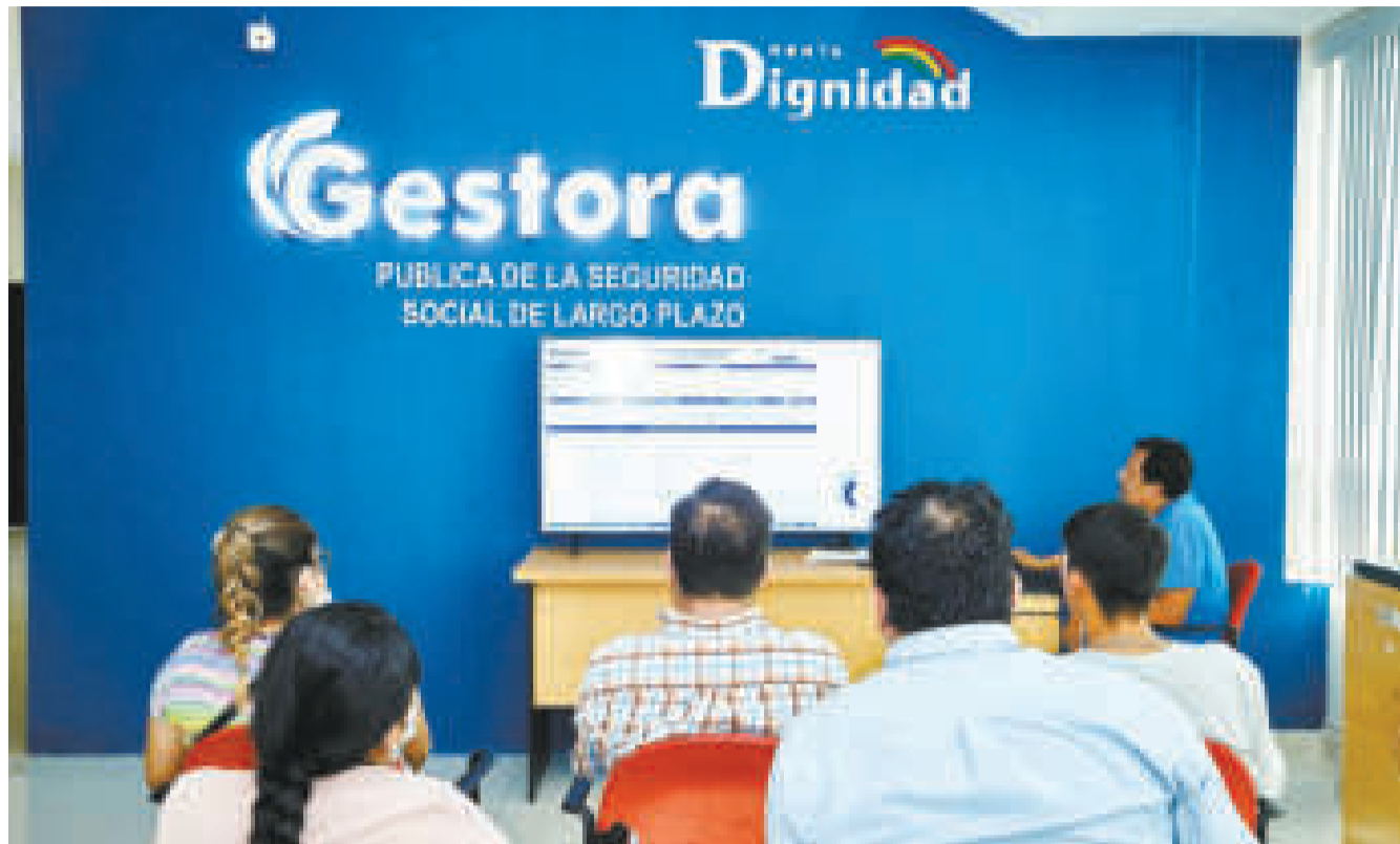
Aportantes conocen detalles del funcionamiento de la Gestora Pública.