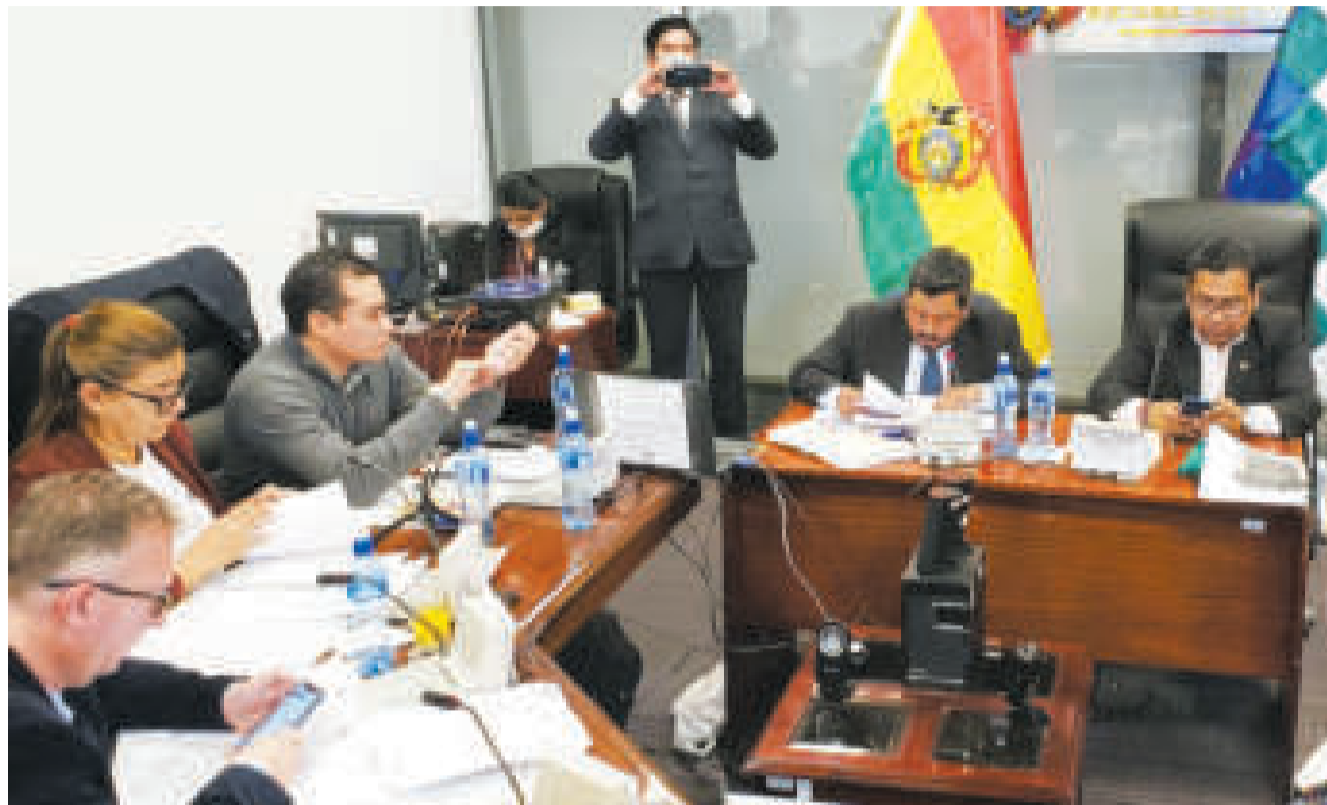
Una sesión de la Comisión de Constitución de la Cámara de Diputados.

Al no delimitar la normativa vigente y no seguir las recomendaciones del GAFI, el país corre el riesgo del cierre de cuentas de corresponsalía bancaria, otros Estados pueden optar por no operar con Bolivia porque sus recursos podrían corresponder a actividades ilícitas.