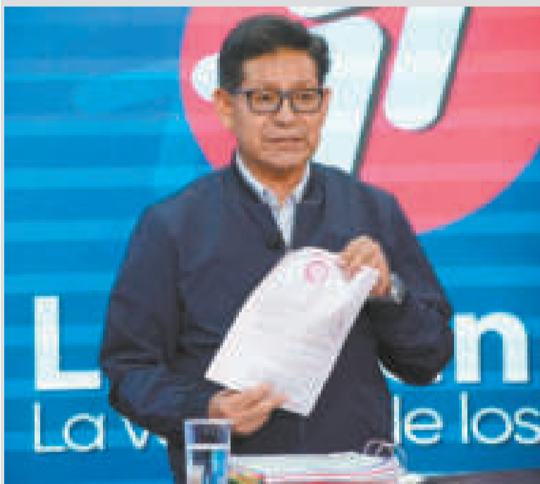
El titular de Educación, Édgar Pary, en el programa 'Las 7 en el 7'.