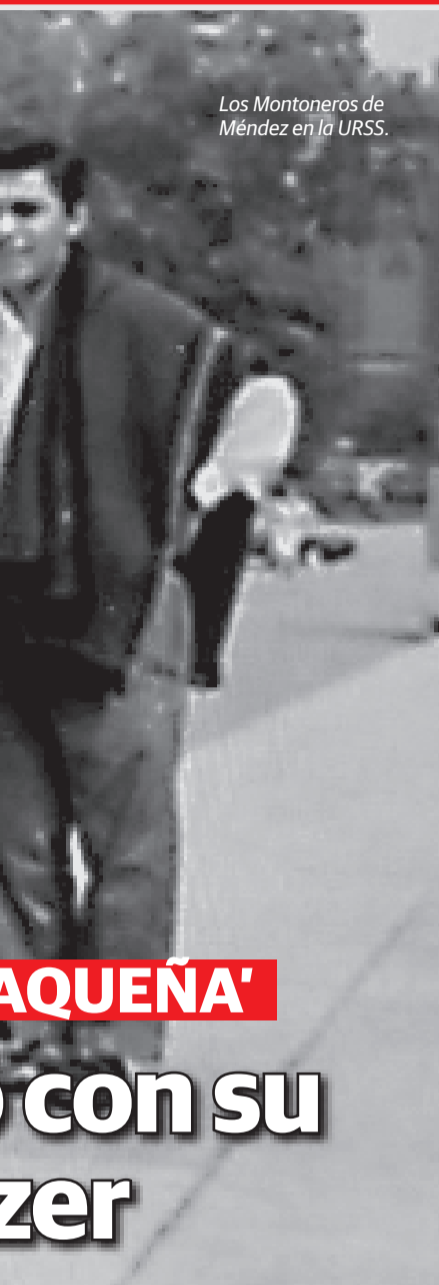
Los Montoneros de Méndez en la URSS.