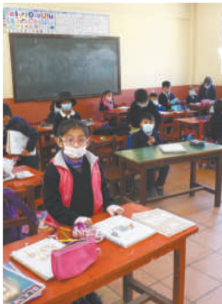
Niños y niñas esperan a su maestra dentro de su aula.

“Es importante asumir que hay una campaña mediática global, no sólo es en Bolivia, de todos estos fundamentalistas religiosos, antederechos, que obviamente aprovechan este escenario político”, lamentó.