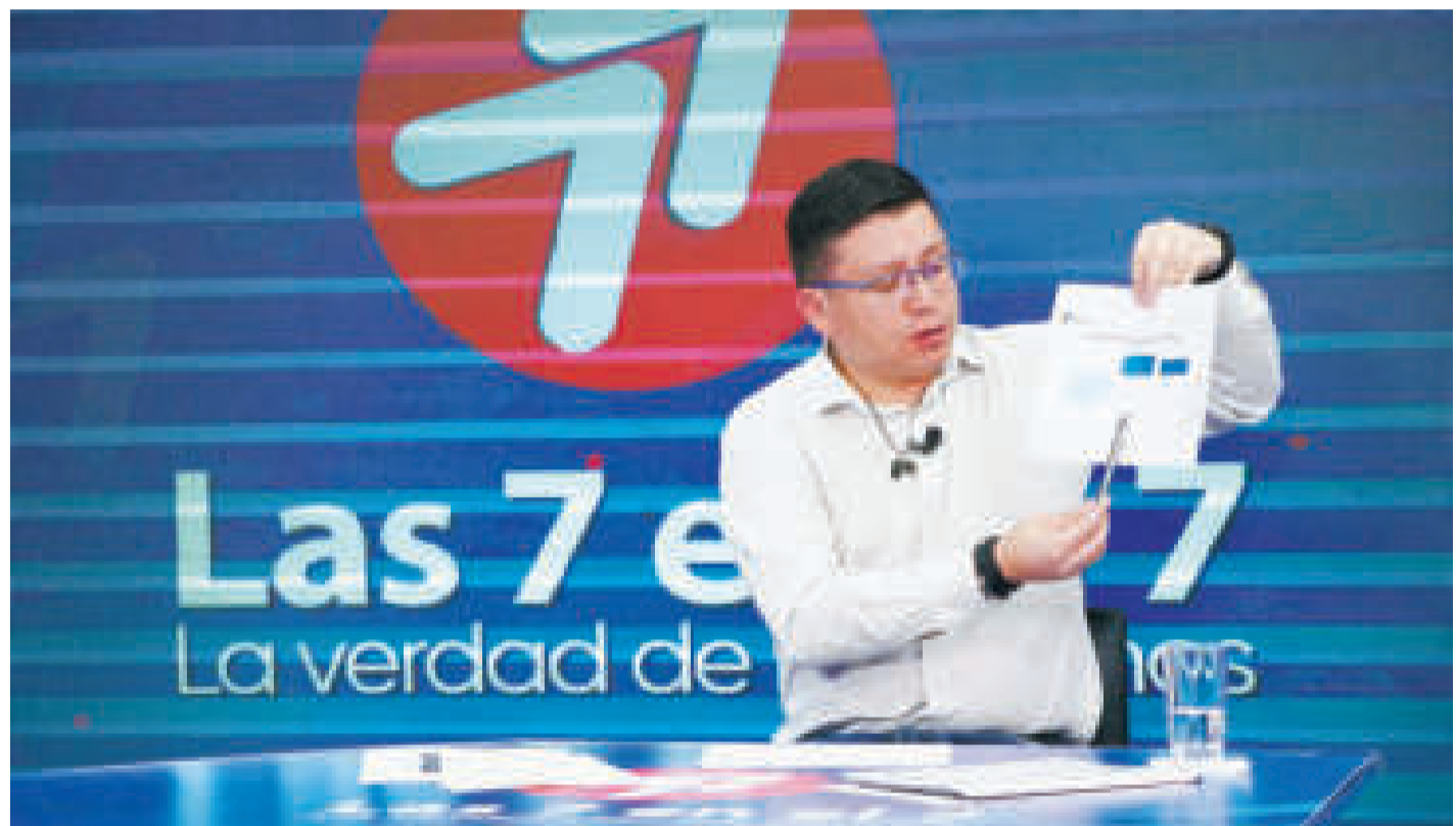
El ministro Cusicanqui en el set del programa 'Las 7 en el 7' de Bolivia TV.

El ministro Sergio Cusicanqui dijo que en Bolivia la demanda interna retoma su dinamización y que ahora el desafío es la industrialización.