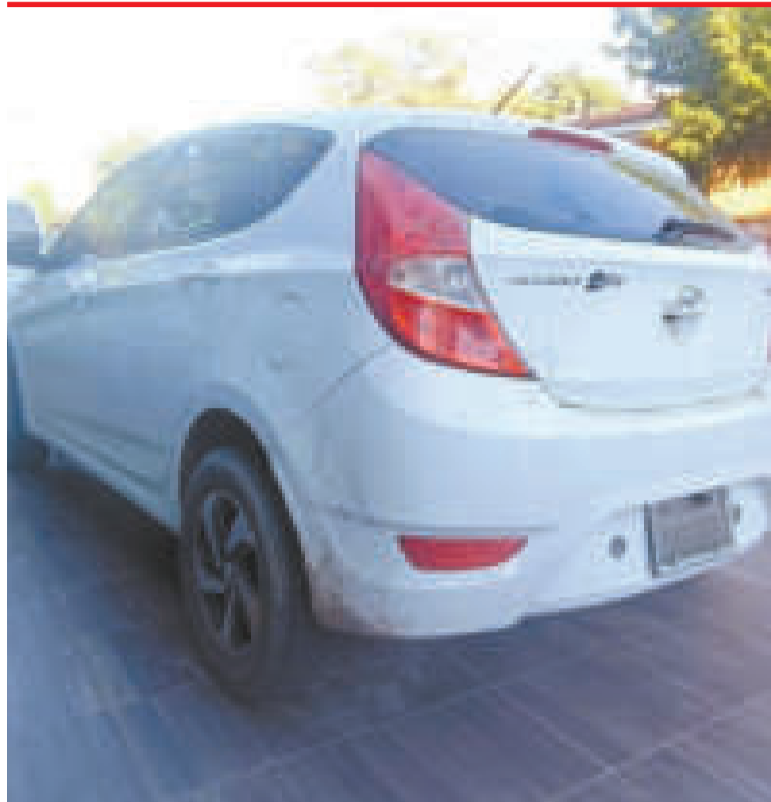
El vehículo que fue secuestrado por la Policía junto a los tres individuos.