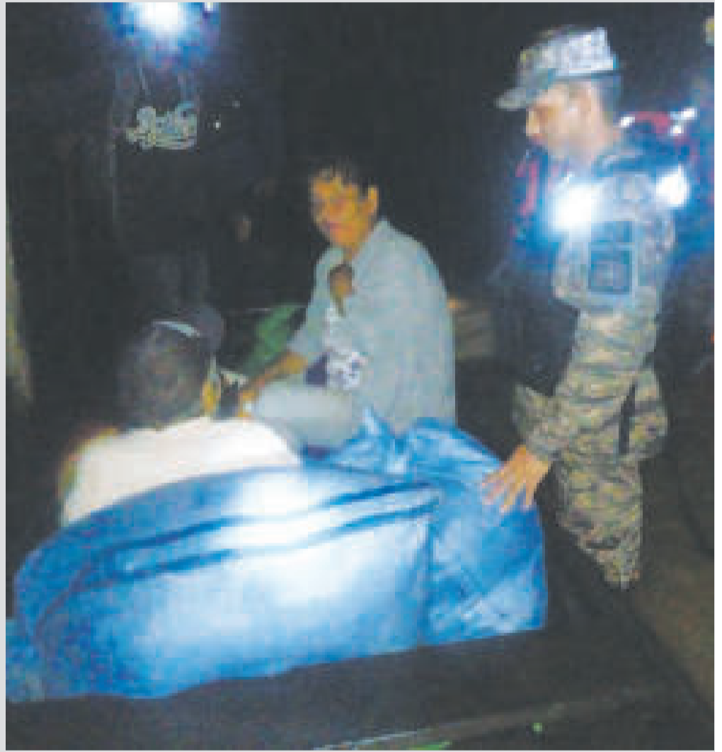
Militares ayudan en la evacuación de familias.