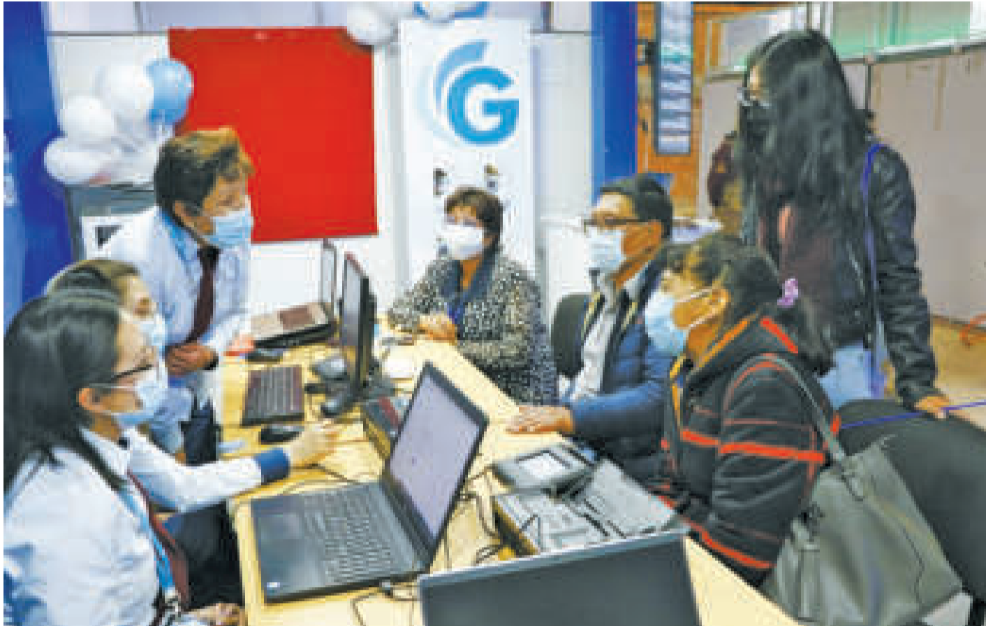
La Gestora tendrá oficinas en cada departamento para atender al público.