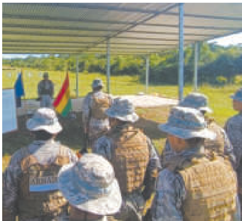
Los nuevos policías de navegación durante su capacitación.