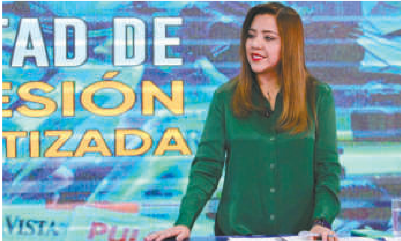
La viceministra de Comunicación, Gabriela Alcón, en el programa 'Las 7 en el 7' , de Bolivia TV.

Asimismo, señaló que, si bien existe el derecho a la libertad de expresión, desde el Gobierno se espera el equilibrio informativo para que la población reciba esa calidad noticiosa que se merece.