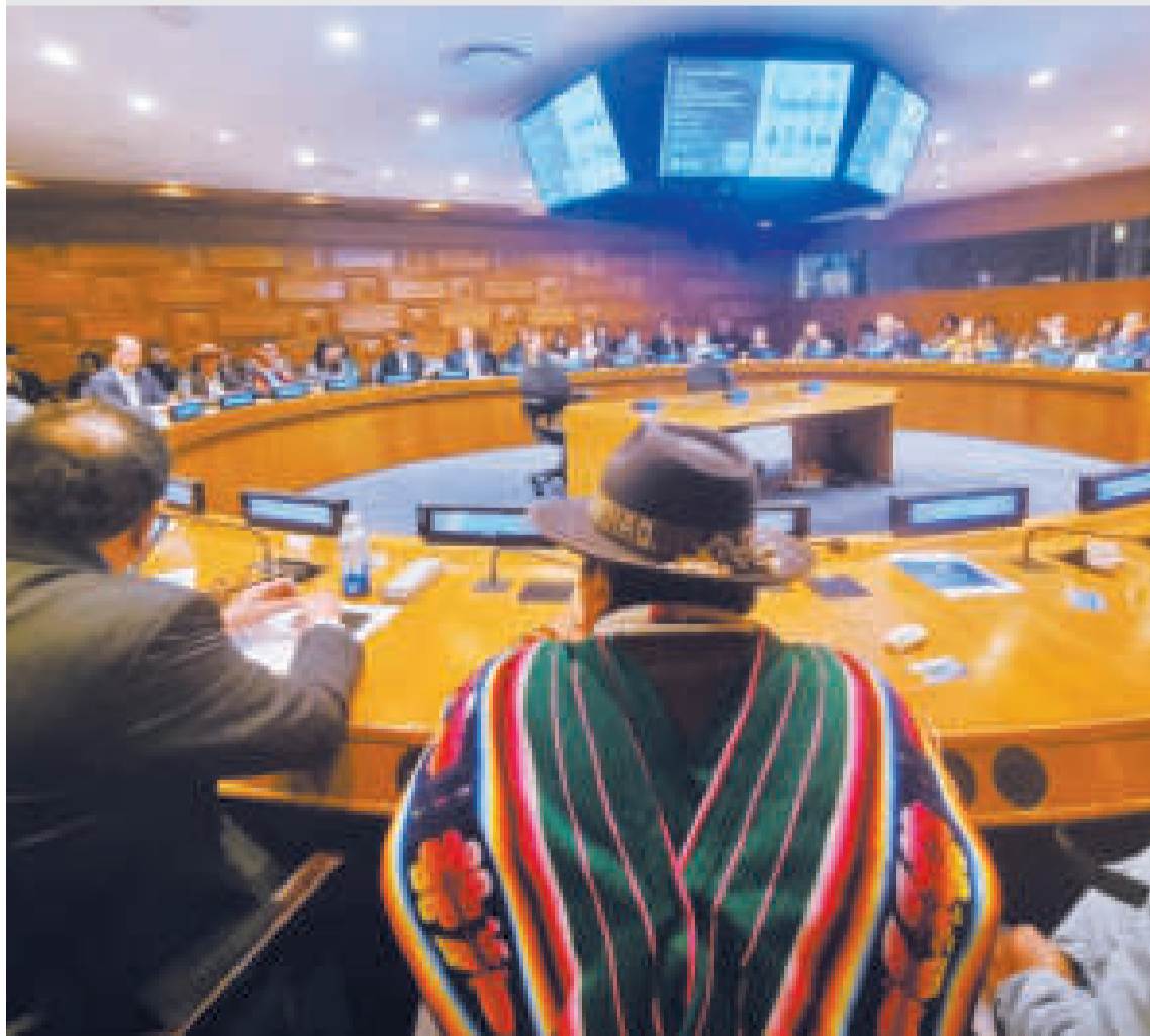
Un momento de la II Conferencia de la ONU sobre el Agua, en la que participaron dirigentes campesinos.

Arce planteó al mundo en esa ocasión que se declare el 2024 como el “Año internacional del agua para la vida”.