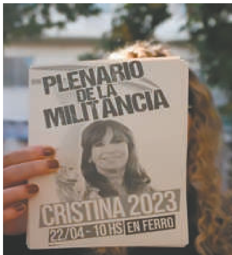
Una militante muestra uno de los panfletos de la marcha.

Con el grito ¡Cristina presidenta!, los presentes reiteraron su apoyo a una posible candidatura de la exjefa de Estado, quien ha denunciado las acciones mediáticas y judiciales para proscribirla.