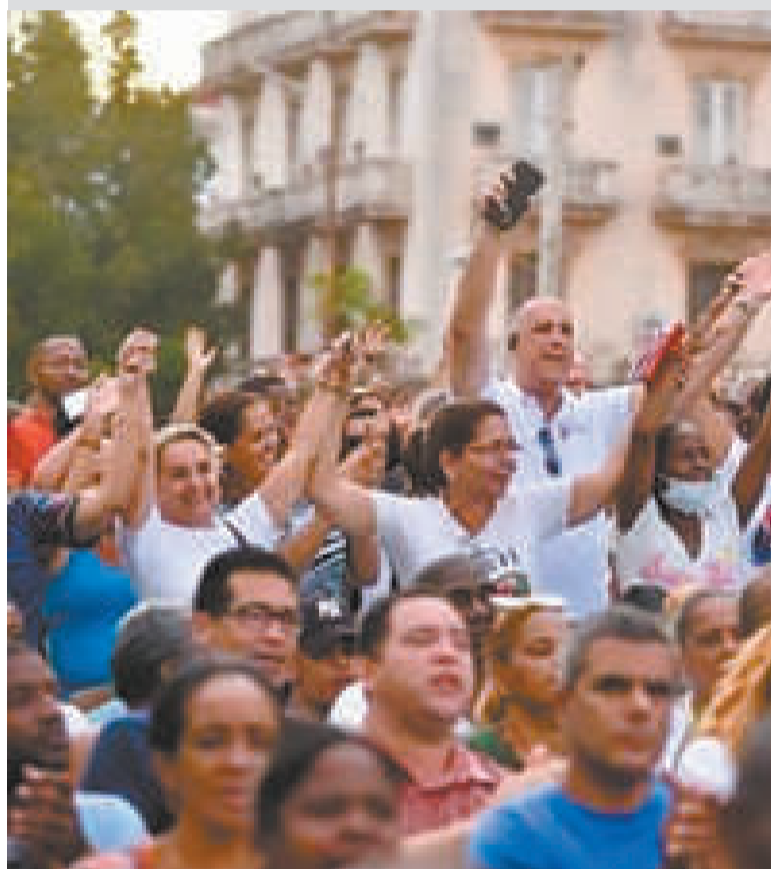
El encuentro incluyó momentos como la declamación del poema 'Por esta libertad'.