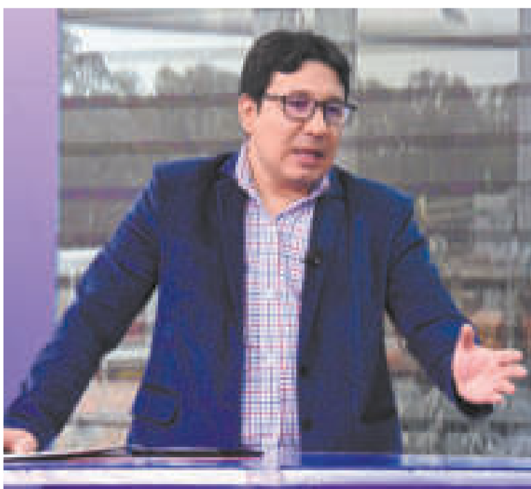
El ministro de Hidrocarburos, Franklin Molina.