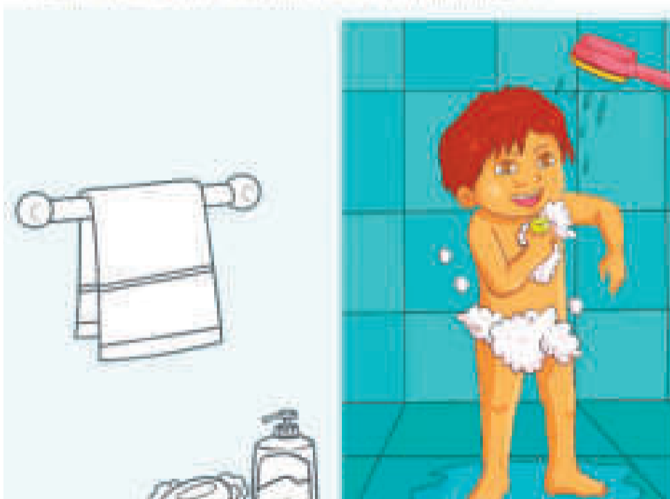
Página 14 del 'Texto de aprendizaje - 1er. año de Educación Inicial en Familia Comunitaria'.

Observamos las imágenes y comentamos sobre los cambios de sexo y contextos culturales.