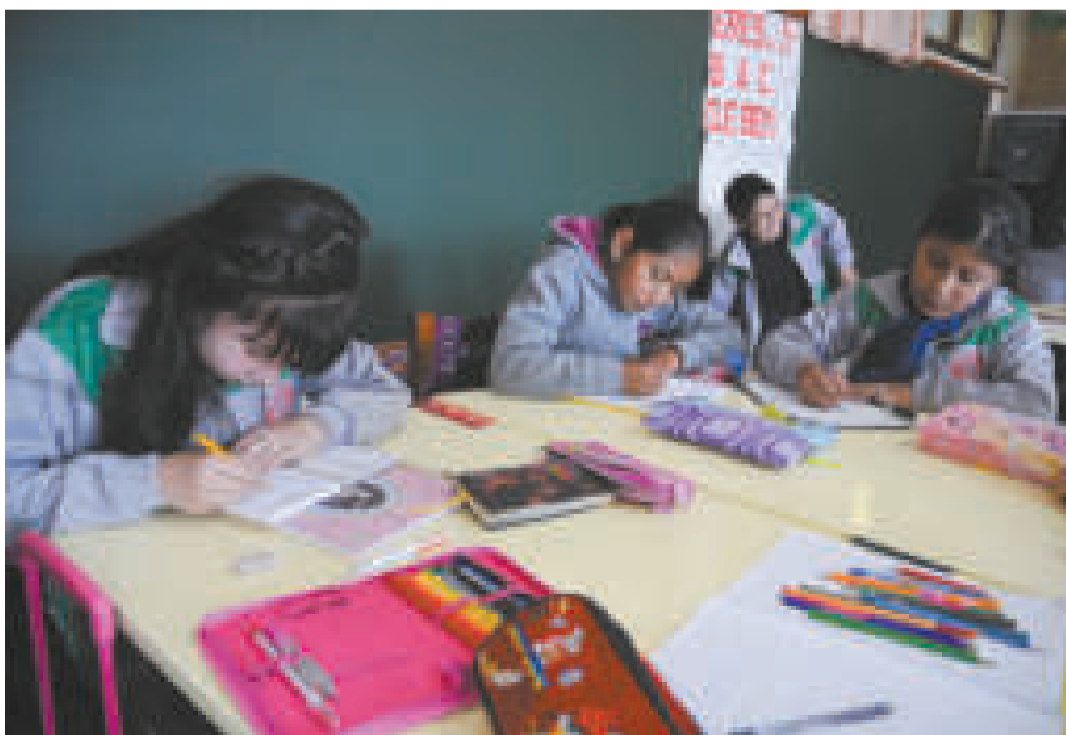
Los estudiantes del país se benefician con textos gratuitos.

lizar las partes del cuerpo. Esto implica representarlas tal como son anatómicamente. En este caso la espuma que tapa una parte del cuerpo del niño no hace más que generar curiosidad. Es muy importante que los maestros nos acostumbremos a utilizar los nombres correctos de todo el cuerpo, porque después tenemos adultos incapaces de nombrar su vulva o su pene, ▶