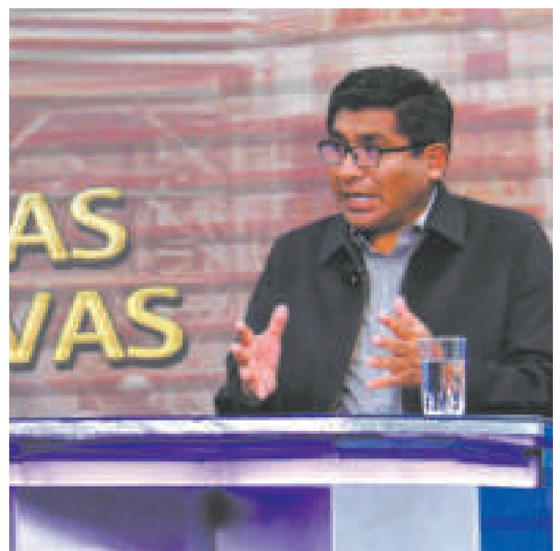
El ministro de Producción, Néstor Huanca, en entrevista con Bolivia TV.

MILLONES DE BOLIVIANOS de inversión se ejecutan para las 43 nuevas industrias.