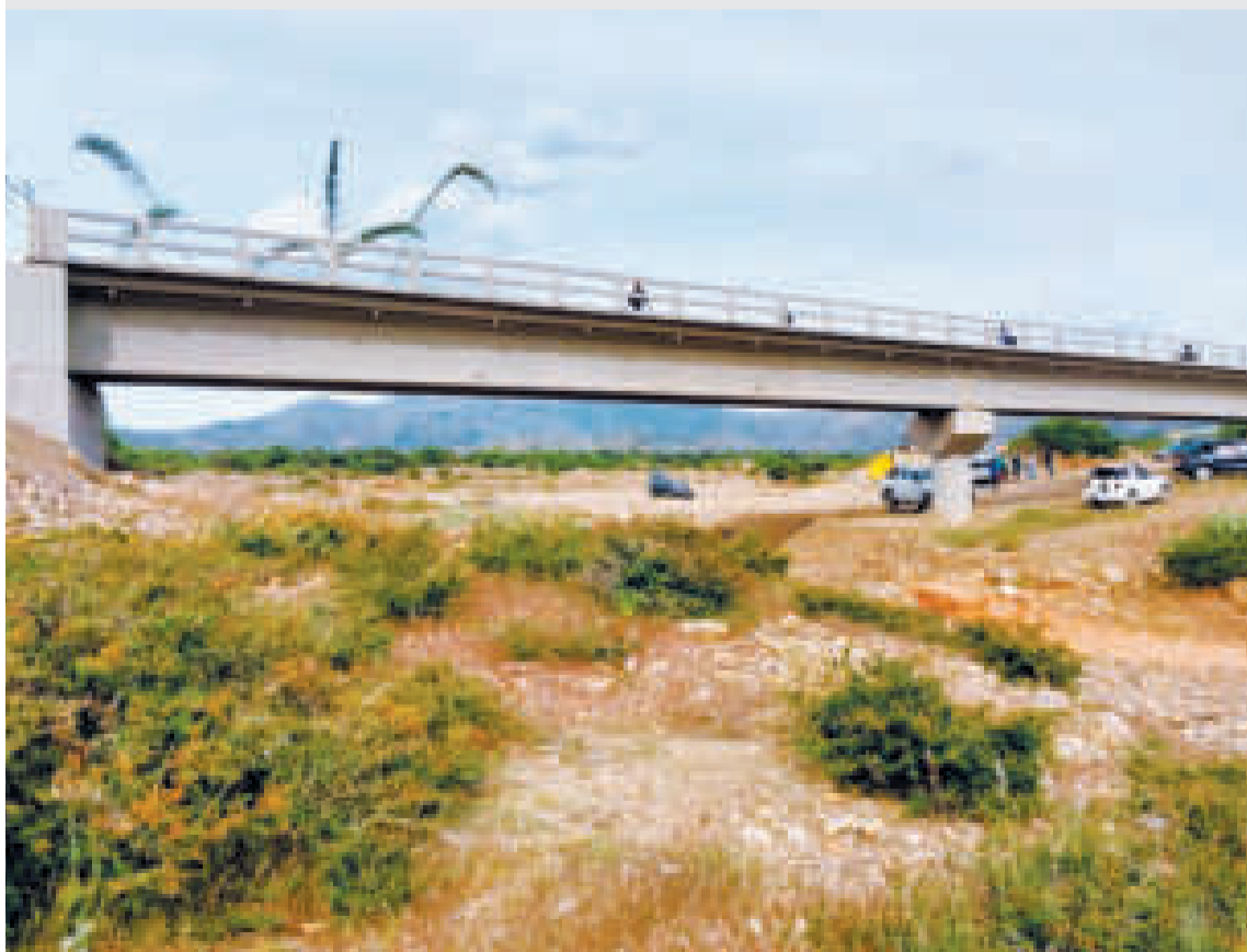
El puente vehicular en el municipio de Santiváñez.

El puente vehicular cuenta con una construcción de hormigón armado de 60 metros de longitud, vigas postensadas de una altura de 1,60 metros pensadas para un óptimo rendimiento en el transporte de la producción agrícola de la zona, con una vía, ancho de calzada de cuatro metros, protecciones laterales de hormigón armado, entre otras características técnicas.