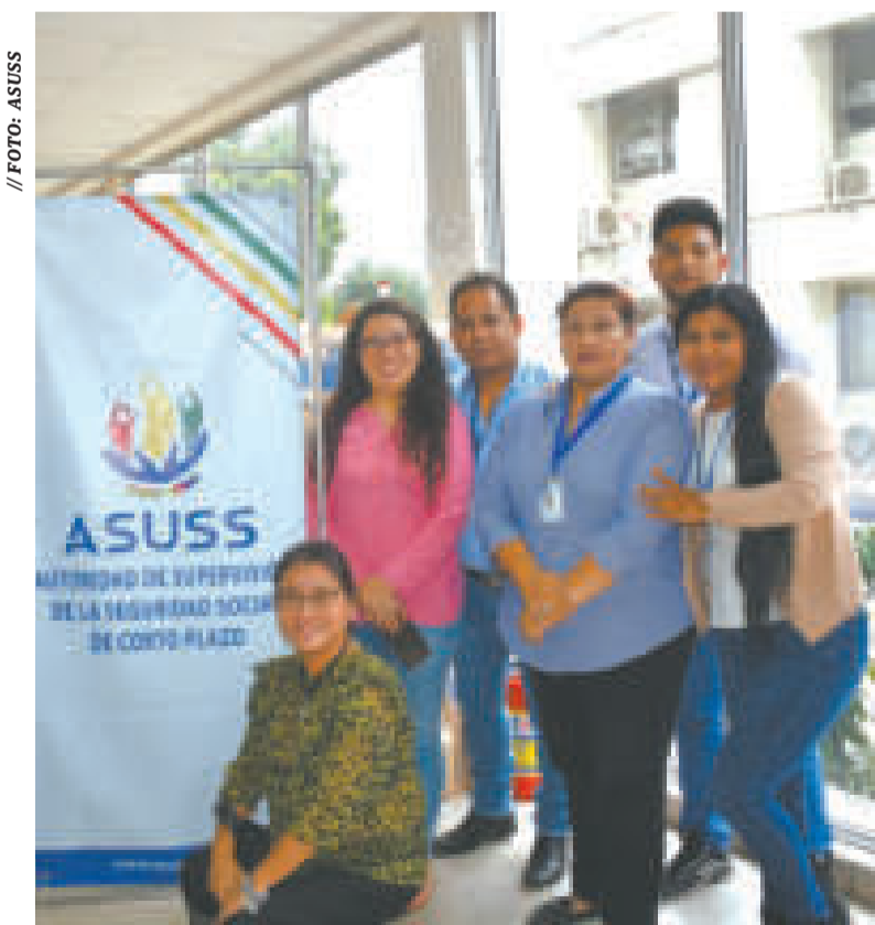
Asistentes a la actividad de Asuss.

La salud ocupacional es una estrategia que asegura el bienestar de los trabajadores, así como la fortaleza de las economías nacionales a través de una mejor productividad, motivación y calidad de productos.