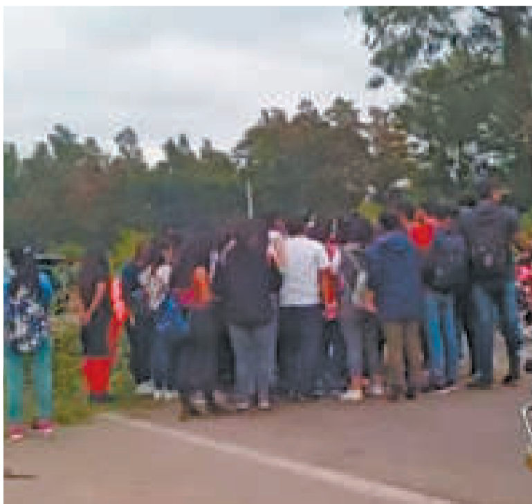
Estudiantes bloquean la carretera Santa Cruz-Yacuiba.

Este bloqueo se instalará poco tiempo después de que se celebrara la efeméride del departamento valluno, que se conmemora cada 15 de abril, en memoria de la Batalla de la Tablada.