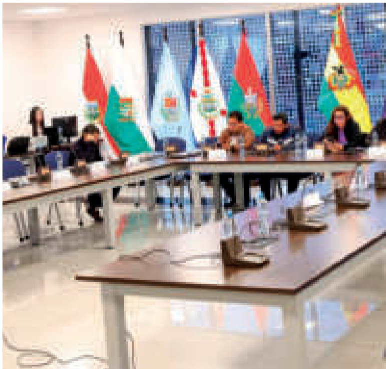
La Comisión Mixta de Constitución sesionó ayer.