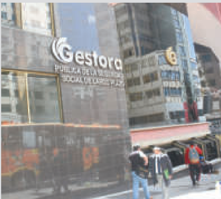
Frontis del edificio de la Gestora Pública.