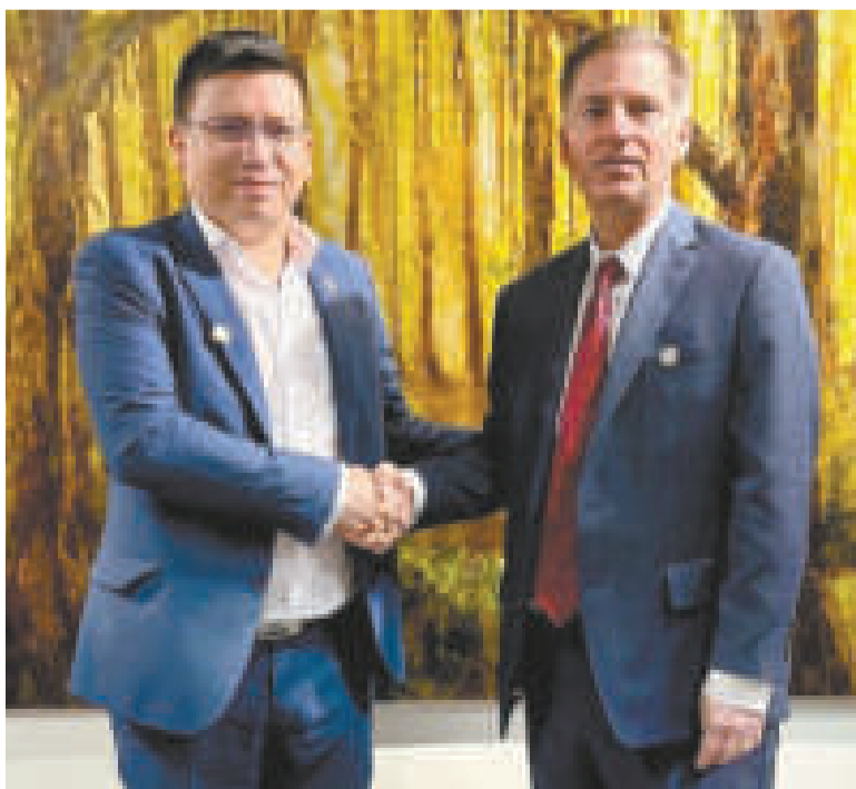
El ministro de Planificación, Sergio Cusicanqui, con el representante del Banco Mundial.

Las Reuniones de Primavera de 2023 del Grupo Banco Mundial (GBM) y el Fondo Monetario Internacional (FMI) se desarrollaron entre el 10 y el 16 de abril en las sedes de ambas instituciones, en Washington. Participaron los ministros de Economía de Latinoamérica y representantes de los organismos multilaterales.