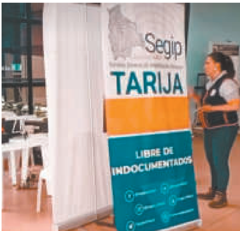
Segip extiende cédula de identidad en Tarija.