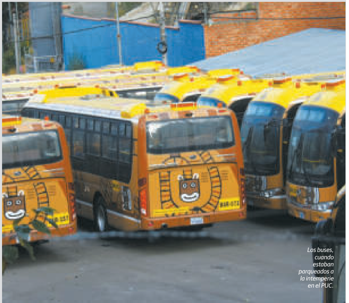
Los buses, cuando estaban parqueados a la intemperie en el PUC.

BUSES llegaron hace un año como reemplazo de aquellos que fueron quemados durante los conflictos de 2019.