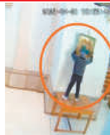
El hombre que robó el cuadro.

No es la primera vez que la Policía Boliviana logra frustrar la fuga de privados de libertad en el país, razón por la que instalaron más cámaras de seguridad.