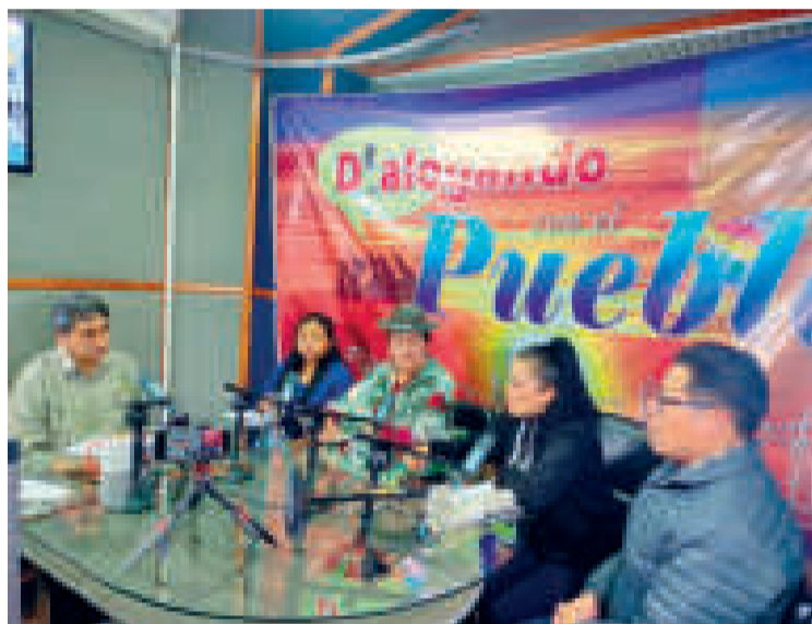
Los tres invitados en el set del programa de radio que se transmite por las RPO.

Tres panelistas coincidieron en que la Ley de Fortalecimiento de las RIN aportará al sistema económico y a la generación de proyectos sociales.