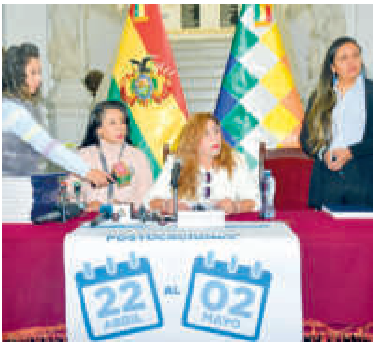
Apertura del libro para recibir a los aspirantes.

Entre los requisitos específicos están la no militancia política al momento de la inscripción y no ser exmagistrado.