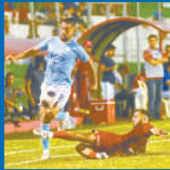
Una escena del cotejo que se disputó en el estadio de Montero.

En el complemento el Equipo del Pueblo buscó por todos los medios llegar al empate, pero Guabirá se plantó bien y defendió hasta el pitazo final el tanto que le dio la victoria.