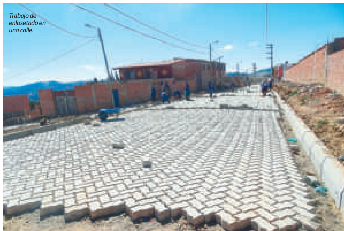
Trabajo de enlosetado en una calle.

“Este programa se encuentra establecido con un monto de alrededor de 636 millones de bolivianos y ya ▶