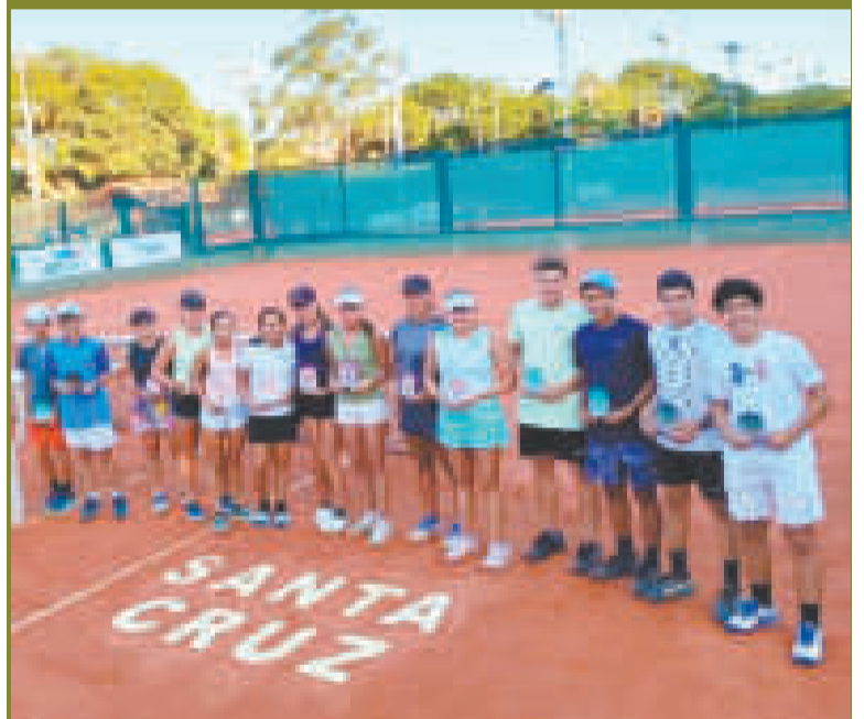
Los ganadores de los torneos internacionales de tenis.