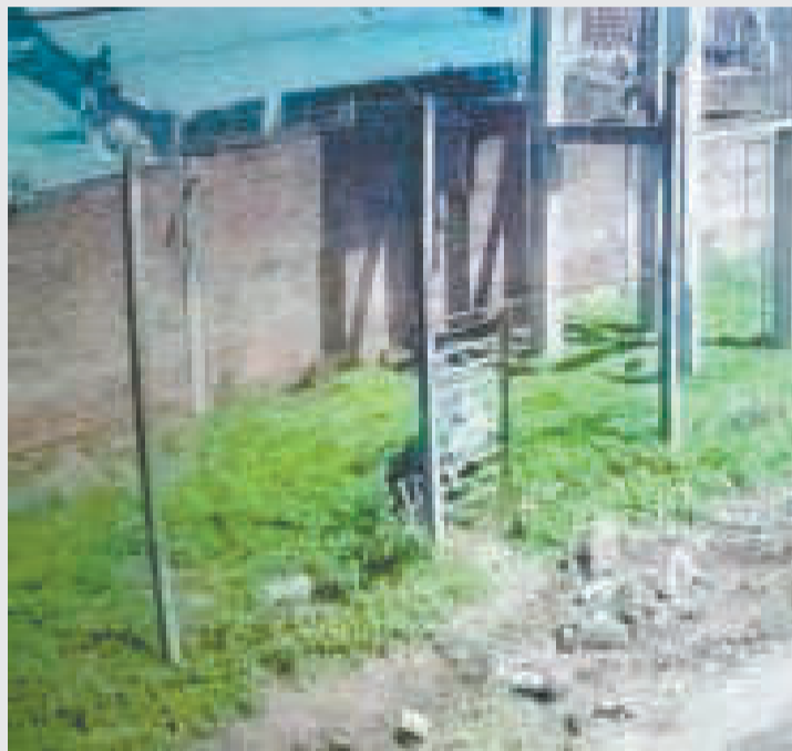
Momento en el que los reos trataban de huir del centro penitenciario.

de servicio, que procedió a su captura de manera inmediata, frustrando la fuga.