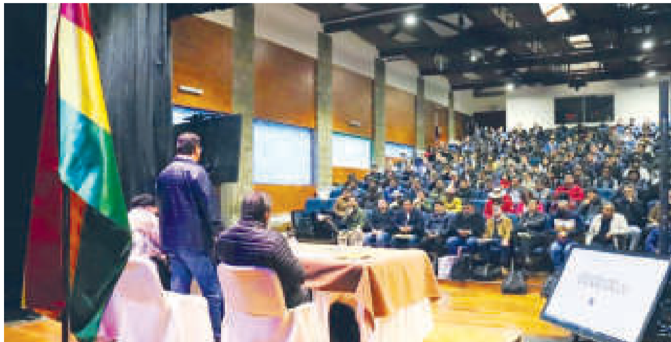
Se realizó el tercer gabinete ampliado del gobierno de Luis Arce, en el Parque de las Culturas de Mi Teleférico, en la ciudad de La Paz.