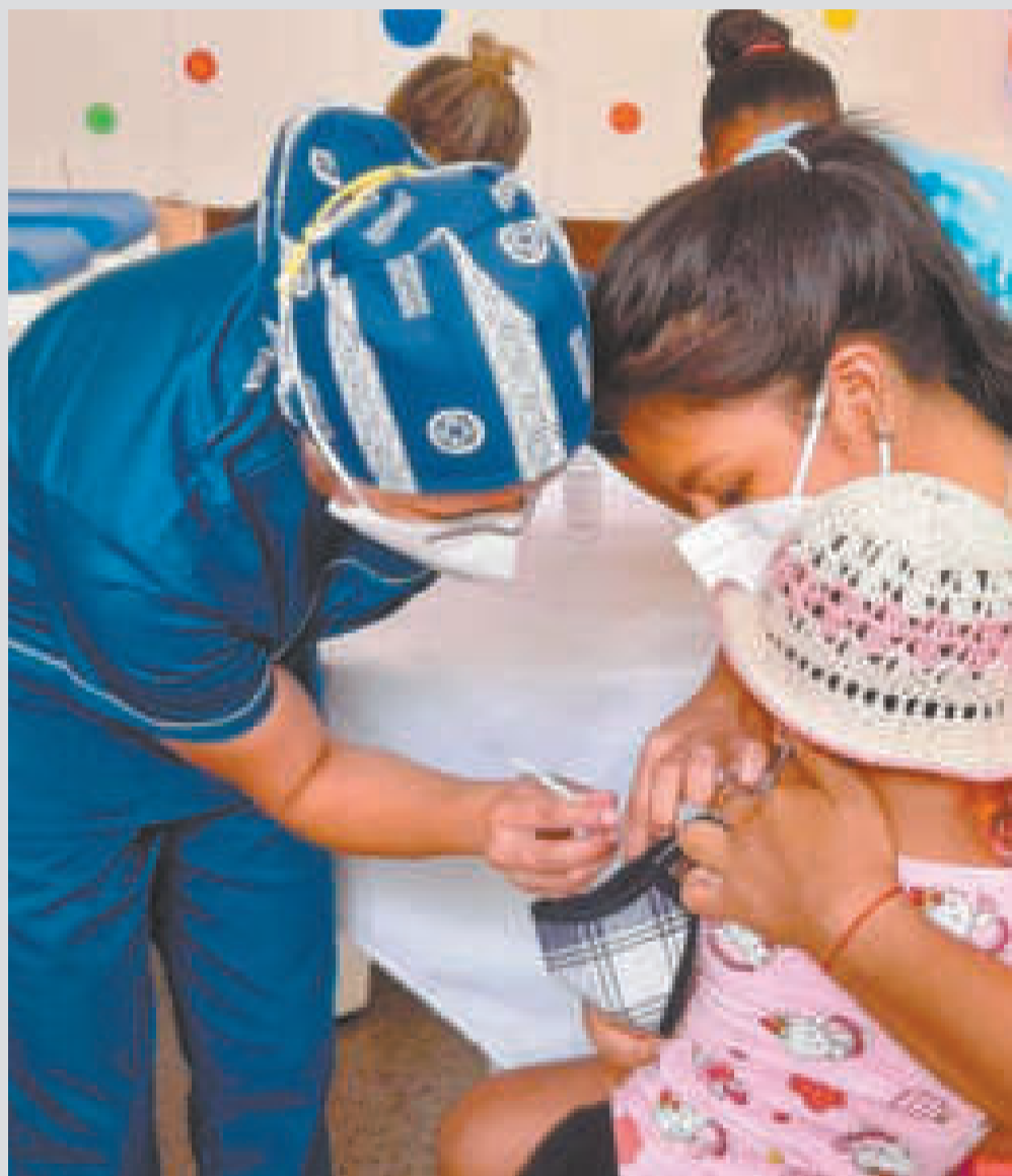
Una madre hace vacunar a su niña.

Del 22 al 29 de abril, la Organización Panamericana de la Salud (OPS), junto con los países y territorios de la Región de las Américas, celebra la XXI Semana de Vacunación en las Américas.