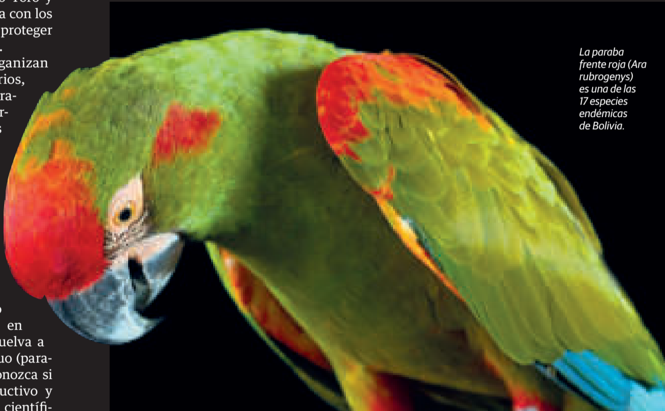
La paraba frente roja (Ara rubrogenys) es una de las 17 especies endémicas de Bolivia.