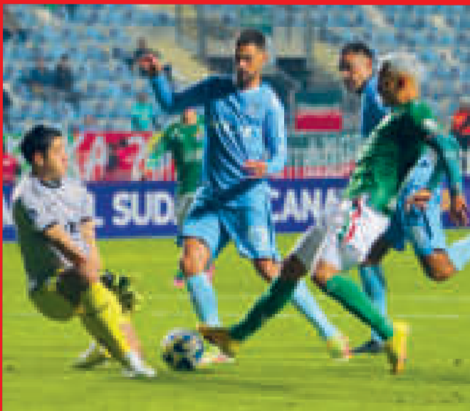
Una incidencia del partido disputado en Chile.

Blooming perdió ante el equipo chileno de Audax Italiano por 0 a 2 y quedó eliminado de la Copa Sudamericana. El partido de la tercera fecha del grupo E se jugó ayer en el estadio El Teniente, de Rancagua.