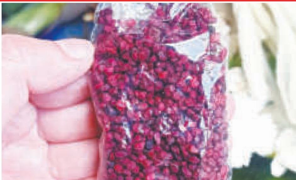
Ayrampo (Opuntia soehrensii): pequeñas semillas que se utilizan para tratar la fiebre y la varicela.