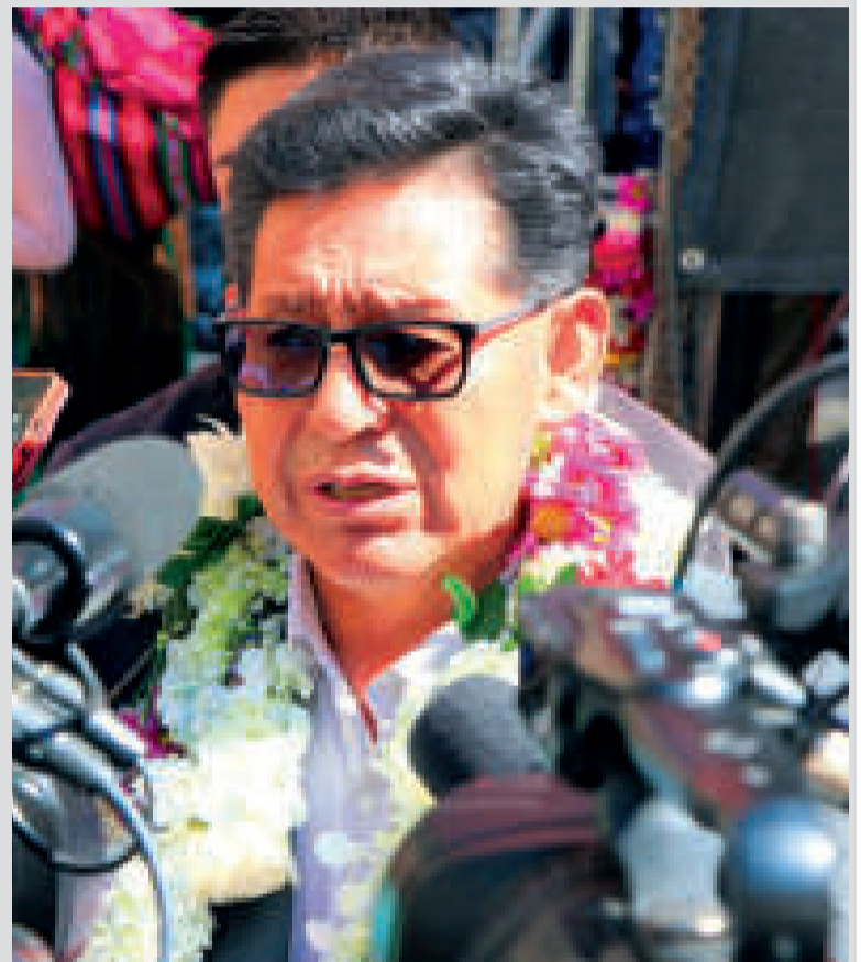
El ministro de Educación, Édgar Pary, en un encuentro con los medios.