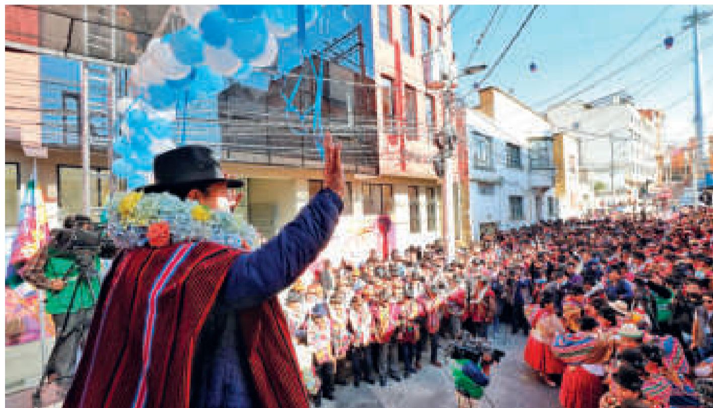
El Jefe de Estado durante la entrega de la sede sindical a la Federación de Mujeres Campesinas ‘Bartolina Sisa’ y la Federación de Trabajadores Campesinos ‘Túpac Katari’, de La Paz.

Los líderes indígenas agradecieron la infraestructura donde sostendrán sus reuniones, para ya no hacerlo en las plazas, como ocurría hasta ayer.