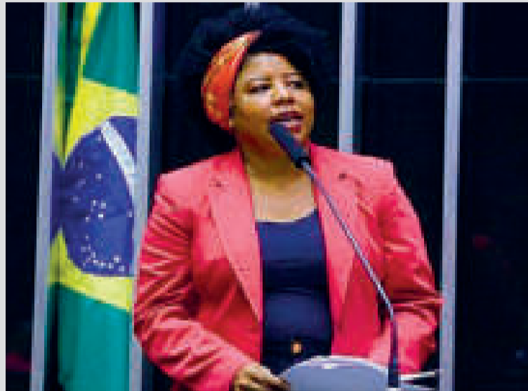
Una diputada brasileña que apoya la igualdad salarial.

“Una victoria importante para que, de una vez por todas, tengamos igual salario por igual trabajo”.