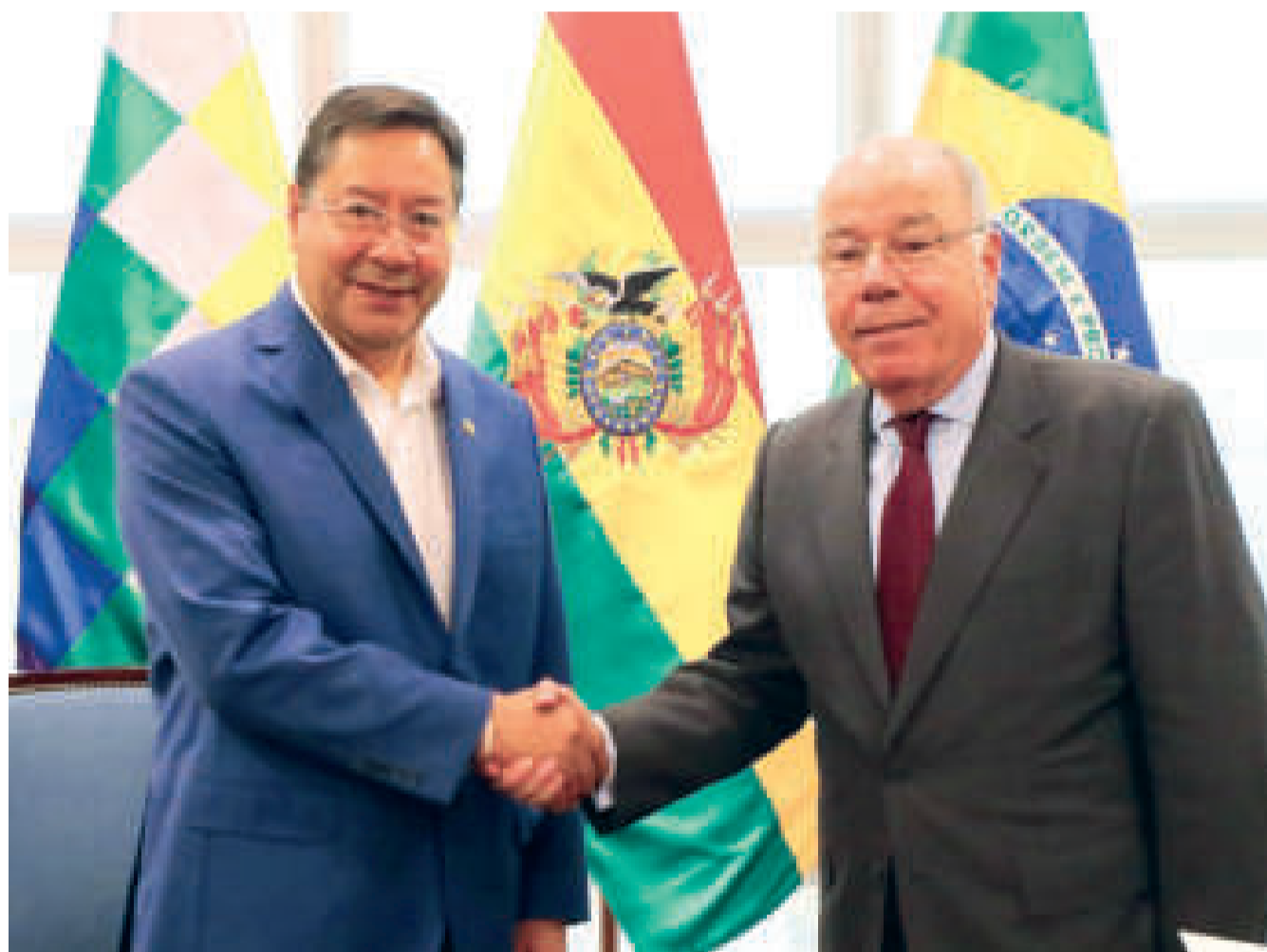
El mandatario Luis Arce Catacora junto al ministro de Relaciones Exteriores de Brasil, Mauro Vieira, en la Casa Grande del Pueblo.

El canciller de Brasil, Mauro Vieira, en su visita oficial al país para tratar la agenda bilateral y la integración regional, se reunió con el presidente Luis Arce.