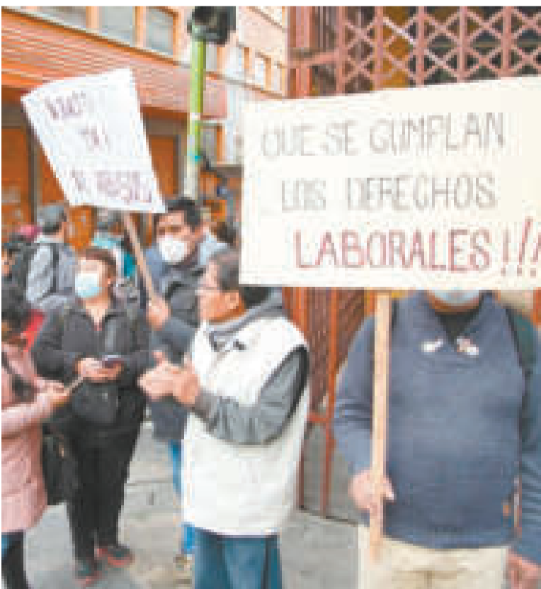
Funcionarios municipales bloquean por segundo día el ingreso a la alcaldía.

Sin embargo, Farfán argumentó, anteriormente, que los empleados tienen a su favor una sentencia del Juzgado Segundo de Trabajo, en la que se le instruye que sean cancelados ambos incentivos municipales.