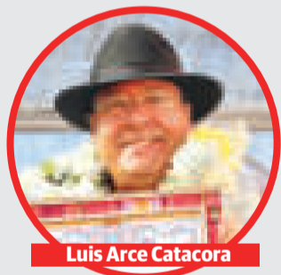
Luis Arce Catacora

479 PROYECTOS anunció la UPRE para esta gestión en áreas de salud, educación, infraestructura y producción.