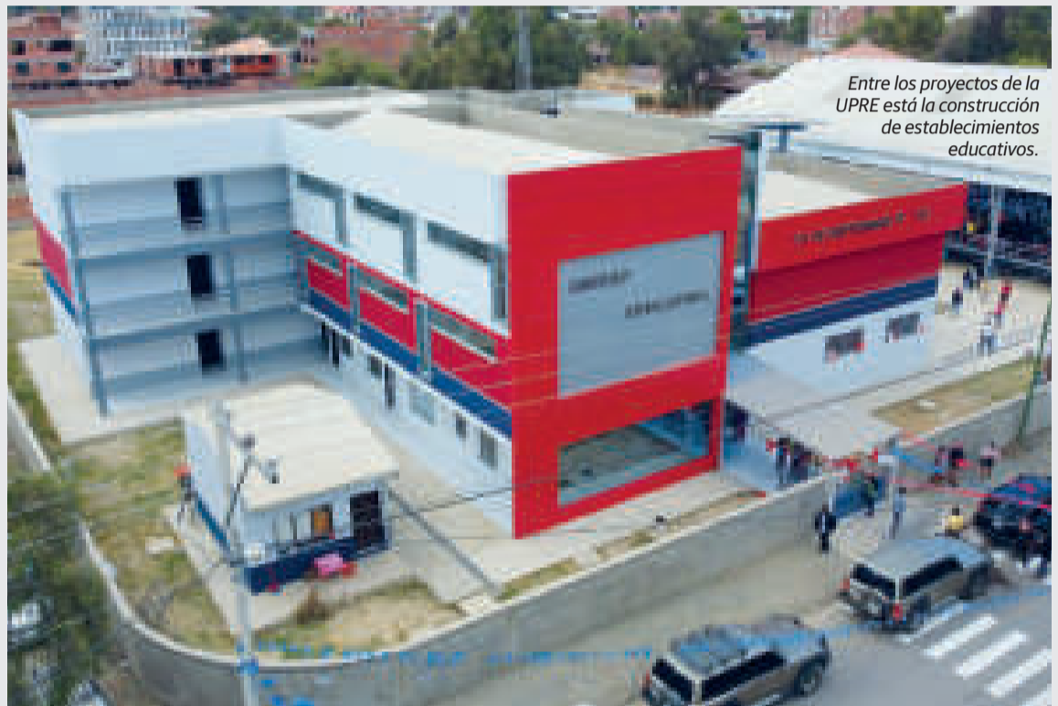
Entre los proyectos de la UPRE está la construcción de establecimientos educativos.

“El 87% del presupuesto para 2023 del Ministerio de la Presidencia corresponde a proyectos de inversión destinados a infraestructura de salud, educación, urbana, apoyo agropecuario y de cul-