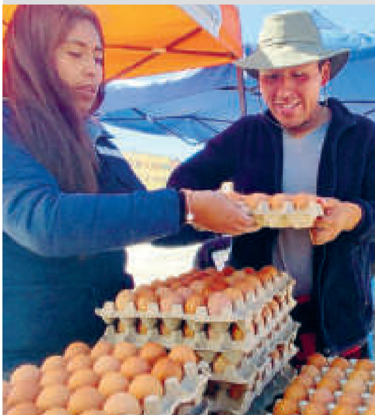
Punto de venta de huevo habilitado por Emapa, en El Alto.