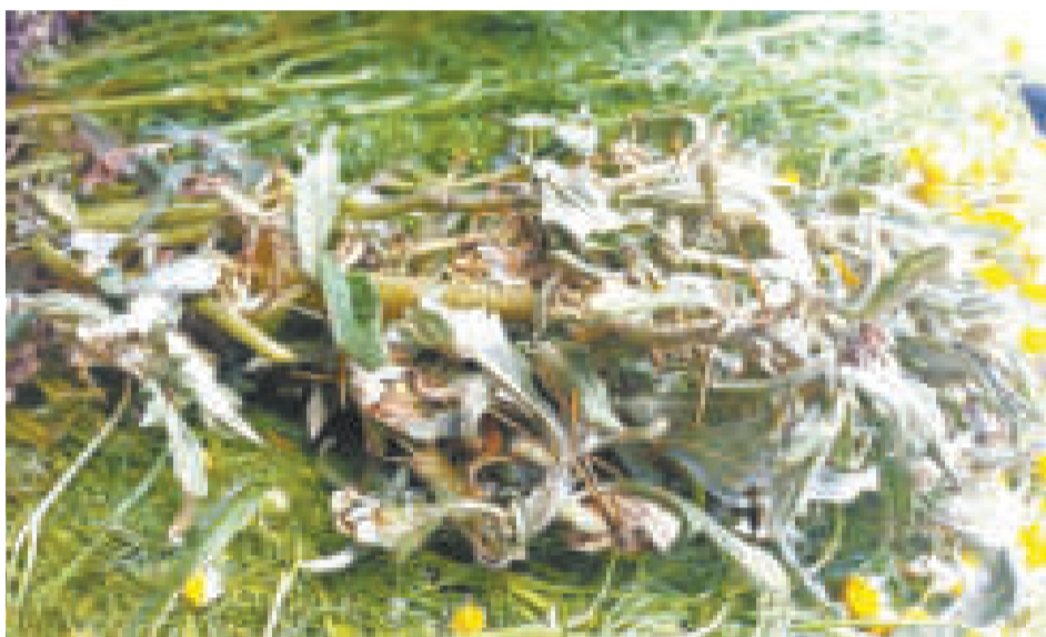
Amor seco (Xanthium spinosum): una hierba con espinas que, junto al ayrampo, ayuda a bajar la fiebre.