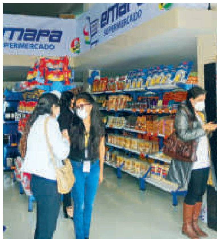
Supermercado de la Empresa de Apoyo a la Producción de Alimentos, en La Paz

El año pasado, esta empresa pública generó una histórica utilidad de más de Bs 35 millones, aportó Bs 20 millones para el Bono Juancito Pinto y cumplió con el pago de Bs 18,6 millones al Fondo para la Revolución Industrial Productiva (Finpro).