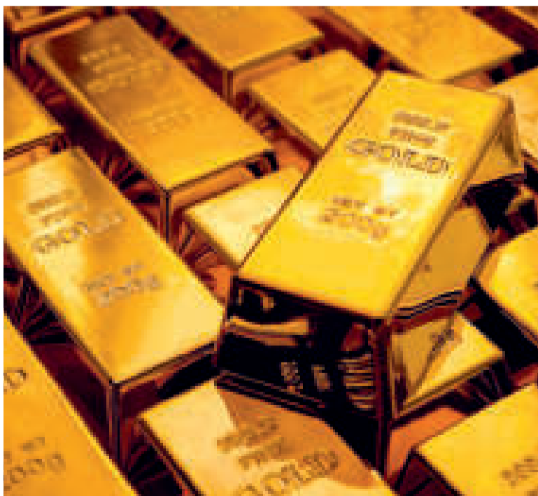
Lingotes de oro.