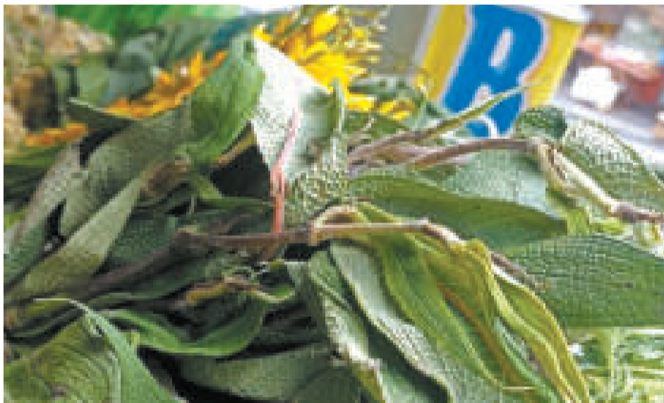
Matico (Buddleja globosa): planta que alivia molestias respiratorias y ayuda al cuerpo a subir defensas.