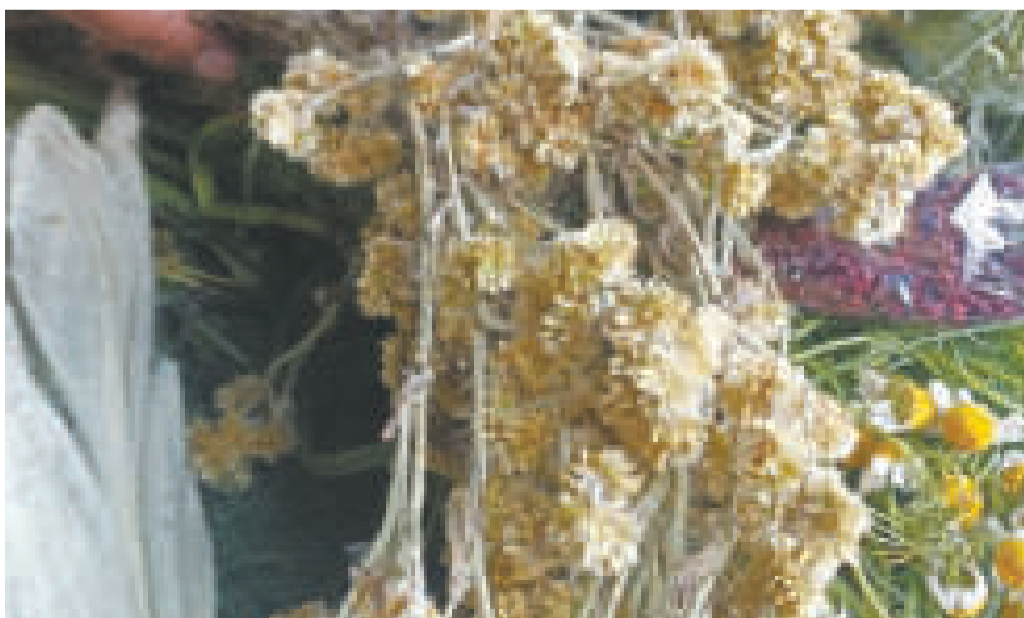
Huirahuirá (Achyrocline satureioides). Esta planta medicinal fortalece el sistema respiratorio y alivia la tos.