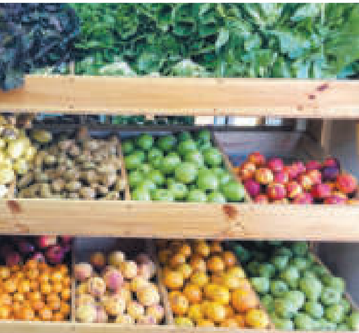
Una dieta abundante en frutas y verduras frescas es necesaria para combatir los resfríos, sin que se agraven.

“El ajo, el jengibre y la curcuma tienen muy buenas propiedades antibacteriales, antivirales y antifúngicas. Muchas veces cuando uno toma anti-