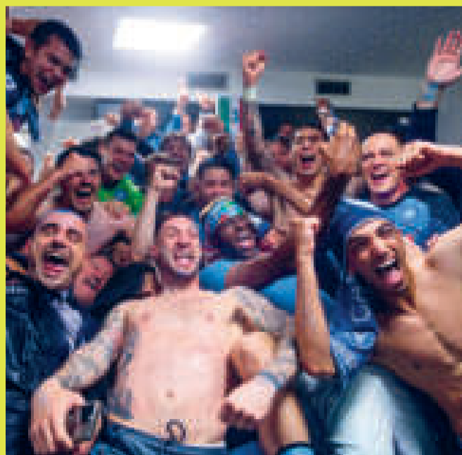
Jugadores del Napoli celebran la conquista del Scudetto.