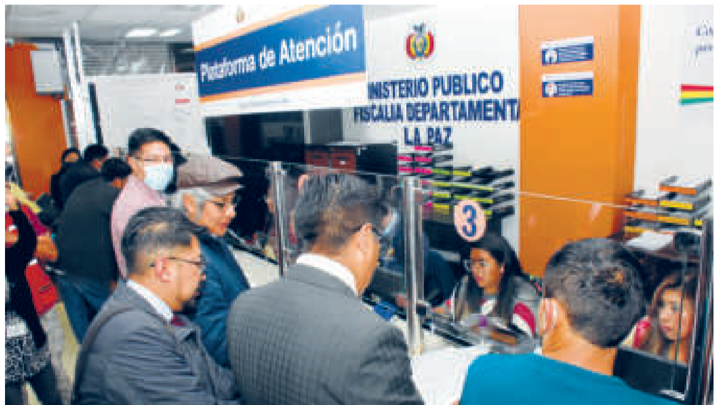
El procurador general del Estado, Wilfredo Chávez, presenta la denuncia formal en la Fiscalía Departamental de La Paz.

Toda la información que pueda haber en los archivos de la institución religiosa será proporcionada a las autoridades que la soliciten.