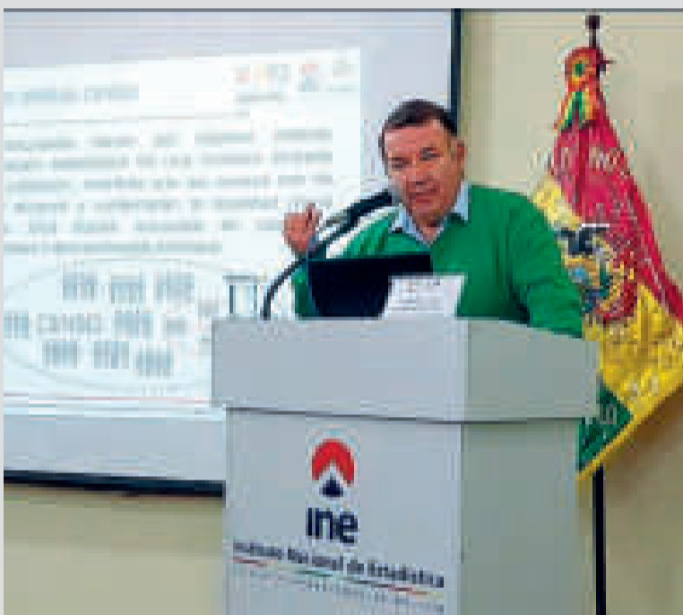
El director del Instituto Nacional de Estadística (INE), Humberto Arandia.