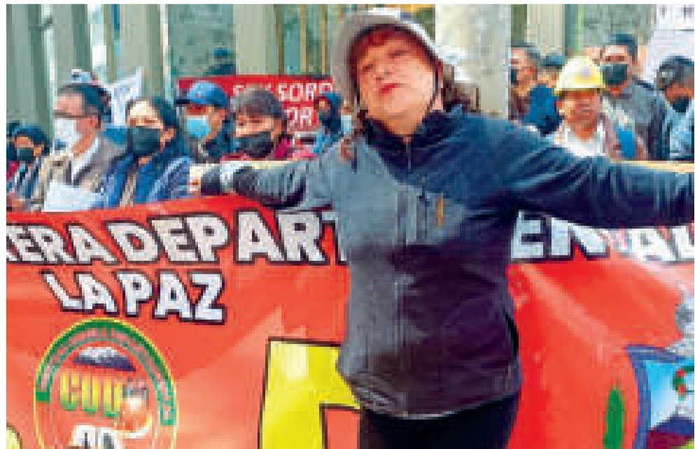
Una de las manifestantes se crucificó para exigir el pago de beneficios.