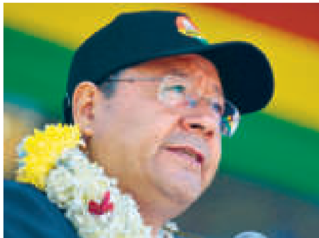
El mandatario Luis Arce obtuvo el 51% de aceptación, según la ACOP.