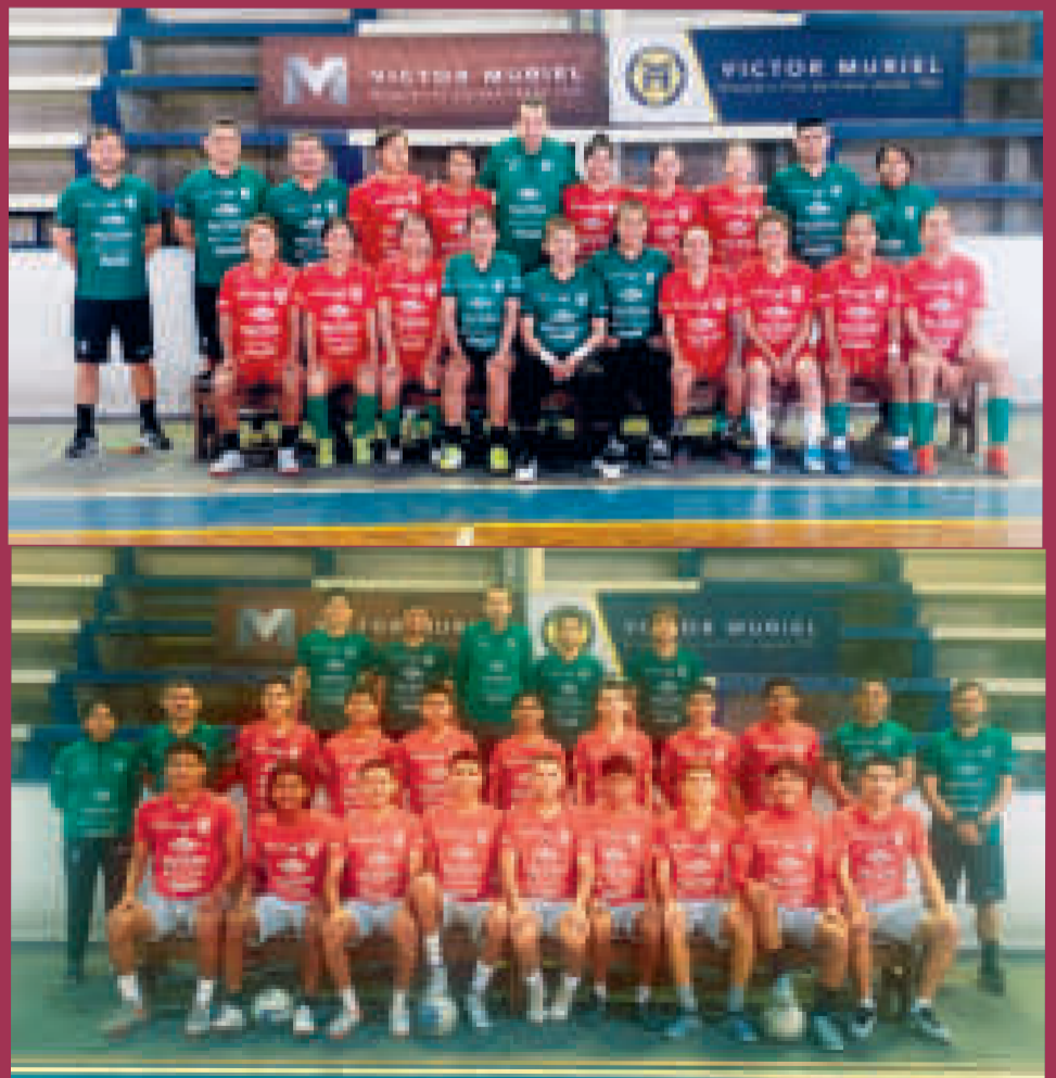
Preselecciones nacionales de fútbol de salón de damas y varones.

“Será un torneo en el que jugarán Brasil, Uruguay, Paraguay, Bélgica, entre otros. Es como un preámbulo a lo que será el Mundial para mostrar el nivel técnico de las selecciones participantes. También nos servirá como preparación para la Copa América que se jugará del 24 de septiembre al 2 de octubre en Buenos Aires, Argentina”, dijo el entrenador.