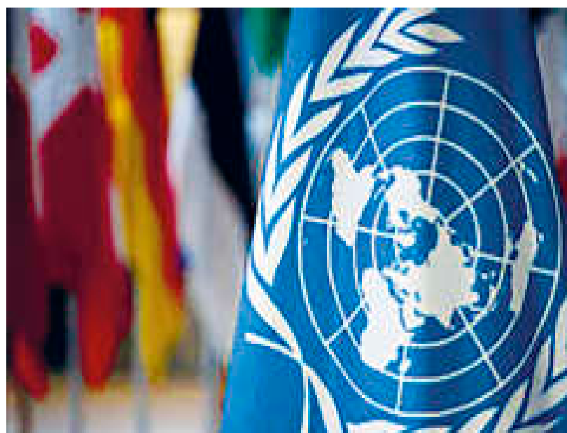
La bandera de la ONU.

“Bolivia es un contribuyente constante a las operaciones de mantenimiento de la paz de las Naciones Unidas, desplegando personal en África, América y Asia para ayudar a abordar las causas profundas de los conflictos y promover la paz. La ONU está particularmente agradecida por la contribución de una década de Bolivia a la antigua misión de la ONU en Haití (MINUSTAH), donde más de 3.000 de sus efectivos de mantenimiento de la paz sirvieron entre 2004 y 2015”, señala la ONU.