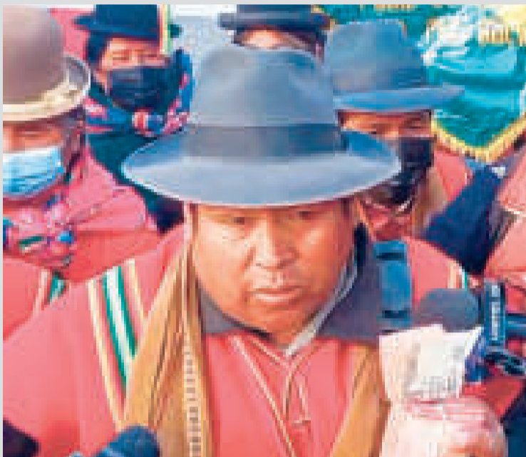
El jiliri mallku Choque con el supuesto dinero entregado por el abogado del interventor.

Explicó que al noveno día de la suspensión se solicitará los informes al Viceminis-