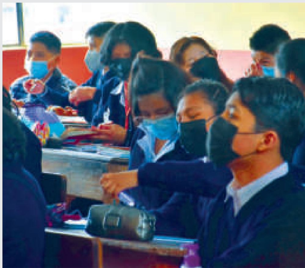
Estudiantes pasan clases.