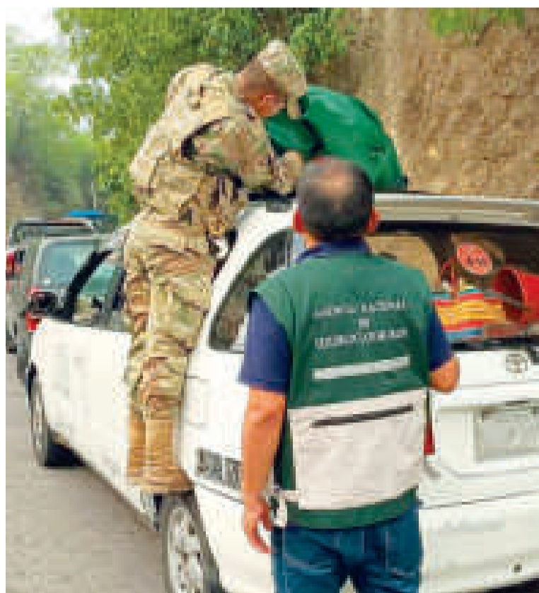
Con apoyo militar, la ANH controla fronteras.

Exhortó a la población boliviana a denunciar cualquier irregularidad respecto a los combustibles, que en el país son subvencionados, llamando al número gratuito 800106006 de la ANH.