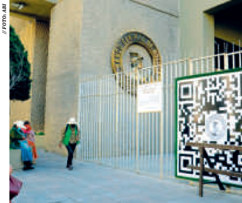
Frontis del Banco Central de Bolivia.

“Permite garantizar los depósitos del público con todas las coberturas normadas por la ley para los procesos a los cuales puede apoyar en caso de ser solicitado por la ASFI”, afirmó el ente emisor como aclaración para tranquilidad de la población.