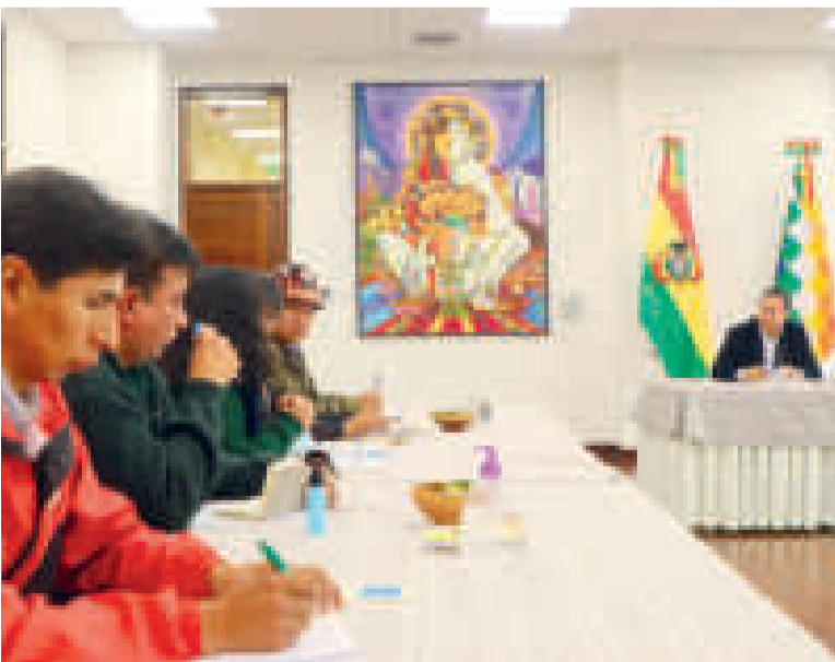
El Primer Mandatario con los representantes de la Federación de Seguridad Social.