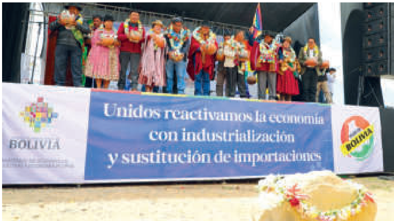
El Gobierno invierte en nuevas plantas industriales para sustituir importaciones.

Para el portavoz, Bolivia debe dejar de ser dependiente de una sola fuente de ingresos como la exportación de hidrocarburos, por lo que es necesario dar el paso a la producción nacional con el proceso de industrialización, con la planta