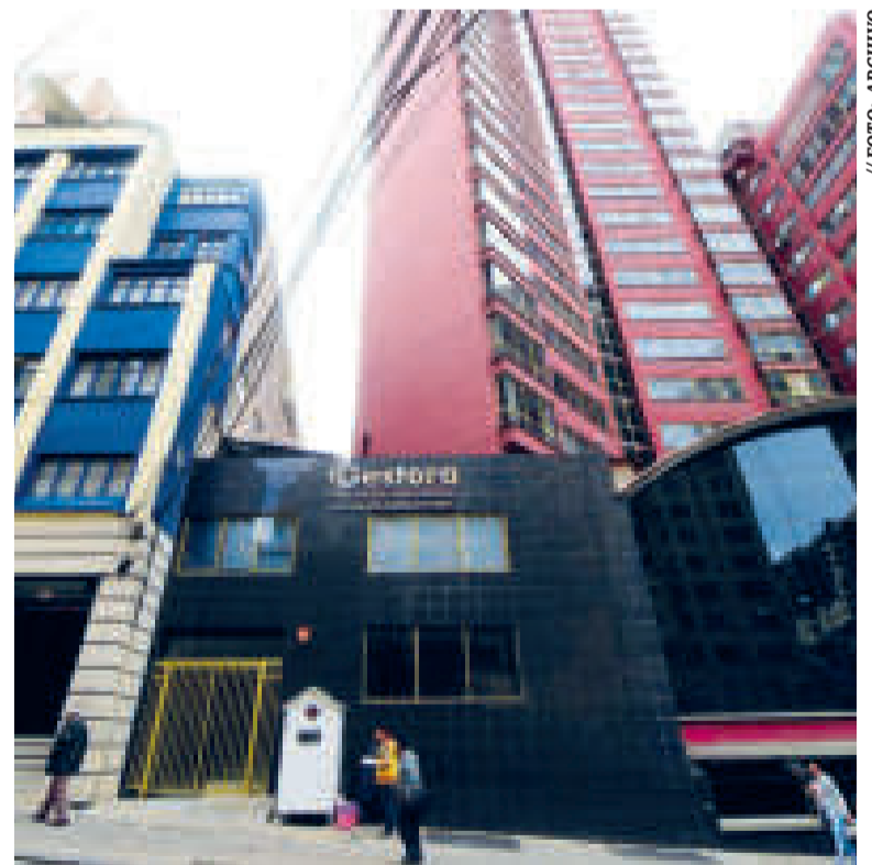
Frontis del edificio de la Gestora Pública.