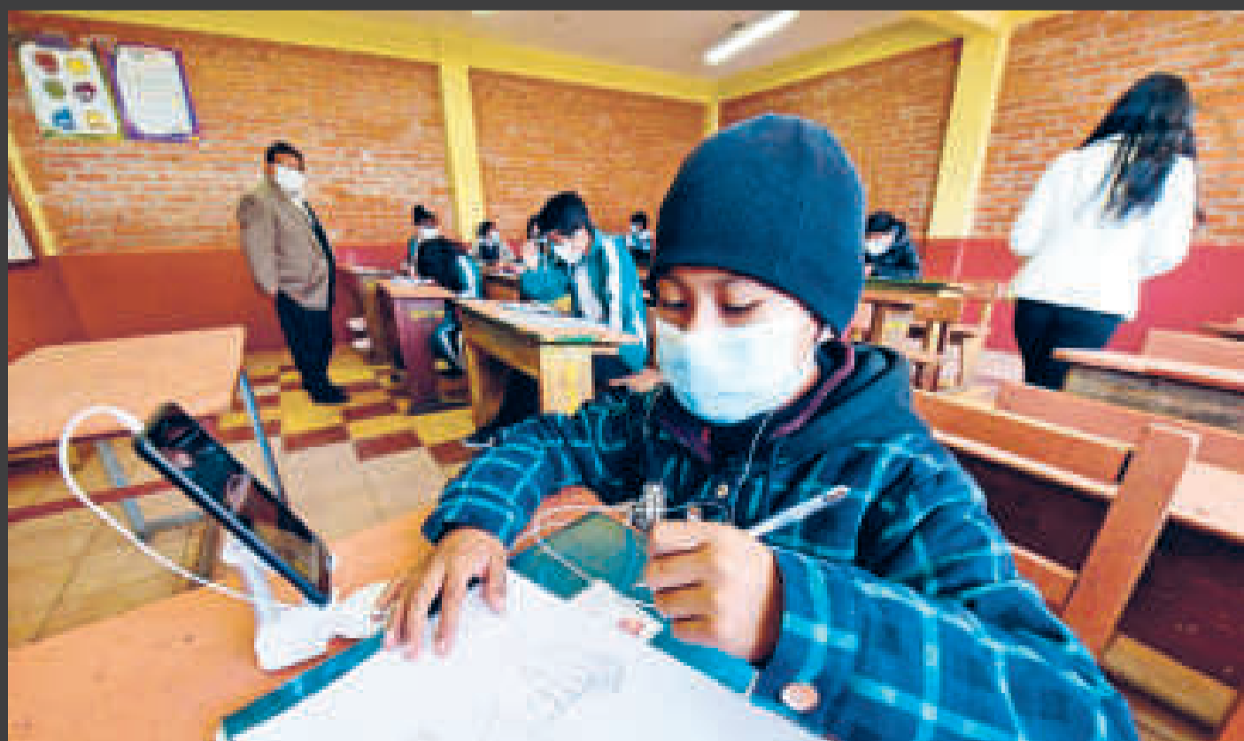
Niños que estudian en colegios del sistema regular interactúan con otros con discapacidades.

El presidente de la Red de Padres de Personas con Autismo, André Agramont, señaló que aún hay poca información sobre este tipo de condición y menos aún in-