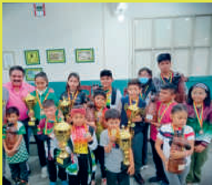
Los ajedrecistas ganadores del clasificatorio.