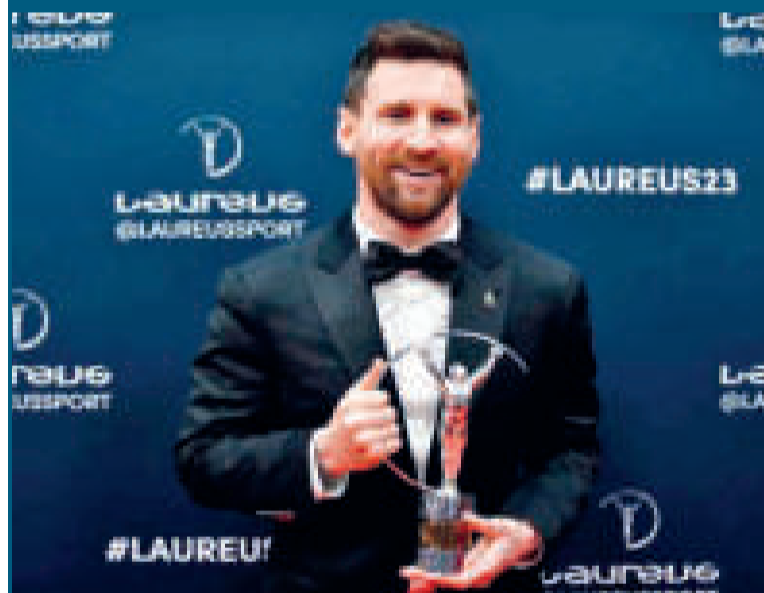
Messi sonriente con su trofeo de mejor deportista.

Los premios Laureus World Sports se entregan cada año desde 2000 para los atletas que brillan tanto en lo individual como en lo colectivo, con los ganadores escogidos por un jurado de 42 miembros.