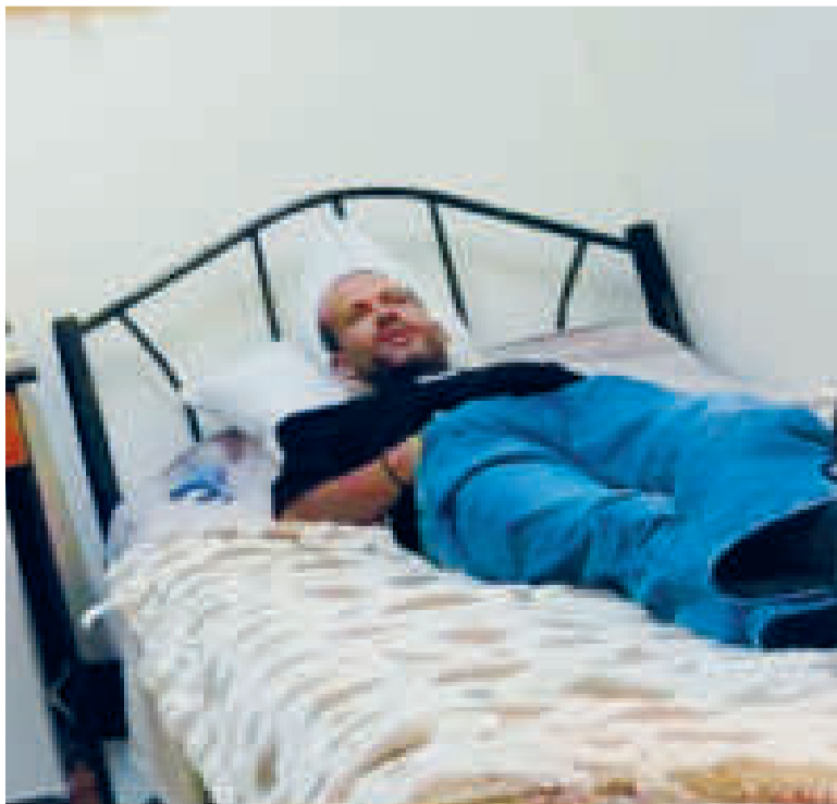
Luis Fernando Camacho en el penal de Chonchocoro.