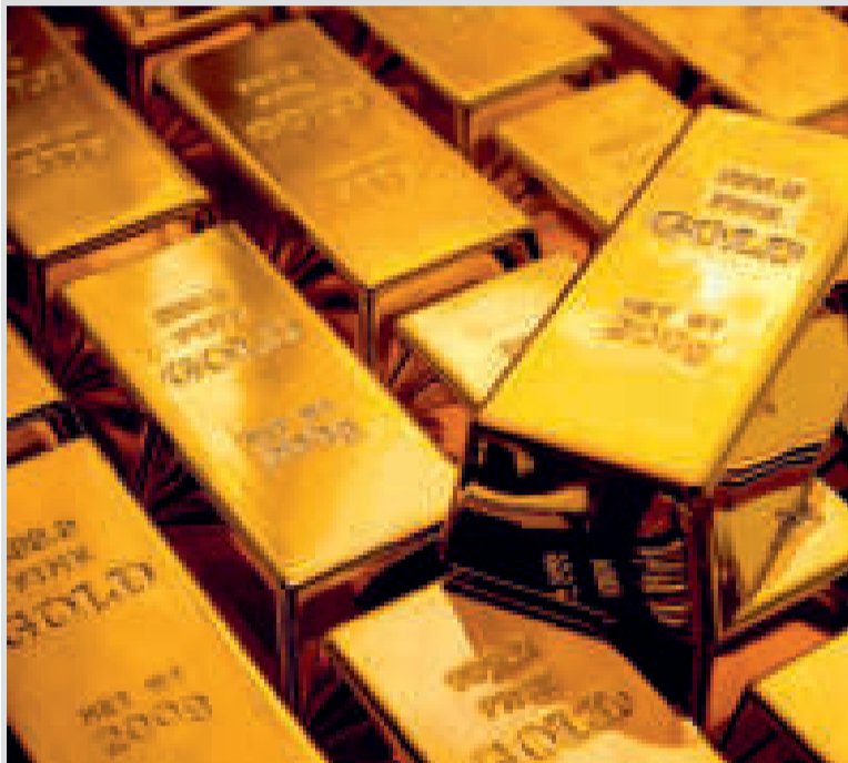
Lingotes de oro.

Solo Venezuela, Brasil y Argentina cuentan con una mayor cantidad del metal en sus reservas, con 161 t, 130 t y 62 t, respectivamente.