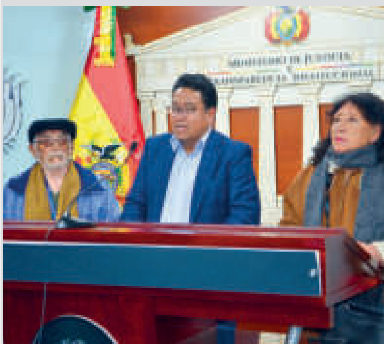
El viceministro César Siles con víctimas de las dictaduras.