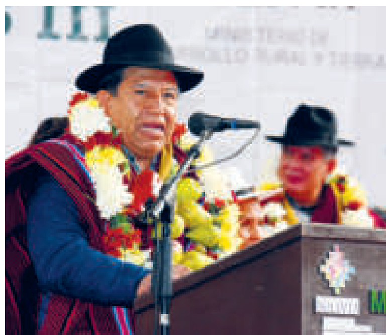
El vicepresidente David Choquehuanca en la entrega de la ley.

Vicepresidente del Estado Plurinacional de Bolivia