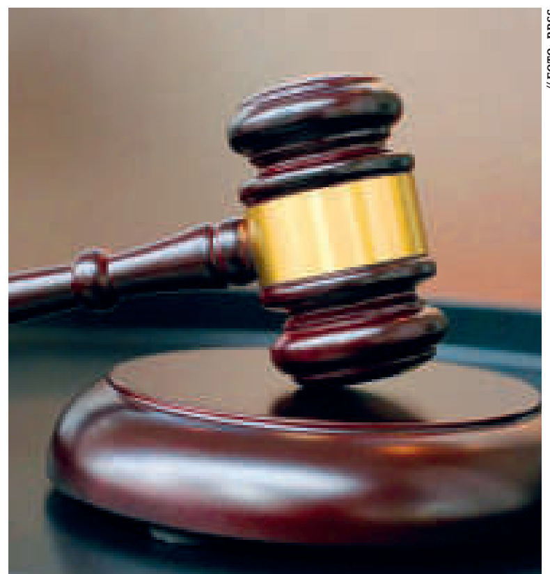
El proceso de transformación de la justicia requerirá un compromiso nacional.

profundas. Por el contrario, debe empezar en la formación de quienes quieren ser parte del sistema judicial.