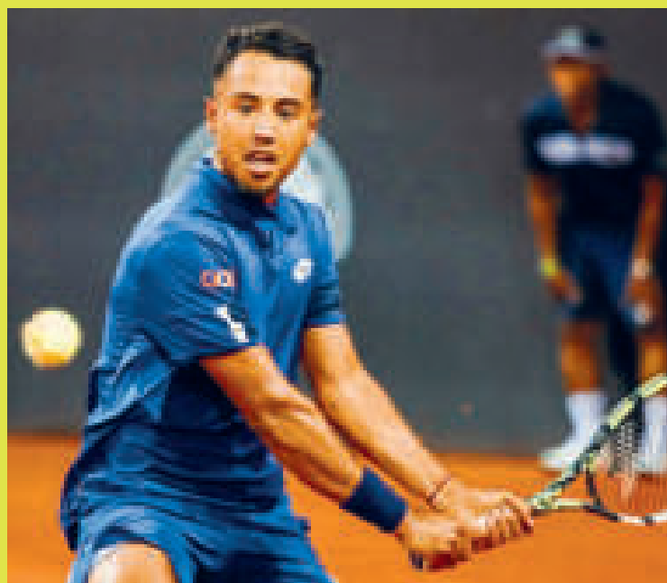
El tenista boliviano Hugo Dellien vuelve a la competencia.