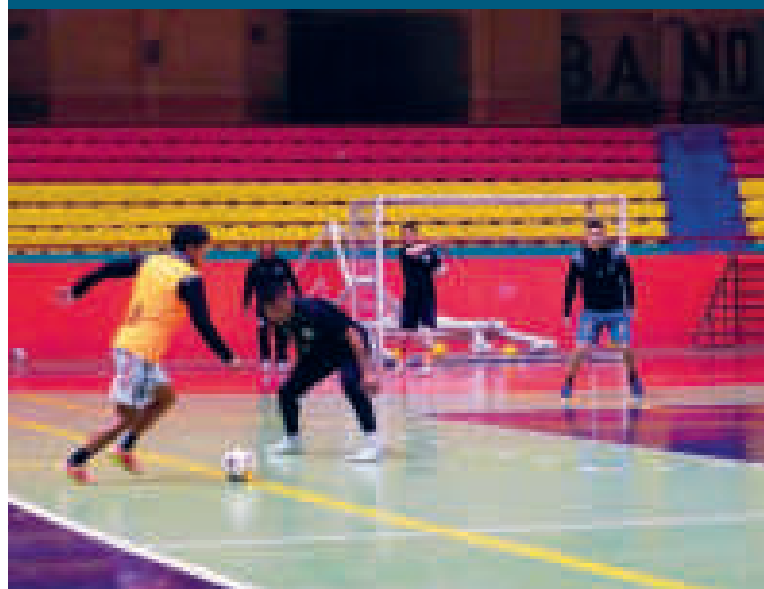
El equipo de Fantasmas Morales Moralitos en plena práctica.

El gobernador de Oruro, Jhonny Vedia, entregó uniformes a los jugadores y cuerpo técnico de Fantasmas Morales Moralitos en un acto que se celebró en el salón Ildefonso Murguía de la Gobernación.