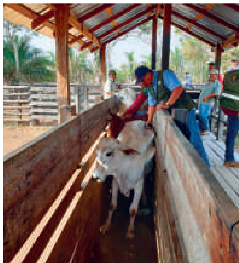
Vacunación de animales contra la fiebre aftosa.

“La influenza aviar (...) fue controlada, en dos meses la logramos controlar y eso demuestra que nuestro sistema sanitario es muy robusto, es bastante fuerte porque la controlamos mucho antes que otros países”, indicó.