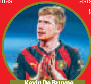
Kevin De Bruyne