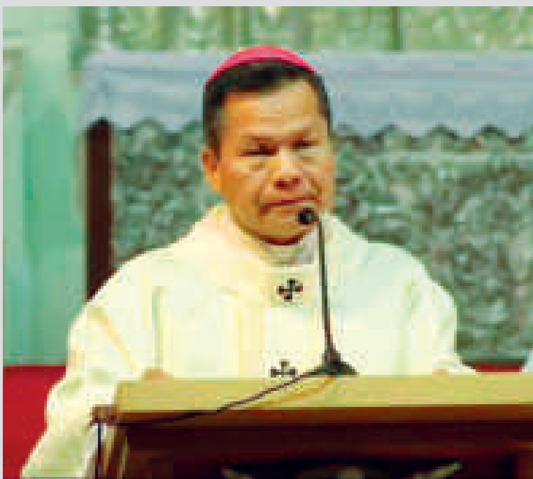
En la homilía dominical, monseñor René Leigue calificó como "error" los abusos sexuales.