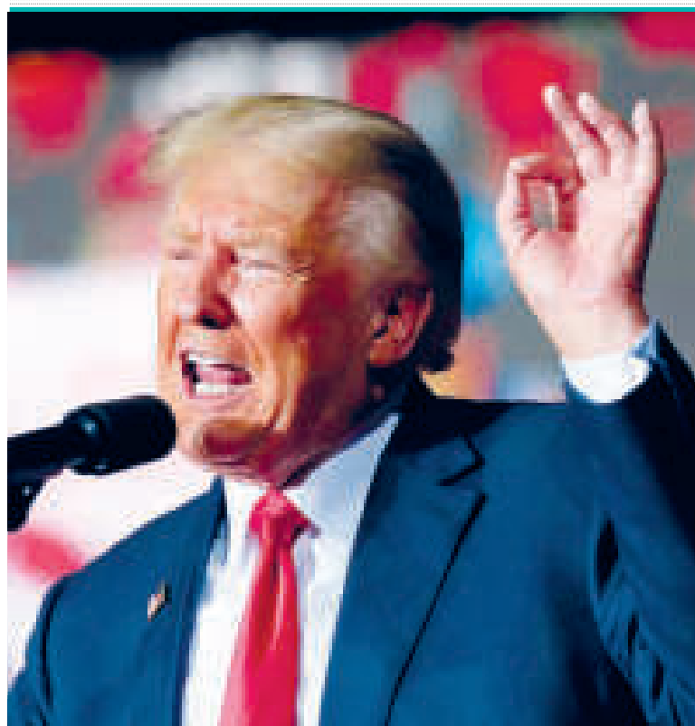
El expresidente estadounidense Donald Trump.