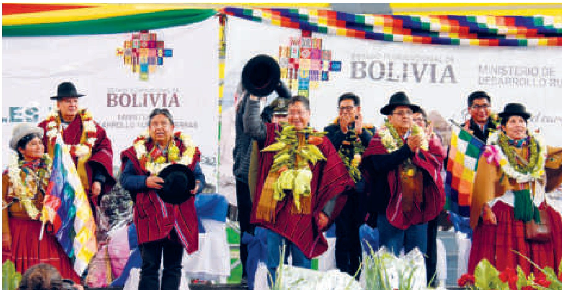
El presidente Luis Arce y el vicepresidente David Choquehuanca en el acto de ayer.