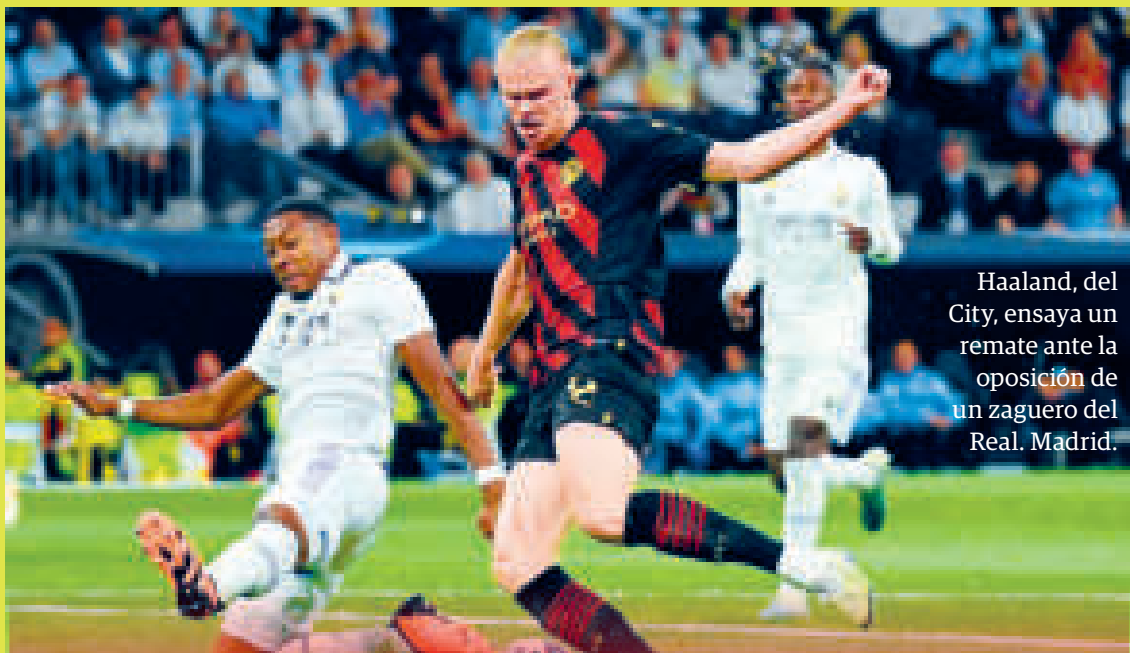
Haaland, del City, ensaya un remate ante la oposición de un zaguero del Real Madrid.