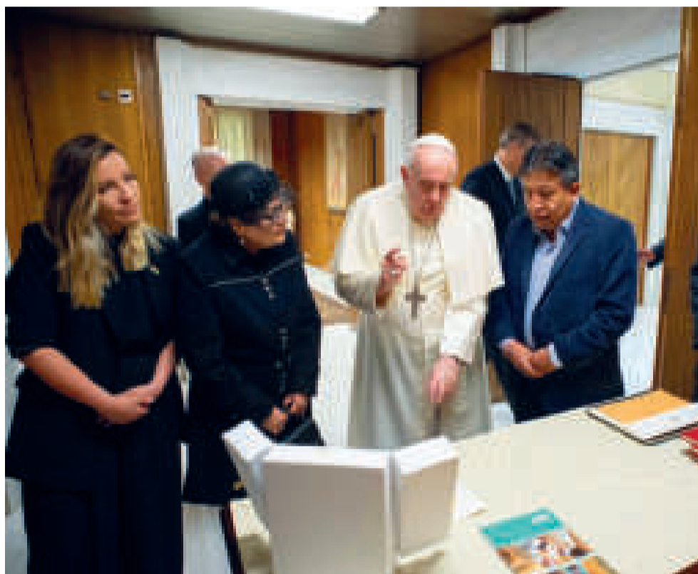
El papa Francisco es impulsor de cambios en las leyes canónicas que endurecen las penas contra sacerdotes acusados de abuso sexual. Aquí, junto al vicepresidente David Choquehuanca.

“En cuanto a la justicia, hay que esperar, lo que sí es cierto es que las instituciones aquí se han movido y están intentando conseguirlo y también las víctimas,