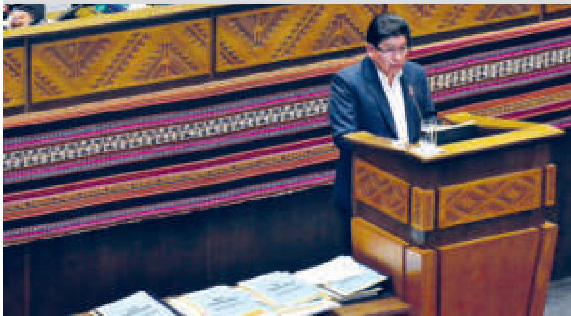
El ministro de Obras Públicas, Édgar Montaña, responde las preguntas de la oposición en el Legislativo.

En la ocasión, el ministro Montaña entregó a sus interpellantes carpetas con la documentación sobre cada una de las más de 40 preguntas.