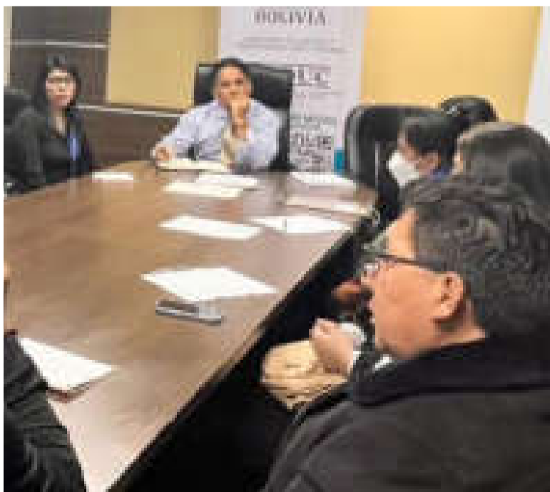
Autoridades y trabajadores de carne de pollo reunidos ayer.