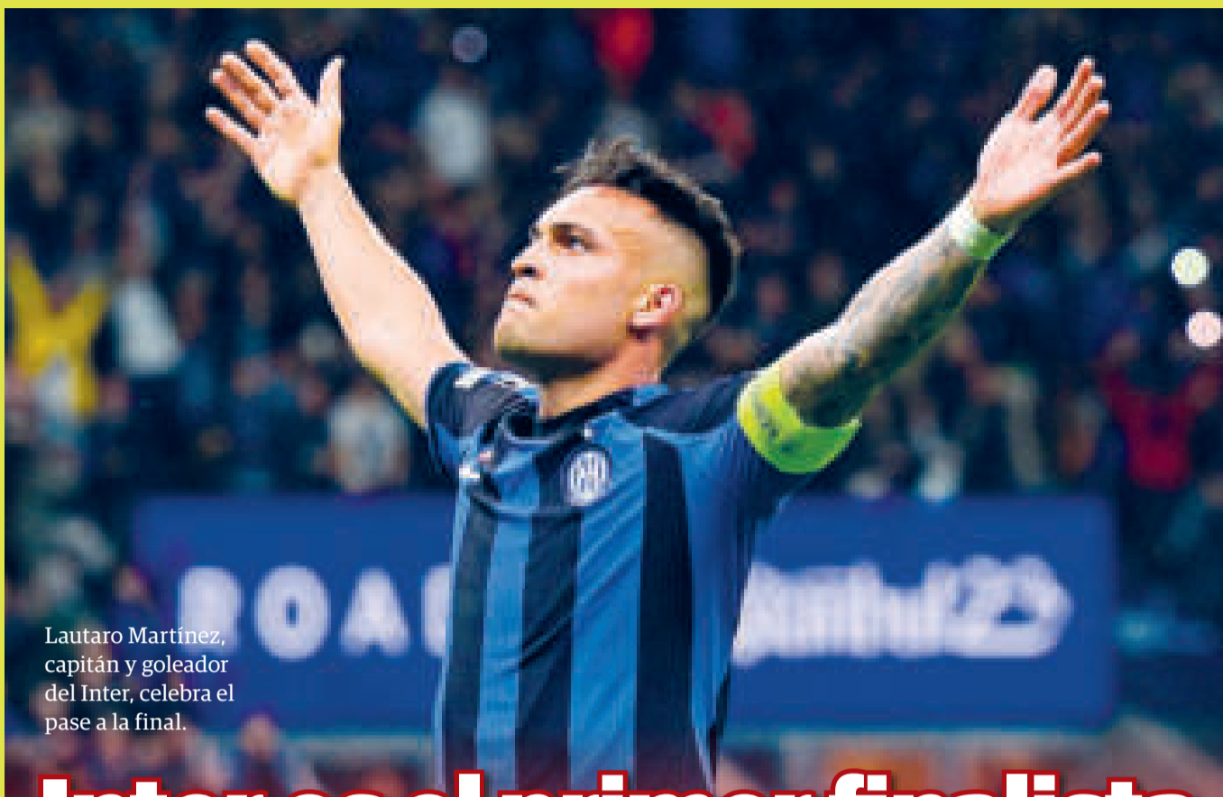
Lautaro Martínez, capitán y goleador del Inter, celebra el pase a la final.