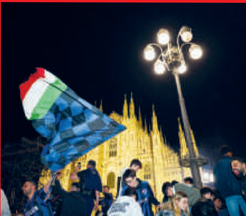
Hinchas del Inter festejan la victoria que le da el derecho a pelear el título.

El pasado enfrentamiento fue en las semifinales de 2022: Manchester City ganó 4-3 como local en la ida y el Real Madrid remontó con un 3-1 en la vuelta en un partido que llevó a tiempo extra.