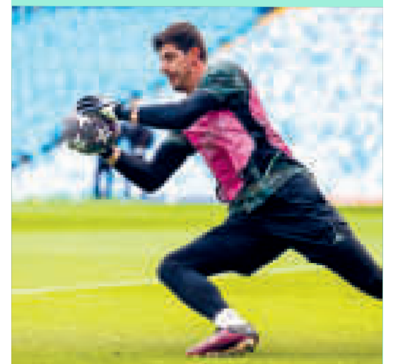
Thibaut Courtois, arquero del Real Madrid.