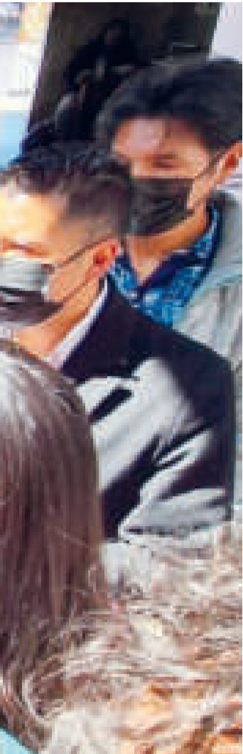
La viceministra de Transparencia Institucional, Susana Ríos, en contacto con medios de difusión.