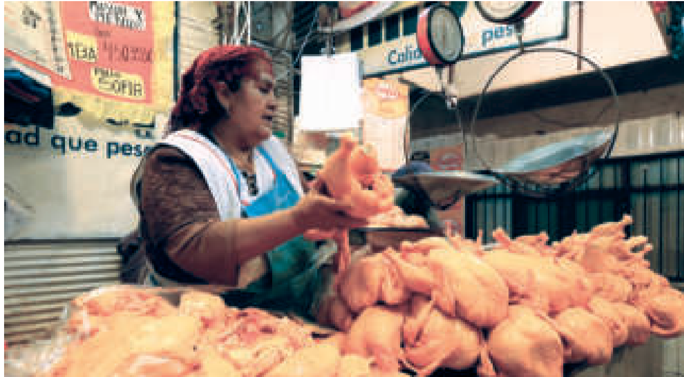
Comercialización de carne de pollo en un mercado de La Paz.

La cuarta crisis se presentó como consecuencia del paro de 36 días convocado por cívicos y sectores extremos en Santa Cruz. Esta medida no solo provocó la pérdida de millonarias cifras en desmedro de la economía boliviana, sino que también restringió el envío de alimentos al resto del país. Esto provocó cierto de-