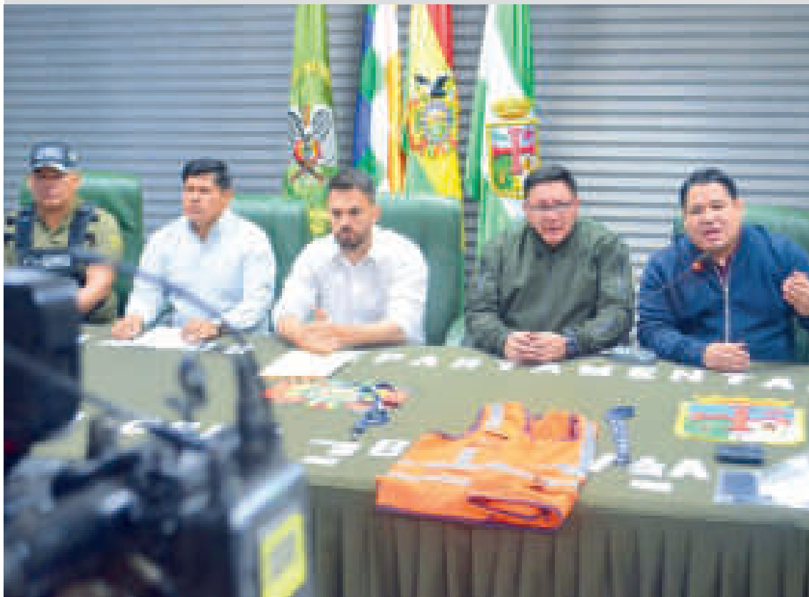
El ministro de Gobierno, Eduardo Del Castillo, junto a otras autoridades.