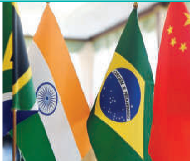
Banderas de los países del Brics.

recorrido, la cuarta por longitud del mundo, detrás de Estados Unidos, Rusia y China, cuenta con unos 21.650 trenes y 7.349 estaciones.