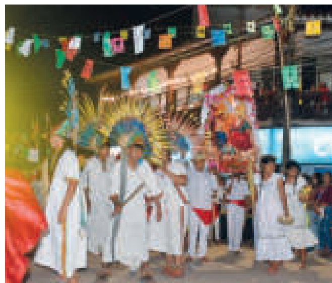
▶ Estudiantes en la fiesta municipal.