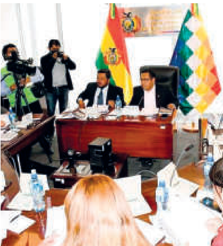
La Comisión de Constitución de Diputados.