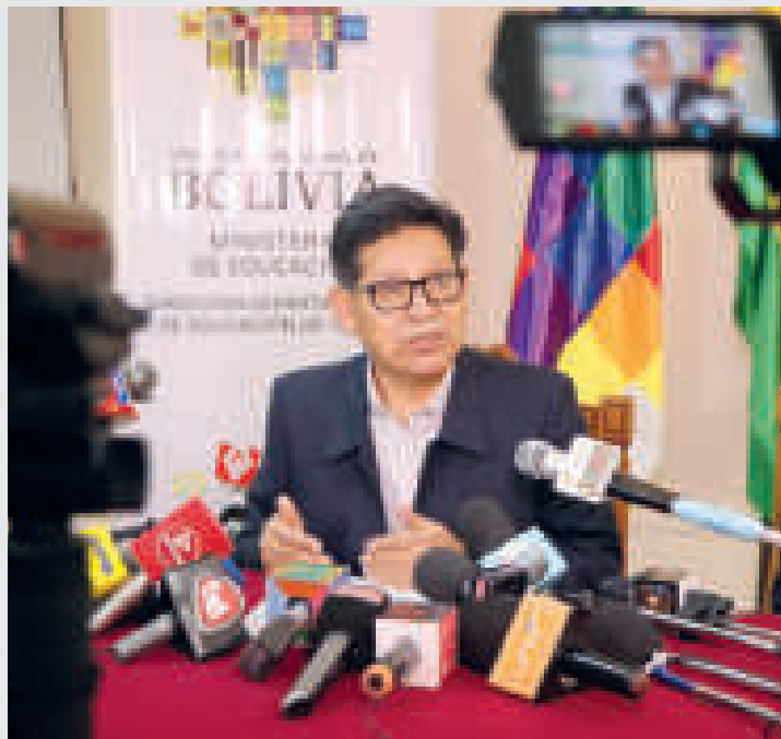
El Ministro de Educación en conferencia de prensa.