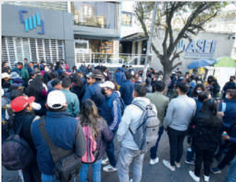
Extrabajadores del Banco Fassil durante su protesta ante la ASFI.

“Los funcionarios seguirán asistiendo a las instalaciones que correspondan