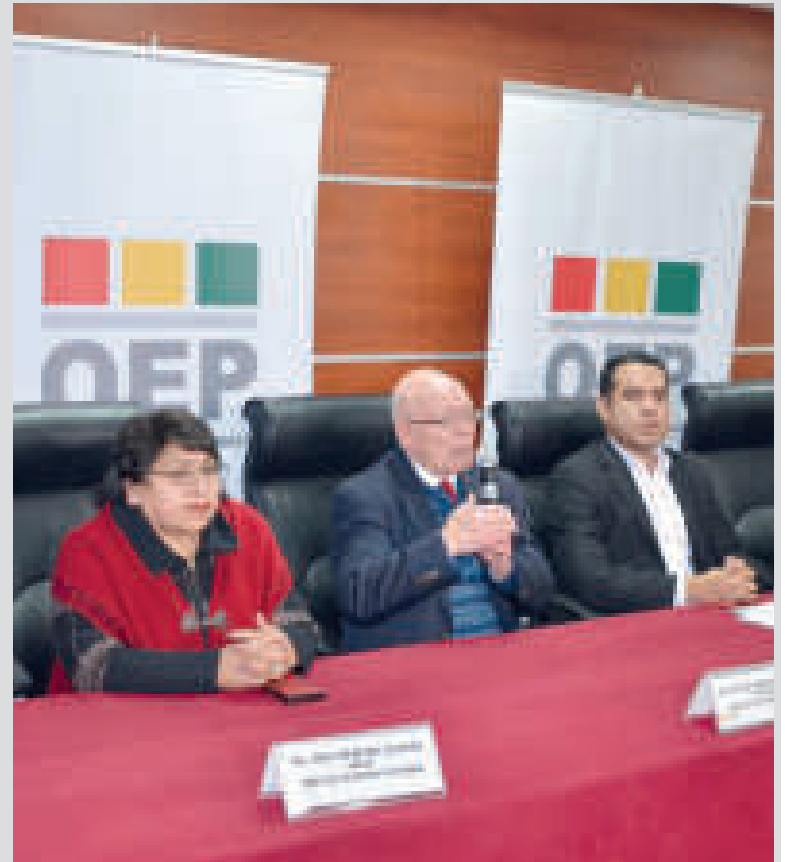
Miembros del Tribunal Supremo Electoral.

Será el tercer reglamento que apruebe la Asamblea Legislativa, luego de los dos anteriores que fueron suspendidos, primero, el 13 de abril, por decisión de un fallo de la Sala Constitucional Primera del Beni, a demanda del abogado Miguel Ángel Balcázar, quien observó el requisito de no emitir comentarios políticos; y la segunda ocasión fue el 28 de abril, por una medida cautelar emitida por el Tribunal Constitucional Plurinacional (TCP), tras admitir una acción de inconstitucionalidad abstracta presentada por el diputado de Creemos Leonardo Ayala.