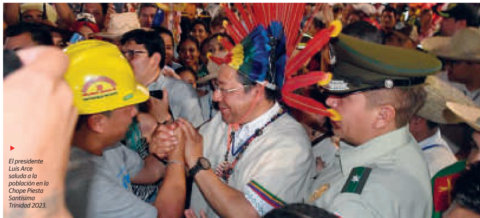
▶ El presidente Luis Arce saluda a la población en la Chope Pieta Santísima Trinidad 2023.