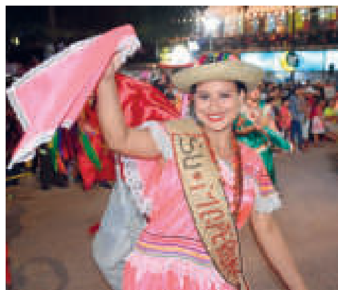
▶ Con mucha alegría muestran sus pasos.