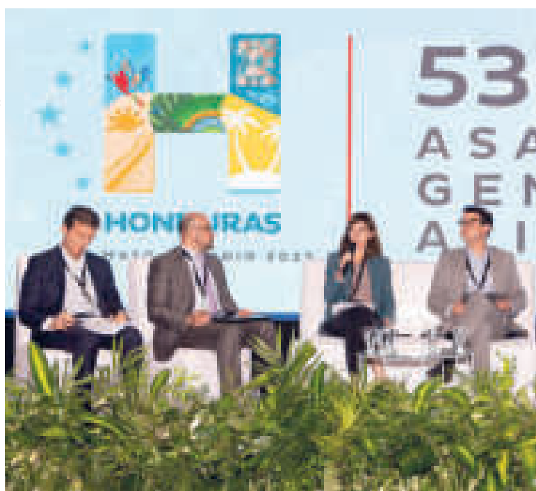
El gerente del BDP en la Asamblea de la Alide.