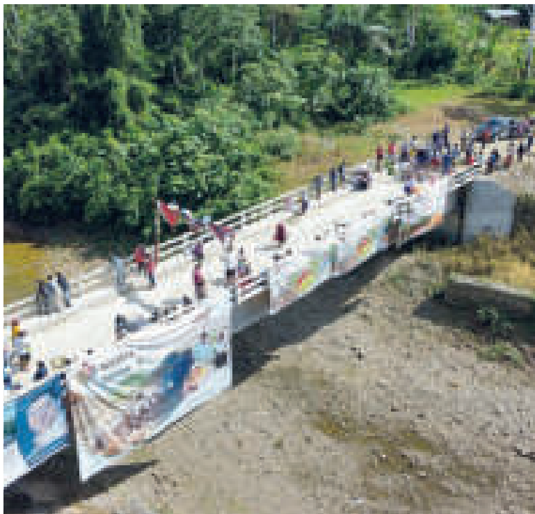
Uno de los puentes entregados por el Gobierno en Cochabamba.