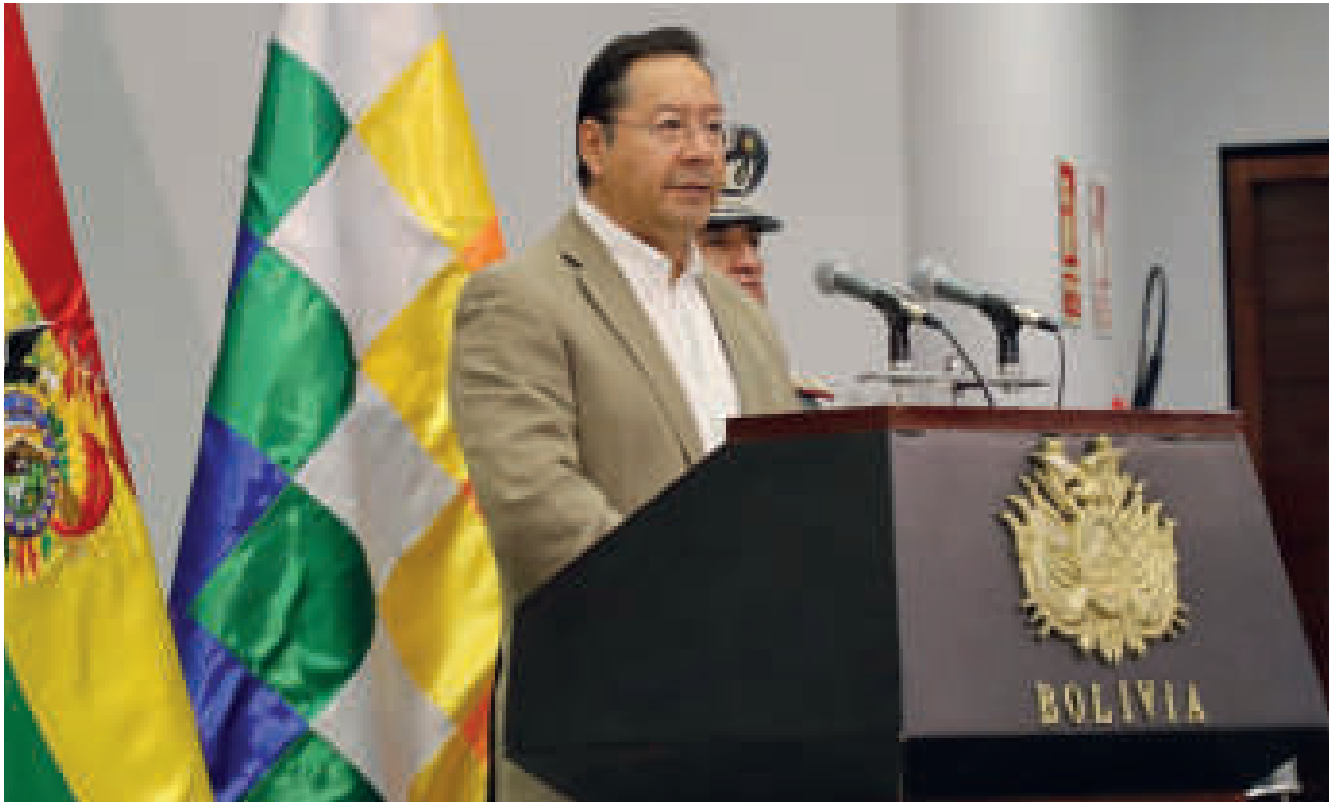
El Jefe de Estado, en su alocución.