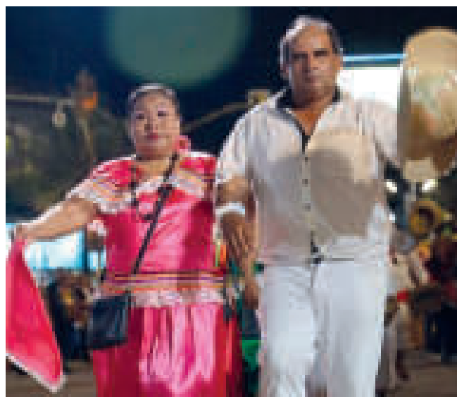
▶ Una de las danzas típicas del Beni.