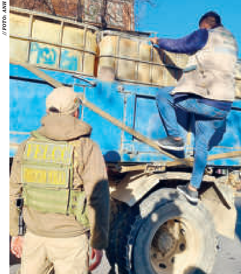
La volqueta que fue comisada en Chasquipampa.