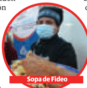
Sopa de Fideo

El secretario municipal de Desarrollo Económico, Bernaldo Huanca, dijo que los 20 productos fueron seleccionados el 16 de mayo de media centena de aspirantes, en el showroom que se desarrolló en la Terminal Metropolitana de El Alto.