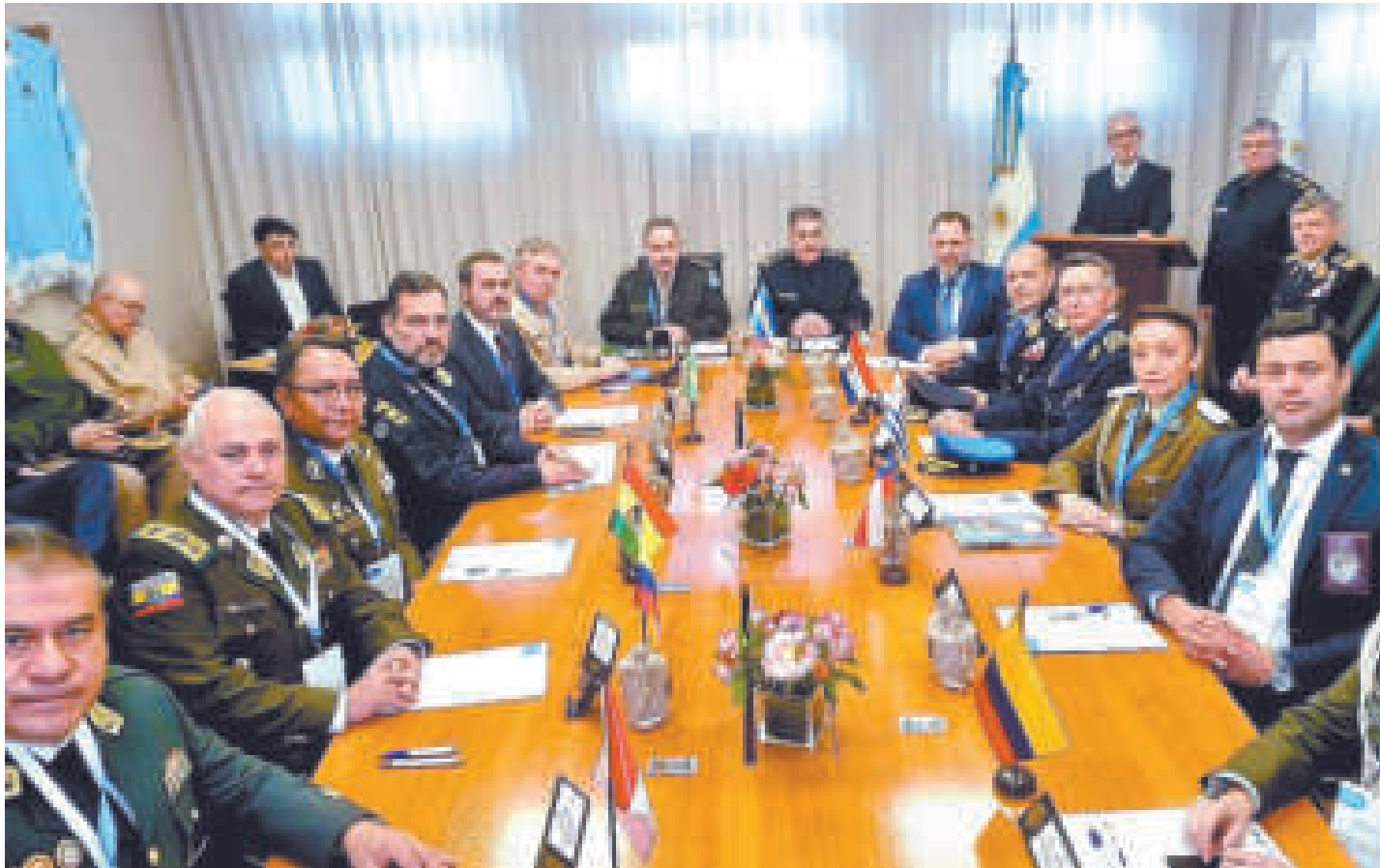
La reunión de jefes policiales de los países del Mercosur y asociados.