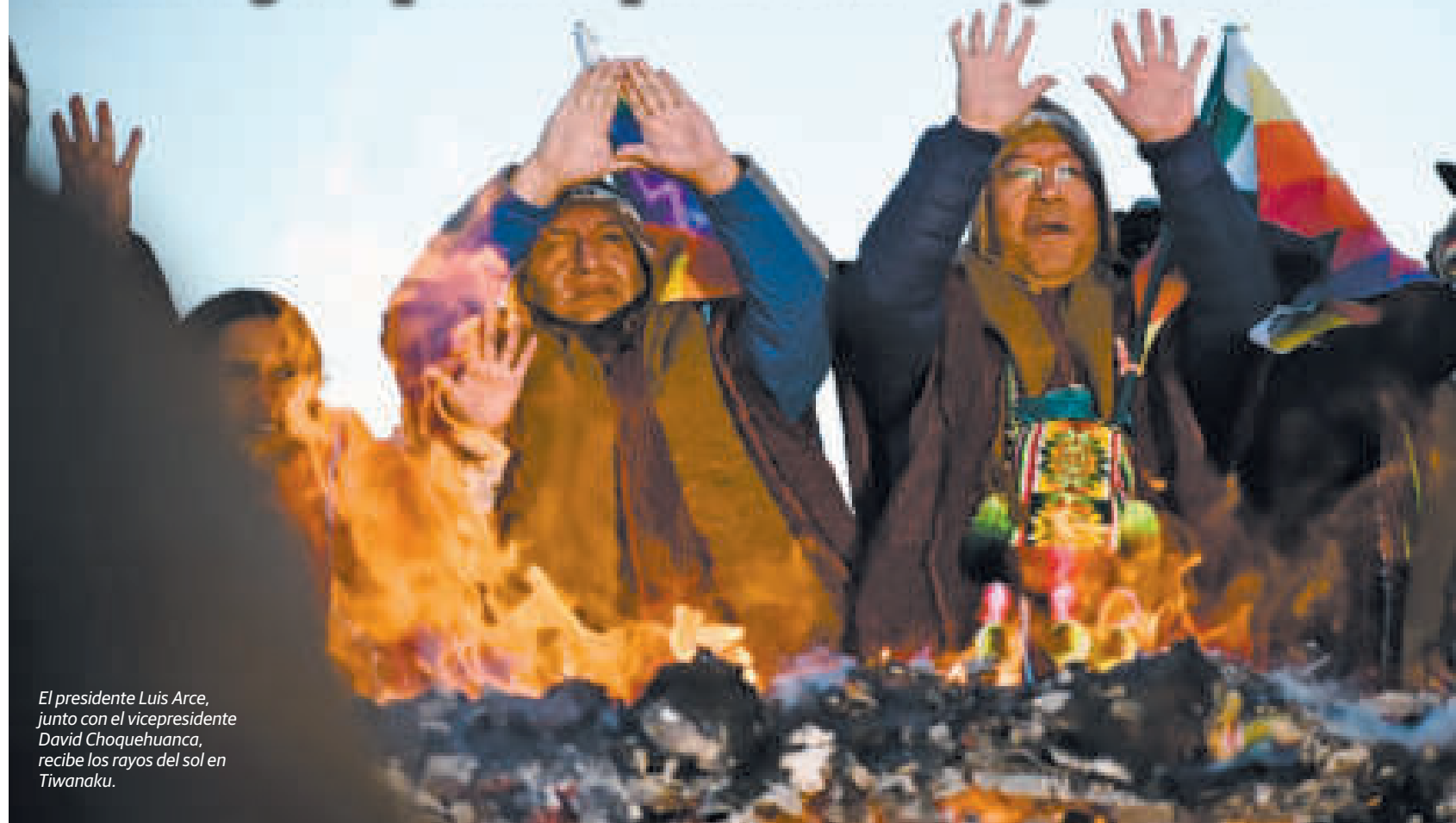
El presidente Luis Arce, junto con el vicepresidente David Choquehuanca, recibe los rayos del sol en Tiwanaku.

y varias autoridades de entidades públicas se desplazaron a otros sitios y participaron, junto a la población, en la celebración de este Año Nuevo Andino Amazónico y del Chaco, Willka Kuti, 5531.