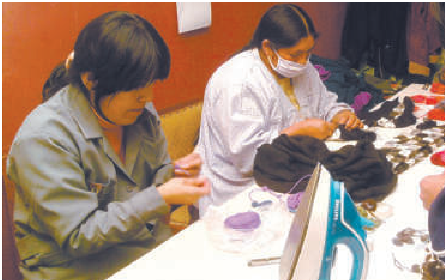
Emprendedoras en tejidos de alpaca.

“Es para aquellas mujeres que están pensando en tener un negocio o actividad económica productiva. Les ayudamos para que puedan tener sostenibilidad de vida”.