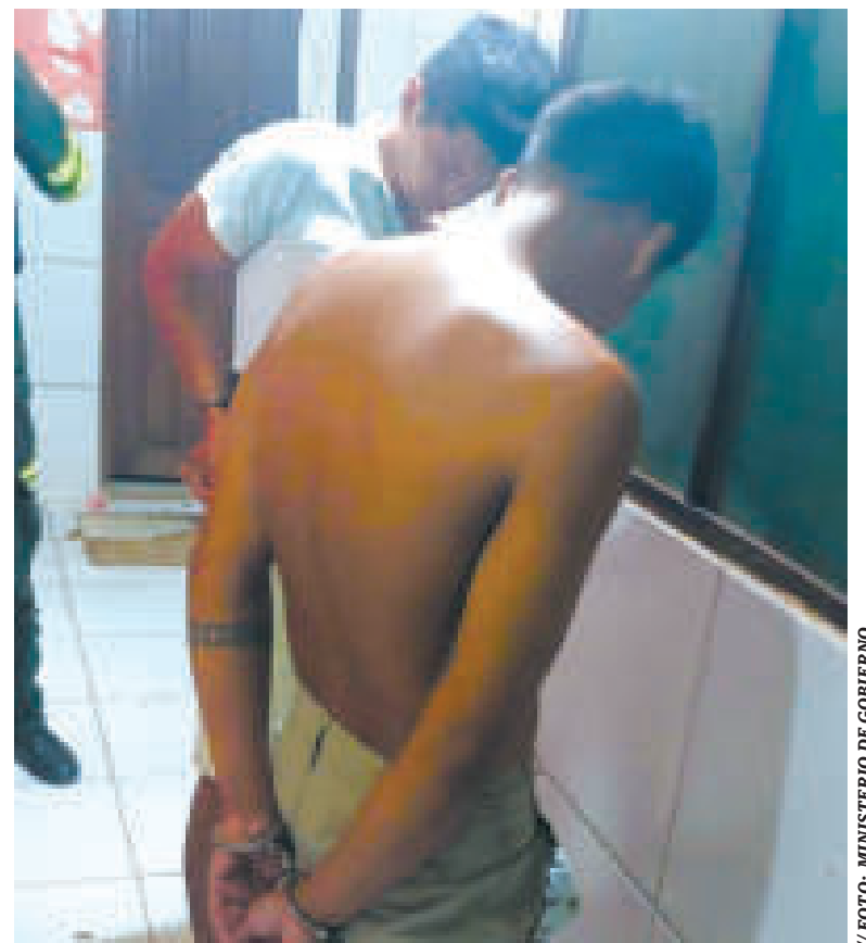
Dos ciudadanos brasileños fueron aprehendidos en Beni.

Así como ese caso, el titular de la cartera de Gobierno fue informando a través de sus redes sociales diversos operativos que se ejecutaron con la aprehensión de personas vinculadas con hechos delictivos.