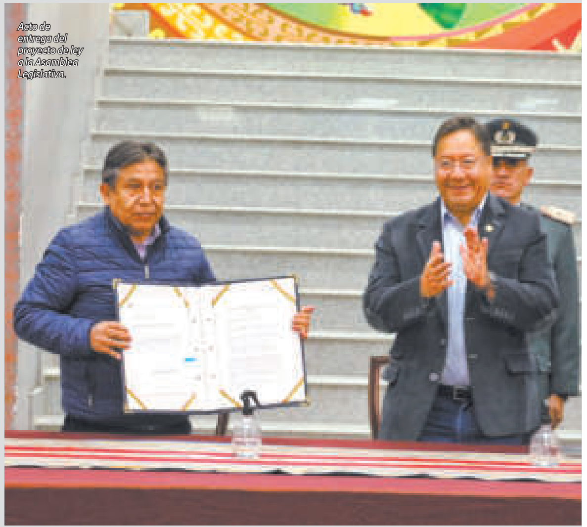
Acto de entrega del proyecto de ley a la Asamblea Legislativa.

“Las cláusulas anticorrupción le obligan a la empresa a tener claridad de que si va a tener que hacer un pago irregular, el contrato se le puede terminar inmediatamente y un proceso de recuperación de los activos pronto, urgente e inmediato”, insistió.