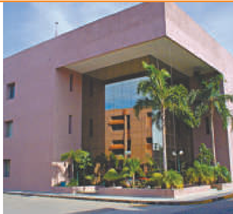
El Centro Nacional de Información Hidrocarburífera (CNIH) de YPFB, en Santa Cruz.

Con la implementación de la tecnología de extracción directa de litio se prevé construir al menos dos plantas de carbonato de litio, cada una con capacidad de 25.000 toneladas al año en los salares de Uyuni (Potosí) y Coipasa (Oruro), que entrarán en funcionamiento en 2025.