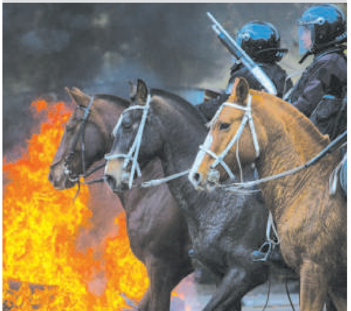
Policia montada durante la represión en Jujuy.