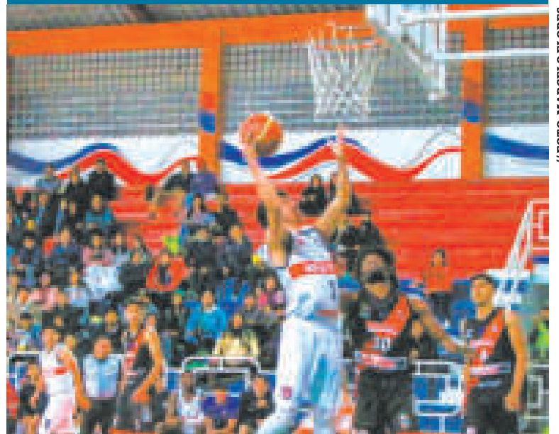
Una escena del partido entre Universitario y Nacional Potosí.

El certamen ingresa en su recta final y hay expectativa.