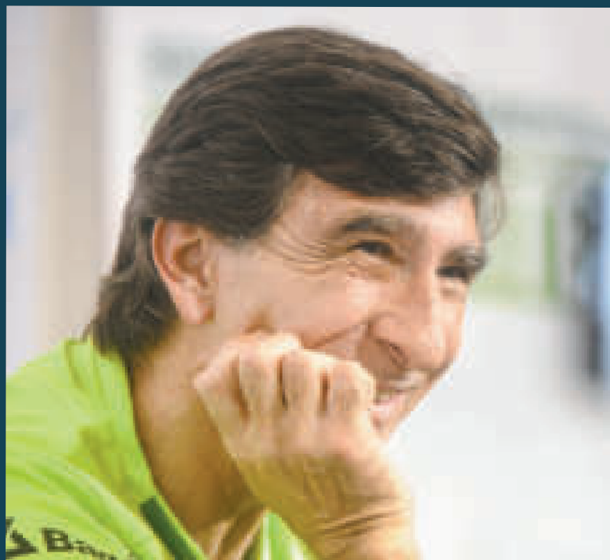
Costas quedó conforme con el rendimiento del seleccionado.

Así como elogió el esfuerzo, la entrega y actitud de los jugadores más jóvenes, también les recriminó sobre el comportamiento dentro la cancha, "no podemos estar parados, hay que estar en movimiento y concentrados en el juego".