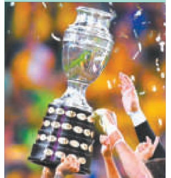
La Copa América 2024 se jugará en EEUU.

Jamaica, México, Surinam, Panamá, Costa Rica, Martinica, Honduras, Canadá, Curazao, El Salvador y Granada serán algunos de los países que lucharán por un lugar en la Copa América. El formato de 16 equipos comprende cuatro grupos de cuatro países cada uno, donde cada primero y segundo accederán a los cuartos de final.