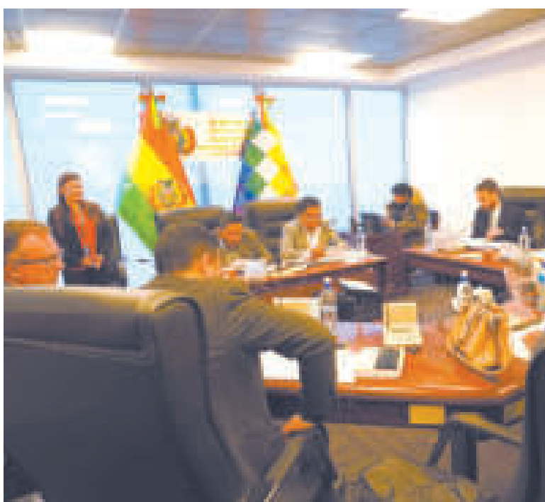
Informe del ministro de Gobierno, Eduardo Del Castillo, en la Comisión de Constitución.

En la exposición de motivos de la propuesta legal, se señala que hasta enero de 2023 las personas privadas de libertad, entre reclusas sin determinación de culpabilidad o inocencia en detención preventiva o sentenciadas, alcanzan aproximadamente a 24.913, de las cuales 8.553 (34,33%) tienen sentencia y 16.360 (65,67%) son detenidos preventivos.