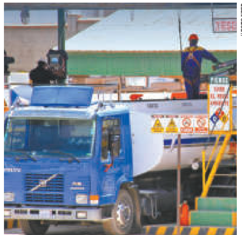
Una estación de servicio en el país.

BOLIVIANOS es el costo por litro de diésel en el territorio nacional.