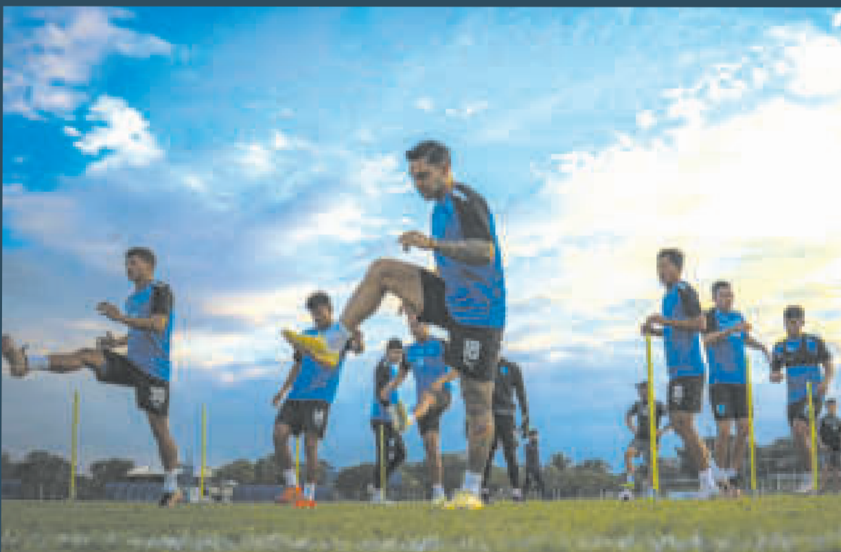
Jugadores de Bolívar en el cierre de prácticas en la cancha del club Blooming, en Santa Cruz.