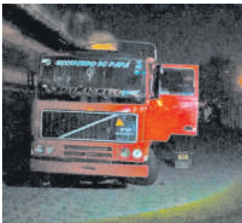
El camión que los contrabandistas trataron de recuperar.