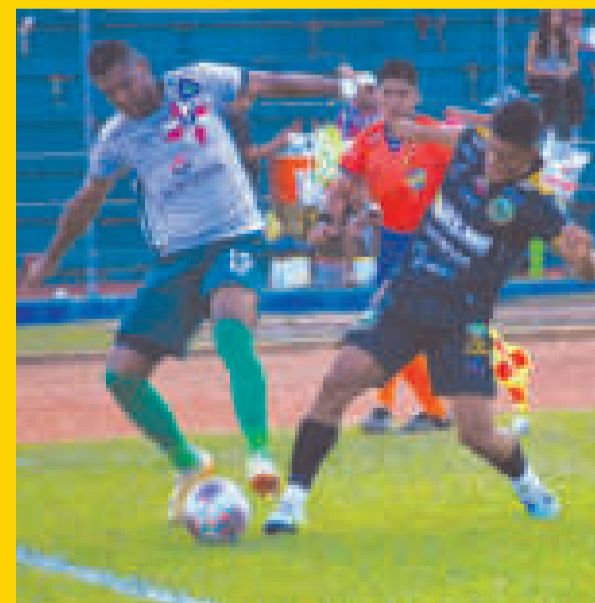
Una escena del encuentro que se disputó en el estadio de Trinidad.

Fue el primer cotejo que dirigió el español David González, quien necesita trabajar para demostrar los avances en el juego del plantel tarijeño.