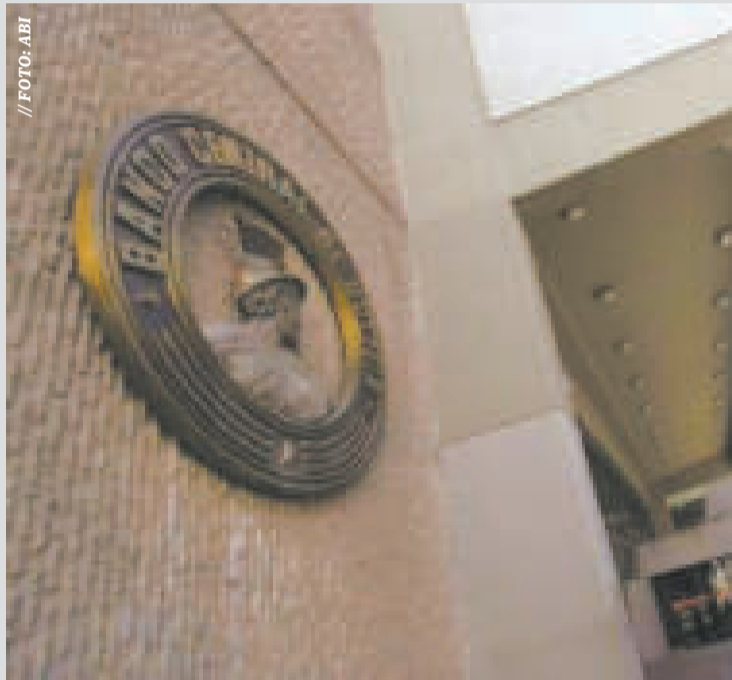
El Banco Central de Bolivia.

El descenso favorecerá a los prestatarios de créditos en bolivianos debido a que la reducción representará menor costo en el pago de intereses.