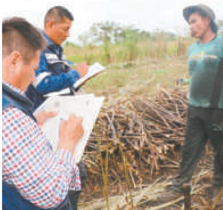
Personal del Ministerio de Trabajo hizo una inspección a los campos de caña.