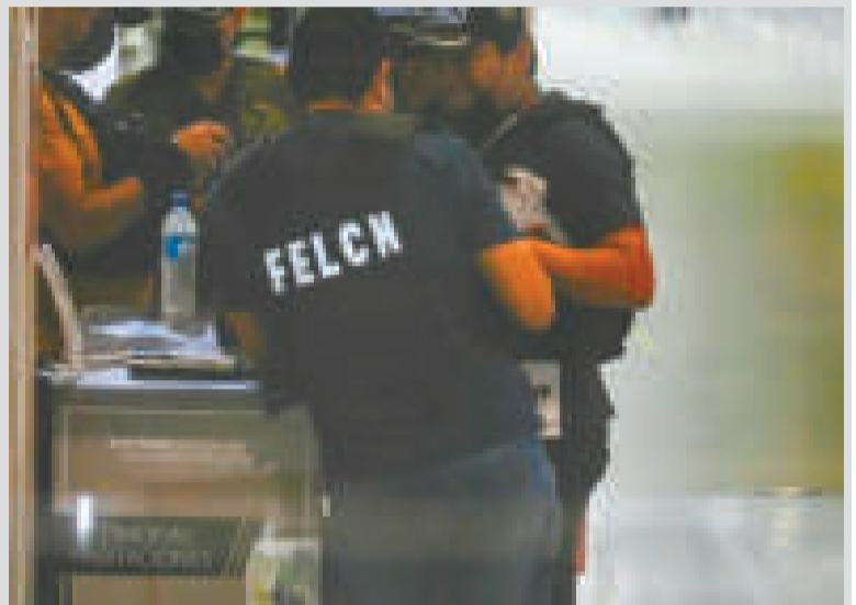
Efectivos de la Fuerza Especial de Lucha Contra el Narcotráfico.

Explicó que una vez que se tenga el documento, será aprobado con una resolución interministerial.