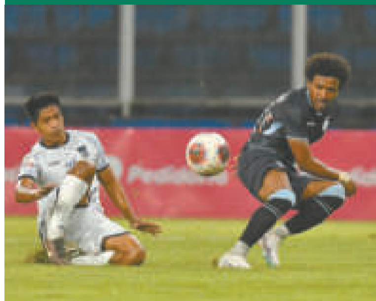
Una incidencia del cotejo que jugaron Palmaflor y Aurora, en Villa Tunari.

En la próxima fecha, Aurora será local ante Guabirá, y Palmaflor ante Real Santa Cruz.