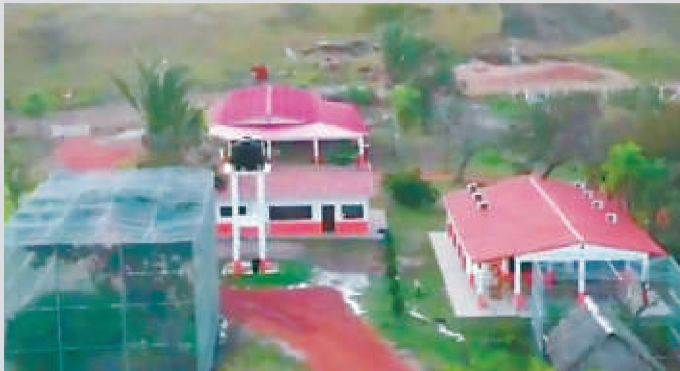
Una de las haciendas de Misael Nallar.

asesinato se le incautó gran cantidad de bienes valuados en más de $us 5 millones, sobre los que Nallar tendrá que demostrar su origen.