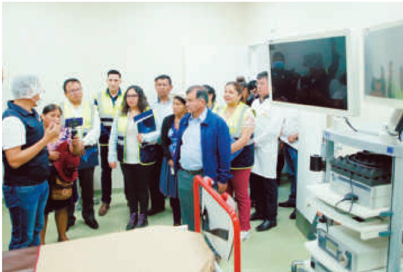
La supervisión que hizo la Ministra de Salud al hospital de tercer nivel de Villa Tunari.