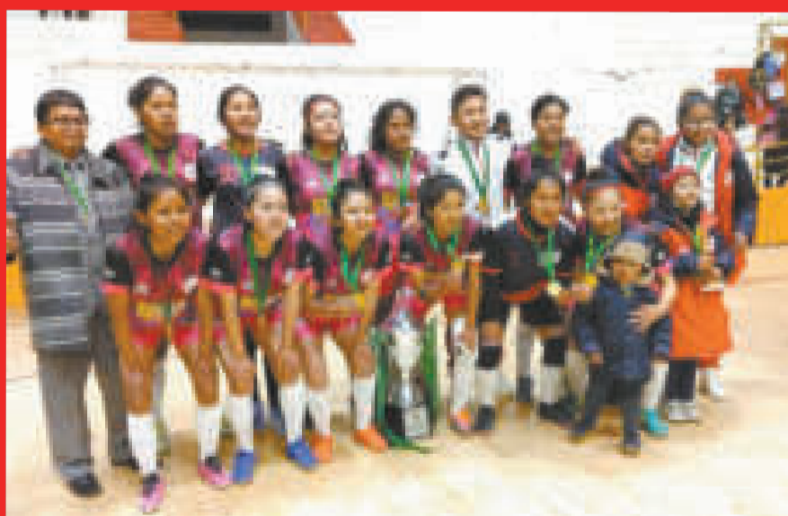
Selección femenina de fútbol mayores que conquistó el título nacional.

minó como primera de su serie con 9 puntos, seguida por Tarija (6), Oruro (3) y Santa Cruz (0).