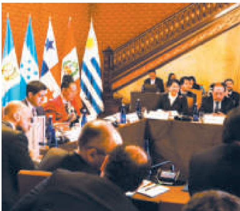
La viceministra de Gestión Consular, Eva Chuquimia, en la reunión en Bogotá.