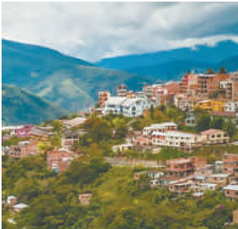
Vista del municipio de Coroico.