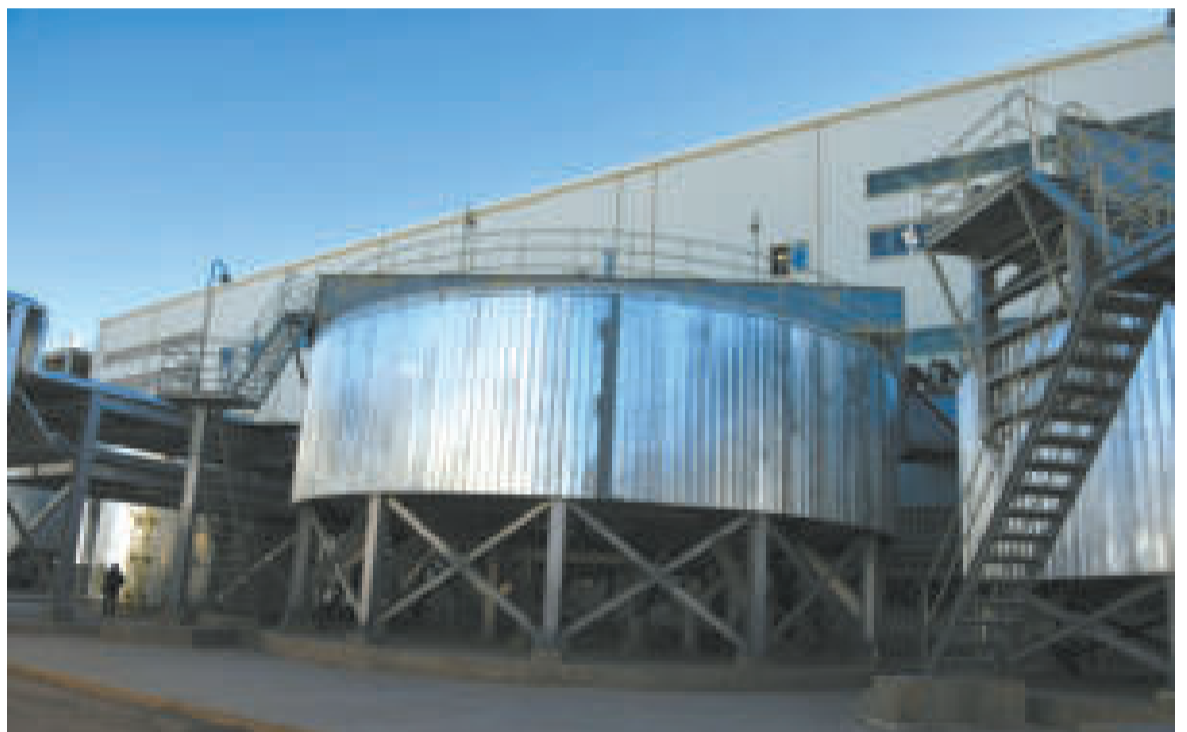
Emplazamiento de la Planta Industrial de Carbonato de Litio.