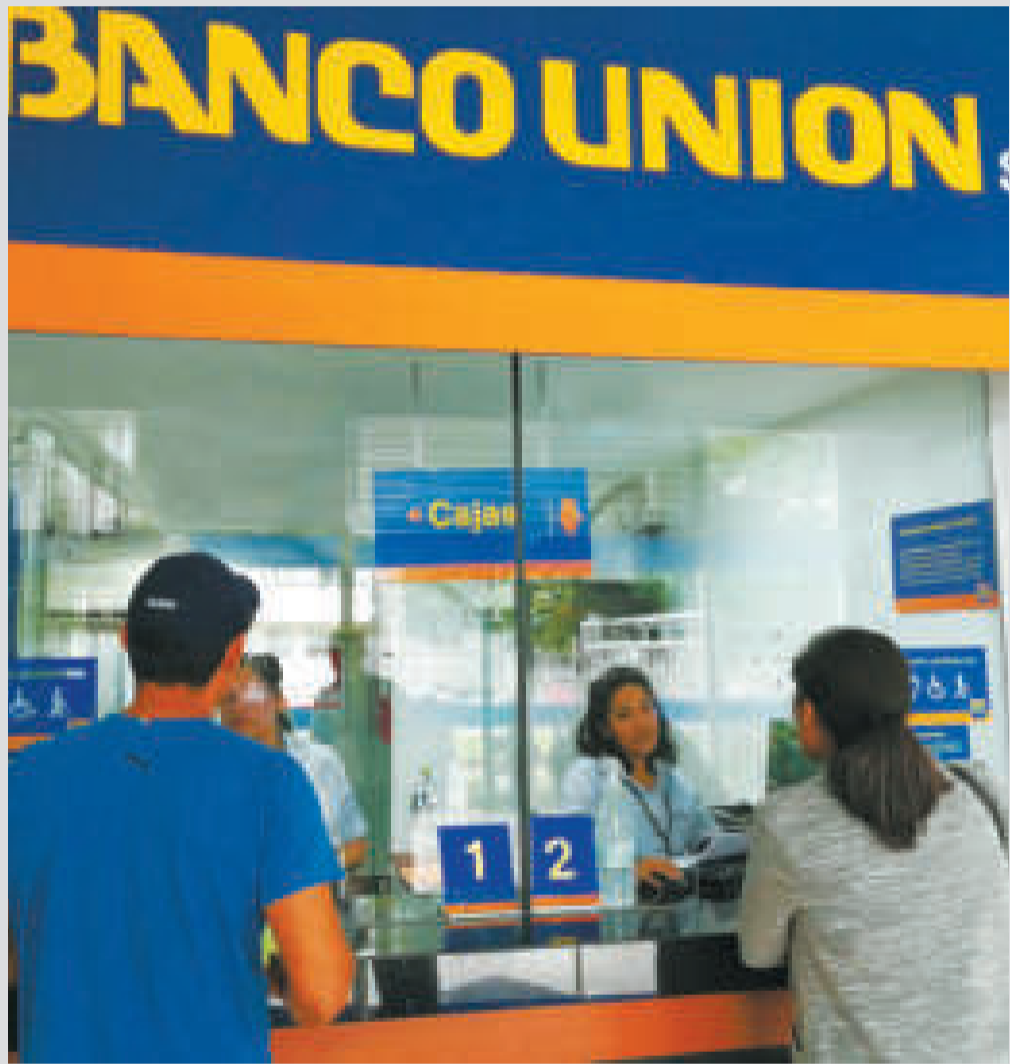
Ventanillas del Banco Unión.