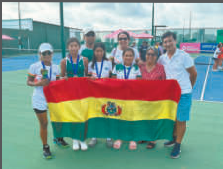
La selección boliviana femenina de tenis menores logró el tercer puesto.