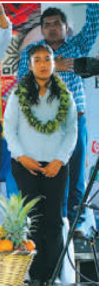
Entrega de obras educativas y de electrificación.