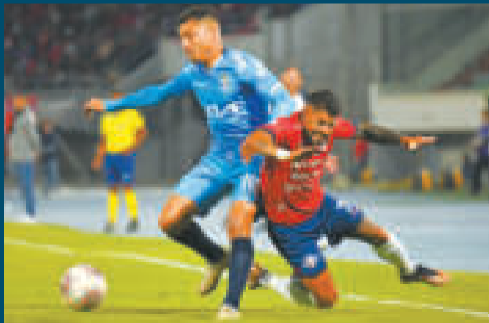
Una escena del cotejo jugado en el estadio Félix Capriles de Cochabamba.

Con los tres puntos, Wilstermann suma 20 y es noveno en la tabla de posiciones.