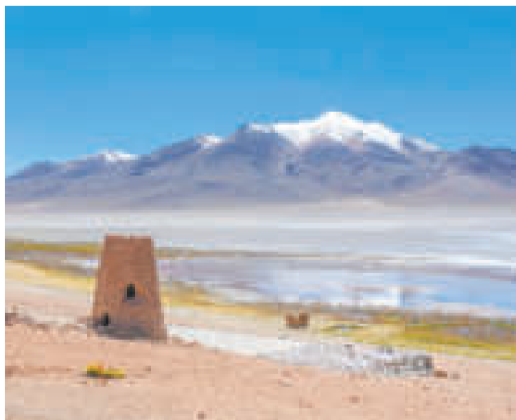
El salar de Chachi Laguna, en Potosí.

“Para el siguiente año tendríamos una cuantificación aproximada de los cinco salares”, dijo la autoridad.