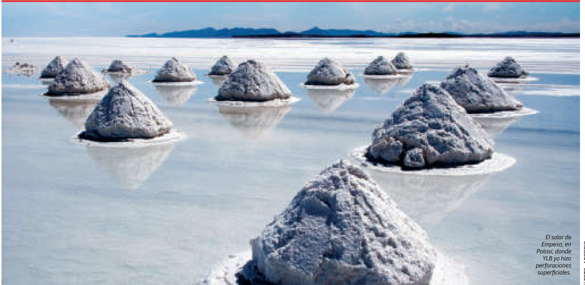
El salar de Empexa, en Potosí, donde YLB ya hizo perforaciones superficiales.