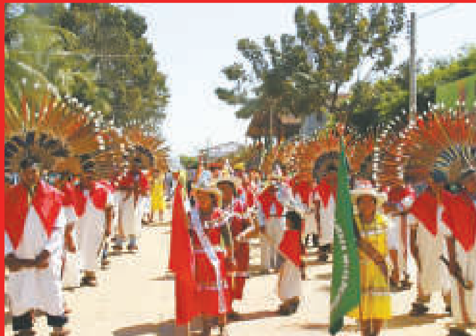
El pueblo moxeño mantiene sus raíces y su lengua.