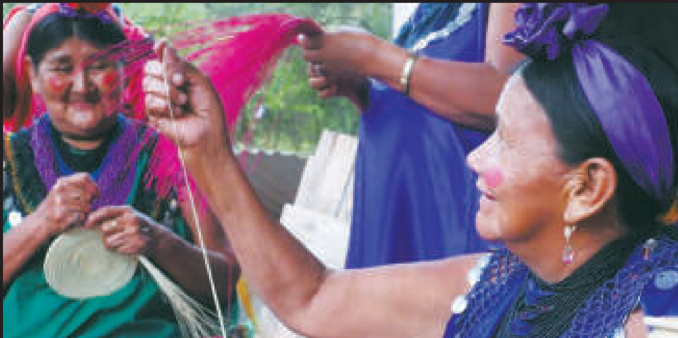
Mujeres indígenas en el chaco boliviano.