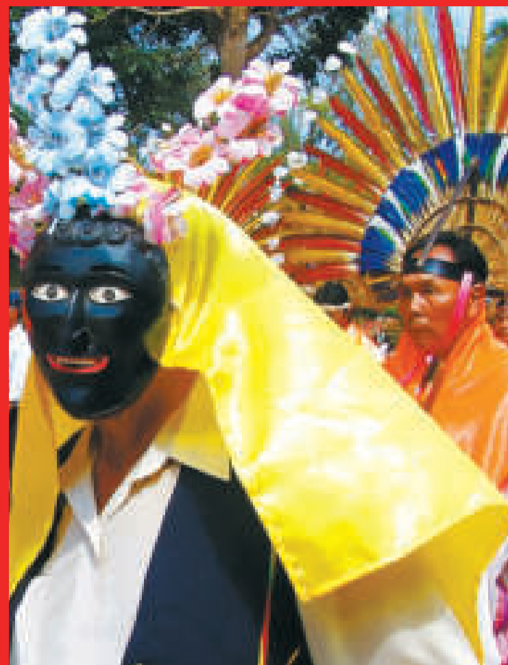
La cultura moxeña.

Los árboles de cedros, palmas, tajibos, en cuyos troncos labran panales de cera y miel las abejas, no pasaron desapercibidos por los religiosos que vieron cómo en la espesura de