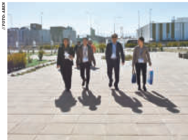
La misión china durante su visita al Centro de Medicina Nuclear.