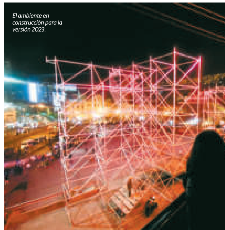
El ambiente en construcción para la versión 2023.

las expectativas coreográficas diferentes a las del año pasado, pero va a seguir ganando en profundidad. Como bien les decía a los artistas que van a poder moverse con holgura a lo largo de todo el escenario y no estar cantando ahí chocándose instrumento con instrumento”, manifestó el burgomaestre.