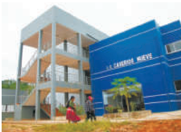
Infraestructura educativa entregada por el presidente Arce.

El mandatario explicó que poco a poco ya se está industrializando el país con más de 130 plantas, muchas de las cuales ya están en ejecución y otras empezando su construcción.