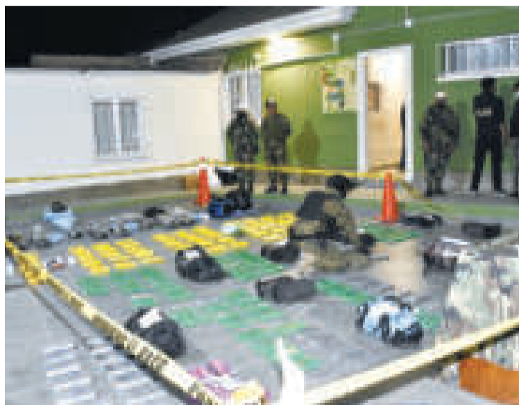
Efectivos de la FELCN presentan una incautación de droga.

“Nuestra lucha es incansable, frontal y transparente contra el flagelo del narcotráfico. Para nuestro Gobierno es una prioridad de Estado y en ese contexto hemos estado fortaleciendo la Fuerza Especial de Lucha Contra el Narcotráfico”, declaró.