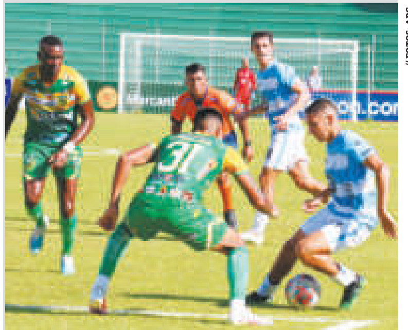
Una incidencia del cotejo que se disputó ayer en Pando.