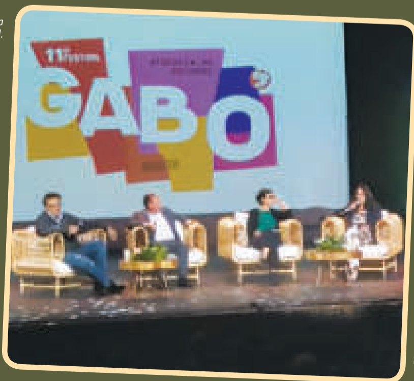
Panel de charla en el Festival.

Estos lugares vuelven a posicionar al Festival Gabo como un evento de ciudad y de país, que ha convertido a la hermosa Colombia en la capital del periodismo iberoamericano durante 11 años consecutivos.