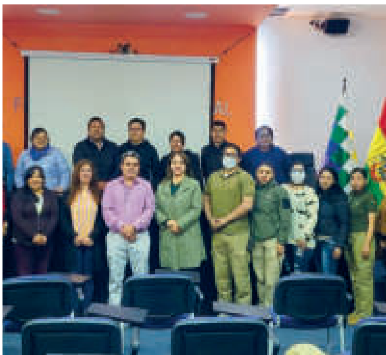
Participantes del curso de capacitación.

Los contenidos estuvieron enfocados en el trabajo de triangulación y geolocalización de llamadas, así como análisis periciales de los equipos de telefonía celular móvil, también de computadoras (DVD, CD y DVR), entre otros.