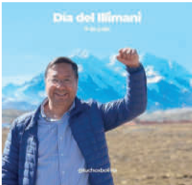
El presidente Luis Arce le rindió homenaje al Illimani en sus redes sociales.