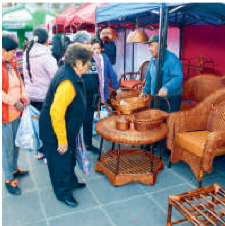
Un artesano expone su producción durante la feria.

EXPOSITORES COMO MÍNIMO fueron parte de esta iniciativa en la plaza Villarroel de la ciudad de La Paz.