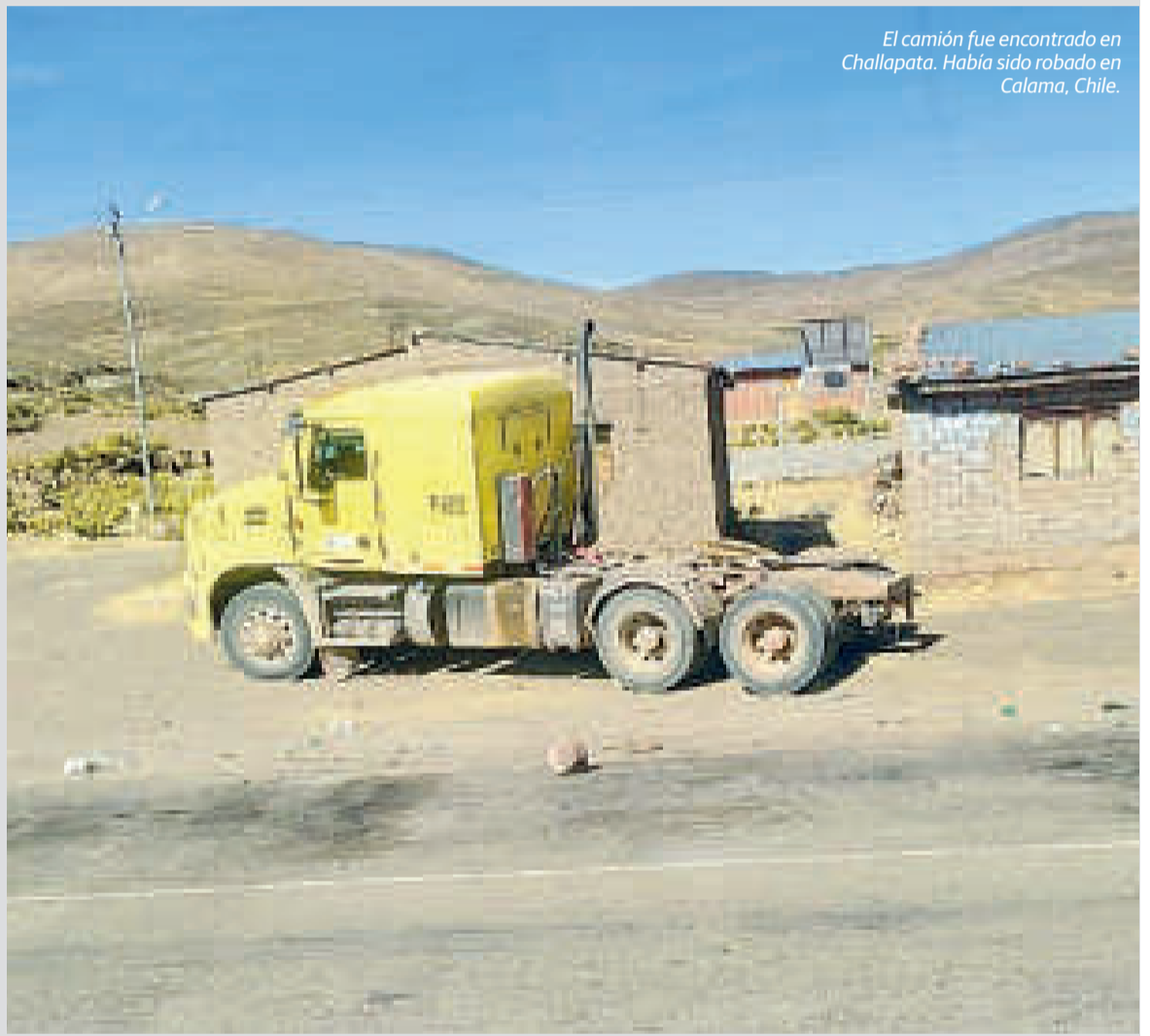
El camión fue encontrado en Challapata. Había sido robado en Calama, Chile.

Se descartó además el secuestro de un ciudadano de nacionalidad chilena, quien fue encontrado en Uyuni. Había ingresado ilegalmente al territorio boliviano.