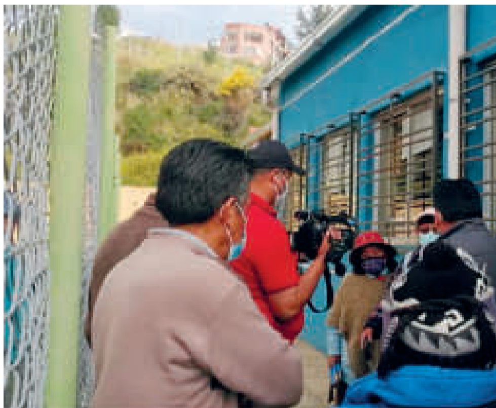
Los centros médicos municipales, en algunos casos, no tienen recursos para servicios básicos.