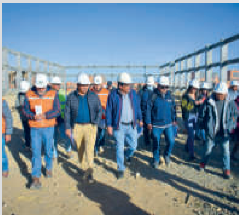
Inspección de la planta procesadora de papa en El Alto.