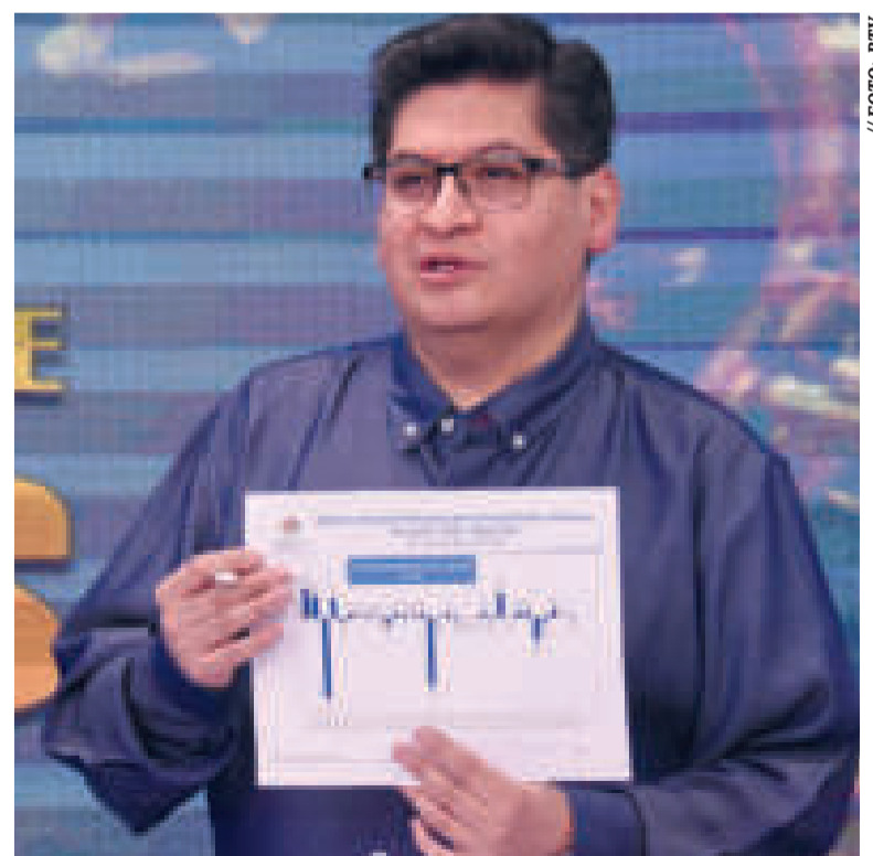
El ministro de Economía y Finanzas Públicas, Marcelo Montenegro.

MILLONES DE DÓLARES en créditos fueron aprobados por la Cámara de Senadores en pasados días.