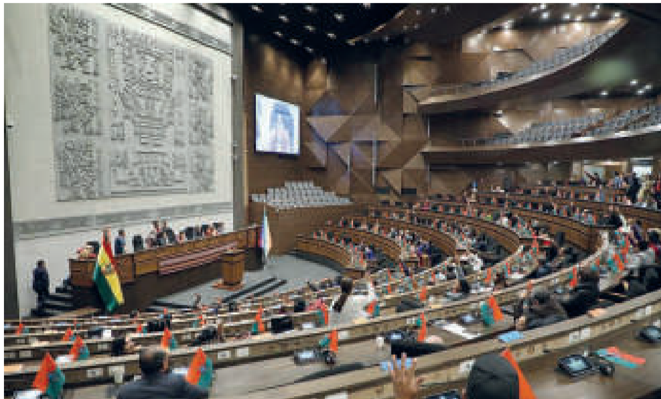
El pleno de la Asamblea Legislativa.