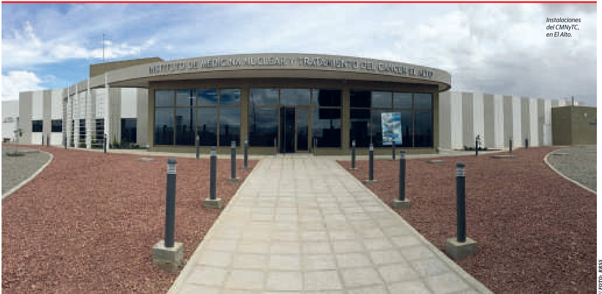
Instalaciones del CMNyTC, en El Alto.