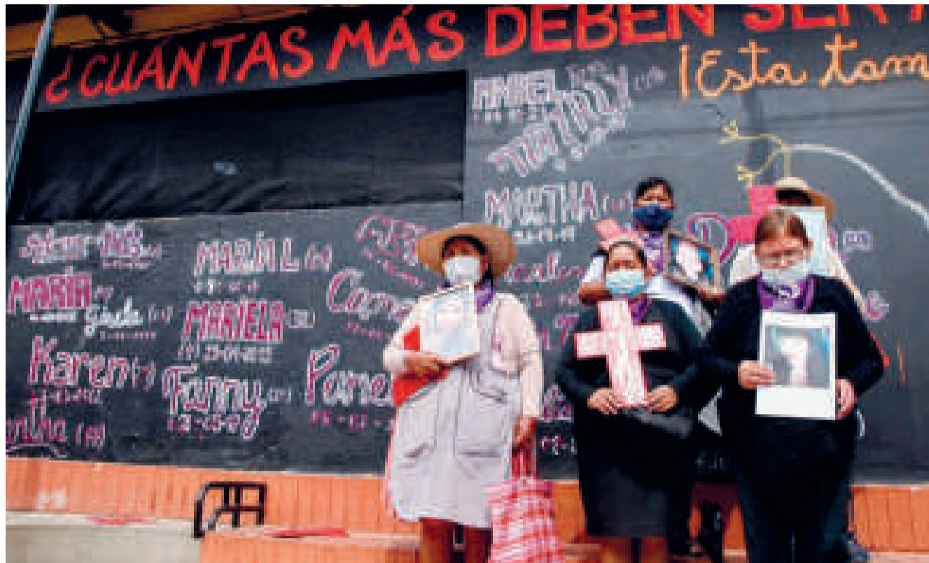
Las madres lloran a sus hijas que fueron asesinadas.

Además indicó que este tipo de violencia está interiorizado en la población, pues se piensa que las mujeres representan sensibilidad, que están para