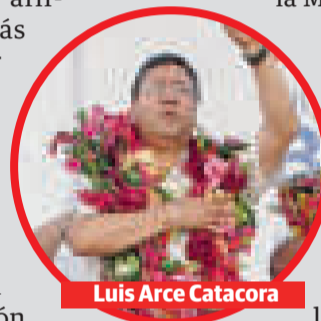
Luis Arce Catacora

El 6 de julio entregó la construcción y otorgación de 22 puentes entre las localidades de Ixiamas y San Buenaventura, en el norte de La Paz, los cuales permitirán unir los departamentos de La Paz y Pando. Arce explicó que es un hito histórico en el desafío de la Marcha al Norte.