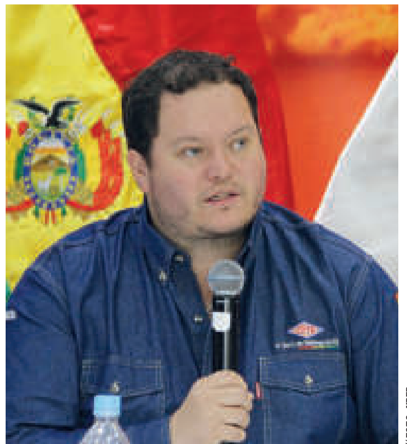
El presidente de YPF, Armin Dorgathen.