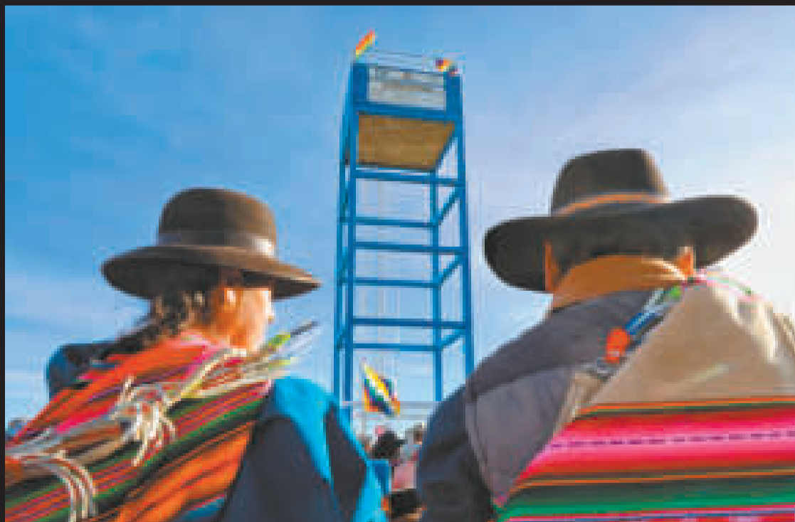
Comunarios de Calacoto son productores de hortalizas.