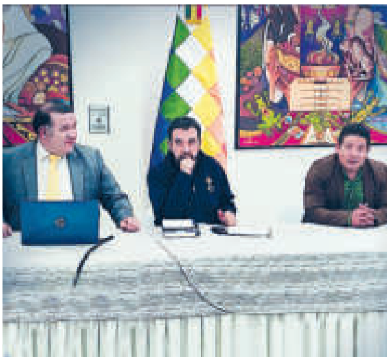
La reunión entre el INE, el Gobierno y la Gobernación paceña.