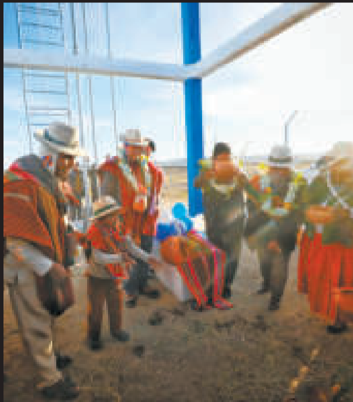
El mandatario Luis Arce en la entrega del sistema de microrriego en Calacoto.