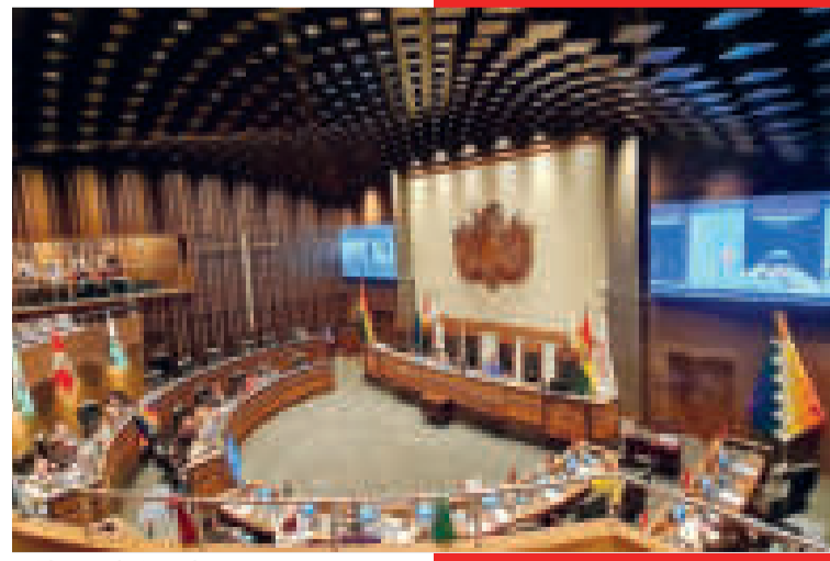
Cámara de Senadores.

ES EL PUNTO RESOLUTIVO de la Comisión Especial que dispone garantizar una protección reforzada a las víctimas.