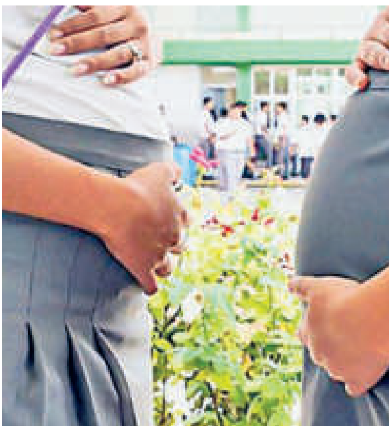
En 2015, cada día más de 200 menores resultaban embarazadas por día.