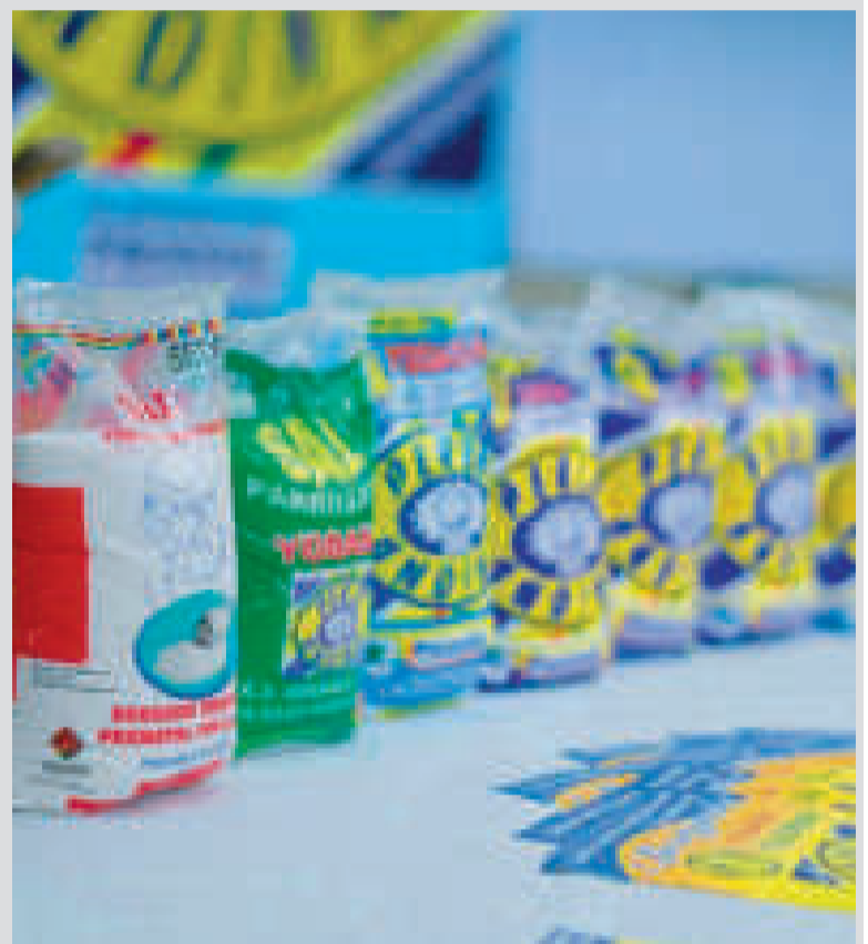
Las marcas de sales que tienen los niveles de fortificación requerida.