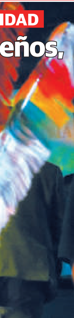
El Presidente recorre los espacios del Centro Cultural Gran Poder en La Paz.

“Es importante dejar un lugar para la perpetuidad del folklore. Tenemos muchos en el país. (El Centro Cultural Gran Poder) era una obra que estaba desechada por el gobierno de facto, había muchas obras desechadas, incluso el Ministerio de Culturas, pero nosotros lo repusimos para reservar el patrimonio del folklore”.