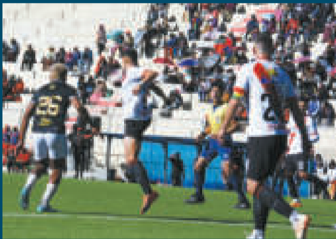
Una incidencia del encuentro que se jugó ayer en el estadio de El Alto.