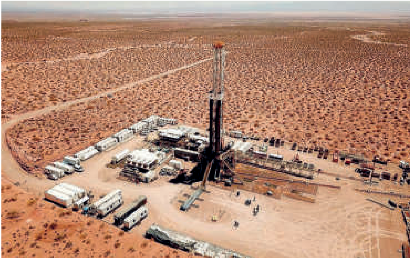
El megayacimiento de Vaca Muerta, en Argentina.