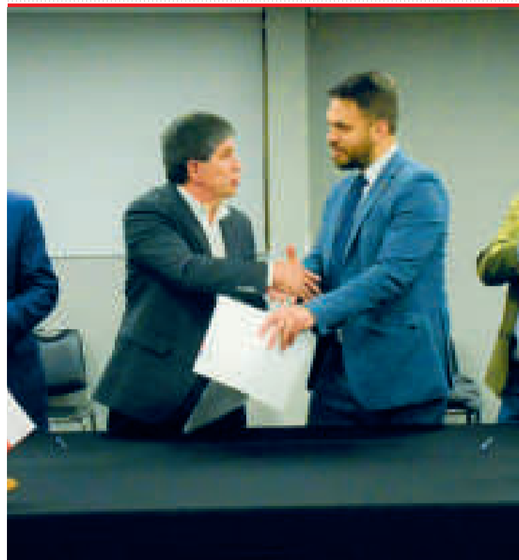
Autoridades de Chile y Bolivia durante el encuentro en Iquique.