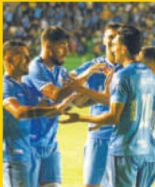
Jugadores de Blooming celebran la victoria.

Blooming sumó tres valiosos puntos después de vencer a Universitario de Vinto por 2 a 1, en el duelo que se disputó anoche en el estadio 'Tahuichi' Aguilera de Santa Cruz.