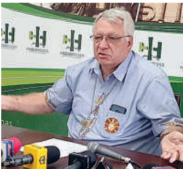
El obispo de San Ignacio de Velasco, Robert Flock.

Se indicó que las personas del lugar no acudían a la Fiscalía a denunciar, sino que se acercaban al obispo Flock para contarle los problemas que sufrían, porque lo consideraban la autoridad y la ley. Así, “como él dijo, tenían que llevarle la denuncia y él iba a tomar las medidas”, manifestó.