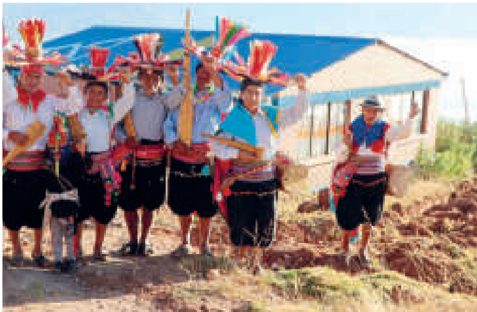
Sistema de agua potable entregado a familias en Batallas, La Paz.

Se tiene previsto que el proyecto, que además contará con un proceso de pasteurización especial, concluya en 2024.