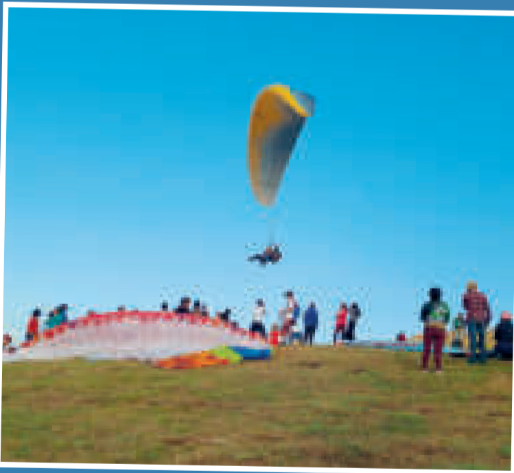
Crédito de foto

◀ La 18 edición del Irupapente es una prueba que genera gran expectativa entre los participantes y el público que gusta del vértigo. En esta versión habrá un vuelo nocturno.