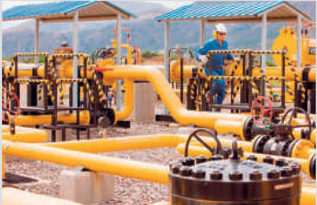
Los gasoductos de exportación de Bolivia a Brasil.

El mismo día, Dorgathen informó en Bolivia que YPFB con-