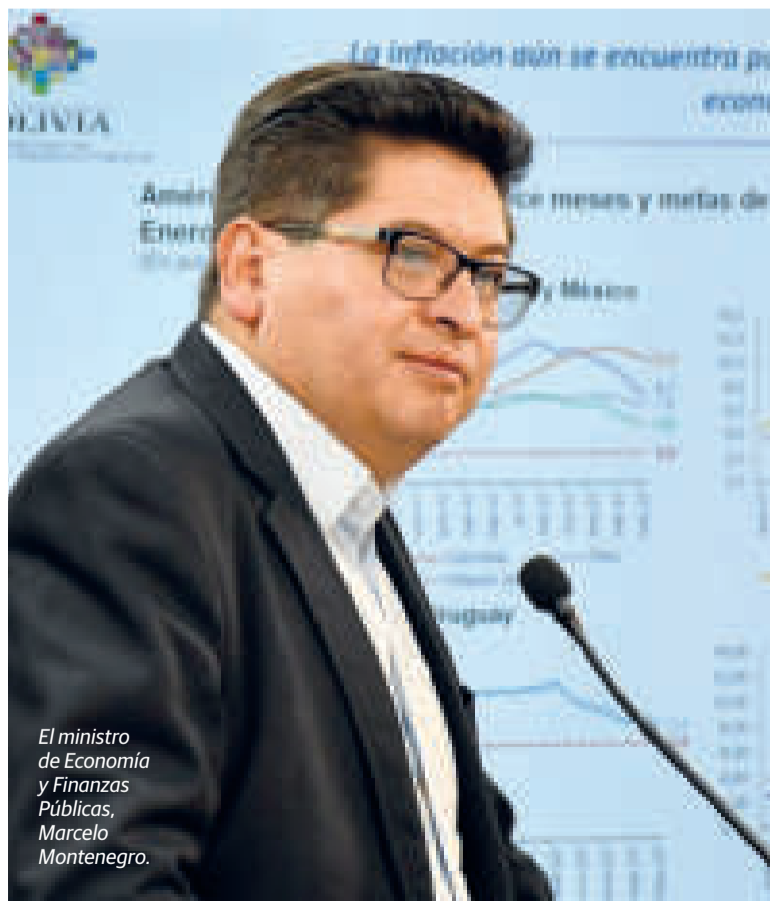
El ministro de Economía y Finanzas Públicas, Marcelo Montenegro.

El Ministerio de Economía informó que organismos internacionales, como la Comu-