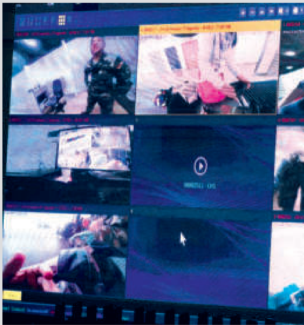
Las imágenes que tomaron las body cam el momento de su prueba.

Del Castillo también indicó que el Ministerio de Gobierno tiene la obligación de suministrar los insumos necesarios para que el personal de seguridad desarrolle su trabajo en buenas condiciones.