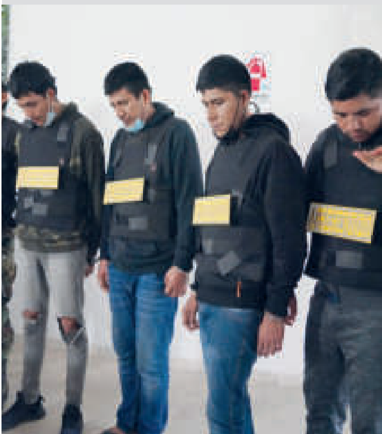
Cuatro miembros de la organización que distribuía droga.