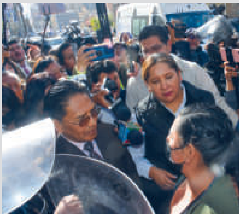
Los viceministros tratan de dialogar con los manifestantes.