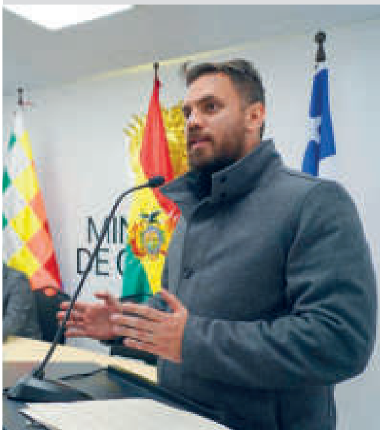
El ministro de Gobierno, Eduardo Del Castillo, en conferencia de prensa.