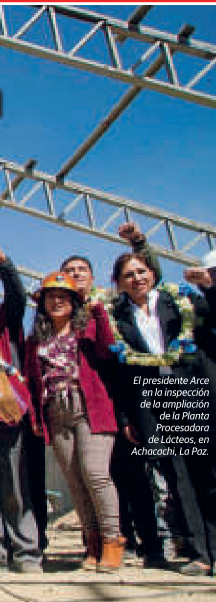
El presidente Arce en la inspección de la ampliación de la Planta Procesadora de Lácteos, en Achacachi, La Paz.