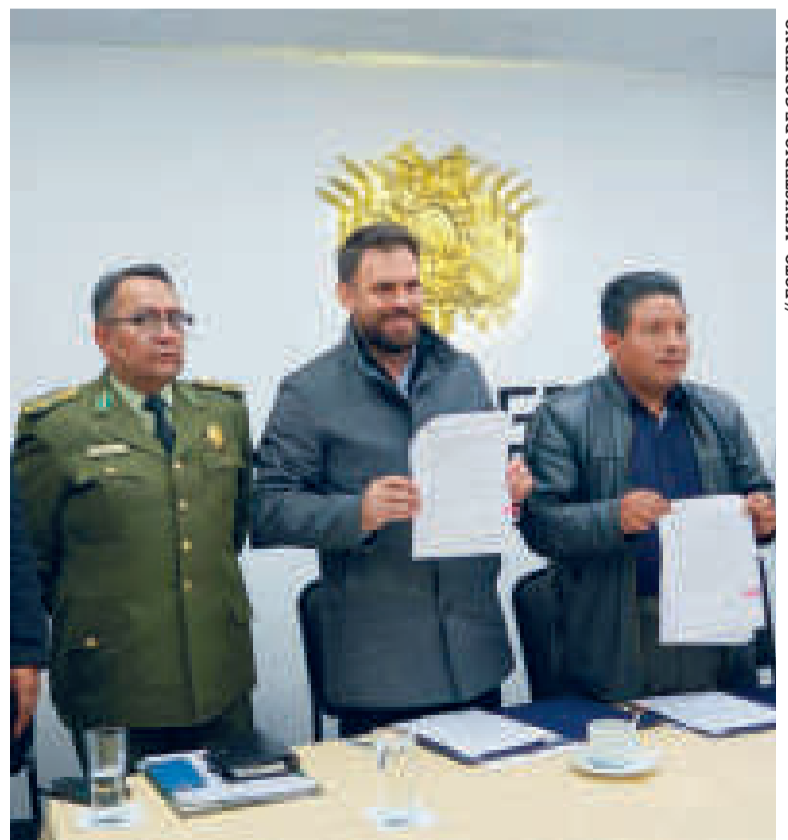
El titular de Gobierno y el Gobernador de La Paz muestran el acuerdo firmado.

El Ministerio de Gobierno cubrirá el costo de implementación de los equipos por un valor de Bs 50.203.348.