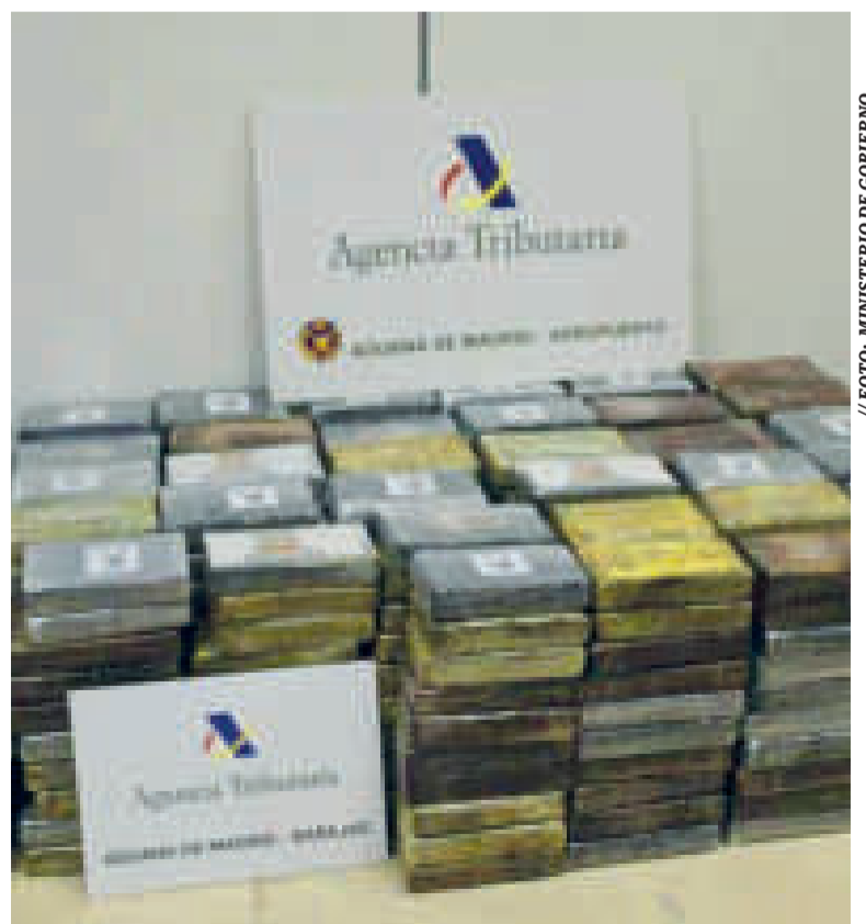
La droga que fue secuestrada en España con el logotipo de un conejo.

Señaló que será la comisión de fiscales y los investigadores quienes, mediante pericias, confirmarán si la droga que se incautó en España —investigada en el caso Droga Barajas— fue cristalizada en el Chapare y trasladada hasta Santa Cruz con rumbo final a España.