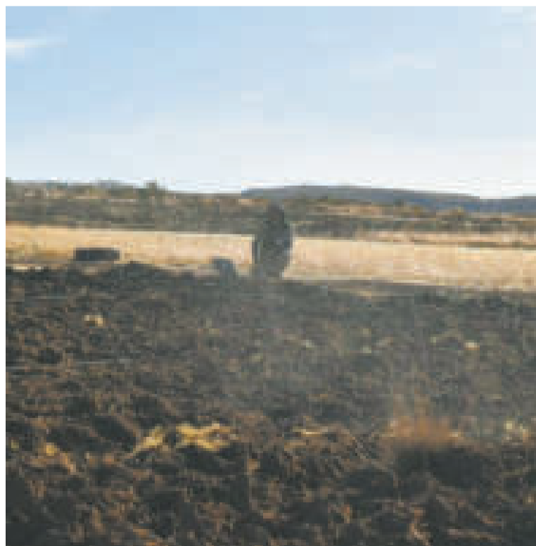
Se busca consolidar mayores áreas de producción.

serán las beneficiadas con la entrega de la maquinaria pesada.