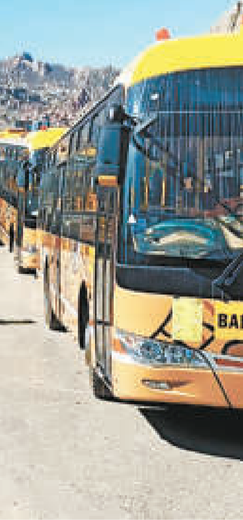
Decenas de buses en un garaje municipal, a cielo abierto.