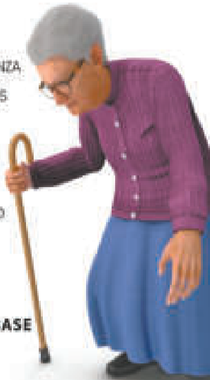
// INFOGRAFÍA: YURI ROJAS

■ SI ERES UNA PERSONA CON ENFERMEDADES DE BASE O DE LA TERCERA EDAD, ES RECOMENDABLE CONTINUAR CON EL USO DEL BARBIJO.