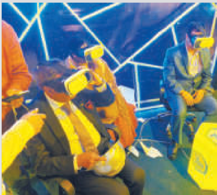
El stand de la empresa YLB generó bastante expectativa.