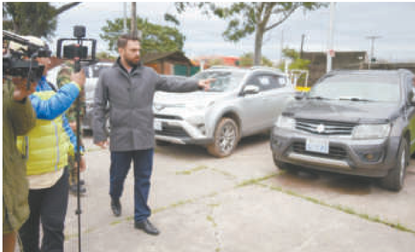
El ministro Eduardo Del Castillo con los vehículos recuperados.

La reunión entre Bolivia y Chile se dio después de que tres ciudadanos chilenos fueron atacados en Challapata, Oruro, con disparos de armas de fuego cuando encontraron