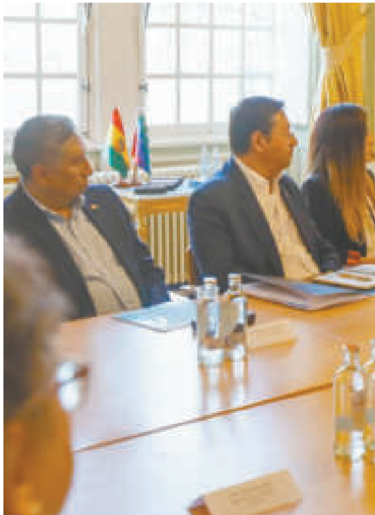
El canciller de Bolivia, Rogelio Mayta, junto a otros ministros de Relaciones Exteriores en la Primera Reunión del Grupo de Contacto del Consenso de Brasilia, en el marco de la UE-Celac.