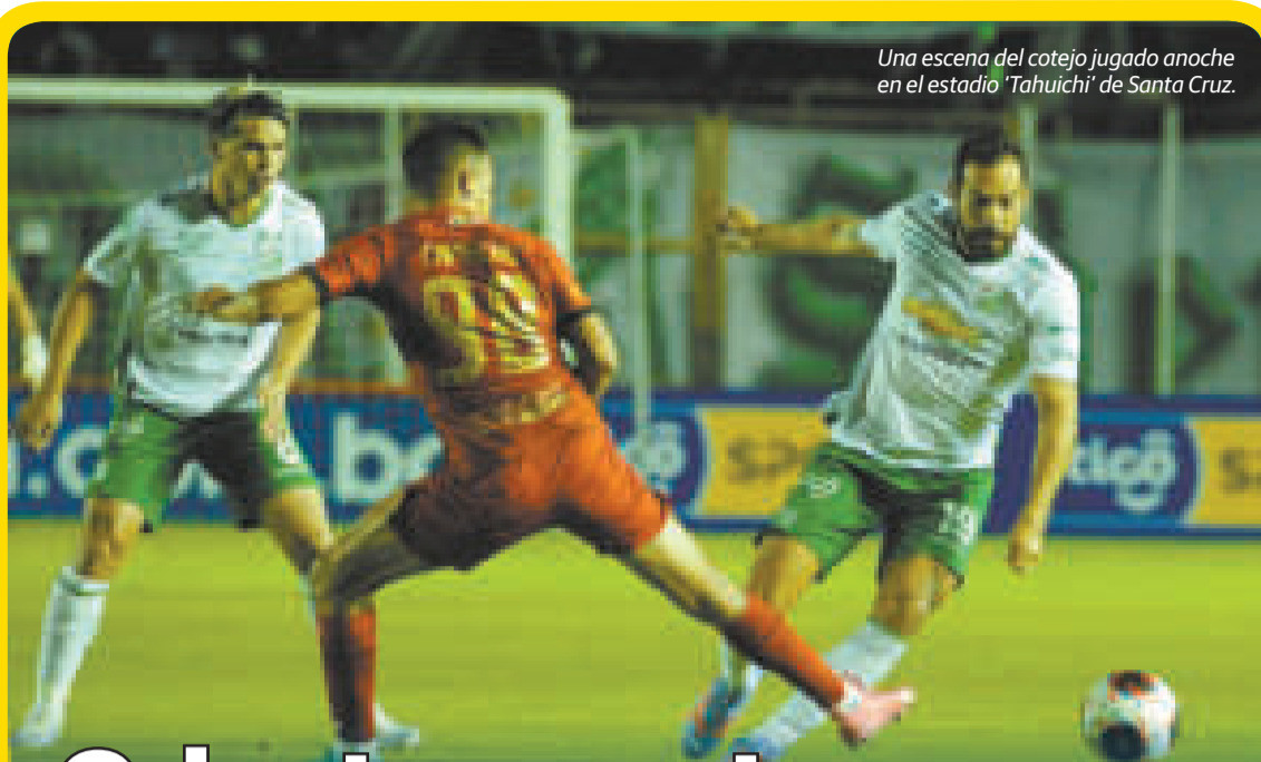
Una escena del cotejo jugado anoche en el estadio 'Tahuichi' de Santa Cruz.