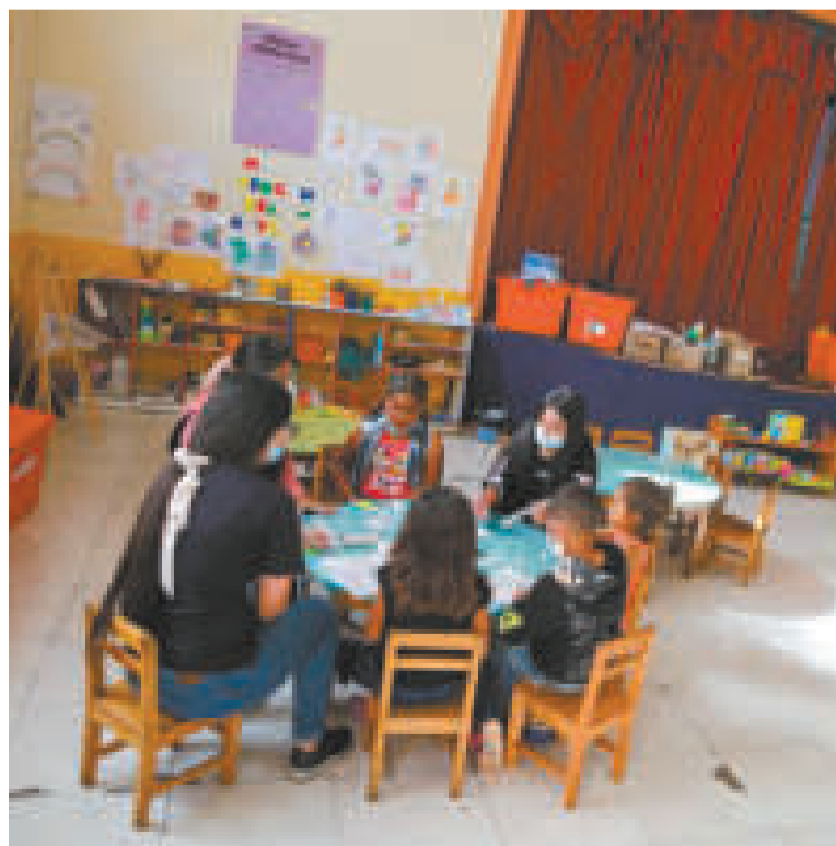
Niños en un centro de acogida de Chile.

Y 21 DE JULIO se llevará a cabo la Cumbre Iberoamericana de movilidad humana y derechos humanos.