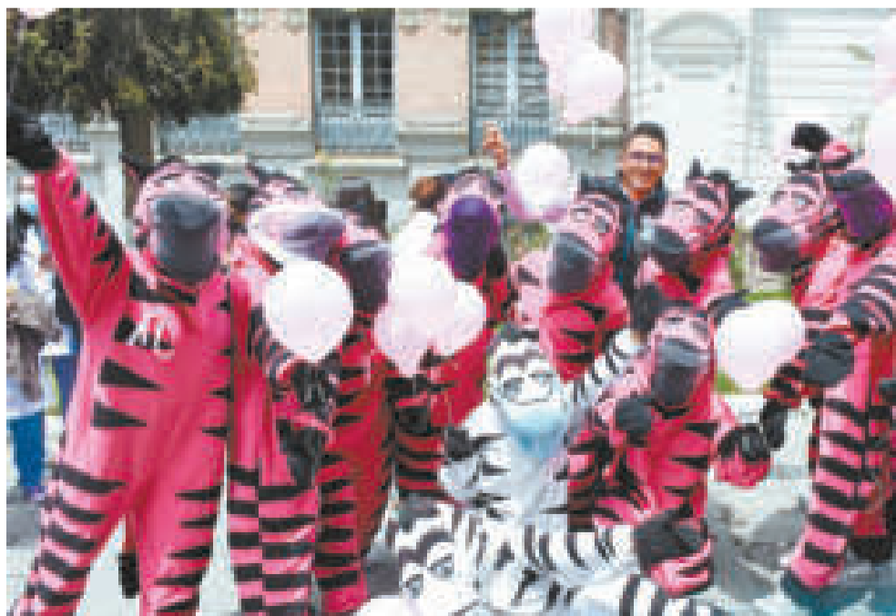
Las cebras, durante una conmemoración por el Día Internacional de Lucha contra el Cáncer de Mama.

El perjuicio no solo se restringe a la cantidad de buses que circulan por la ciudad, sino a la recaudación del servicio de La Paz Bus. En 2019, los PumaKatari llegaron a recaudar más de Bs 19 millones; sin embargo, desde 2021 —año en que Iván Arias asumió como alcalde— el dinero que entra a las arcas municipales anualmente por ese concepto no llega a Bs 9 millones. ▶