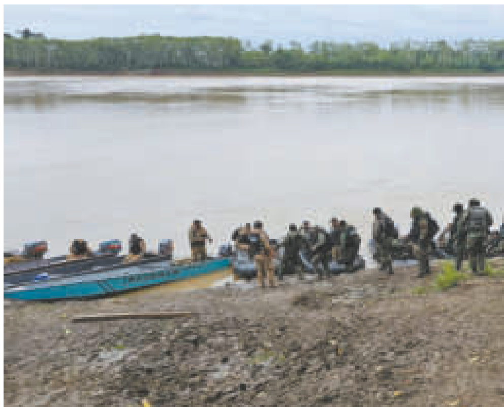
El pasado viernes, efectivos policiales realizaron un operativo para dar con las dragas ilegales.