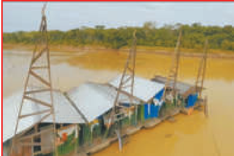
Dragas sin los permisos necesarios para operar.

Reiteró que ese elemento químico es dañino para la salud de la población, razón por la que los controles continuarán, a fin de preservar la salud de las personas que viven cerca de las zonas que se dedican a la minería.