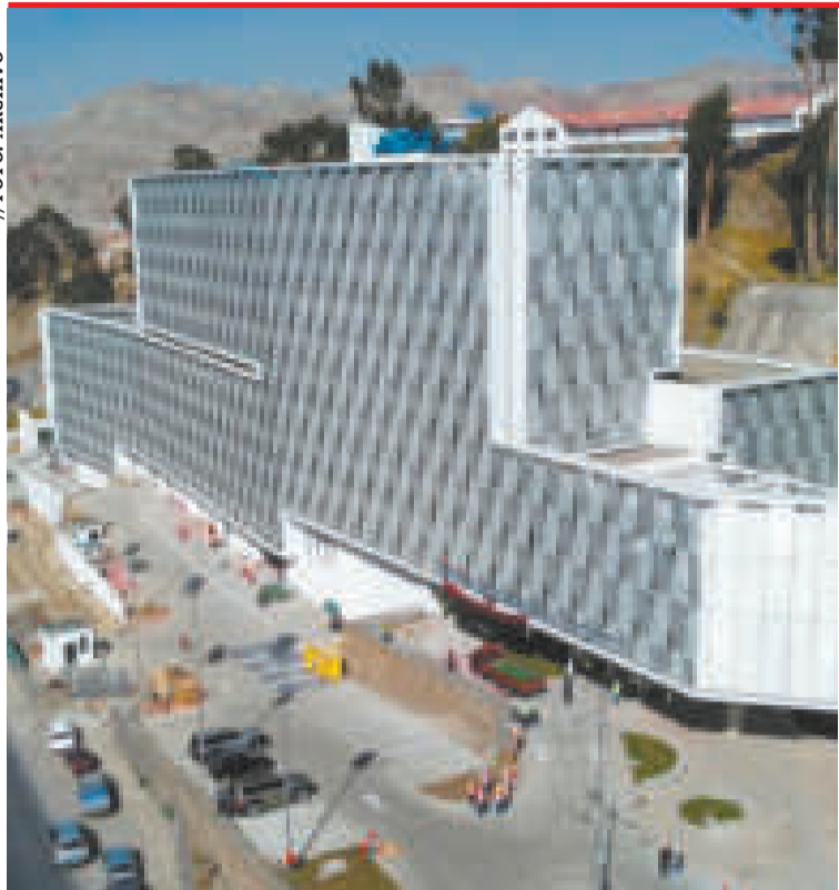
Frontis del Gastroenterológico en la zona de Miraflores.