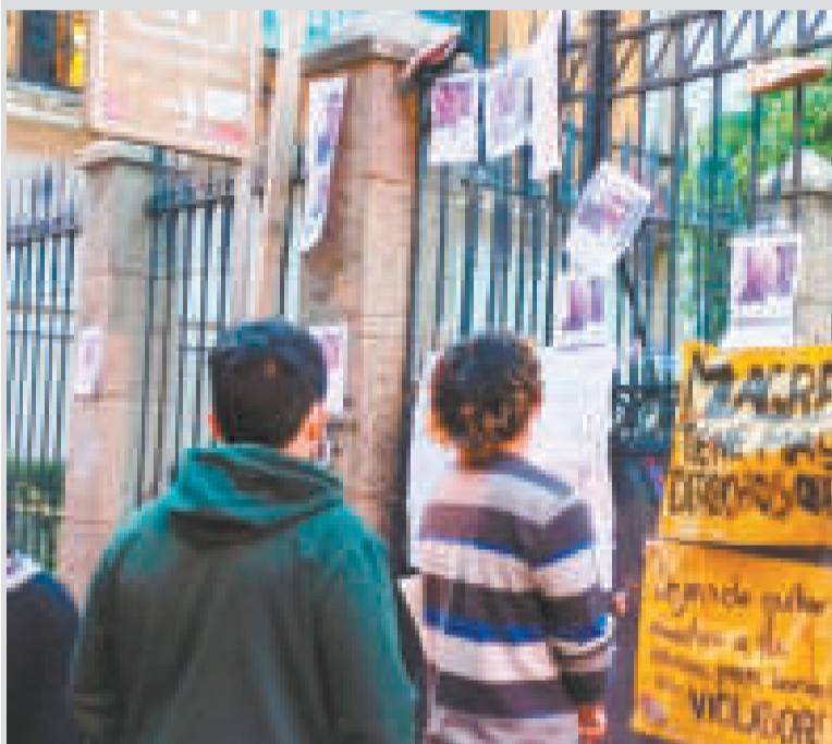
Protesta en la que se puso las fotografías de los religiosos pederastas y encubridores.