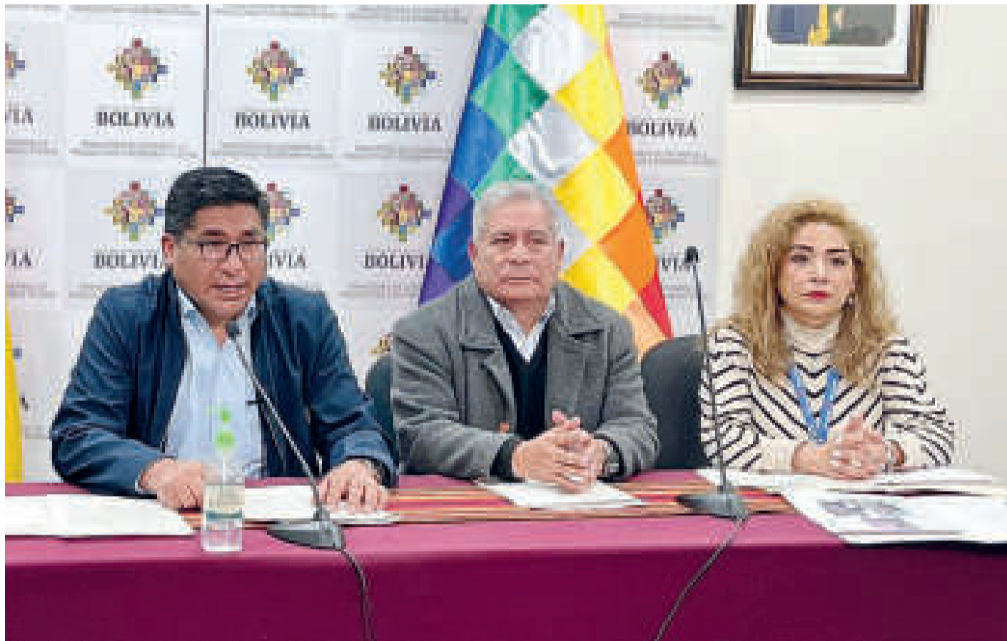
Autoridades de Desarrollo Productivo, de la Aduana y del Viceministerio de Lucha Contra el Contrabando.