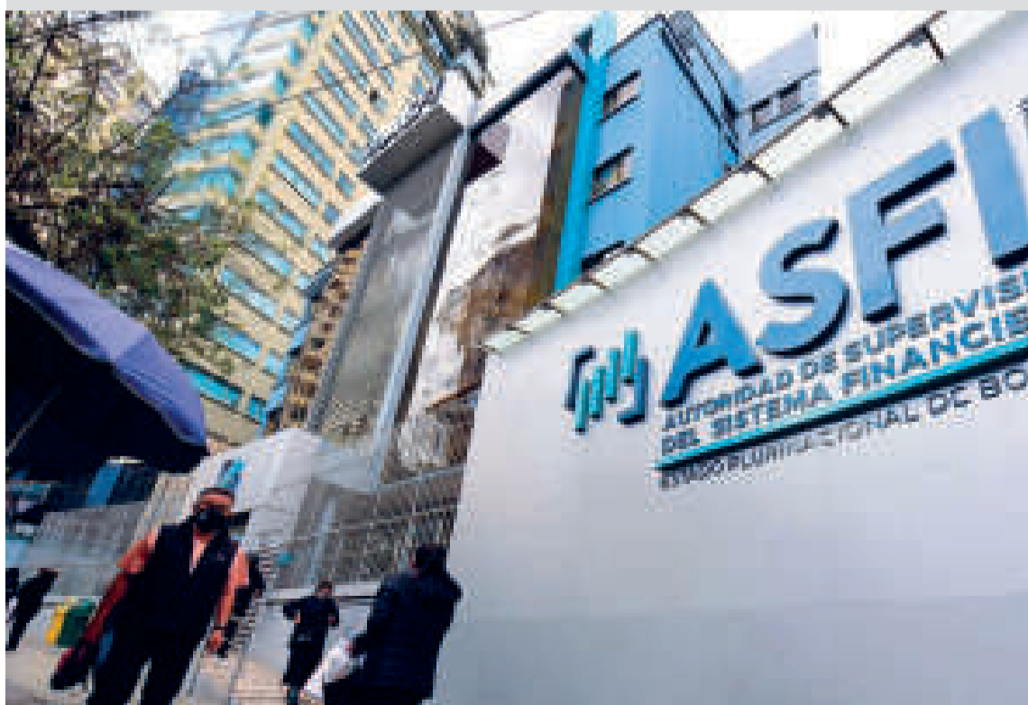
Instalaciones de la ASFI.

“Por lo tanto, no corresponde atribuirle a un fenómeno simplemente de una limitada tenencia de dólares en el país y menos a una falta de supervisión del órgano regulador. Hay que recordar que la ASFI desarrolla su trabajo de control y supervisión continuamente de forma permanente”, enfatizó.