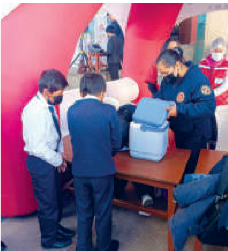
Personal de Salud inocula a niños en Potosí.