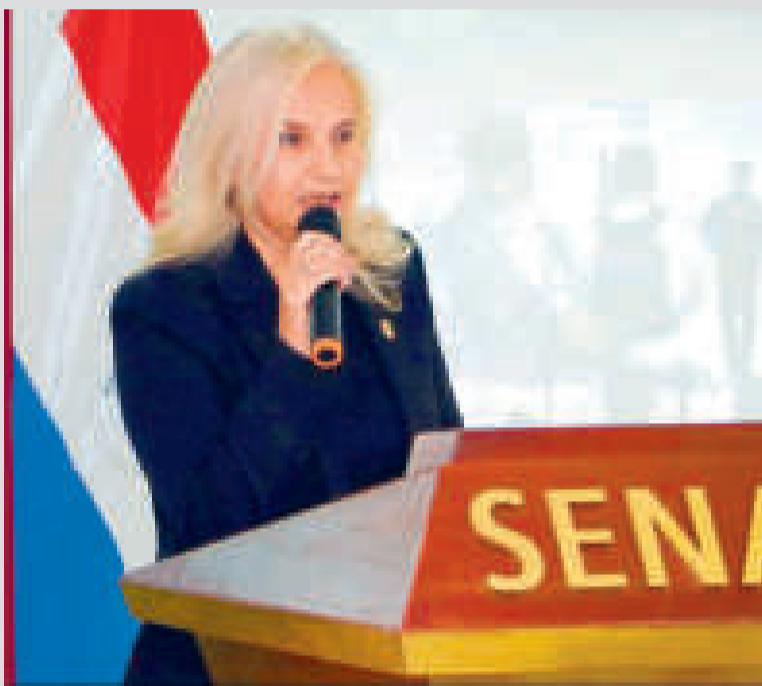
Zully Rolón, secretaria nacional antidrogas de Paraguay.