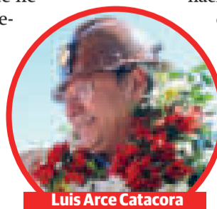
Luis Arce Catacora

El programa tiene el objetivo de contribuir a la reconstrucción económica del país, generando empleos directos e indirectos, dirigidos a población vulnerable (mujeres y jóvenes).