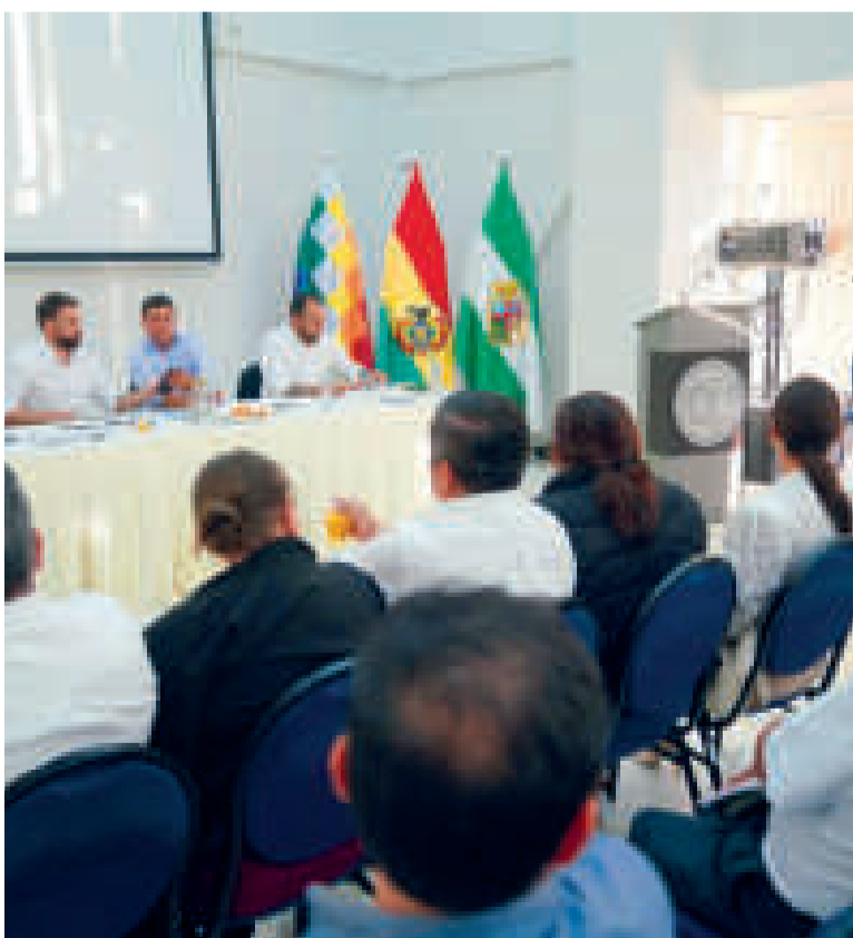
El ministro Eduardo Del Castillo junto a los alcaldes de Santa Cruz.