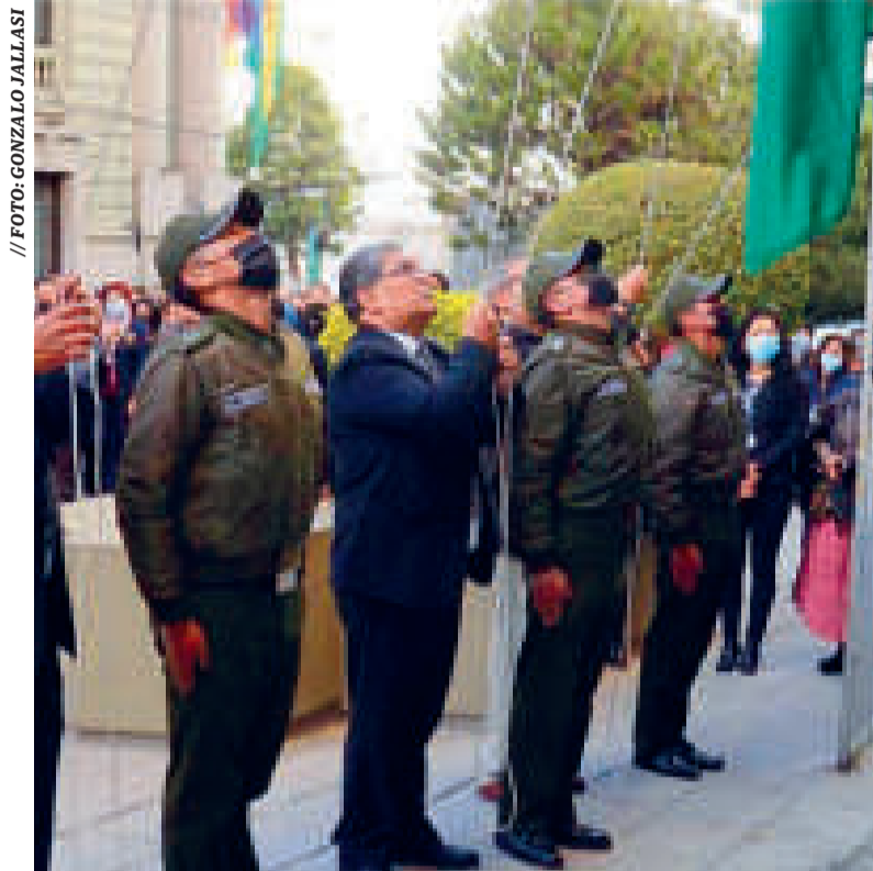
Acto de celebración del BCB.