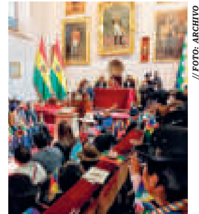
Los actos patrios en 2022.

Bolivia también cuenta con el apoyo de la UE, que, luego de la tercera Cumbre UE-Celac, anunció que invertirá 45 millones de euros en los países de América Latina y el Caribe en 67 áreas o iniciativas potenciales para reducir la pobreza y la desigualdad, impulsar la transición verde y justa, la transformación digital y energías renovables, proceso en el que está incluido el país.