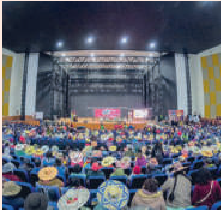
Celebración de los 57 años de Coipasa, Oruro.

Comunidad de Estados Latinoamericanos y Caribeños (Celac), el 17 y 18 de julio.