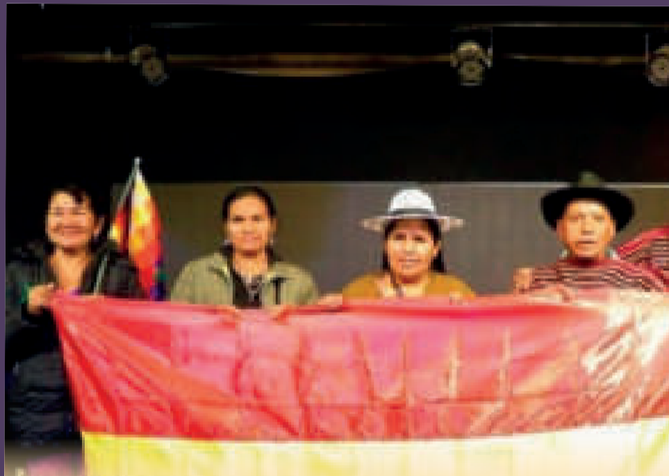
“RURAQ MAKI, NUESTRA HERENCIA HECHA A MANO”

Desde su creación en 2007, Ruraq Maki desarrolló diversas acciones que contribuyeron a la protección y promoción de la artesanía tradicional peruana y la región.