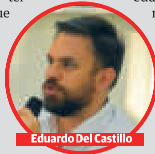
Eduardo Del Castillo