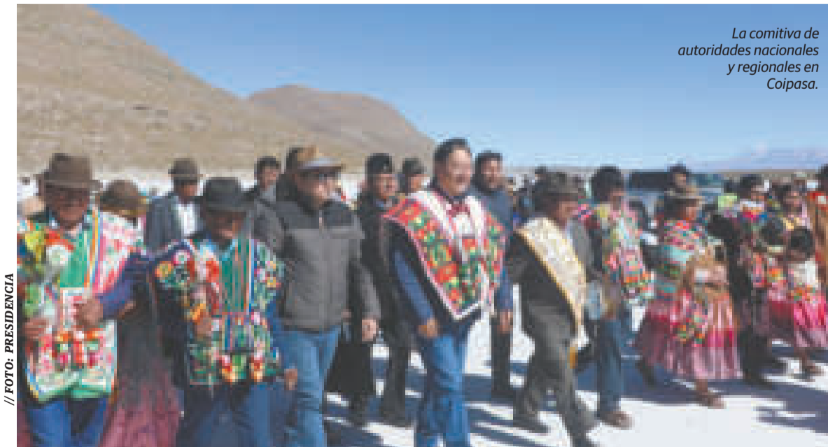
La comitiva de autoridades nacionales y regionales en Coipasa.

“Está dentro de los planes, nosotros tenemos que tener una carretera que conecte Coipasa con Sabaya y, por supuesto, la salida hacia