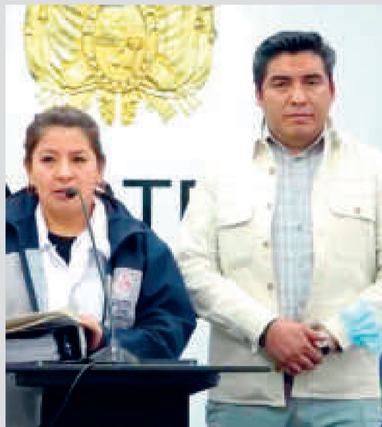
Conferencia de prensa de Régimen Penitenciario.