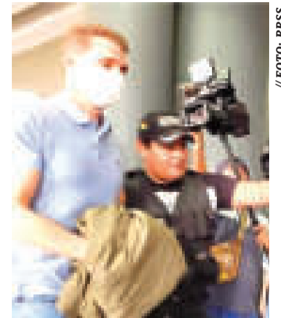
El exvicepresidente del intervenido Banco Fassil .

||||||||||||||||||||||||||||||||||||||||