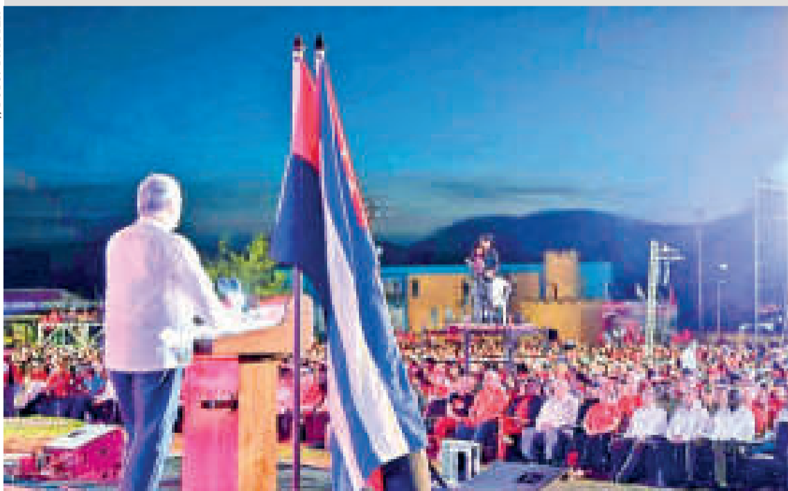
Díaz-Canel en el acto central por el aniversario 70 del asalto a los cuarteles Moncada y Carlos Manuel de Céspedes.