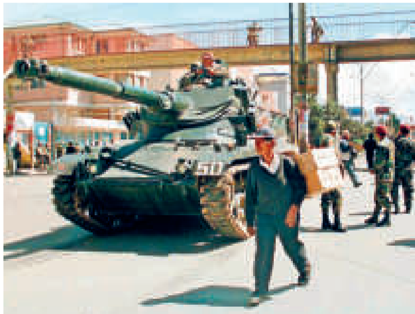
Imagen de la masacre de octubre de 2003.

La Dirección Regional Urbana del MAS-IPSP de Santa Cruz, cuya dirigencia se encuentra en La Paz, reconoce esta lucha no solo por lo que pasó en octubre de 2003, sino también porque El Alto combatió para la recuperación de la democracia en 2019 y con ello el retorno del MAS al Gobierno.