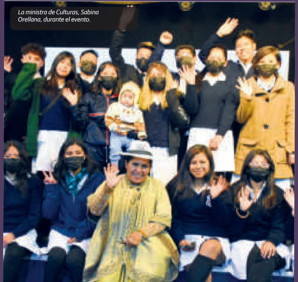
La ministra de Culturas, Sabina Orellana, durante el evento.

El tercer concurso está destinado a los gestores culturales y se denomina Latidos Urbanos. Podrán participar artistas, organizaciones, instituciones y colectivos, con proyectos creativos que reflexionen sobre la construcción de una cultura de la vida, que conecte diferentes generaciones y revalorice la construcción plural y diversa de las identidades. Las convocatorias están en la página web de esta cartera de Estado.