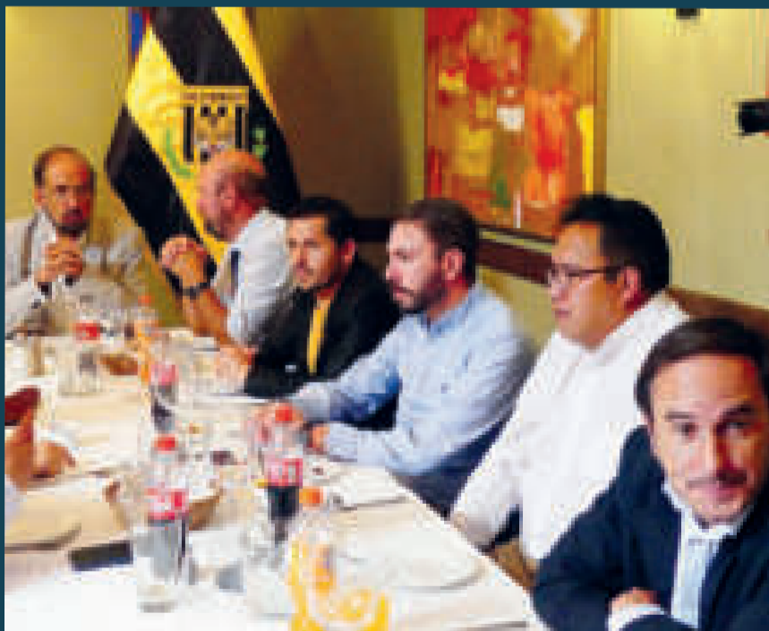
Directivos bolivarianos y stronguistas en el almuerzo de confraternidad.