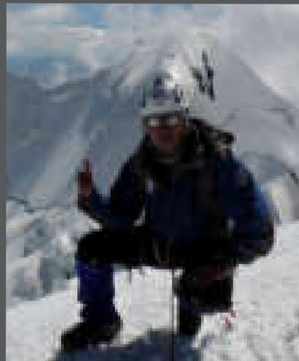
Ayaviri hizo su quinta cumbre de '14ochomiles'

Las nueve montañas que le faltan de los '14 ochomiles' son el Everest (China y Nepal 8.848), el Kanchenjunga (India/Nepal, 8.586), el Lhotse (China/Nepal, 8.516), el Makalu (China/Nepal, 8.463), el Cho Oyu (China/Nepal, 8.201), el Dhaulagiri (Nepal, 8.167), el Manaslu (Nepal, 8.163), el Annapurna (Nepal, 8.091) y el Shisha