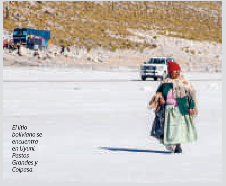
El litio boliviano se encuentra en Uyuni, Pastos Grandes y Coipasa.

También alertó de que hay varios países que tienen sus ojos puestos en el litio de Bolivia. “Estados Unidos lo ha expresado incluso a través del Comando Sur”, indicó Prada.