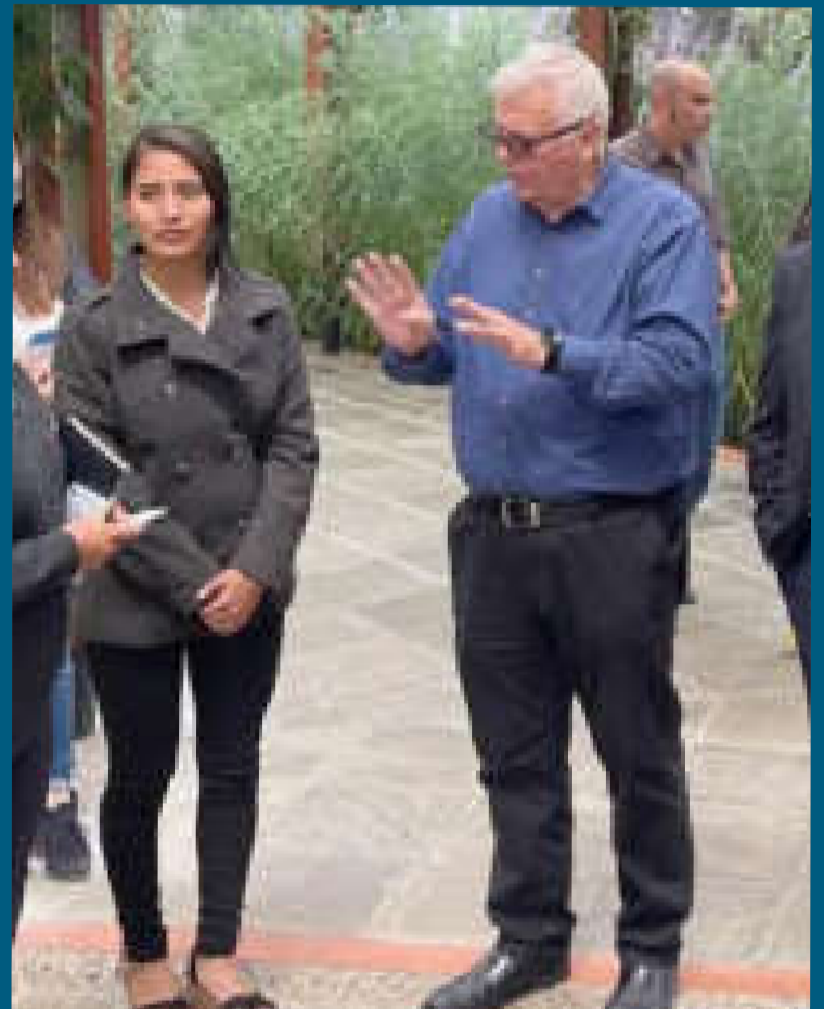
La viceministra Veizaga con el presidente de la FIR, Osvaldo Maggi.

El Gobierno reafirma su compromiso de seguir impulsando el deporte en todas sus manifestaciones y continuar siendo anfitrión de eventos de relevancia mundial.