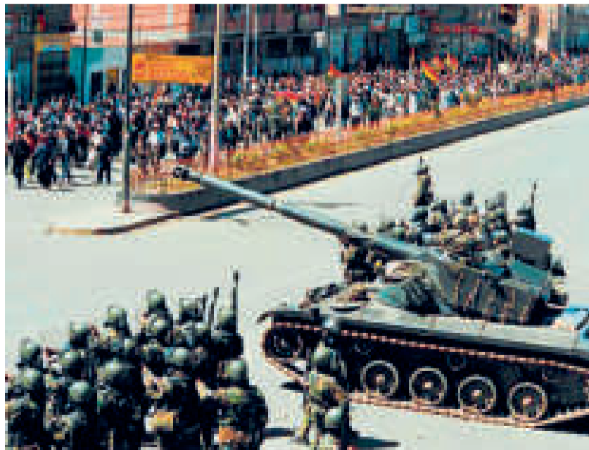
La amenaza de tanques contra el pueblo alteño.