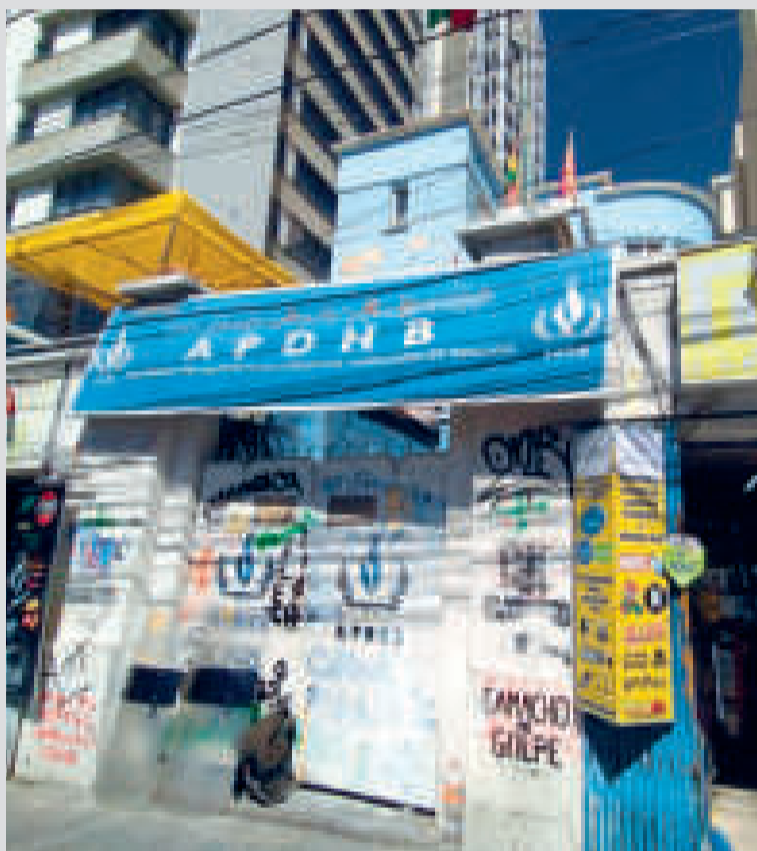
Puertas de las oficinas de la Asamblea Permanente de Derechos Humanos de Bolivia.