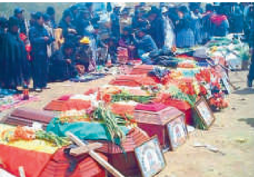
Los caídos de octubre de 2003.