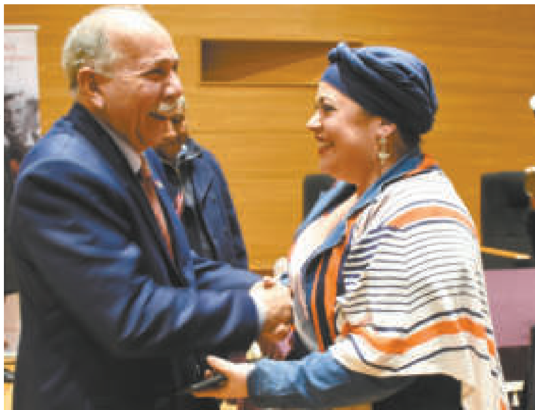
La Ministra de la Presidencia saluda al Embajador de Cuba en Bolivia.