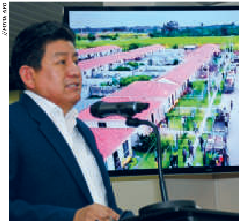
El ministro de Obras Públicas, Édgar Montaño, en conferencia de prensa, ayer.