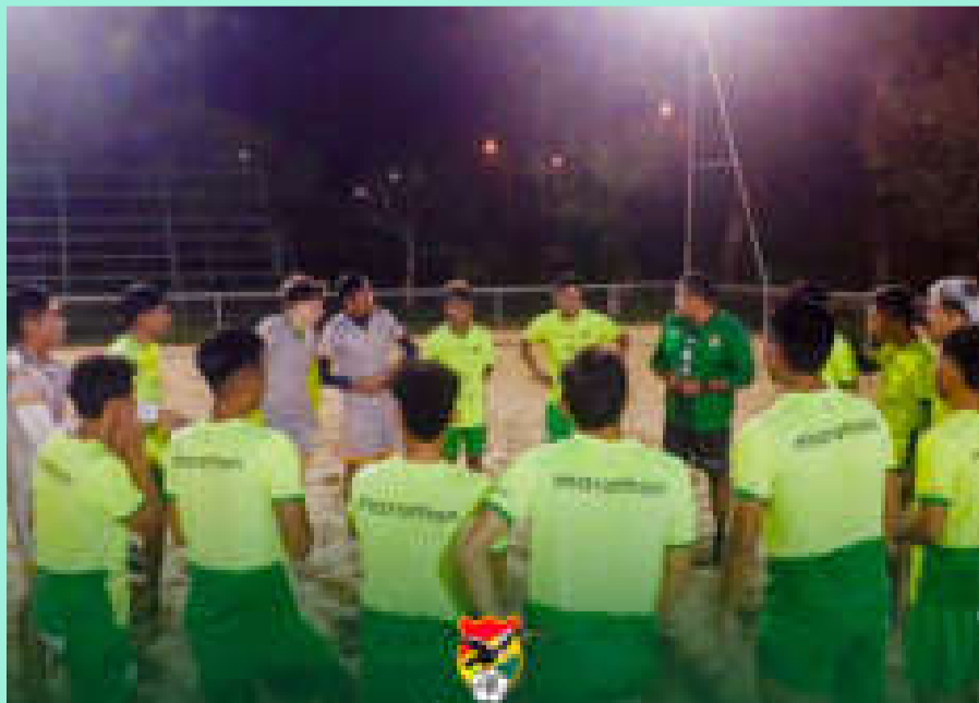
Jugadores juveniles concentrados en Pando.