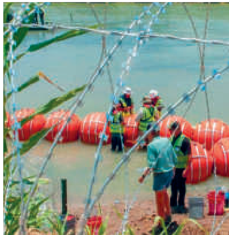
Las boyas en las fronteras acuáticas.

Al referirse a la trascendencia del 26 de julio de 1953, destacó que “las acciones de ese día fueron el principio del fin de la última dictadura instalada en Cuba con el reconocimiento y el apoyo inmoral y material de los EEUU”.