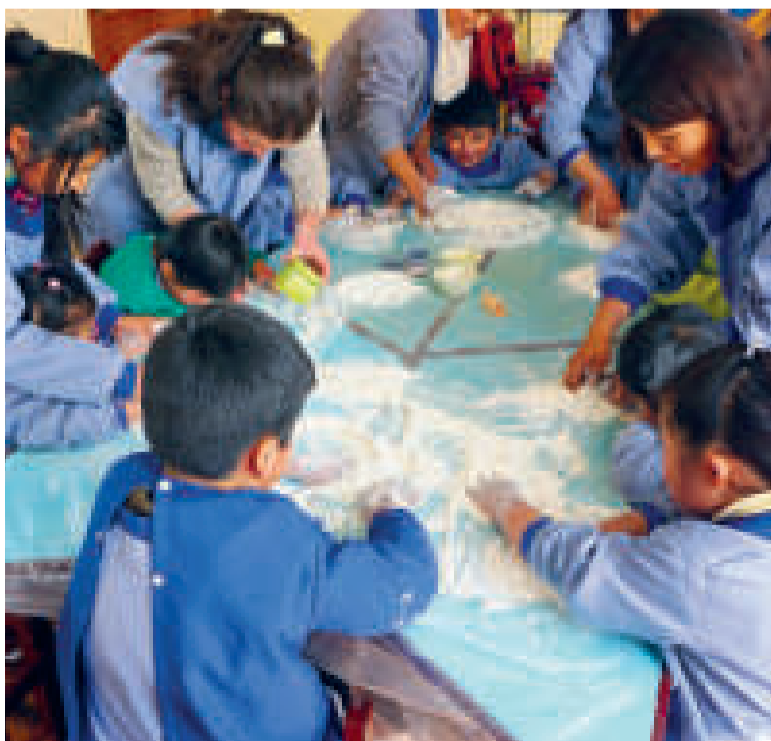
Niños con discapacidad deben tener atención especial para desarrollarse.