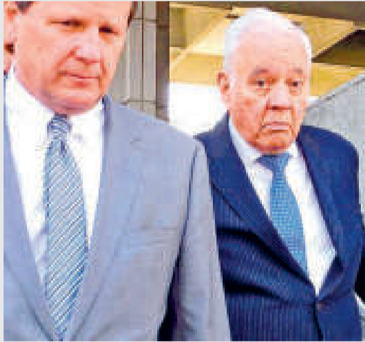
El expresidente Gonzalo Sánchez de Lozada .

“Hemos señalado audiencia para el próximo martes (8 de agosto), en el que se iniciará el desarrollo del juicio oral; estamos a la espera de que se realicen todas las diligencias mediante las comisiones respectivas para las notificaciones y que todas las partes tengan conocimiento de este juicio oral”, sostuvo.