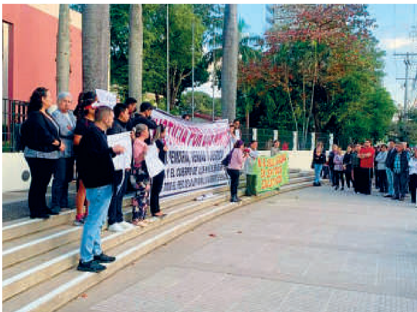
Padres de familia protestaron en las puertas del colegio Alemán, en Santa Cruz, en rechazo a las agresiones sexuales que se registraron.

La Viceministra de Igualdad de Oportunidades indicó que desde el 12 de junio el centro educativo privado ya tenía conocimiento del hecho.