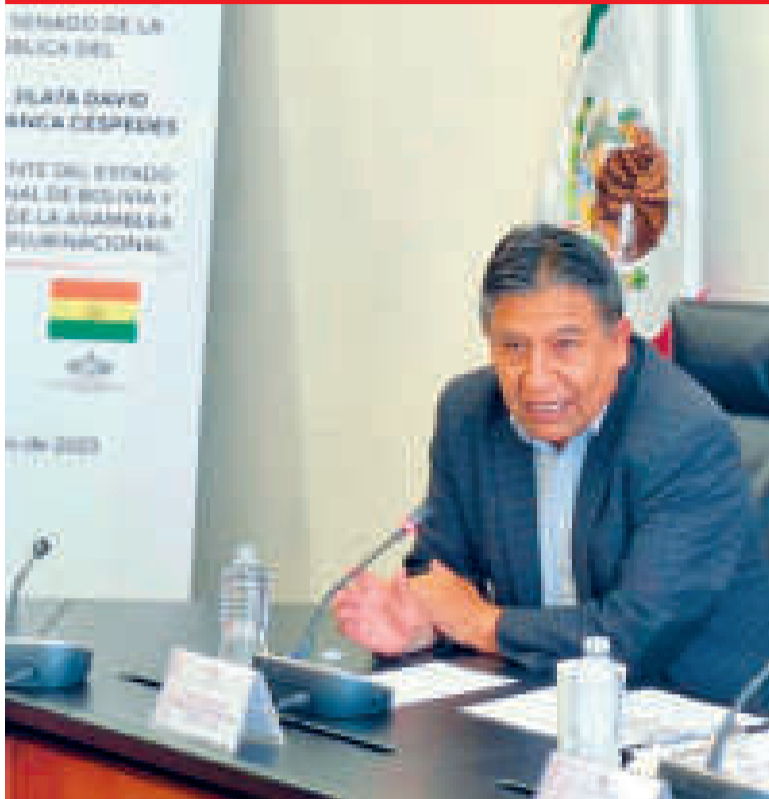
David Choquehuanca, vicepresidente de Bolivia.