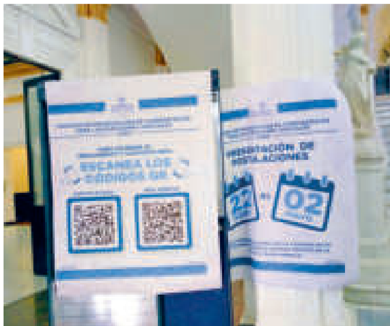
La convocatoria de postulantes fue paralizada en abril.

El senador Luis Adolfo Flores detalló que el Legislativo solo tiene 20 días para la preselección y 10 días para la postulación de candidatos.