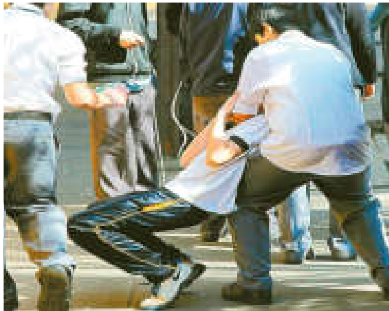
Representación de la violencia dentro de una unidad educativa.

“La Defensoría del Pueblo hace el seguimiento de las investigaciones con el fin de garantizar el acceso a la justicia, evitar la retención de justicia y que se cumpla con el debido proceso, según requiera cada caso”, indica el protocolo de atención de la Defensoría.