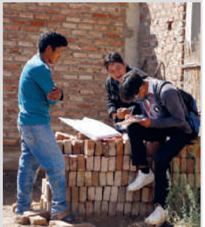
Censistas acudieron a comunidades lejanas de Capinota.

La prueba reveló que Bolivia tiene muchas diferencias entre las áreas urbanas y rurales. “Una Bolivia está en la ciudad, posee niveles de infraestructura civil bastante apropiadas y comunicación, pero la Bolivia rural, en muchos casos, no posee acceso a internet y “es donde se dificulta la comunicación y la realización del proceso censal”, manifestó Arandia.