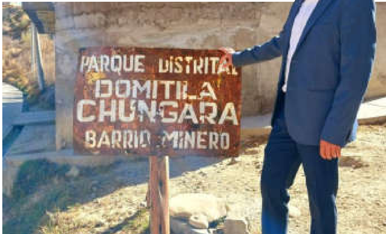
El letrero deteriorado que anuncia la entrada del parque.