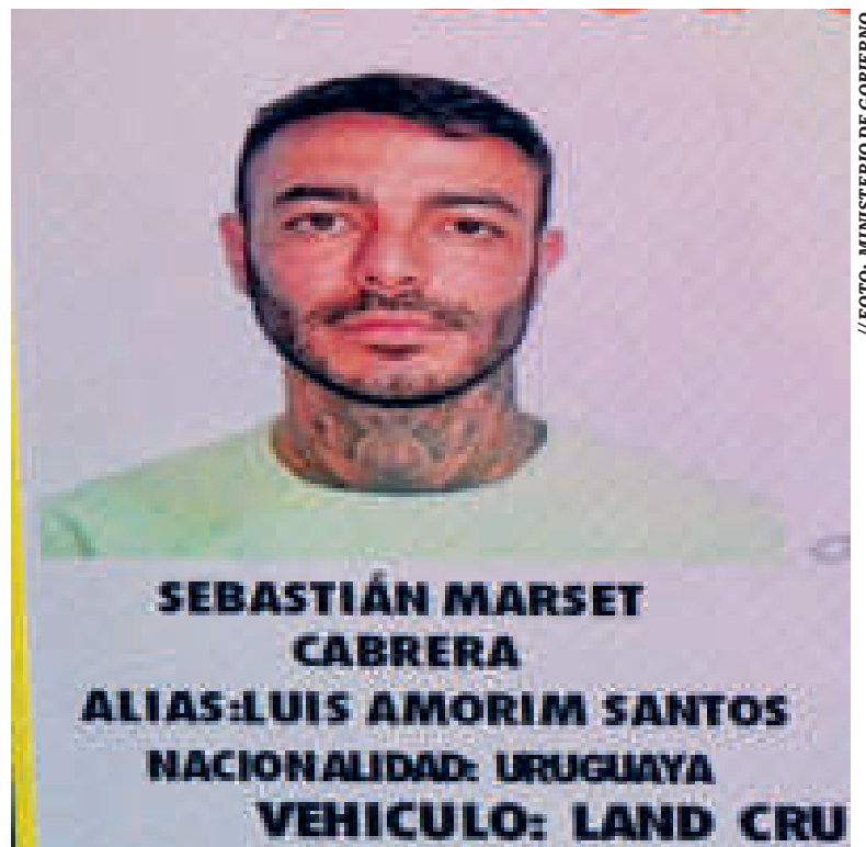
El narcotraficante uruguayo que es buscado por la Policía.

habría ingresado al país ese año y se instaló en el departamento de Santa Cruz.