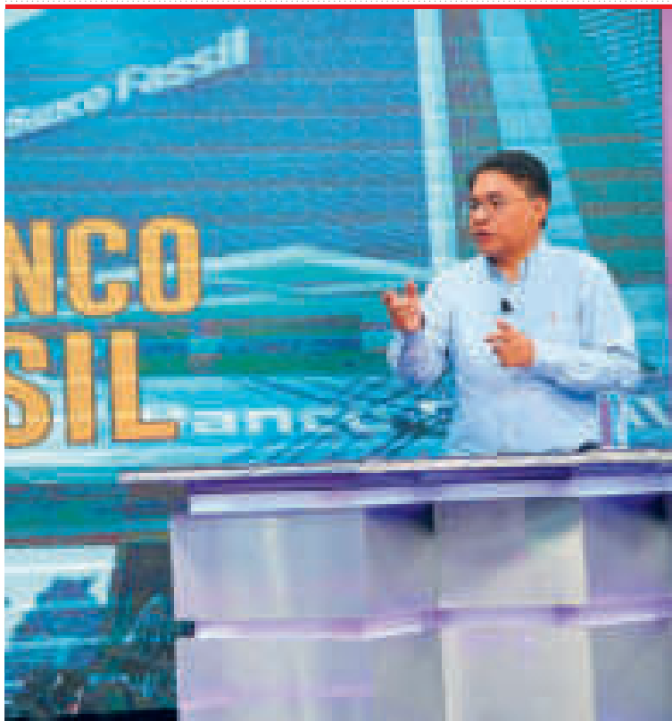
El titular de Justicia, Iván Lima, en entrevista con 'Las 7 en el 7'.