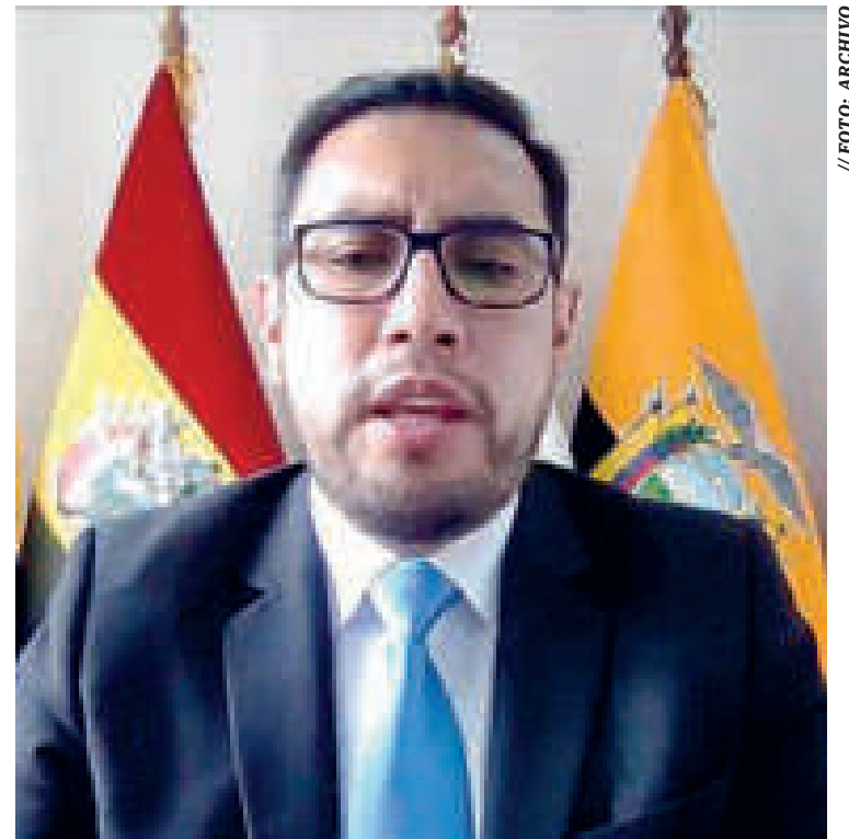
El magistrado boliviano en el Tribunal de Justicia de la CAN, Gustavo García Brito.

Sostuvo que la posición como Gobierno nacional en la temática es de respeto a las determinaciones que asuma el tribunal “siempre y cuando estas estén en el marco de un debido proceso”.