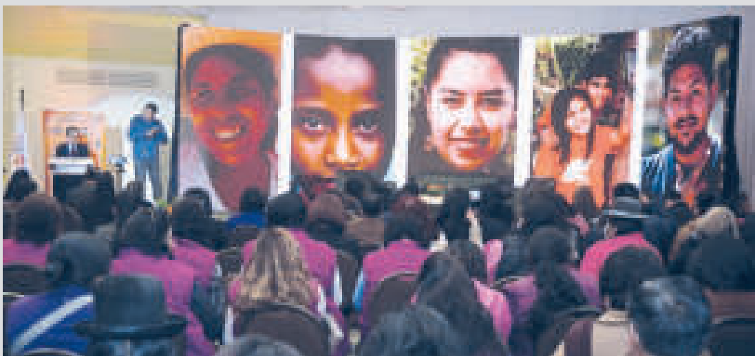
La asistencia en el informe del UNFPA.

deseaban ser madres al momento en que tuvieron su hija/hijo. En tanto que tres de cada 10 mujeres hubieran preferido posponer la maternidad para más adelante. Dos de cada 10 manifestaron que no querían ser madres, según datos del INE a 2016.