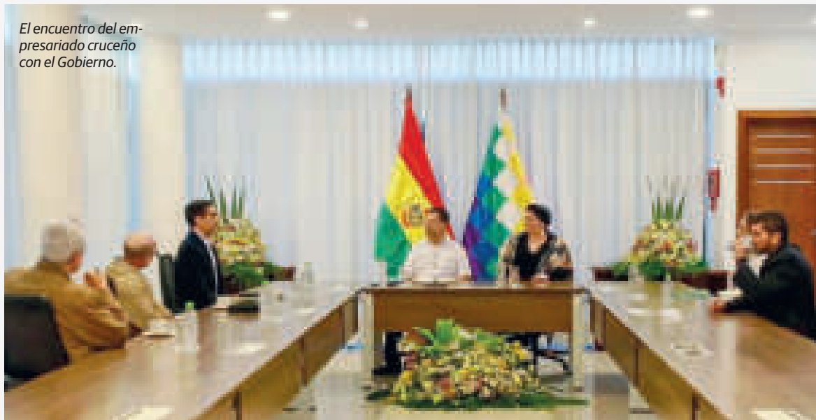
El encuentro del empresariado cruceño con el Gobierno.

Prada detalló que los empresarios cruceños plantearon la seguridad alimentaria, energética, lucha contra el contrabando, diversificar la economía y la industria forestal, entre otros temas de interés que se abordarán con los diferentes ministerios.