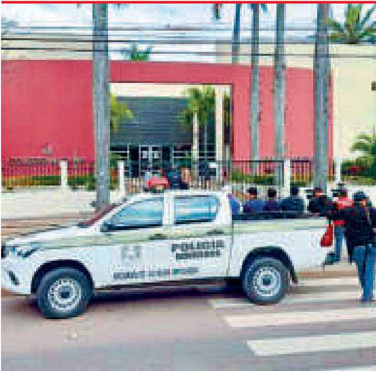
Una patrulla frente al colegio Alemán en Santa Cruz.