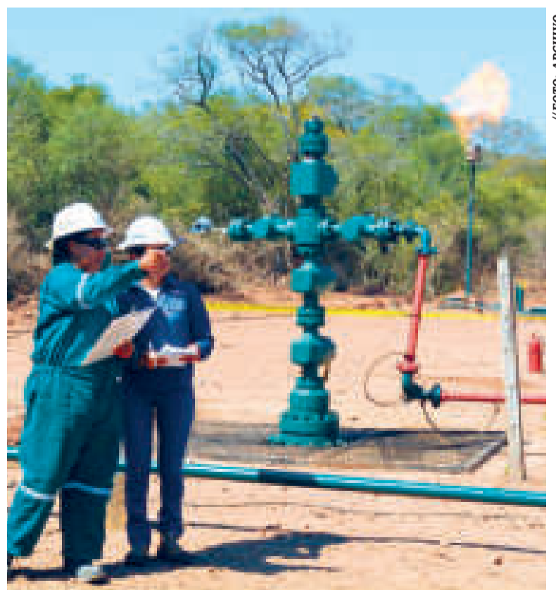
El pozo Remanso-X1, en Santa Cruz.

Michel ratificó también los datos respecto al pozo Yarará-X2, ubicado en el municipio de Yapacaní, que actualmente se encuentra en etapa de prueba de producción, e incrementará la obtención de petróleo en más de 700 barriles por día.