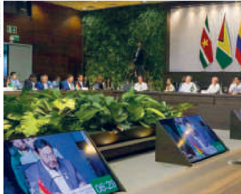
La Cumbre Amazónica, en Brasil.