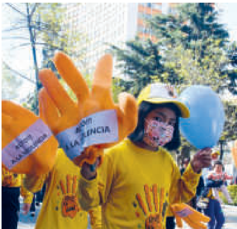
Niños recorren las calles paceñas para visibilizar la lucha contra la violencia.

La marcha se desarrollará en el marco del Día Nacional de So-