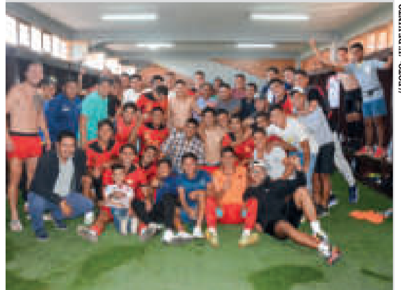
La alegría de los jugadores de Universitario después de la victoria.