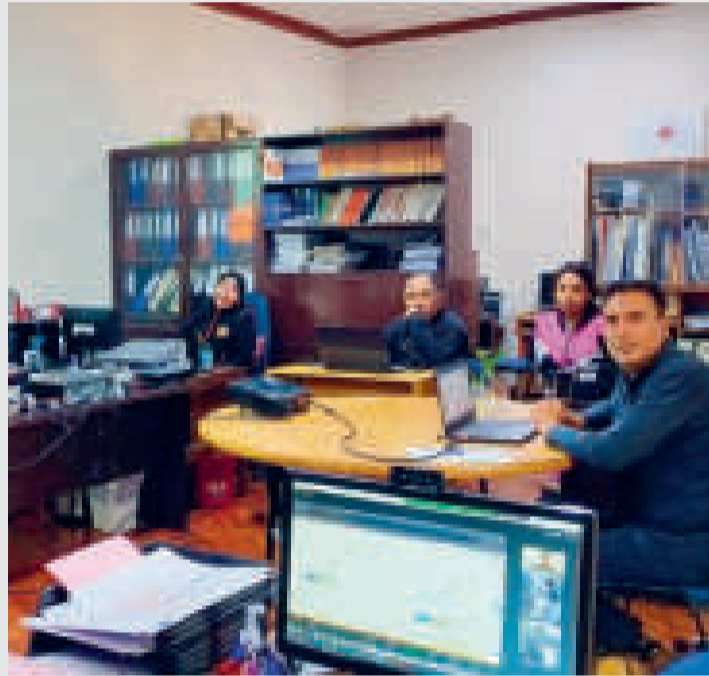
Los trabajadores públicos de la Fiscalía.

esta manera la actualización del equipo de profesionales, la adecuada organización de la información contenida en los documentos y una correcta gestión documental”, dijo Serrano según nota de prensa.