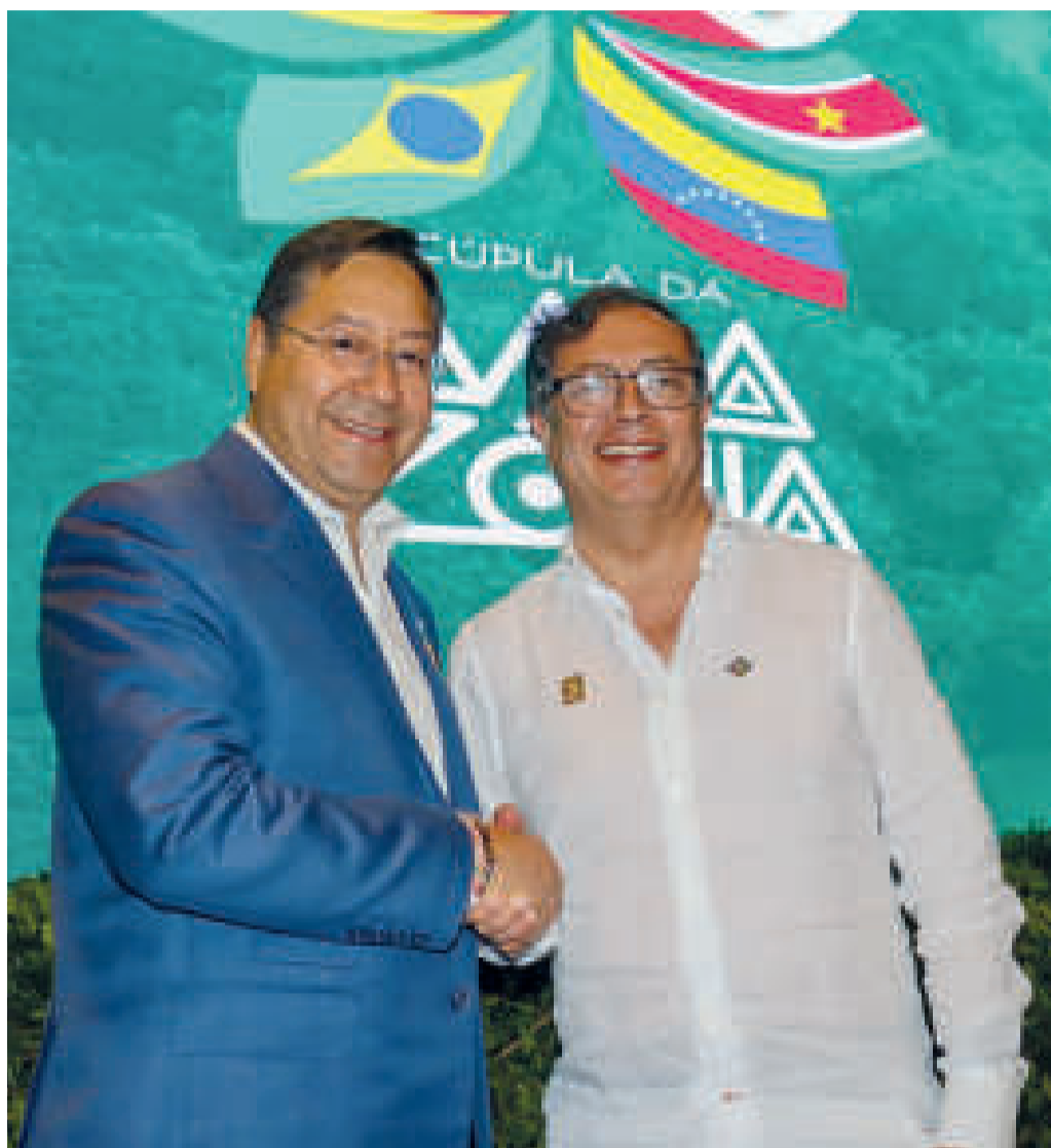
El mandatario de Colombia, Gustavo Petro, y el presidente Luis Arce.