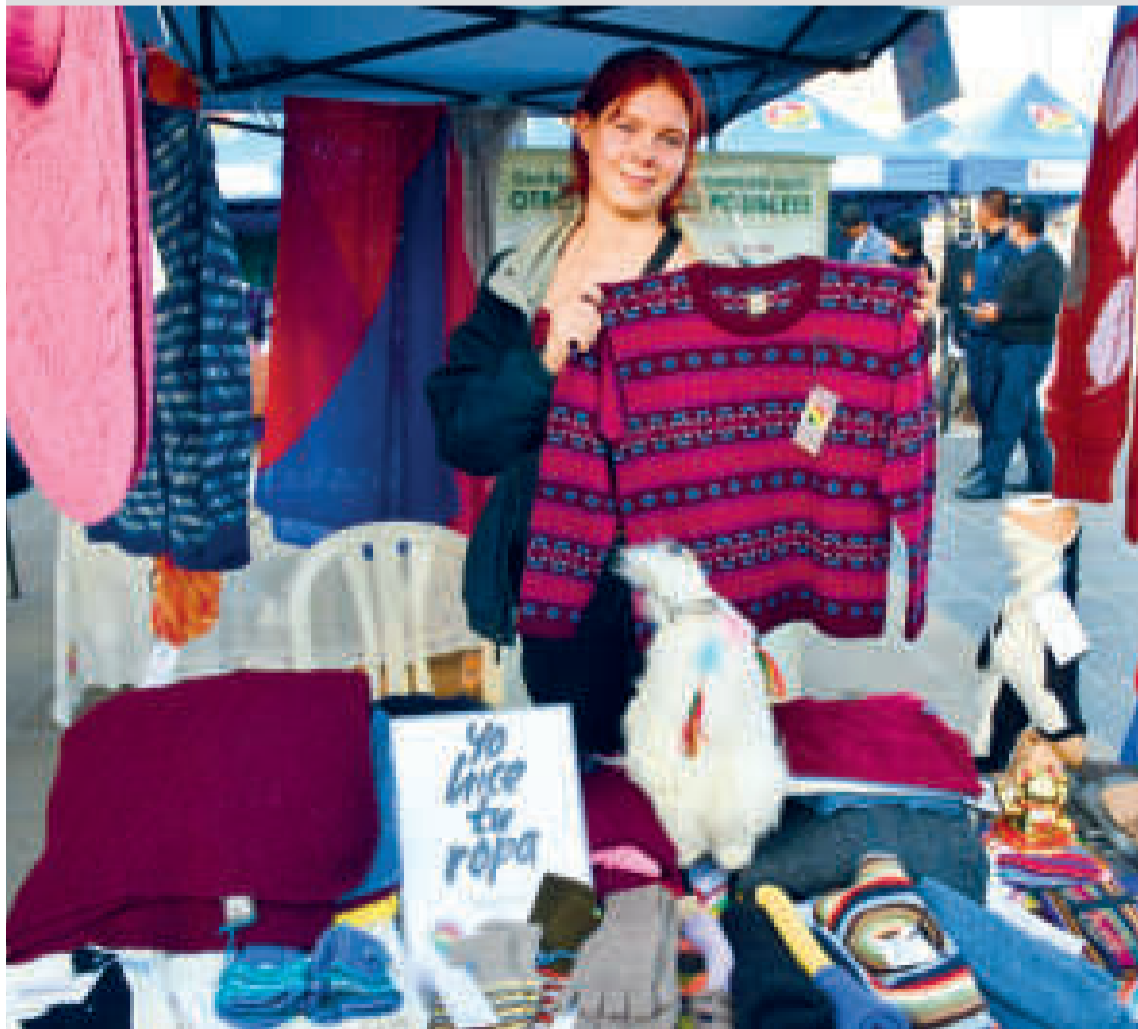
Se fortalece la producción nacional con la baja de importaciones.