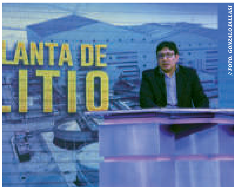
El ministro de Hidrocarburos y Energías, Franklin Molina.

“YLB (Yacimientos de Litio Bolivianos) está en una etapa de arranque de la planta y para ello lógicamente hay algunas actividades muy importantes que significan que todos los equipos que están recibidos provisionalmente pueden entrar en operación y en cargas. Nos referimos a insumos, ma-