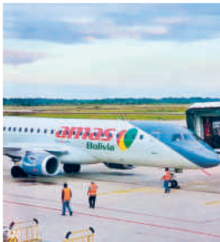
Uno de los aviones que opera Amazonas.

Aclaró que el Estado no quitó el certificado aéreo a Amazonas, por lo tanto puede seguir operando.