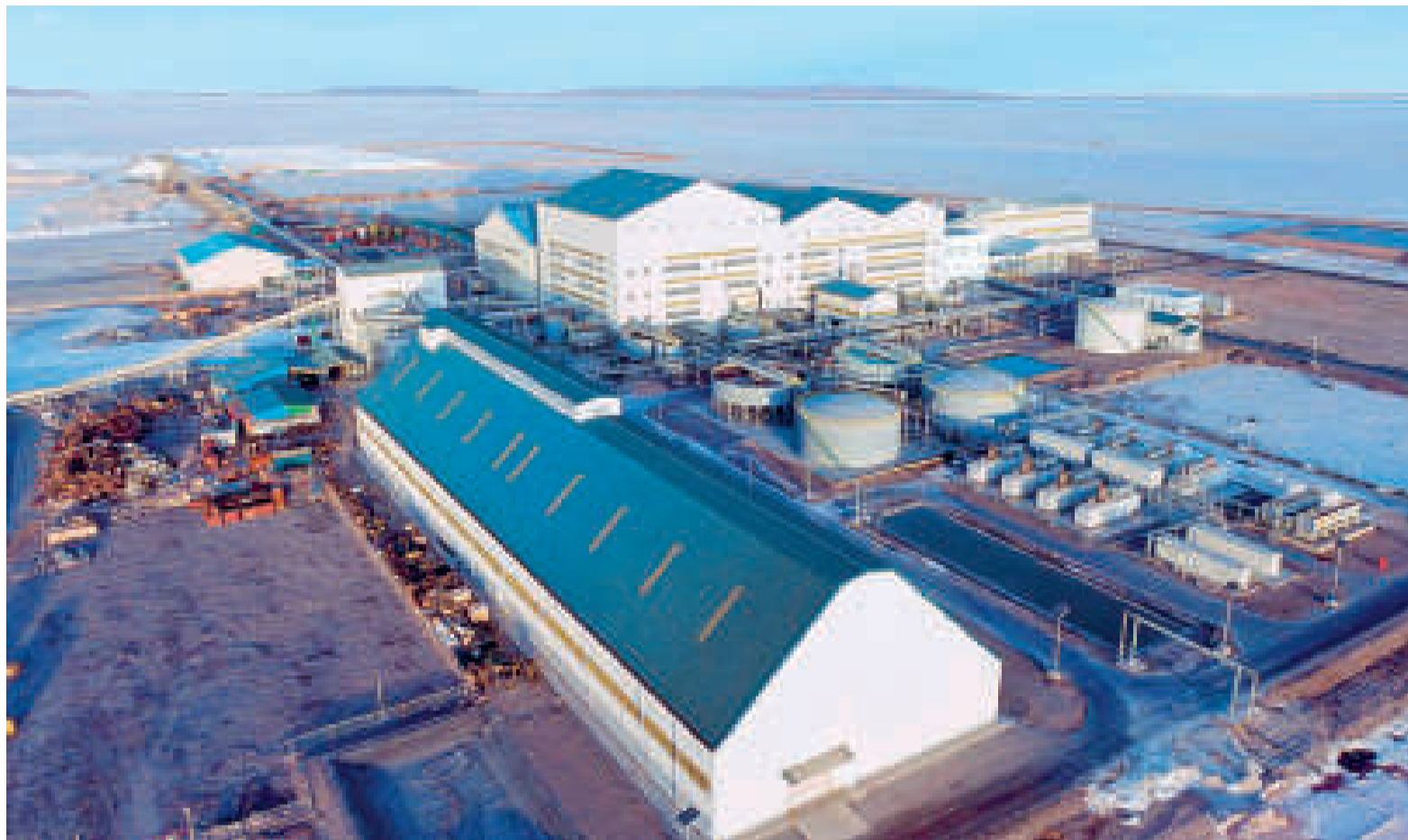
El complejo industrial producirá carbonato en grado batería.