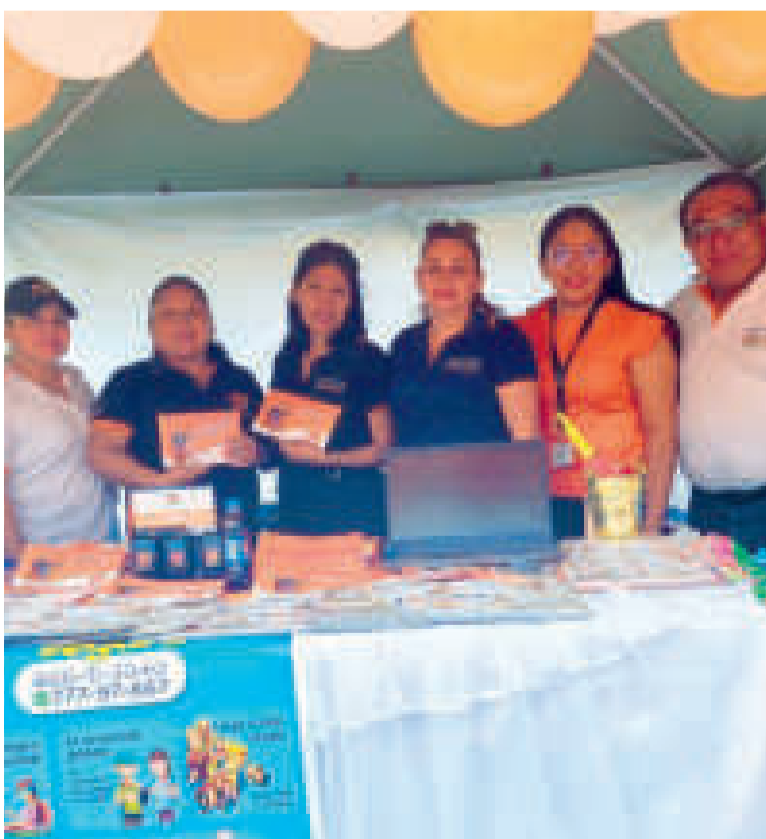
Servidores públicos de la Fiscalía Departamental de Santa Cruz.

La Feria Interinstitucional se desarrolló en los barrios Roca y Coronado de la capital cruceña y contó con la participación de instituciones como la Policía Boliviana, el Servicio General de Identificación Personal, el Servicio de Registro Cívico, la Delegación Defensorial Departamental del Pueblo y el Ministerio Público.