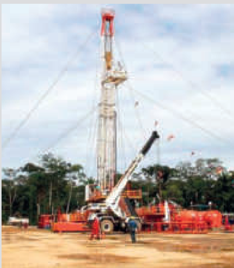
El proyecto Churumas está ubicado en Tarija.