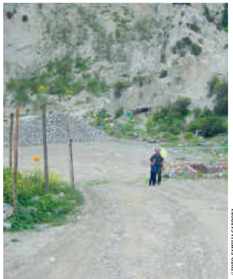
Mario Cardona, hace más de 10 años, en su terreno.