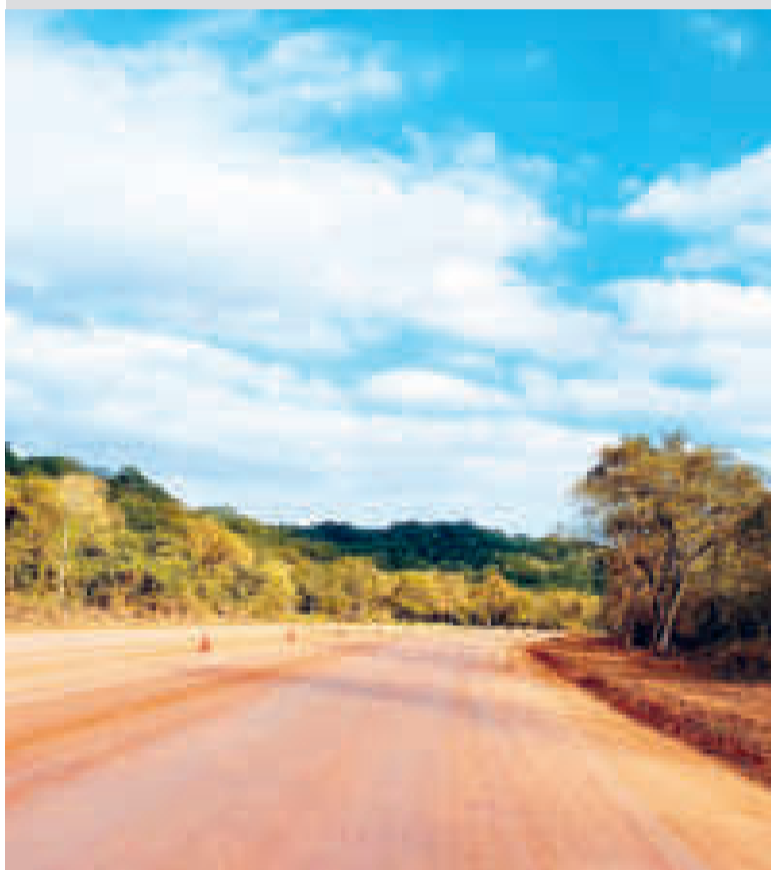
La carretera Buena Vista-Las Cruces, en Santa Cruz.