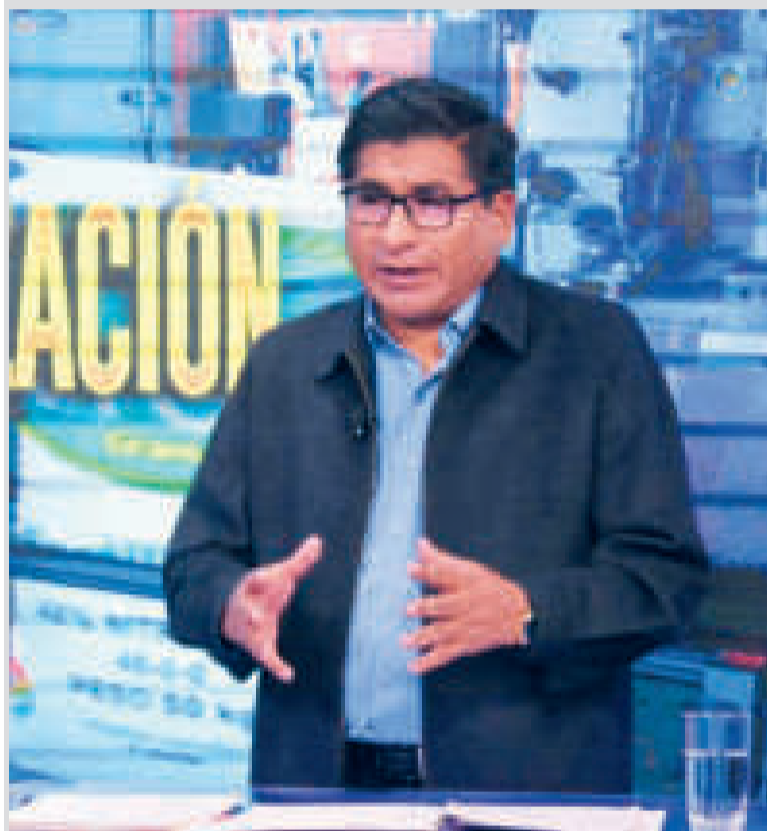
El ministro de Desarrollo Productivo y Economía Plural, Néstor Huanca.