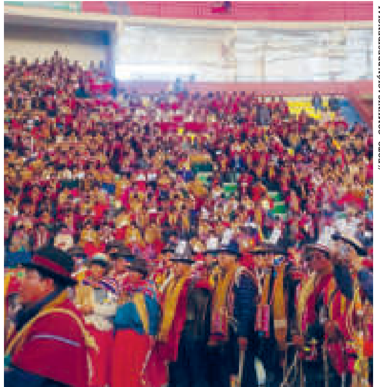
Representantes nacionales en la inauguración del congreso.

La flamante autoridad campesina y otros candidatos terciaron en la elección que se desarrolló en el coliseo Héroes de Octubre de la ciudad de El Alto.