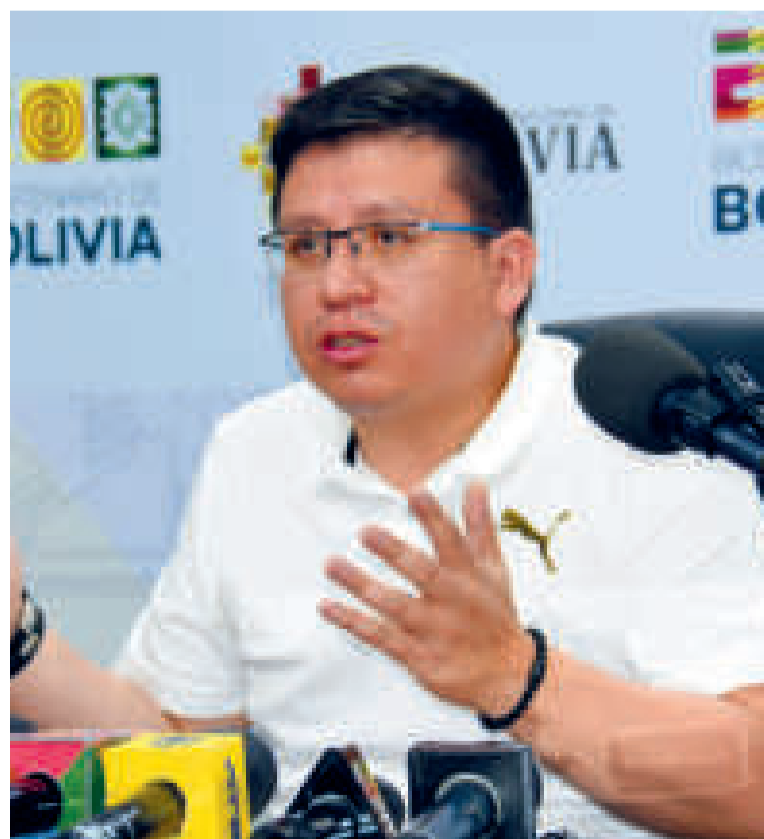
El ministro de Planificación del Desarrollo, Sergio Cusicanqui.

Explicó que el Modelo Económico Social Comunitario Productivo, a través de la inclusión como motor del crecimiento de la demanda interna, "está apuntalando" al retorno a la senda del crecimiento económico, "y es a partir de este motor que estamos logrando mantener este crecimiento económico positivo".