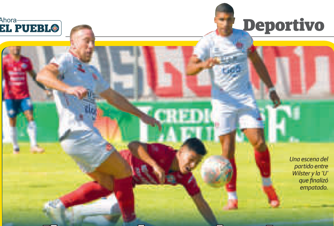
Una escena del partido entre Wilster y la 'U' que finalizó empatado.