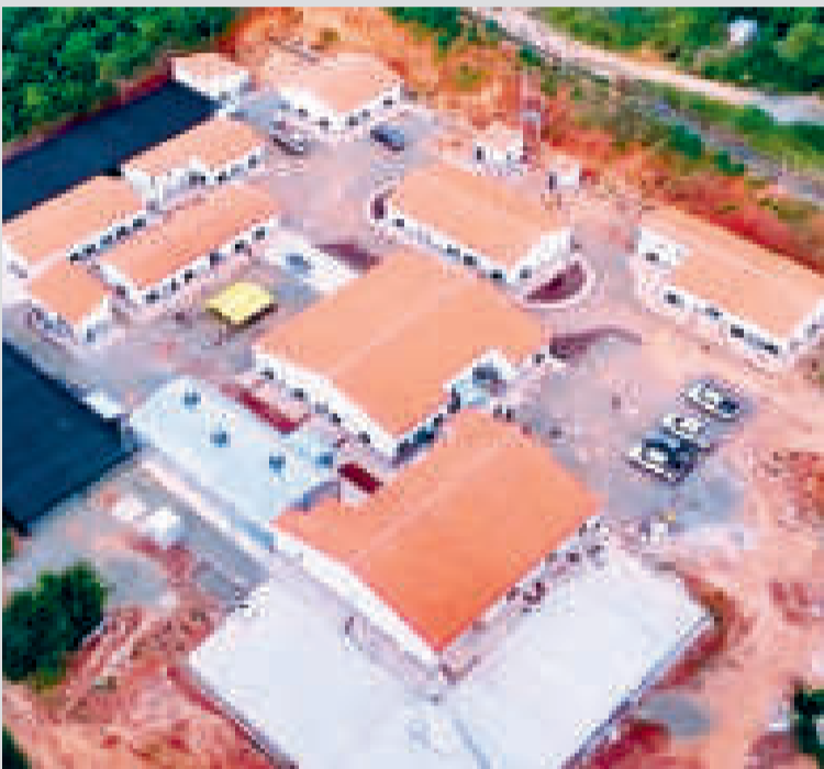
El emplazamiento del Centro del Cacao en el municipio de Palos Blancos.