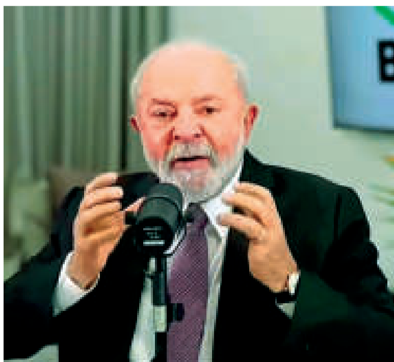
El Primer Mandatario brasileño en la Cumbre del Brics.

El bloque se proyecta como una alternativa geopolítica a un orden mundial liderado por Estados Unidos, posicionándose como representante del Sur Global.