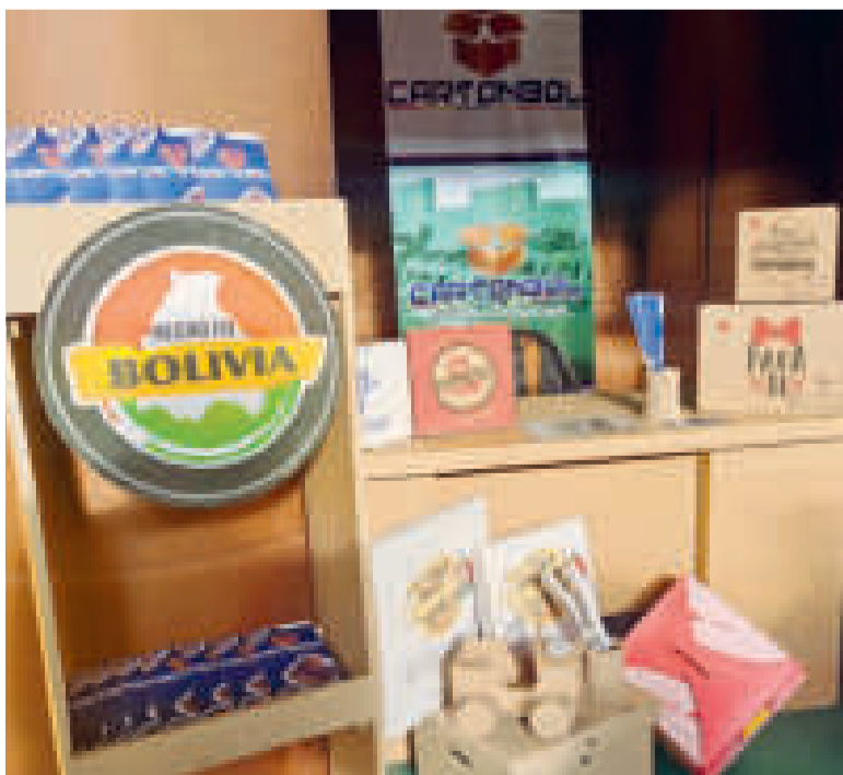
Parte de los productos que ofrece la estatal Cartonbol para su distribución.