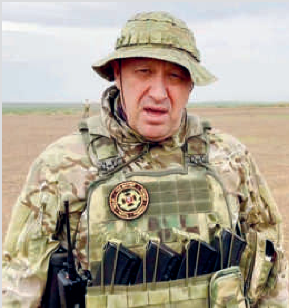
El nombre del jefe del grupo Wagner, Yevgueni Prigozhin, está en la lista de fallecidos.