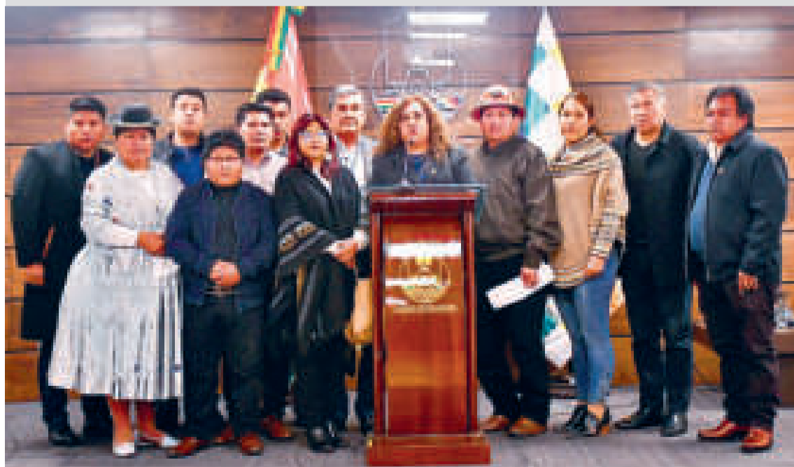
La bancada del MAS en el Senado, durante una conferencia de prensa.