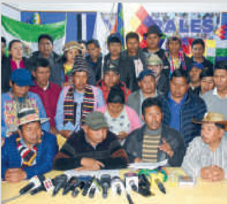
Dirigentes de la CSUTCB afines a Evo anuncian bloqueo de caminos a nivel nacional.