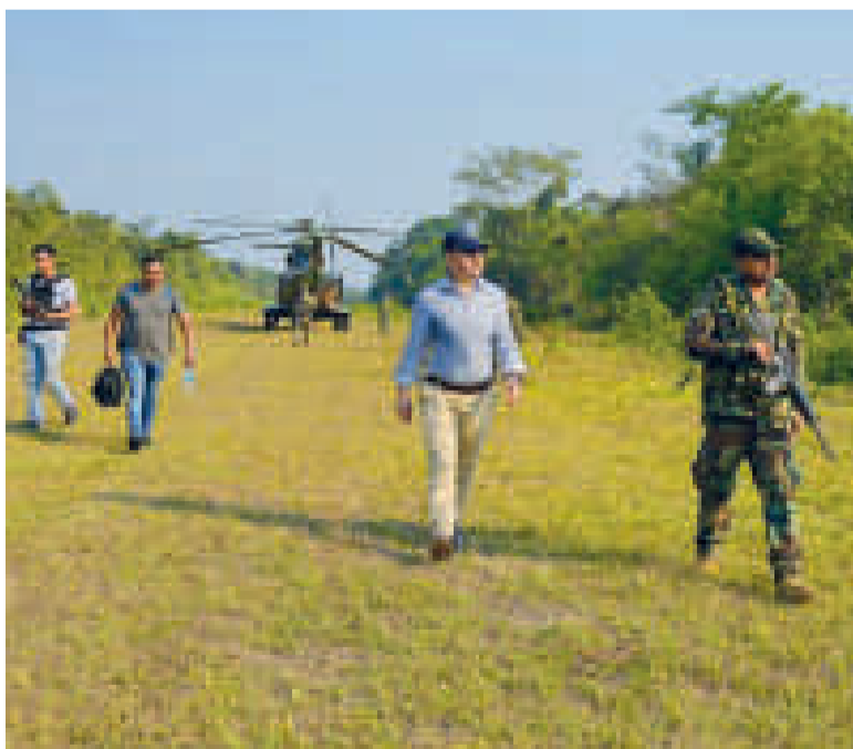
Rastrillajes en Beni para ubicar al uruguayo Sebastián Marset.