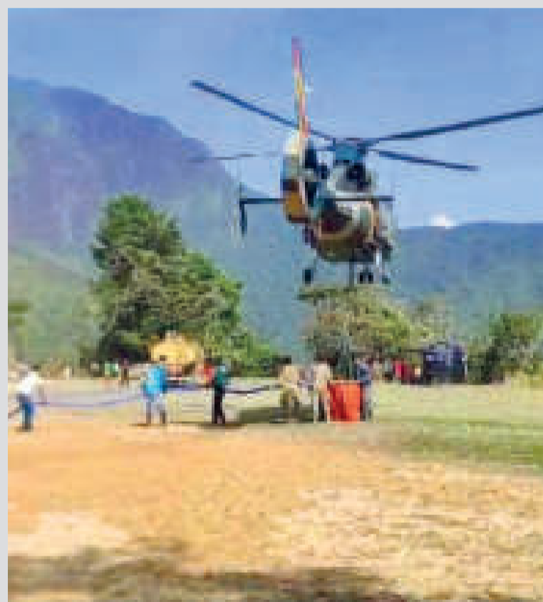
Un helicóptero de las FFAA en tareas de mitigación de un incendio en Cochabamba.