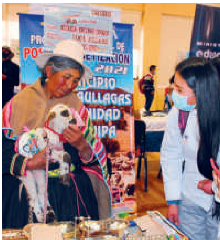
Una mujer expone sus conocimientos durante la Olimpiada.