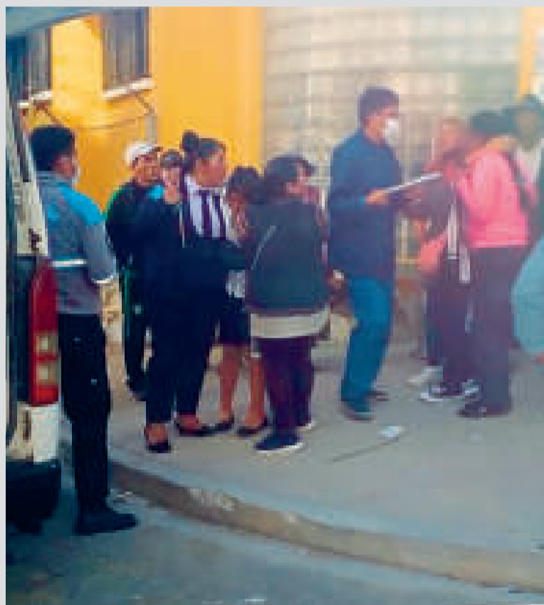
Familiares de la estudiante fallecida, en el centro de salud.

Según el testimonio de una de las madres de las afectadas, inicialmente 24 alumnos sufrieron los síntomas de intoxicación, pero solo 19 fueron auxiliadas; incluso más estudiantes registraron malestares, pero en menor intensidad. También aclaró que, según lo narrado por su hija, no consumieron nada todos juntos, pero sí sintieron un olor extraño en su unidad educativa.