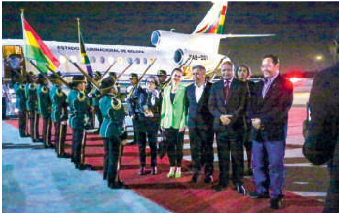
El presidente Luis Arce a su arribo a Sudáfrica para participar en la XV Cumbre Brics.