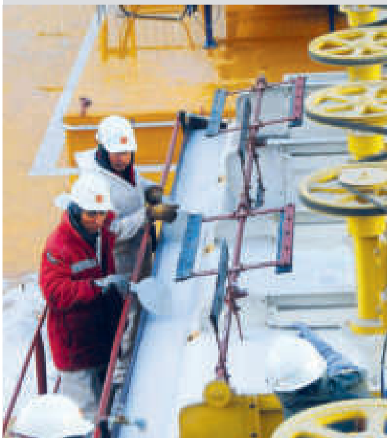
La producción de carbonato de litio de YLB.