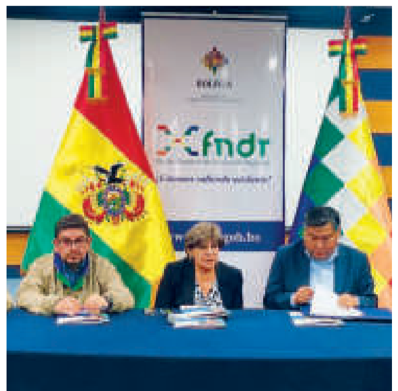
Firma del convenio en ambientes del FNDR, en La Paz.

KILÓMETROS DE CALLES Y AVENIDAS serán pavimentados.