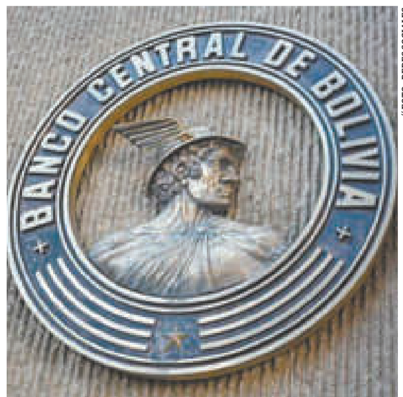
El logo del Banco Central de Bolivia en La Paz.

EMPRESAS DEL ESTADO adeudan al Banco Central de Bolivia.