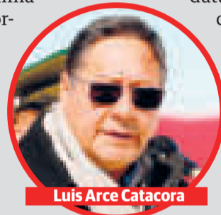
Luis Arce Catacora

“Con este moderno centro contribuiremos a la mejora de los procesos de innovación tecnológica del cacao nativo y cultivado, a través de la investigación, va-