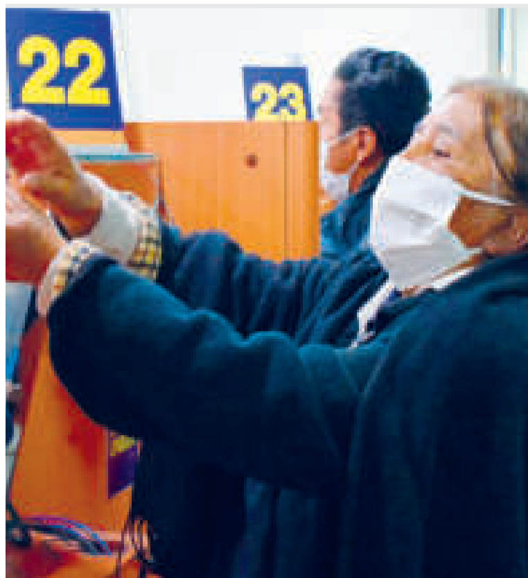
Todos los bolivianos mayores de 60 años son los beneficiarios.

La Renta Dignidad comenzó con el pago anual de Bs 1.800, para aquellas personas que percibían una pensión de jubilación; y de Bs 2.400 para quienes no tenían ahorros para su vejez. En 2019, el importe anual fue elevado a Bs 3.900 para las personas adultas mayores rentistas; y para las no rentistas a Bs 4.550 anuales. En ambos casos se incluye el aguinaldo.