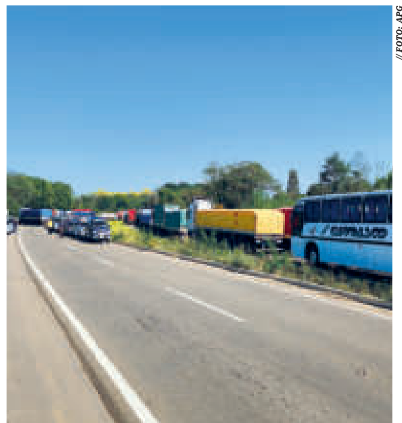
Ayer, los bloqueos cumplieron 10 días en la ruta Buena Vista.

También ayer, la Federación Departamental de Productores de Leche (Fedepel) comunicó que 432 lecheros resultan afectados por los bloqueos, con "pérdidas económicas cuantiosas" por la ruptura de la logística de acarreo diario de leche desde los predios pecuarios hasta el centro de acopio de la industria PIL Andina, en Warnes.