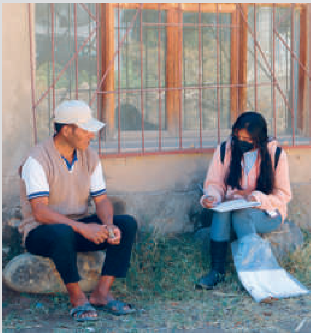
El Censo de Población y Vivienda se desarrollará el 23 de marzo de 2024.