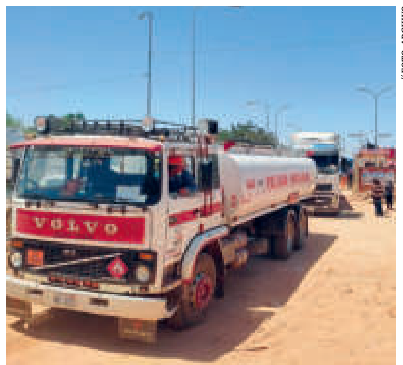
Camiones cisterna que transportan combustibles.

Jiménez dio cuenta de que en los últimos cuatro meses se incautaron más de 11 camiones cisterna que estaban desviando diésel al contrabando, además se precintaron cinco estaciones de servicio implicadas y se aprehendió a 107 personas.