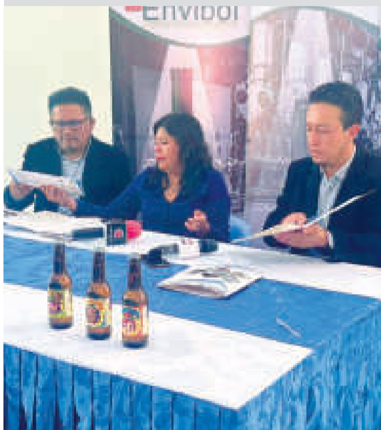
Firma de contrato entre Envibol y la empresa Rebelión Cervecería Artesanal.