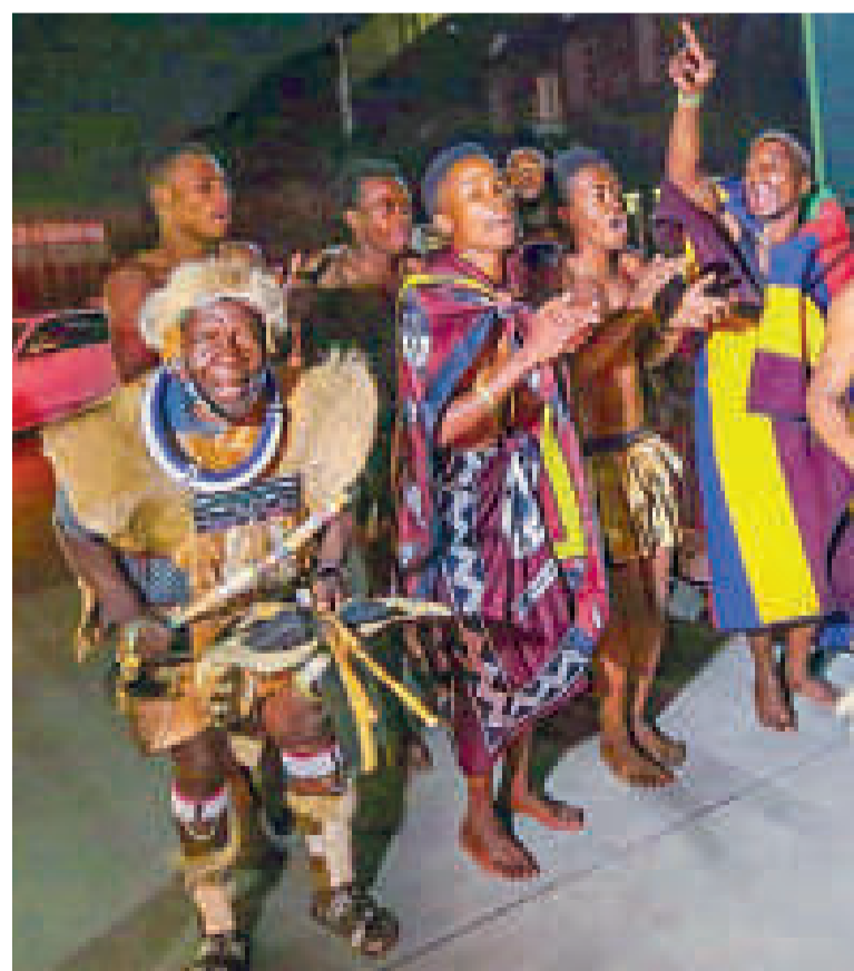
Danza típica de Sudáfrica.