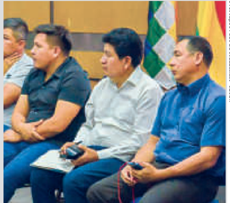
El ministro de Obras Públicas, Édgar Montaño, en la reunión de ayer.

El punto cuatro se refiere a que, “en caso de incumplimiento al plazo establecido en el punto dos, todas las organizaciones sociales e instituciones tomarán las medidas legítimas para lograr la ratificación del convenio”, leyó Montaño.