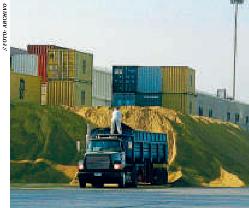
El comercio exterior es uno de los rubros más afectados con los bloqueos.

Del mismo modo, el ministro de Desarrollo Productivo, Néstor Huanca, expresó que la medida perjudicará los procesos de industrialización y los rendimientos en la producción agropecuaria.