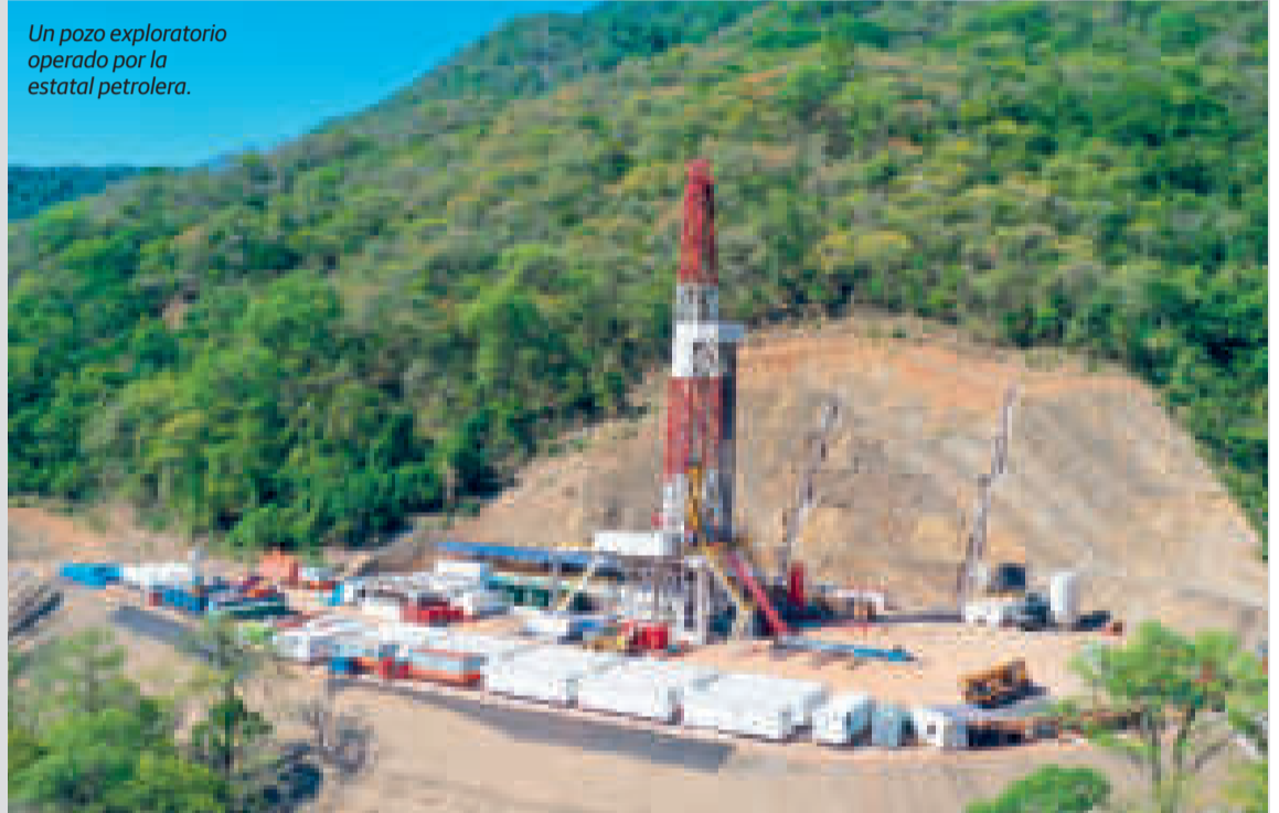
Un pozo exploratorio operado por la estatal petrolera.

Lamentó que durante el periodo de gobierno de Jair Bolsonaro no se haya avanzado en la agenda bilateral; en cambio, “ahora hay un viento distinto y eso se manifiesta en un entu-