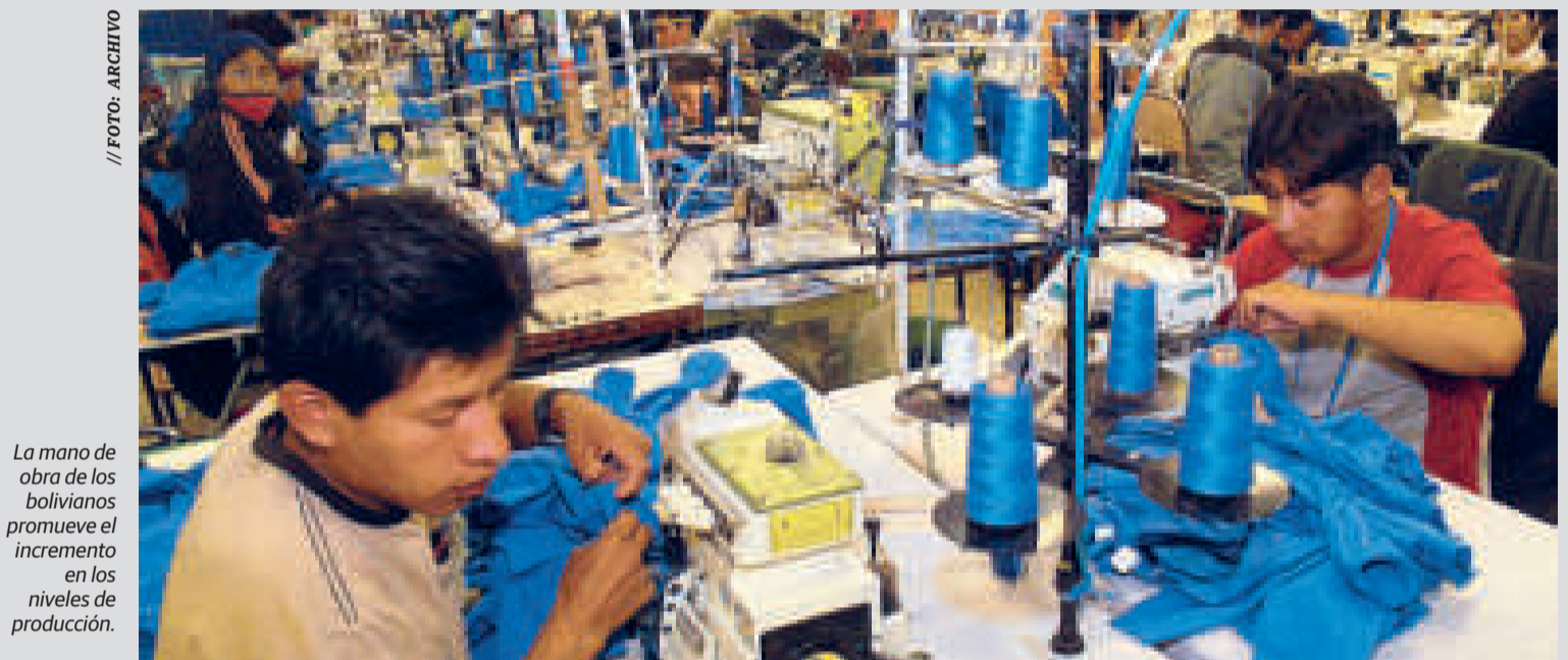
La mano de obra de los bolivianos promueve el incremento en los niveles de producción.

El Gobierno afirma que esta cifra refleja la participación más alta de toda la historia del país.