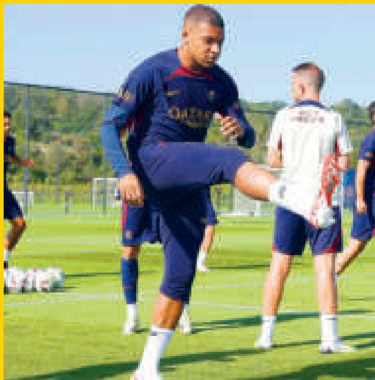
El jugador francés Mbappé no se mueve esta temporada del PSG.