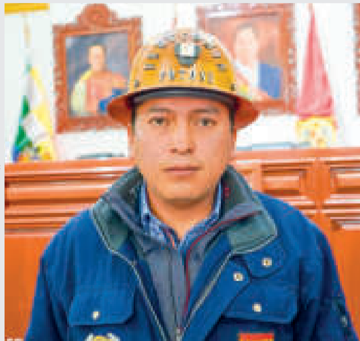
Marco Antonio Copa es el gobernador interino de Potosí.