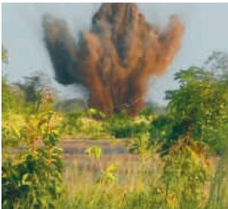
Un equipo especializado se encargó de dinamitar la pista usada para el narcotráfico.