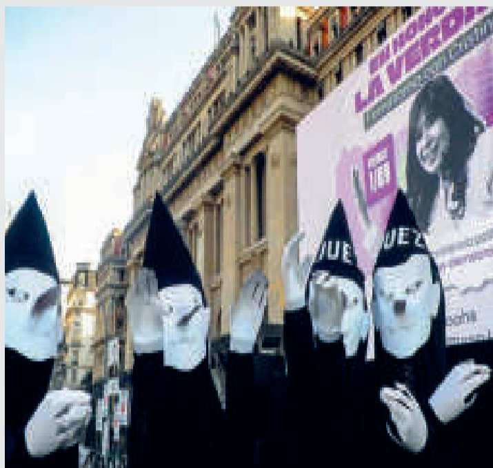
Organizaciones demandan justicia para Cristina Fernández.

Los grupos sociales, sindicales, feministas y de adultos mayores se reunieron, principalmente, bajo el precepto de "con violencia política no hay democracia" y con el lema "Justicia x Cristina".