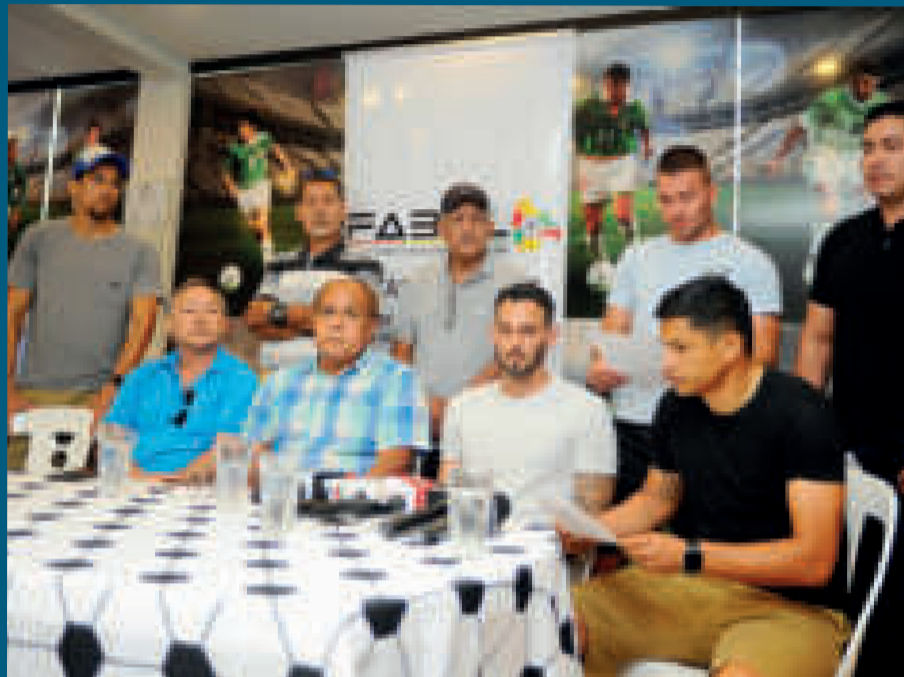
La dirigencia de Fabol pide la continuidad de los torneos del fútbol profesional.