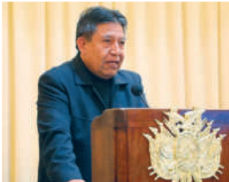
El vicepresidente del Estado Plurinacional de Bolivia, David Choquehuanca.

Hizo un llamado a la acción y la reflexión colectiva, destacando la necesidad