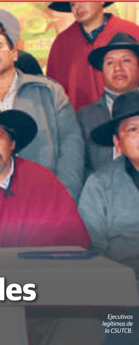
Ejecutivos legítimos de la CSUTCB.