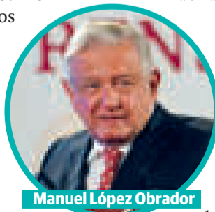
Manuel López Obrador

López Obrador remarcó que la tarea de los "impartidores de justicia" es servir al pueblo y "no como ocurre ahora, operar bajo la consigna de beneficio de grupos o de facciones políticas, económicas y hasta bajo consigna de intereses delictivos".