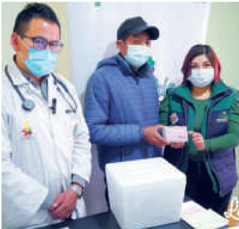
El paciente beneficiado recibe la primera entrega de medicamentos.

La autoridad recordó que esta institución no tiene fines de lucro, sino que su objetivo es colaborar, por lo tanto cada boliviano que recauda a través de los billetes será utilizado para ayudar a alguien.