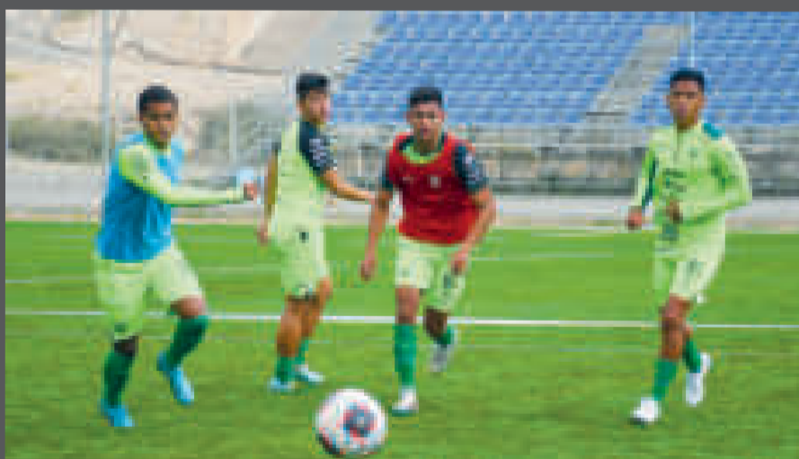
Jugadores de la Sub-23 en la práctica de fútbol que se cumplió en el CAR de Ananta.