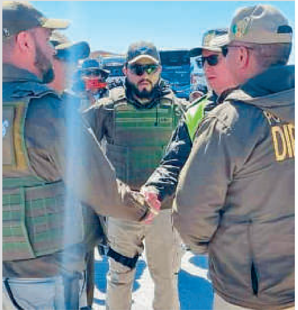
Carabineros de Chile y autoridades de la Policía Boliviana intercambian saludos en la frontera.