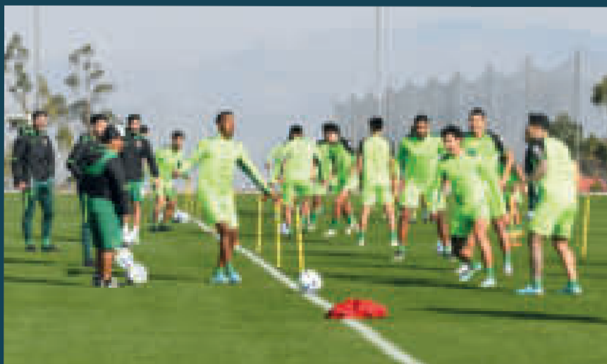
Jugadores de la Verde en pleno trabajo de dominio de la pelota.

Señaló que Brasil tiene jugadores de mucha jerarquía que pueden definir un partido en cualquier momento, pero Bolivia intentará contrarrestar ese factor con "mucha concentración y mentalidad positiva que nos pueda dar la oportunidad de conseguir un buen resultado para la alegría de nosotros y del pueblo boliviano", finalizó.