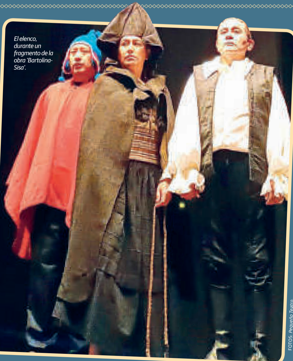
El elenco, durante un fragmento de la obra 'Bartolina-Sisa'.

Bartolina Sisa, Túpac Katari y Gregoria Apaza fueron líderes indígenas que durante el siglo XVIII lucharon contra el dominio español.