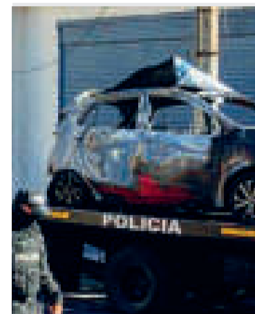
El vehículo explotó el martes.