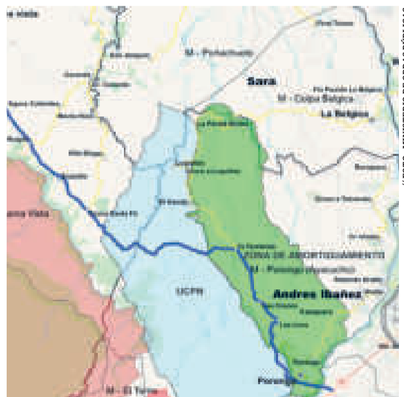
Trazo de la carretera, según el proyecto.

tiene Santa Cruz de la Sierra dentro de los 100 y 360 metros.