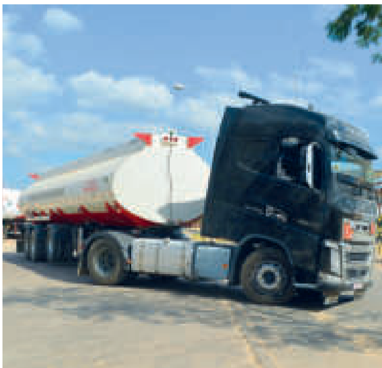
Un carro cisterna transporta combustible.