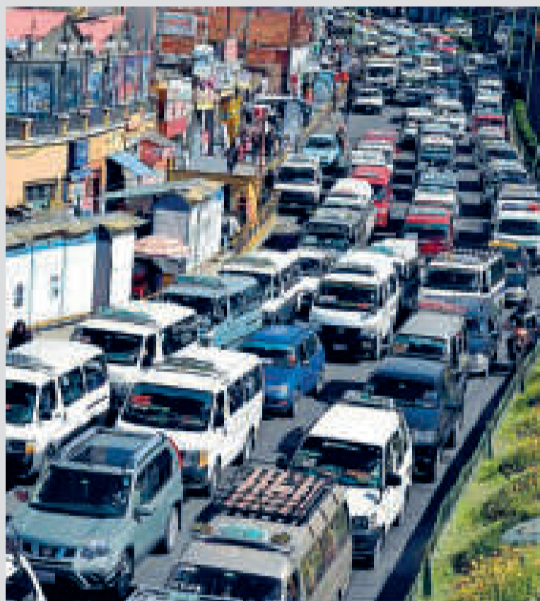
Las medidas para hacer más fluido el tráfico en La Paz habrían fracasado.