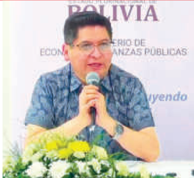
Marcelo Montenegro, ministro de Economía y Finanzas Públicas.

Dentro de las transferencias a través de ‘simple, pago móvil (QR)’, más del 80% se realizaron por montos menores a Bs 500, reflejando así su importante uso y aporte a la inclusión financiera de la población.