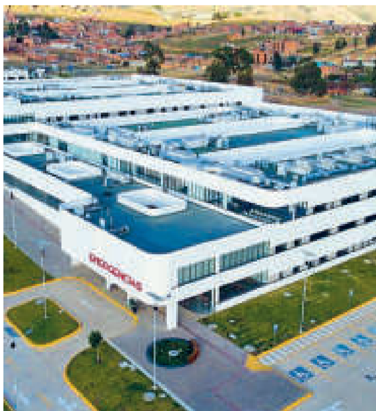
Se busca que el hospital de tercer nivel en Chuquisaca atienda desde septiembre.

Este nosocomio representó una inversión de Bs 514 millones y cuenta con equipamiento de alta tecnología como equipo de rayos X con fluoroscopia, equipo de rayos X convencional, entre otros.