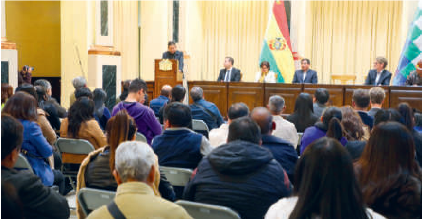
El conversatorio en la Vicepresidencia del Estado Plurinacional de Bolivia.