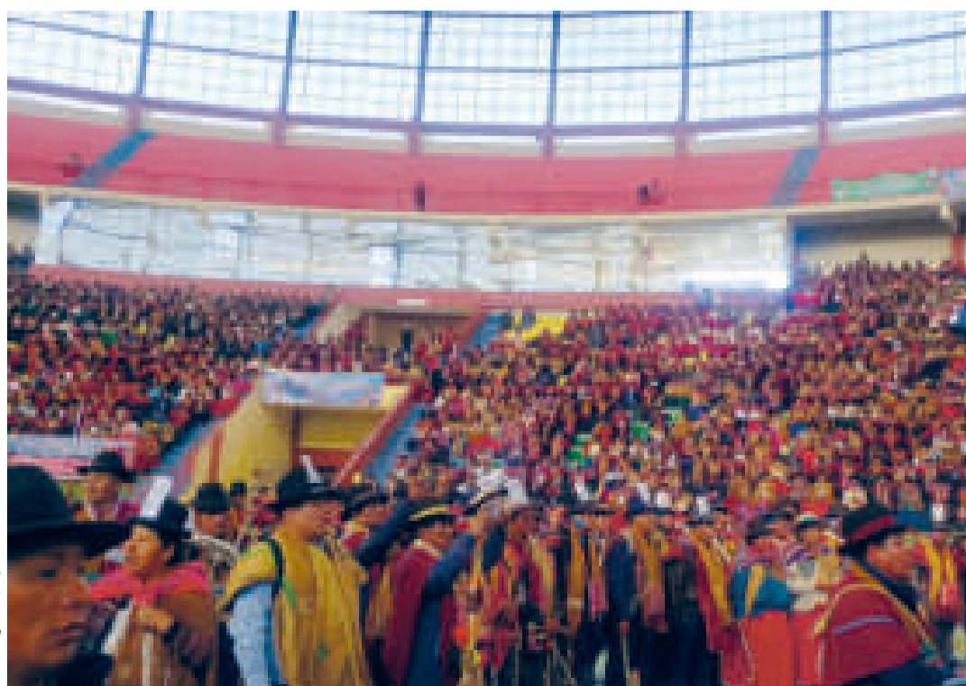
Congreso de la CSUTCB en la ciudad de El Alto.

También pidieron a las autoridades electas por el pueblo a no dividir a las organizaciones sociales y mucho menos entrometerse en las decisiones orgánicas que toman.