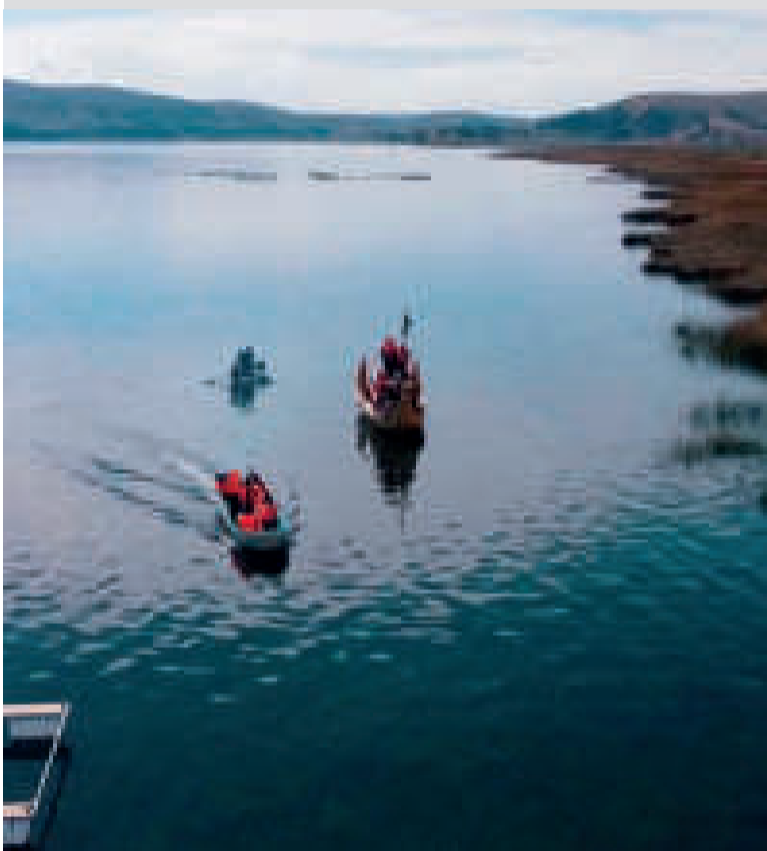
Las aguas del lago Titicaca sufren una disminución que se acerca a registros históricos.