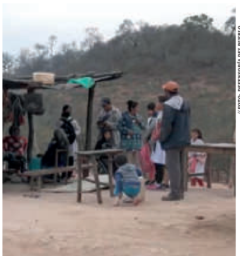
La Defensoría del Pueblo identificó indígenas guaraníes sobreexplotados.

“No se puede admitir que continúen estas condiciones de explotación y sobreexplotación laboral. Dejamos este informe como precedente para que estas condiciones de vida sean erradicadas y denunciadas”, dijo el defensor.