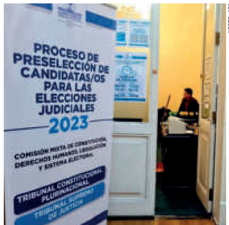
Cartel de información de un proceso anulado.

PUNTOS de calificación requerirán los postulantes para ser elegidos candidatos.