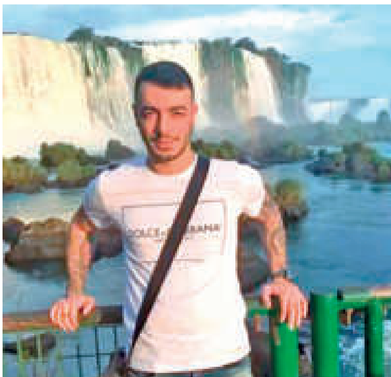
El narcotraficante más buscado en la región.

En la llamada se escucha que el supuesto Marset pregunta: “¿Pudo averiguar algo?” Y la respuesta es “Positivo, hermano, el ‘10’ mandó a capturarte, tienes que huir lo más antes posible”.