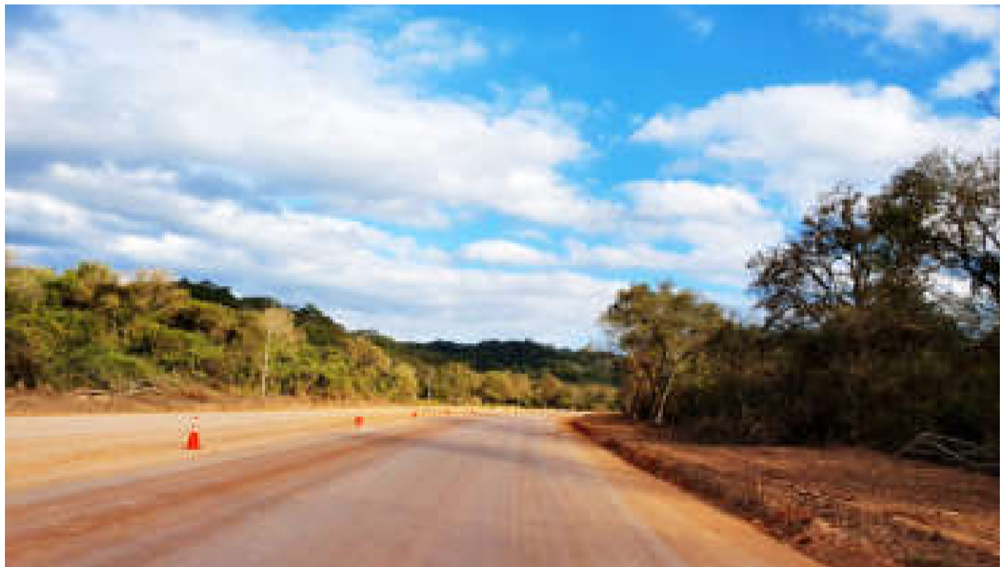
En la carretera Buena Vista-Las Cruces “no hay monte virgen, sino una vía de más de 100 años de antigüedad consolidada, de tierra, de ripio, que quiere únicamente pavimentarse”.

El financiador del proyecto autorizó los recursos económicos a finales de 2018, por lo que está a la espera de que estos se ejecuten.