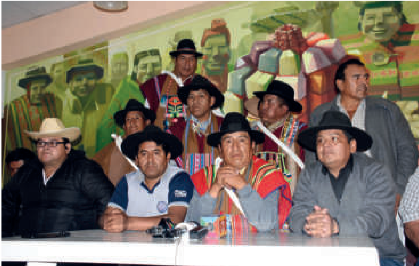
El Comité Ejecutivo Nacional de la Confederación Sindical Única de Trabajadores Campesinos de Bolivia.