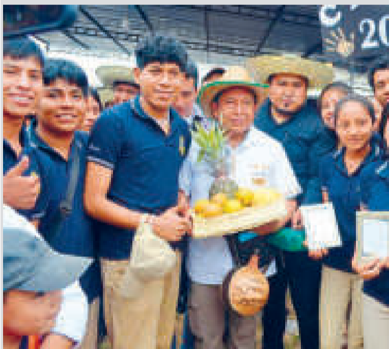
David Choquehuanca con un grupo de jóvenes en La Guardia.