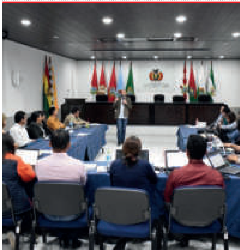
Taller de validación en Sucre.