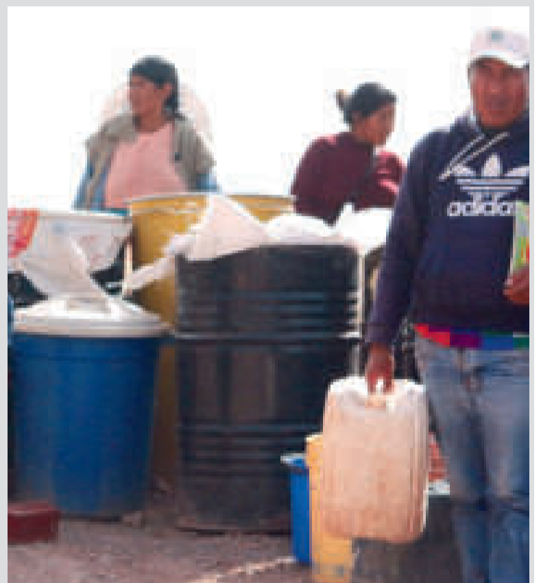
La población espera los carros cisterna para recibir agua en turriles y otros recipientes.

“Epsas sigue trabajando con el abastecimiento de agua. No solo son los pozos que vamos a perforar en la ciudad de El Alto, sino también vamos a tomar el bombeo de otros lugares, por ejemplo de Huayllara. Es una estación donde nos suministra agua por bombeo para la represa de Incachaca”, dijo.