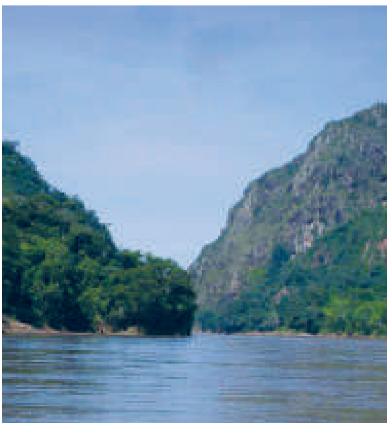
El Madidi es una de las áreas protegidas más diversas por su riqueza natural.