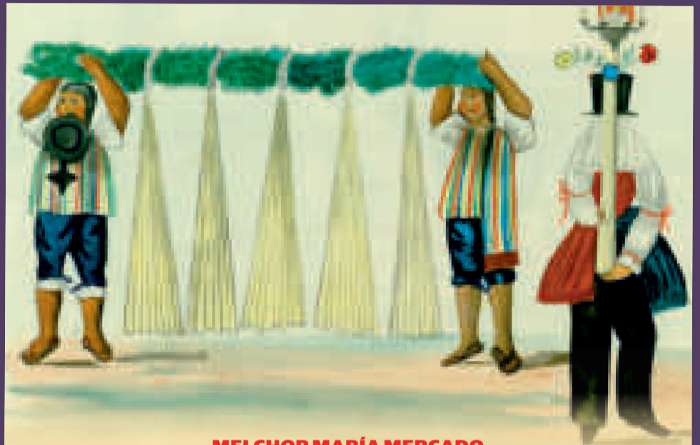
MELCHOR MARÍA MERCADO

Artista autodidacta, cultivó el óleo y la acuarela. Fue influenciado por la obra del explorador y naturalista Alcides de D'Orbigny, quien estuvo en Bolivia entre 1830 y 1833, y que motivó en Mercado un arte que refleja la población, los usos y costumbres y la naturaleza de todos los lugares de la geografía de los Andes y la Amazonia que recorrió a lo largo de los años.