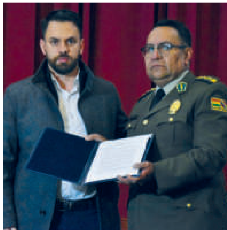
Entrega del decreto supremo al alto mando de la Policía Boliviana.

ES EL DECRETO SUPREMO que repone la cuota mortuoria.