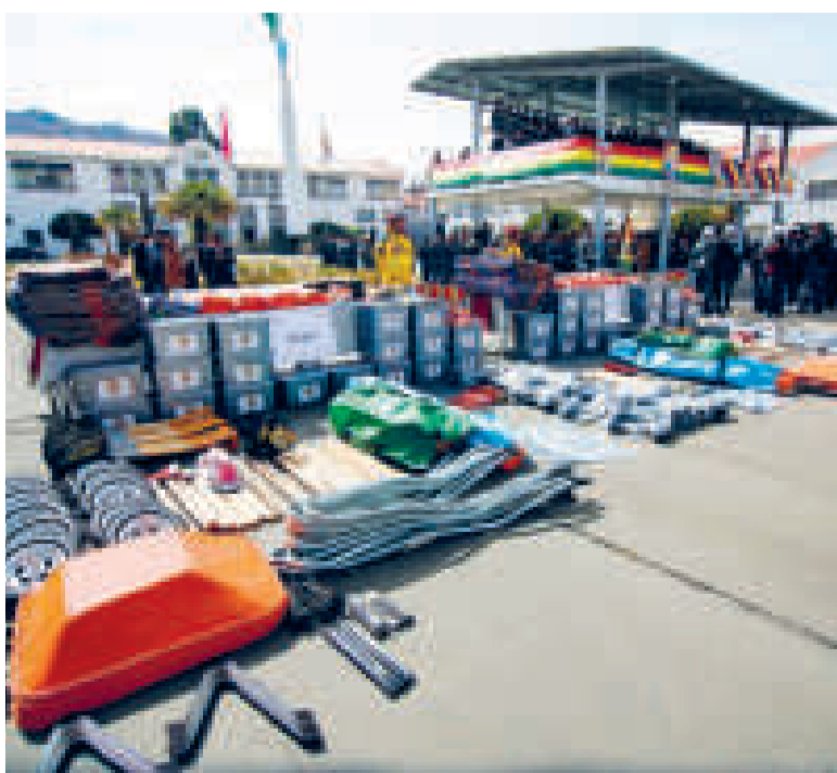
Equipos entregados a cinco unidades militares del CCR-EA de La Paz.