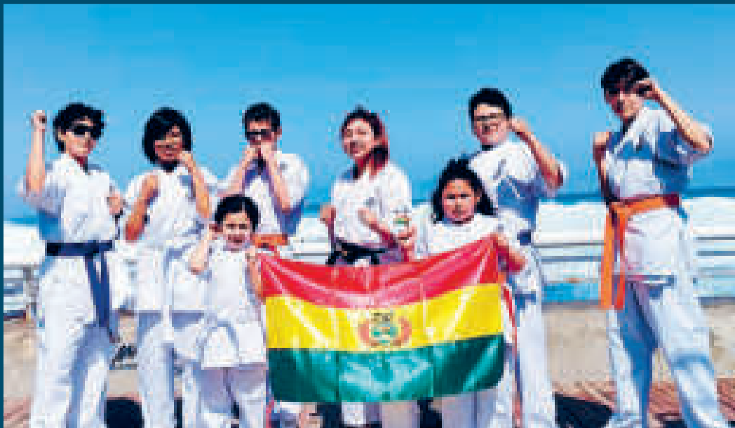
Integrantes del equipo Magno Dojo Karate Kyokushin Bolivia.