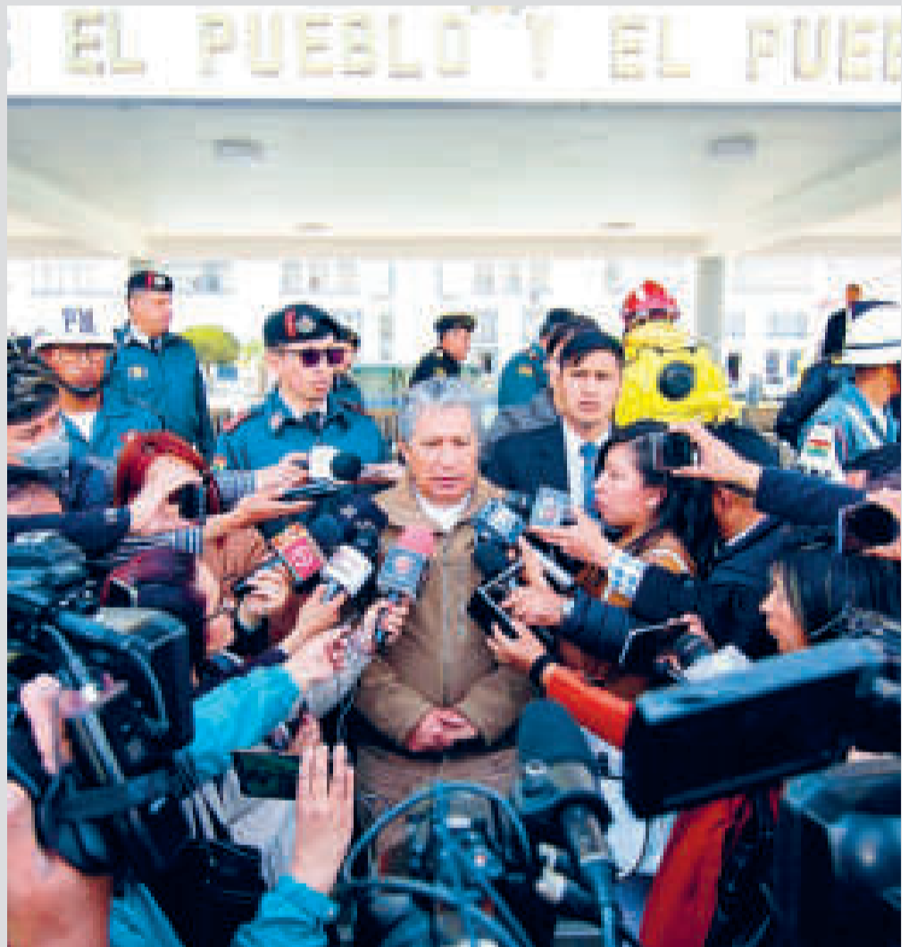
El ministro de Defensa, Edmundo Novillo, en el cuartel de Miraflores.