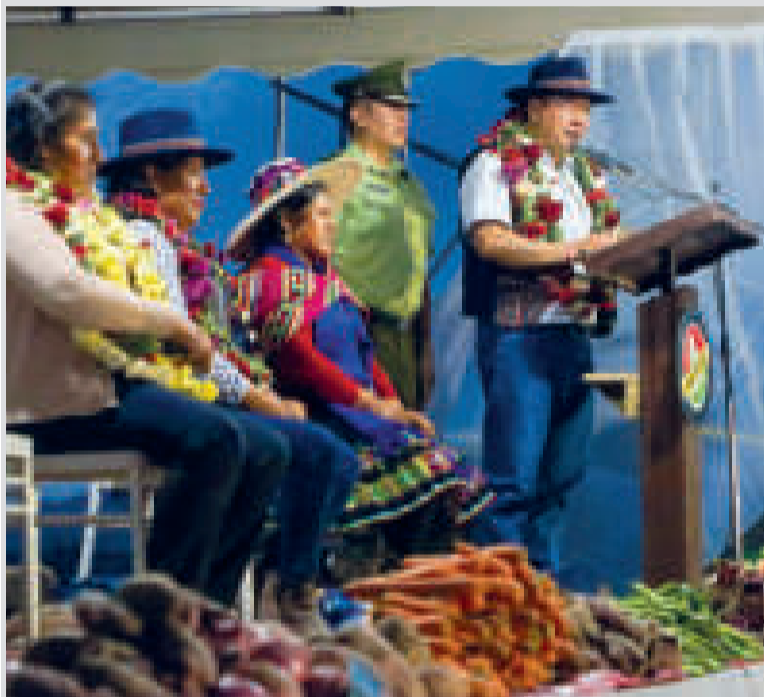
El presidente Luis Arce en Capinota, la noche de ayer.

“La industrialización no es un sueño (...) Nuestro país ya ha ingresado a la era de la industrialización”, dijo el presidente Luis Arce en ese municipio.