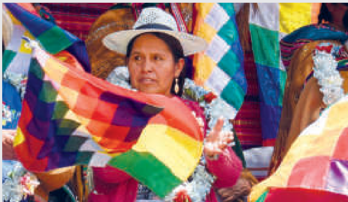
Ministra de Culturas, Sabina Orellana.