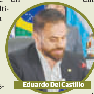
Eduardo Del Castillo

Desarticular Organizaciones Criminales (Ciadoc). En tanto, el Jefe de Estado informó que Uruguay, Paraguay, Brasil y Colombia coincidieron con Bolivia en regionalizar la lucha contra el narcotráfico.