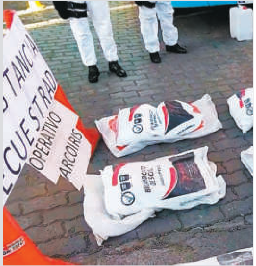
Exposición de las bolsas de bicarbonato de sodio incautadas.