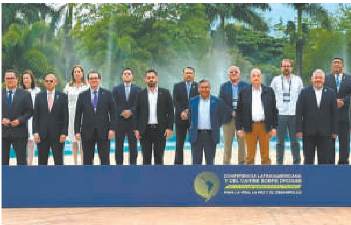
La foto oficial del encuentro en Cali, Colombia.