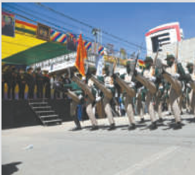
Soldados durante un acto especial.