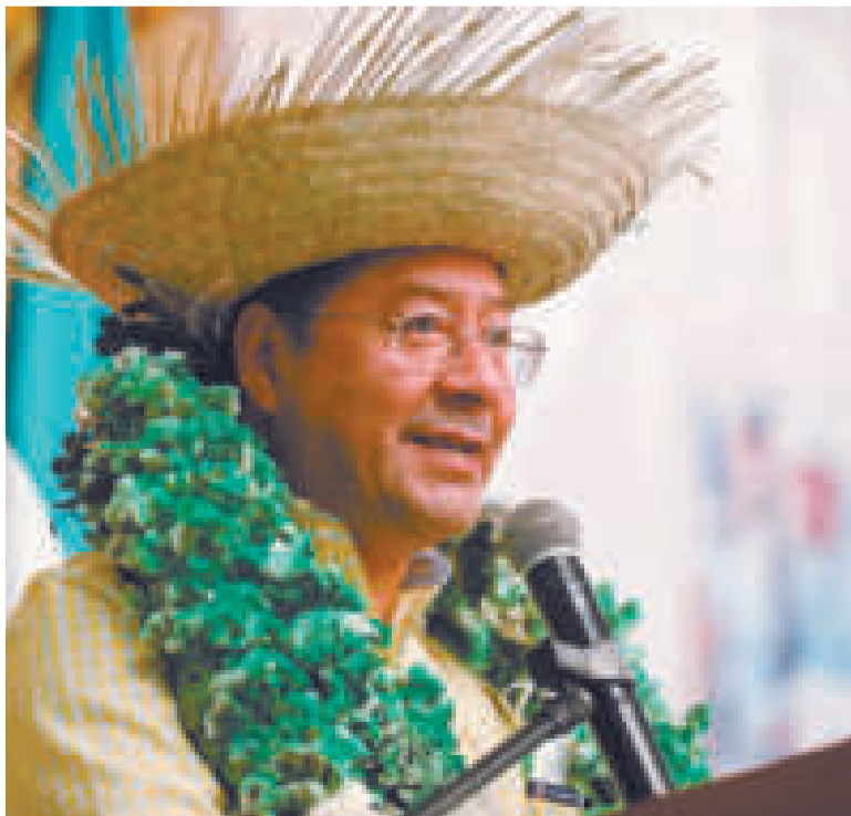
El Jefe de Estado en un acto en Santa Cruz.