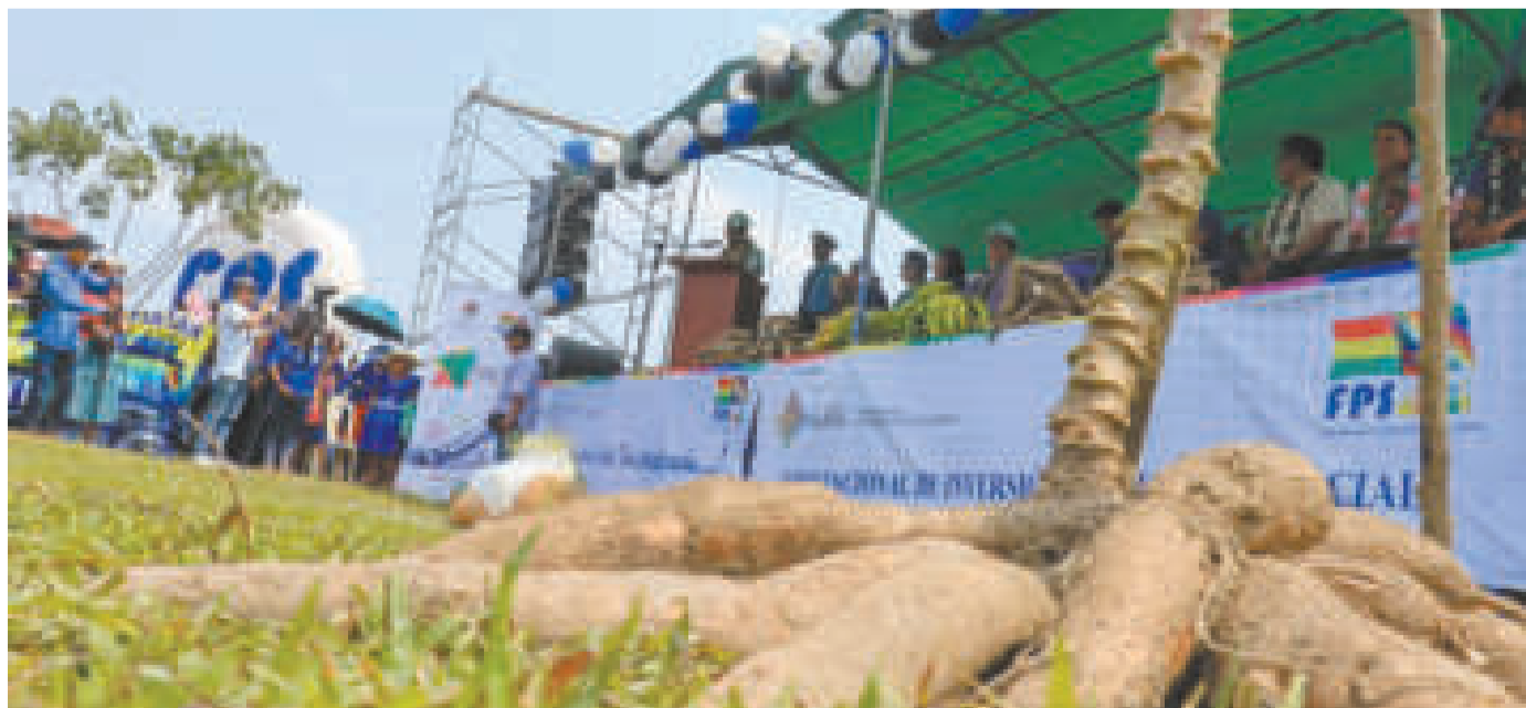
Acto de inauguración de la construcción de la Planta Procesadora de Yuca.

El Jefe de Estado estuvo acompañado del presidente del Senado, Andrónico Rodríguez, oriundo de esta región, y los ministros de Planificación, Sergio Cusicanqui, y de Desarrollo Productivo, Néstor Huanca, entre otras autoridades.