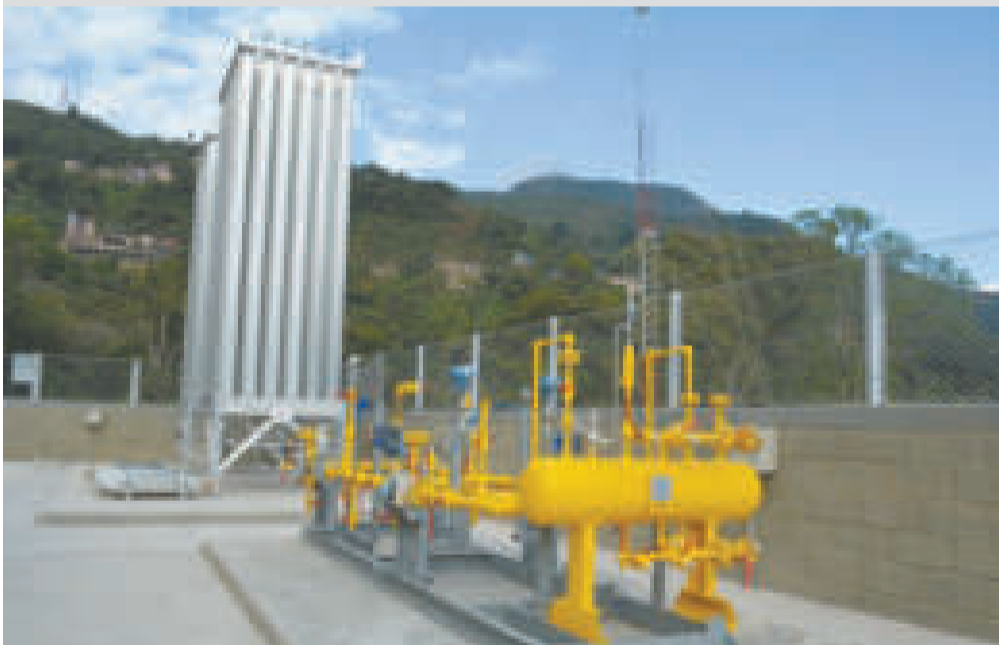
Las estaciones satelitales de regasificación posibilitan que el gas llegue a los hogares yungueños.