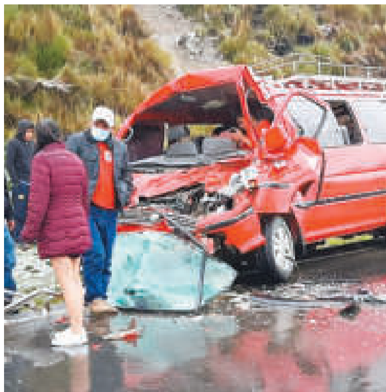
Siniestro en el sector de los Yungas, en La Paz.

PERSONAS PERDIERON la vida por accidentes de tránsito en 2022.