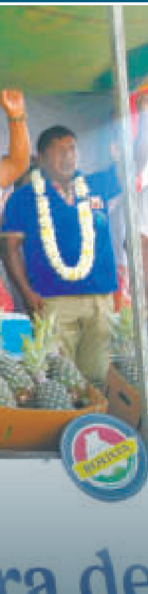
Autoridades durante el colocado de la piedra fundamental de la Planta Procesadora de Piña.

Para el Gobierno nacional, poner la piedra fundamental quiere decir que todo ya está listo para empezar a construir, tenemos el proyecto terminado, el financiamiento garantizado y la empresa contratada para llevar adelante los proyectos de industrialización”.