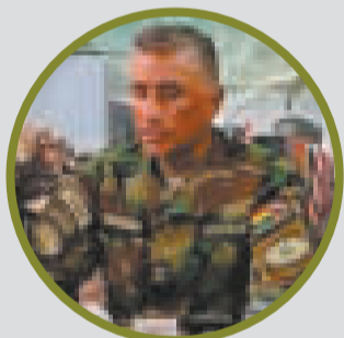
AUTORIDAD DE LA FELCN LA PAZ durante la conferencia de prensa.

“De estos tres operativos tenemos cinco personas aprehendidas, tres vehículos secuestrados, un inmueble y un celular secuestrado (...)”