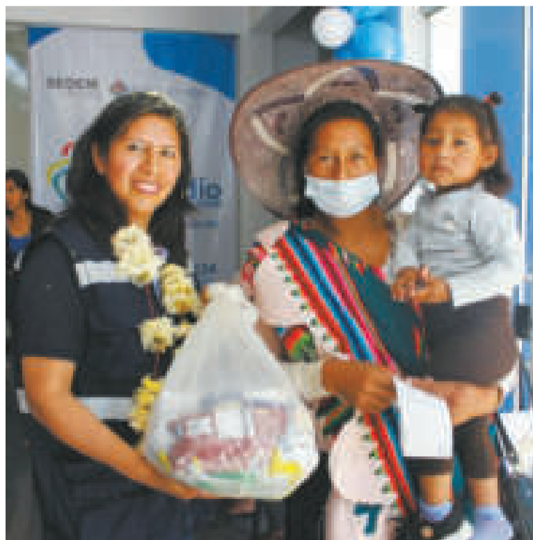
Una madre recibe su paquete de subsidio en Vinto.

MIL PAQUETES de subsidio prenatal se entregarán en el municipio de Vinto.