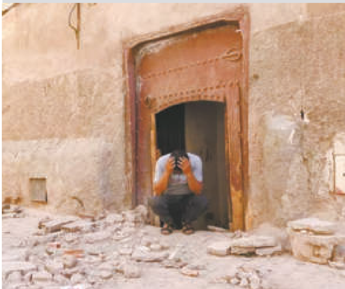
Un hombre ante un edificio dañado por el terremoto en Marruecos.