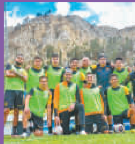
Futbolistas del club The Strongest.

En tanto, la dirigencia espera una respuesta de la Conmebol antes de la reunión de Consejo convocada para el miércoles 13 en La Paz, desde las 15.00, en la que definirá la situación.