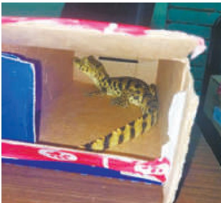
La cría de lagarto se encontraba en una caja.