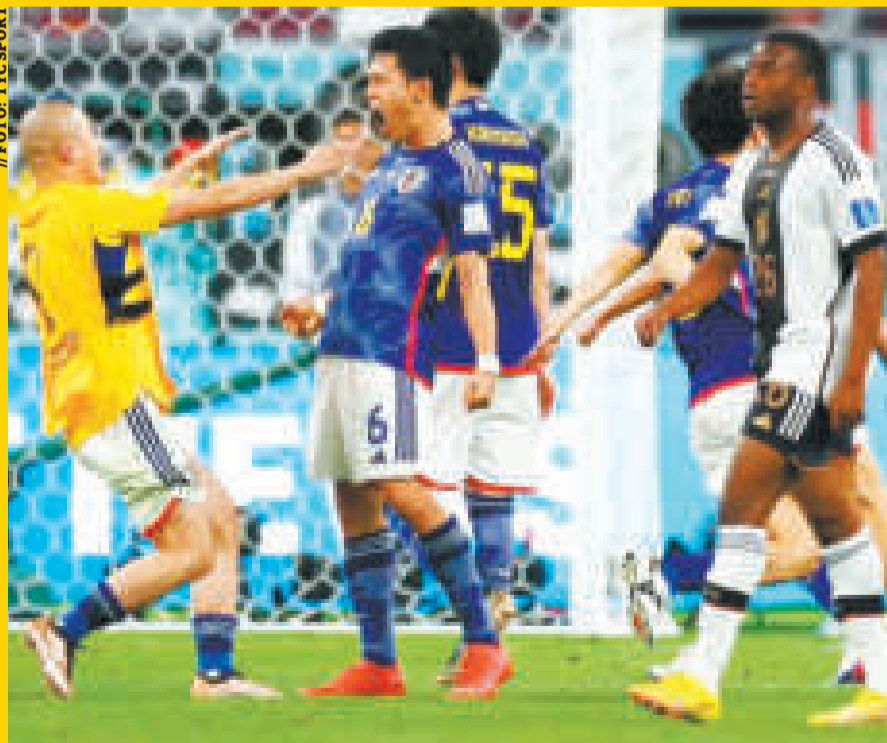
Jugadores de Japón celebran la victoria ante Alemania, en condición de visitante.