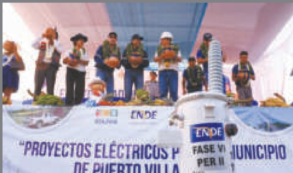
Autoridades durante la entrega de los tres proyectos de electrificación.