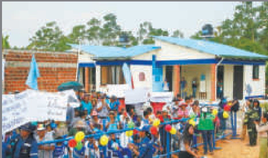
Puerto Villarroel recibe 50 viviendas sociales.

Además, entregó en forma simbólica el mercado regional emplazado en Ivirgarzama, distrito 6 de Puerto Villarroel; así como infraestructura de fibra óptica 4G.