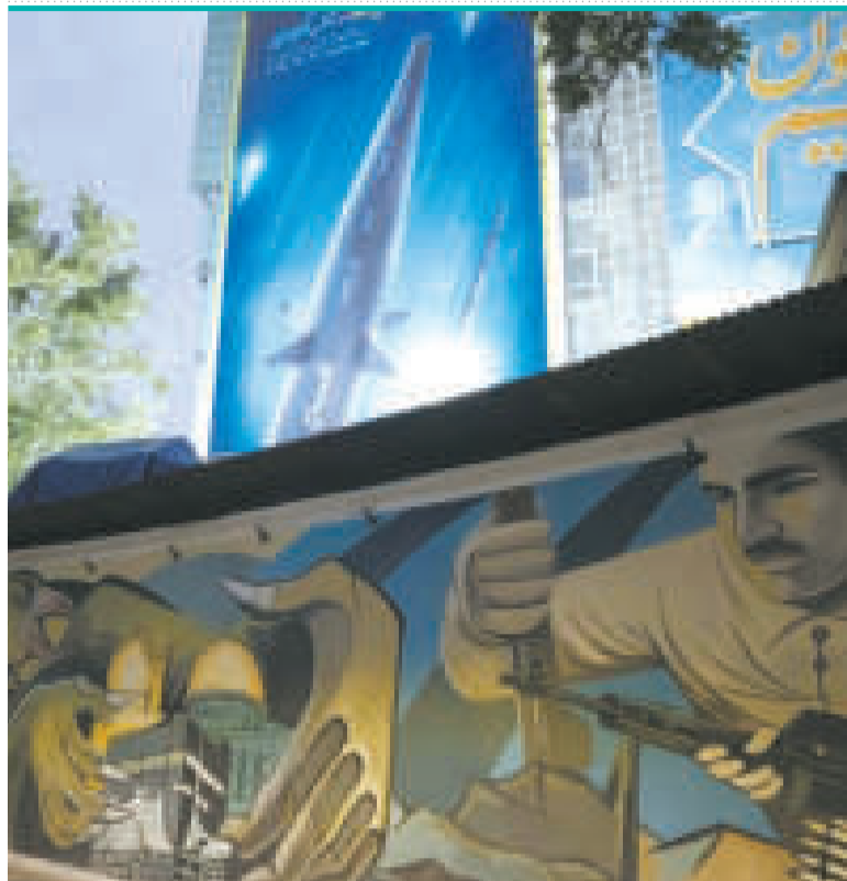
Un mural antisraelí y una imagen del misil hipersónico Fattah en la plaza Palestina.