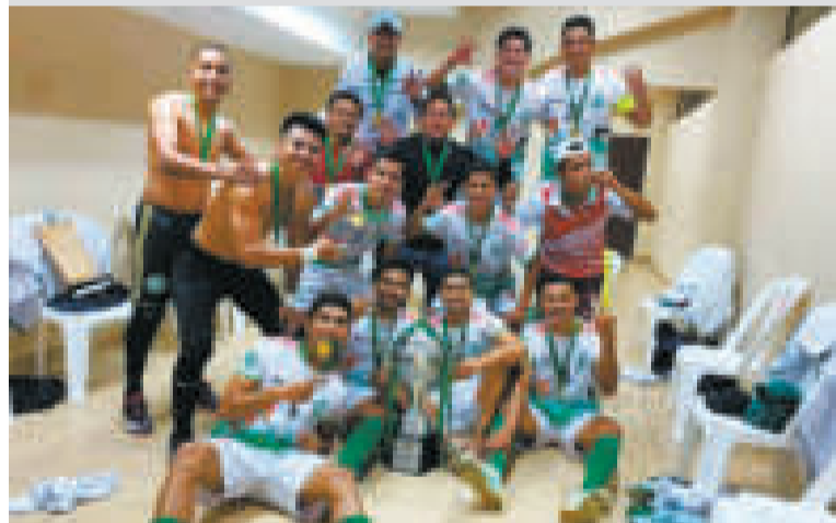
Los seleccionados cruceños de futsal festejan la conquista del tricampeonato.

En el cotejo por el tercer puesto, Punata derrotó a Chuquisaca por 5 a 2; en tanto, en la gran final, los jugadores del seleccionado cruceño no tuvieron piedad de los anfitriones al imponerse por un contundente 6-1, para luego dar rienda suelta al festejo con la tradicional vuelta olímpica.