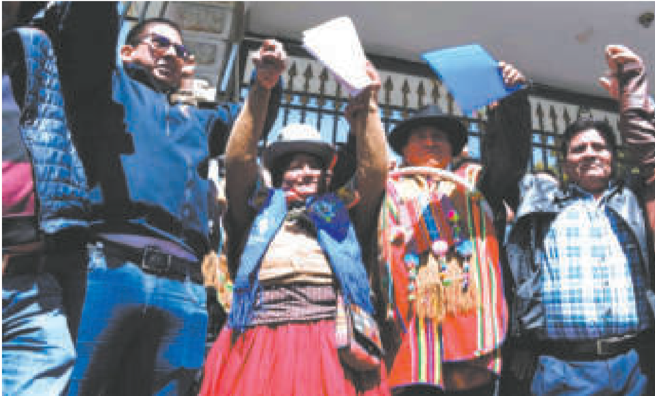
Los principales ejecutivos del Pacto de Unidad en el TSE, el pasado jueves.