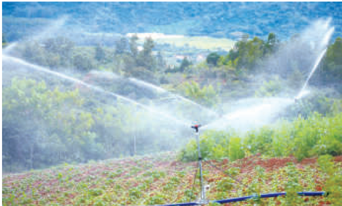
Sistema de riego ejecutado por el Gobierno.