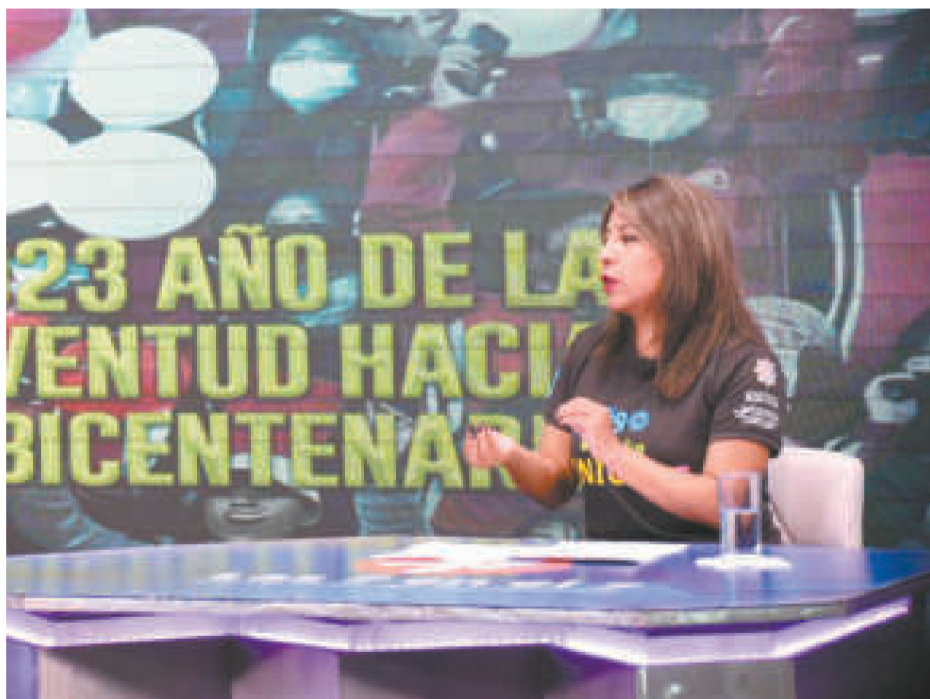
La viceministra Nadia Cruz durante su participación en el programa 'Las 7 en el 7', de Bolivia TV, donde dio a conocer las actividades para la juventud.

En Bolivia, la juventud representa alrededor del 25% del total de la población. Esta gestión, 33.971 jóvenes accedieron a la ciudadanía digital.