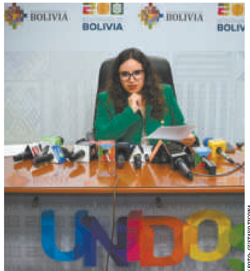
La ministra de Salud, María Renée Castro, en conferencia de prensa.

El total de vacunas gestionadas y adquiridas por el Ejecutivo asciende a 23,8 millones de dosis.