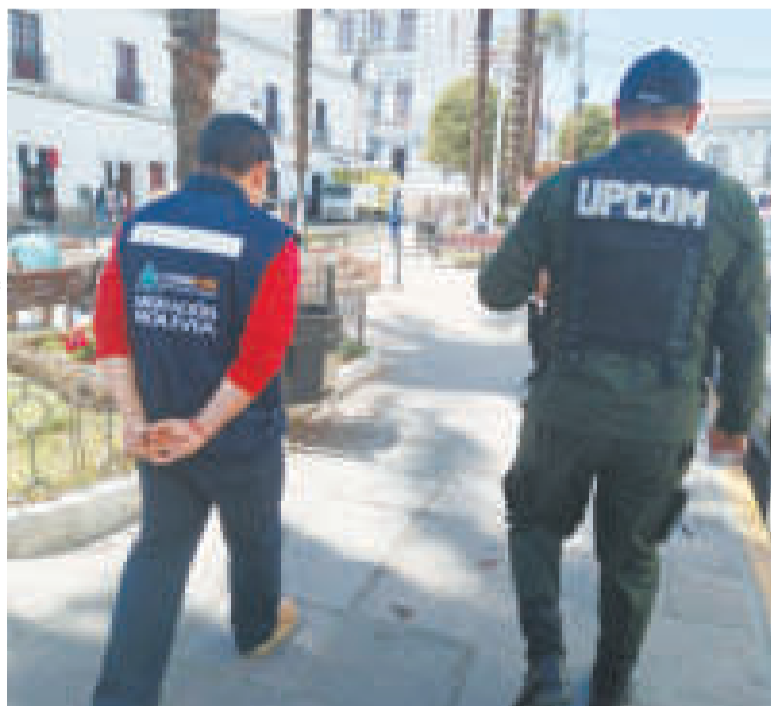
Funcionarios de Migración durante operativos de control.