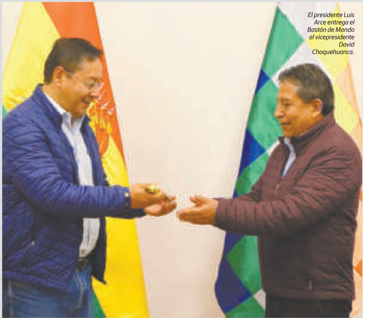
El presidente Luis Arce entrega el Bastón de Mando al vicepresidente David Choquehuanca.

El Gobierno de ese país anunció una nueva iniciativa nacional para encontrar los restos de más de 1.000 chilenos desaparecidos bajo la dictadura de Pinochet.