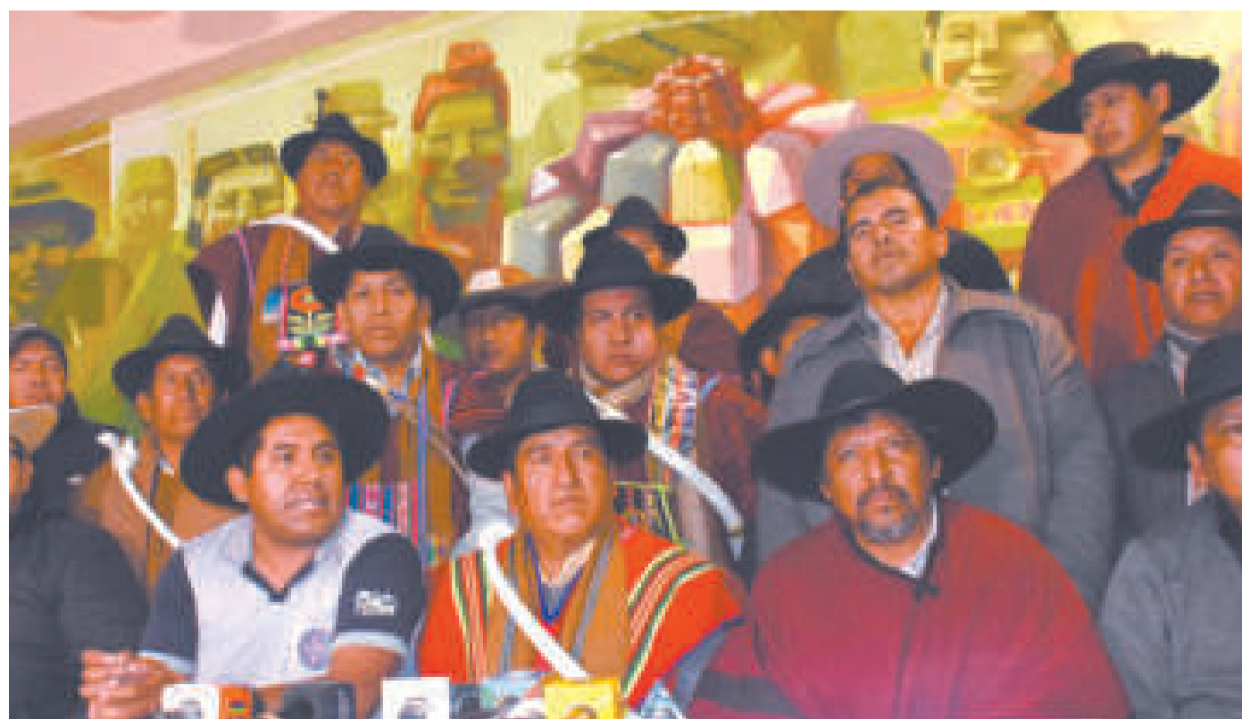
Actuales dirigentes de la CSUTCB, que representan a la nación aymara, quechua y oriente.

Fue el principal impulsor de la lucha contra el expresidente Gonzalo Sánchez de Lozada en 2003. En enero de 2021, 'El Mallku' falleció.