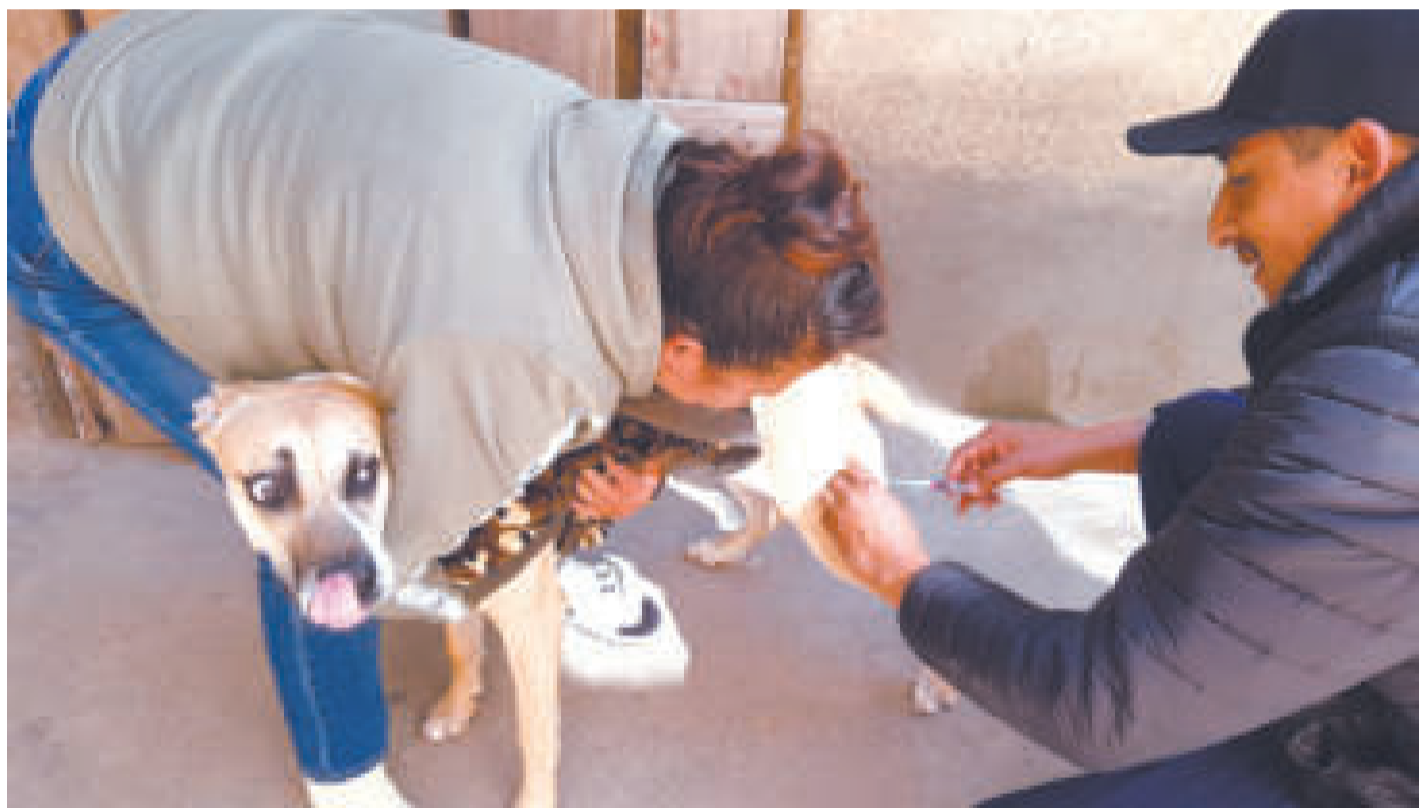
Un perro es vacunado contra la rabia canina.

La ministra Castro informó que manejan una estrategia de tres etapas: la campaña de vacunación, de consolidación y de mantenimiento.