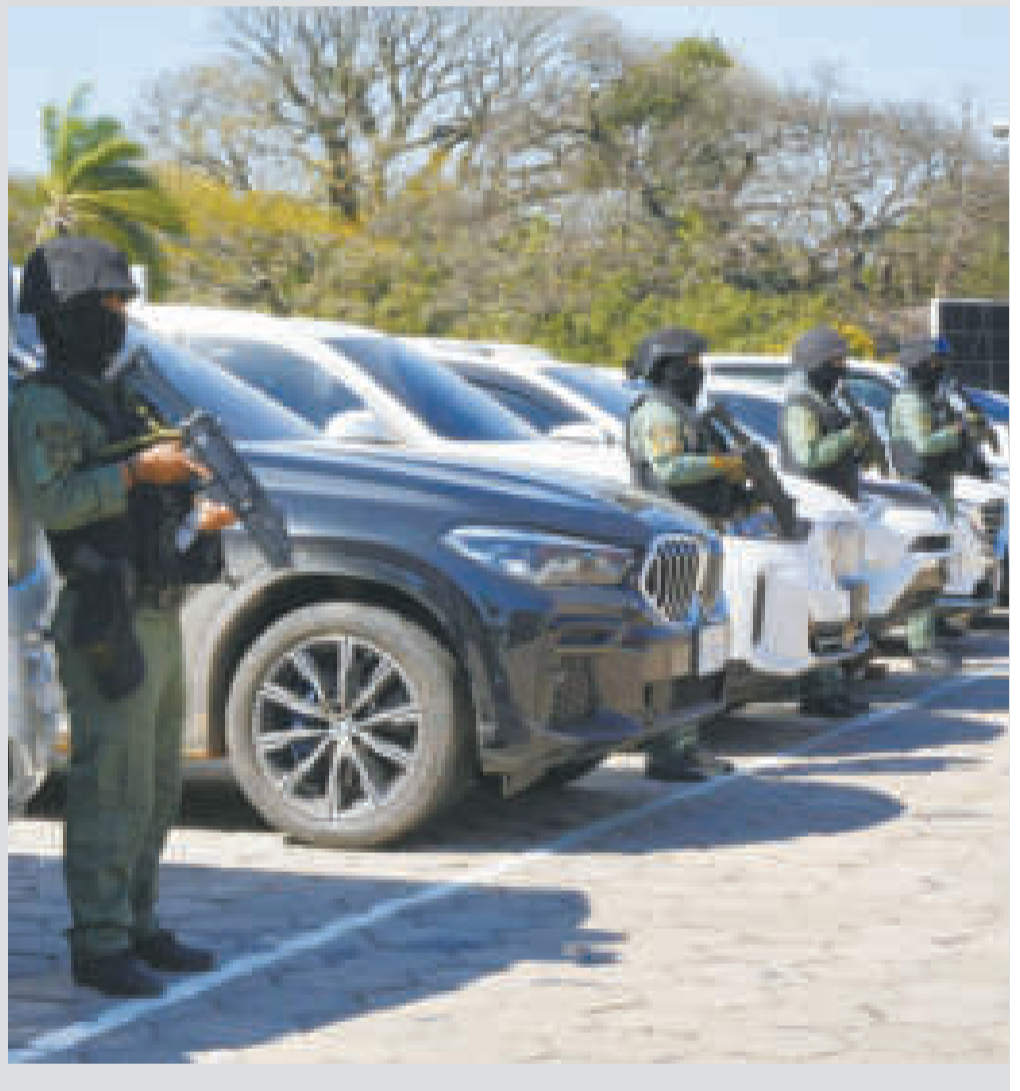
Vehículos secuestrados durante operativos policiales en busca de Sebastián Marset.

La autoridad aseguró que la búsqueda para aprehender a Marset continúa en una tarea coordinada con otros países.