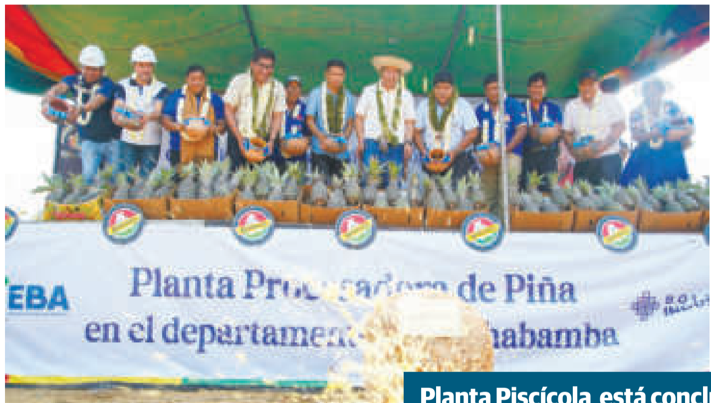
El presidente Luis Arce realiza la ch'alla tradicional en el inicio de la construcción de la Planta Procesadora de Piña.

Son siete factorías que están en construcción en el departamento, para fortalecer la sustitución de importaciones. Otra está próxima a iniciarse.