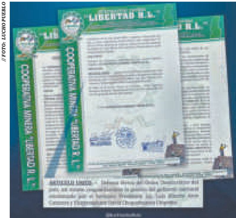
El voto resolutivo de apoyo de la cooperativa Libertad a Luis Arce.