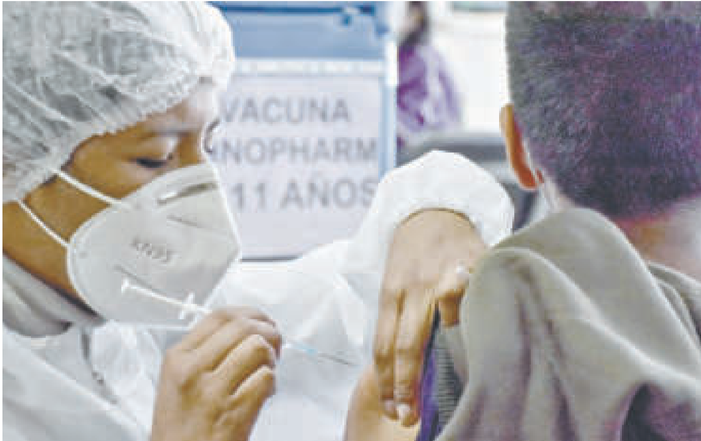
Una persona se vacuna contra el Covid-19.