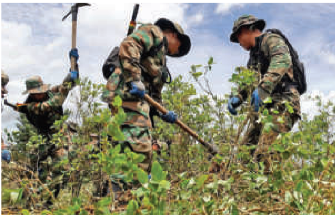
Militares en tareas de erradicación.

Del Castillo, por su parte, sostuvo que un factor constitutivo del valor soberano del país es la revalorización y la defensa de la hoja de coca.