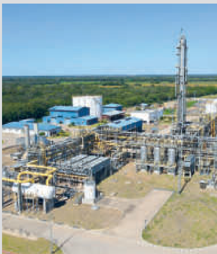
La Planta Río Grande está ubicada en el municipio de Cabezas, Santa Cruz.