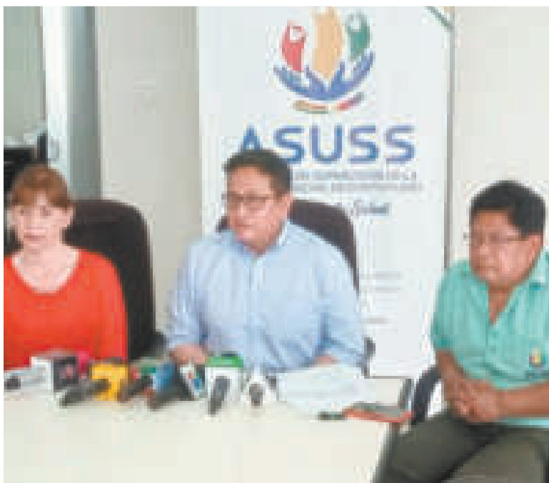
El viceministro de Salud, Álvaro Terrazas (medio), durante la conferencia de prensa.