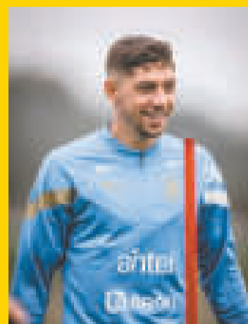
Federico Valverde, capitán de Uruguay.

La Celeste viene de vencer por 3 a 1 a Chile, del DT argentino Eduardo Berizzo en el banco de suplentes, en condición de