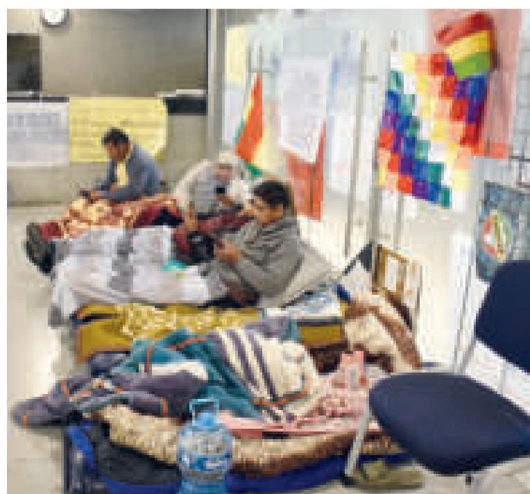
La medida instalada en la Asamblea Legislativa.

ES EL PROYECTO de ley judicial que fue aprobado en el Senado.