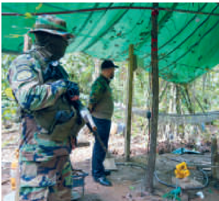
Último operativo antidroga en el trópico de Cochabamba.