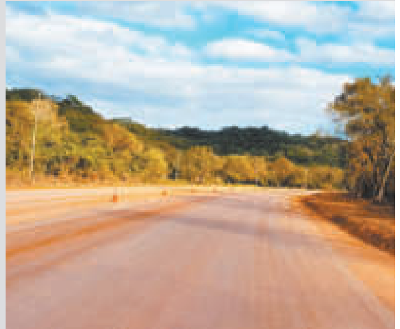
La ejecución de la carretera permitiría la integración de varias comunidades.