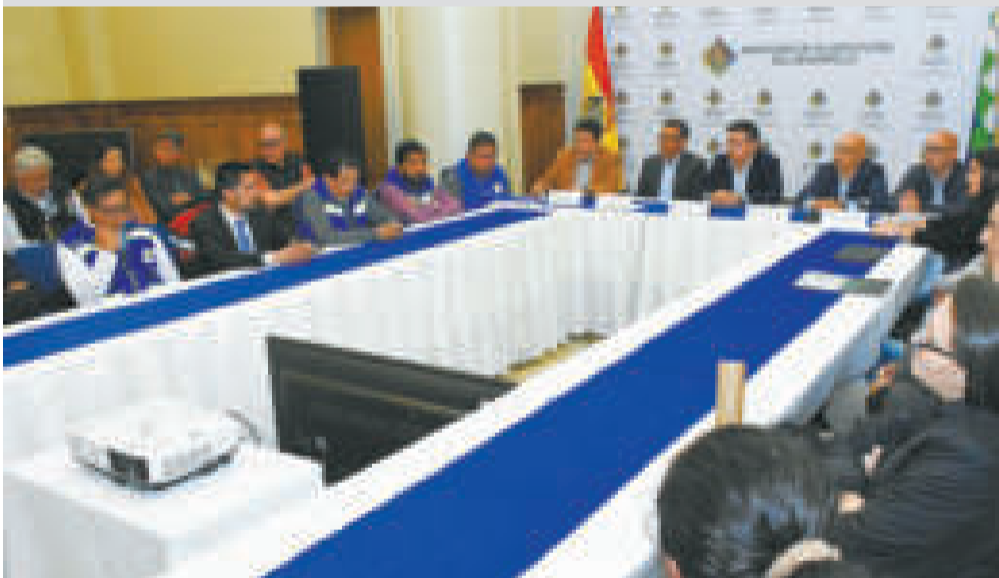
El primer día del diálogo técnico entre el Gobierno nacional y la gobernación cruceña, en La Paz.