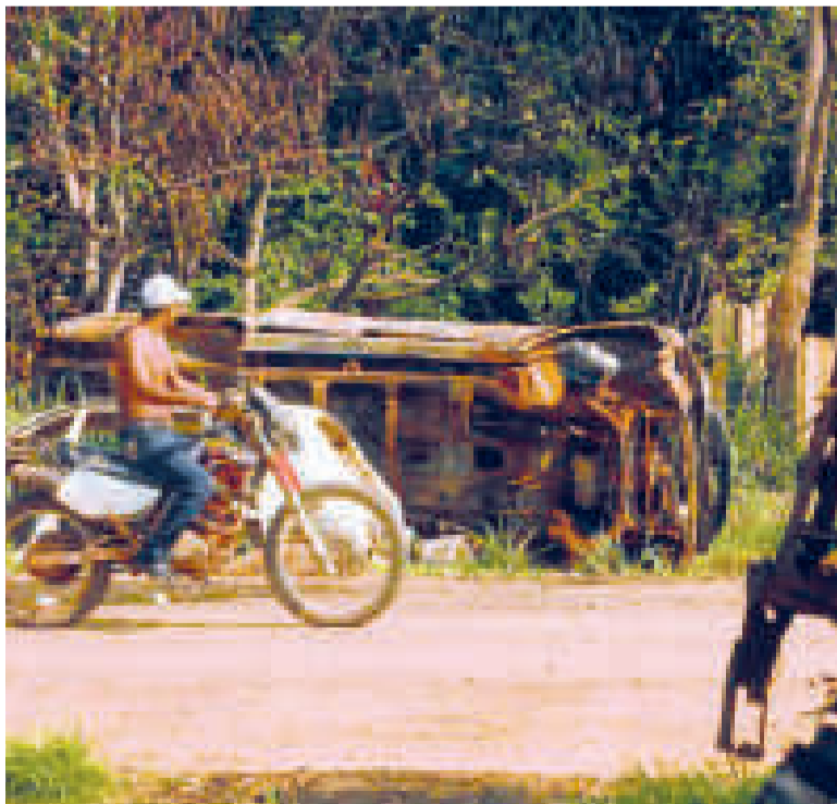
Vehículos quemados son mudos testigos de lo que pasó en Porvenir en 2008.