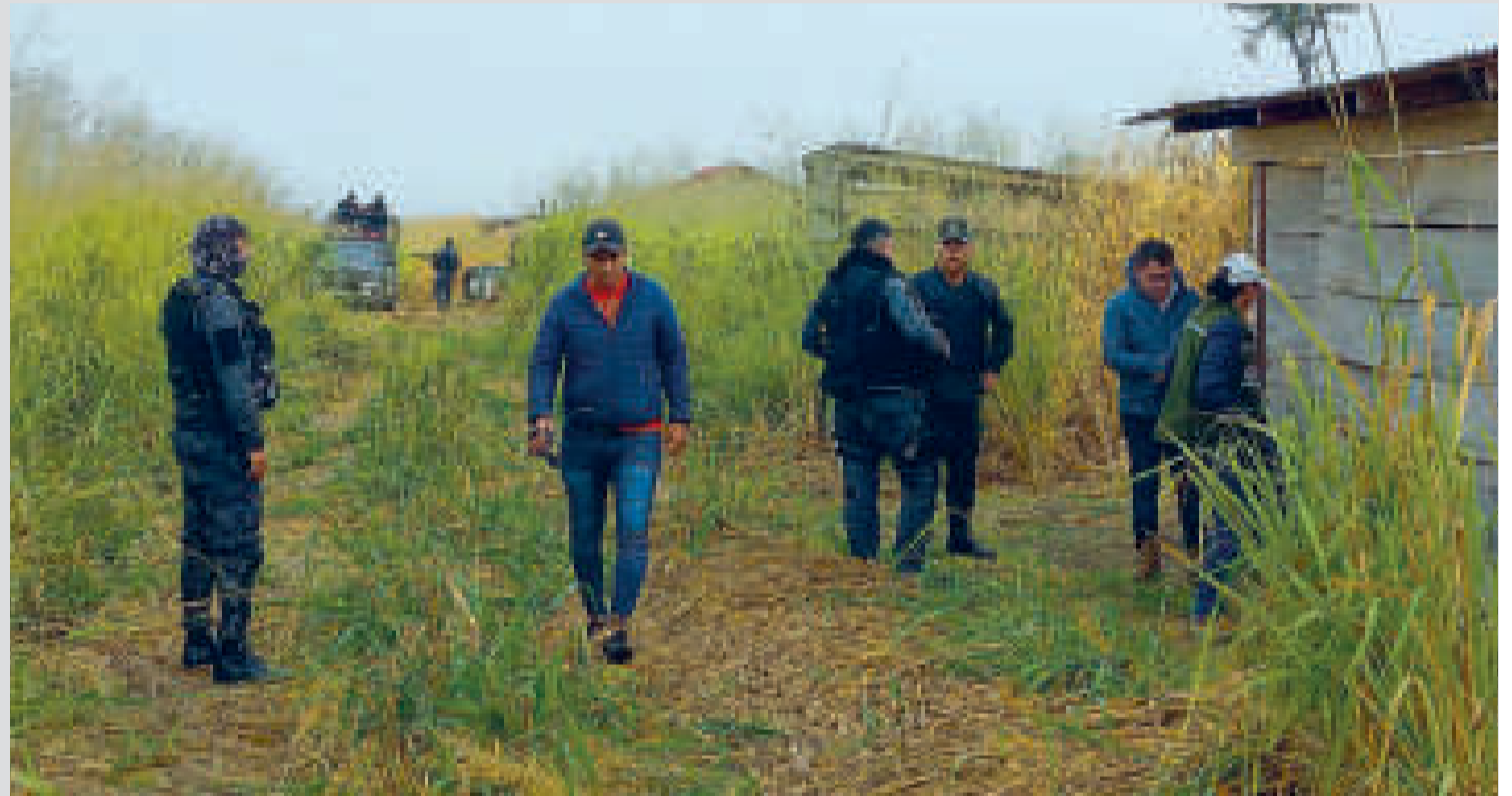
Operativos de búsqueda en el Beni a cargo de la Policía Boliviana.

La autoridad recordó que los funcionarios del Servicio de Registro Cívico (Serecí) de Santa Cruz, y Migración, en Beni, son investigados por la entrega de documentación falsa a Marset