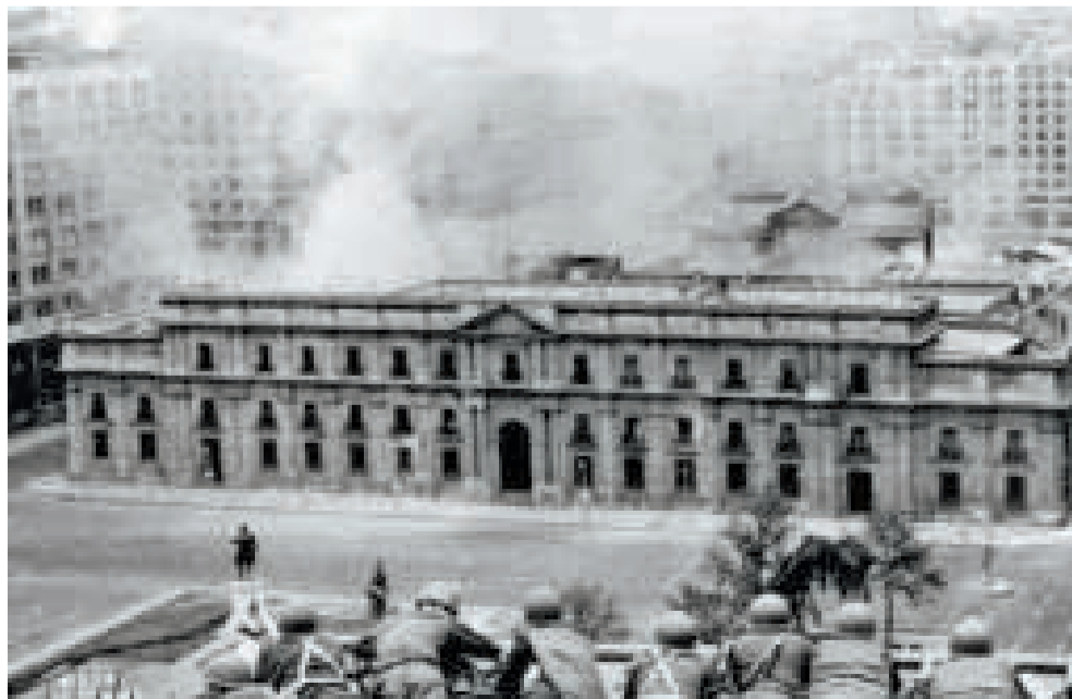
La Moneda ardiendo tras el bombardeo ordenado por Augusto Pinochet.

Medio siglo después del golpe militar, Chile aún está dividido entre los que defienden y repudian la dictadura.