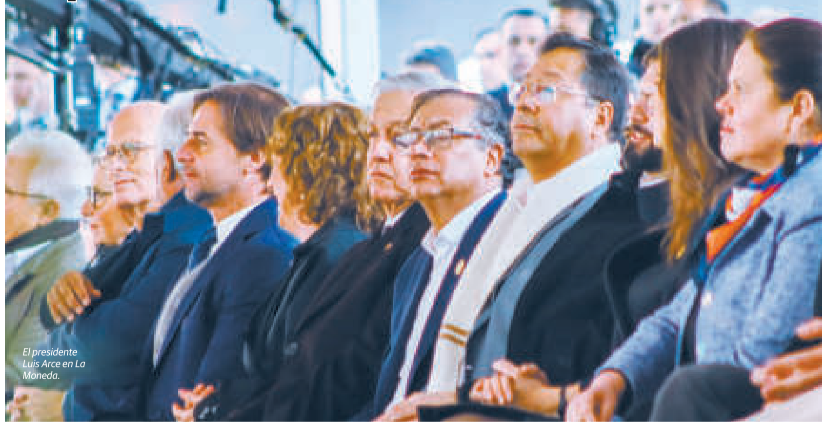
El presidente Luis Arce en La Moneda.

chileno, estuvieron en la ceremonia de homenaje.