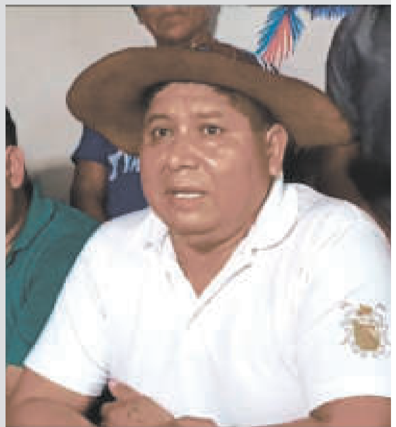
La dirigencia de la Cidob en conferencia de prensa.

La Paz y el MAS Urbano de Santa Cruz analizan su participación en el congreso ordinario. Es más, en el oriente se llevará a cabo un ampliado para definir una posición oficial.