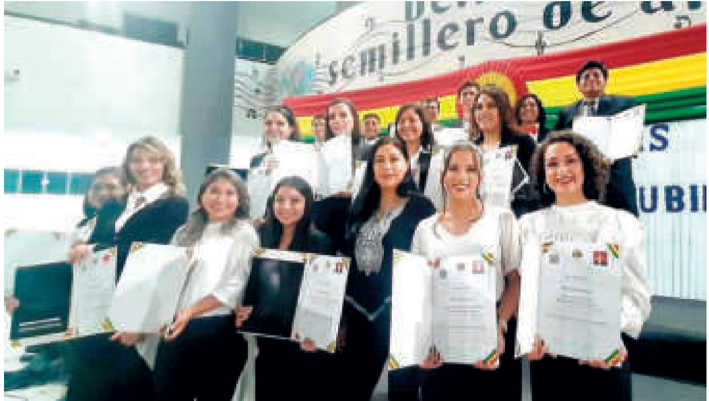
Los creadores durante uno de los actos de entrega.

“Si bien el arte va mucho más allá de una colección de diplomas, este gran paso consolida la formación artística como una profesión reconocida socialmente y legalmente por el Estado. Es un primer paso para fortalecer las industrias culturales, cuyos