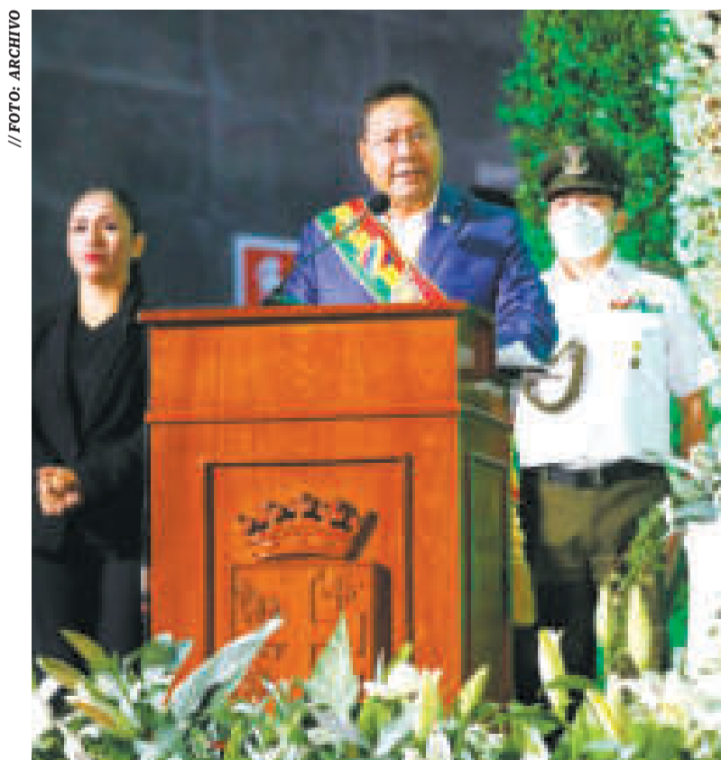
El presidente Arce en la Sesión de Honor municipal de Santa Cruz, en 2022.