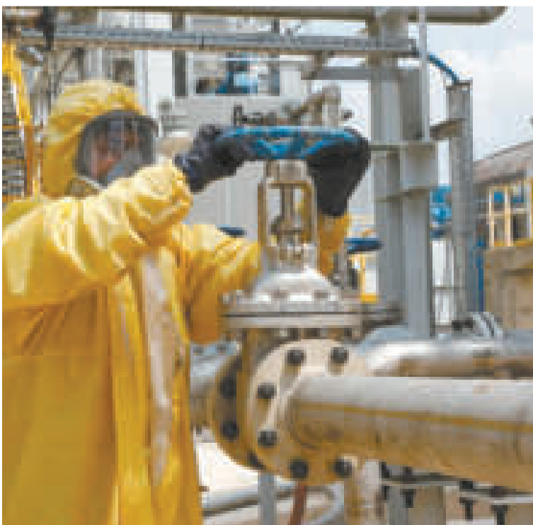
Ductos de gas operados por YPFB.