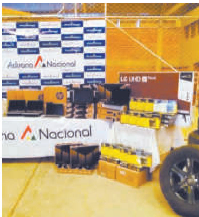
Los productos que podrán ser adquiridos a través de la subasta.

La Subasta Ecológica consiste en la participación de una persona o empresa con licencia ambiental que se adjudica un lote para reutilizarlo como materia prima en nuevos emprendimientos. Los interesados pueden acceder por medio de la dirección http://anbsw04.aduana.gob.bo:7777/subastaEcologica/