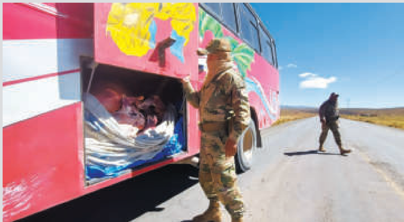
Un militar ejecuta labores de control a un bus en una carretera internacional.

El 65% del contrabando que ingresa a territorio nacional lo hace por la frontera con Chile, entre vehículos, ropa usada, línea blanca y otros.