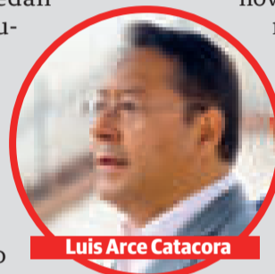
Luis Arce Catacora

“Cuando se logra impulsar la ciencia, la tecnológica e innovación podrán tener un aporte mucho mayor que el que se tiene hoy, no solo ser meros generadores de materias primas para los países industrializados”, apuntó Sánchez, quien luego recordó que a pesar del bloqueo económico de Estados Unidos, el país caribeño fue una de las pocas naciones que logró desarrollar vacunas contra el Covid-19.