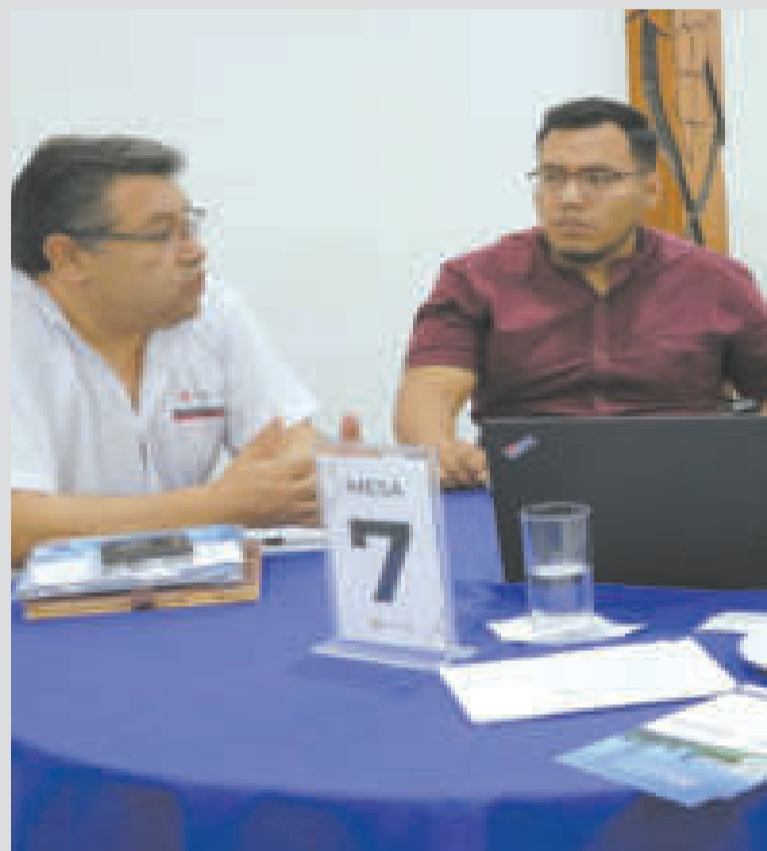
Empresarios durante la rueda de negocios binacional.

“Sí, la visita es de Ecuador a Bolivia, pero en el momento de hacer los negocios se va a producir el comercio de ida y vuelta, y ambos saldremos beneficiados. Seguimos explorando el mercado boliviano para tener un networking más directo”, agregó.