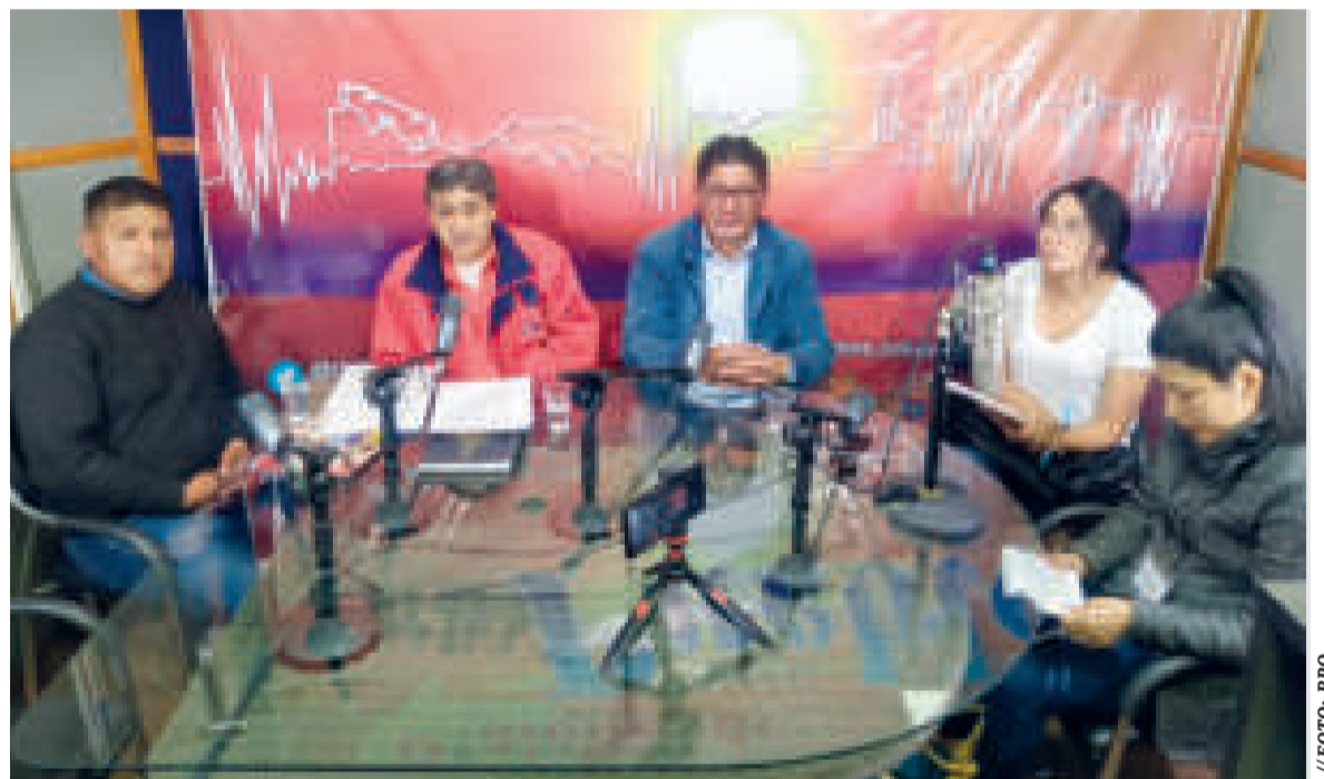
El viceministro Magín Herrera (centro) y representantes de sectores sociales en el programa 'Dialogando con el pueblo', de las RPO.

“Con toda esa documentación se va a construir una ponencia, una posición de Bolivia para finalmente tener una participación de jóvenes de Bolivia en Panamá para que allá, entre países, se coordine y salga una posición más o menos homogeneizada y de carácter regional latinoamericano, la cual vaya a ser transmitida a través de la