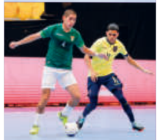
Das incidencias del encuentro de fútbol.