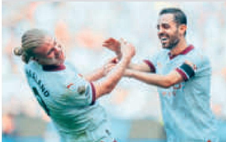
Erling Haaland y Silva celebran el triunfo del Manchester City

El partido fue una pesadilla para el Manchester United, que unió el revés ante el Brighton, que hace tiempo dejó de ser una sorpresa y una novedad en la competición para asentarse como realidad, a los sufridos antes contra el Tottenham y el Arsenal. Ahora el equipo de Roberto de Zerbi se acomoda en la parte baja de la tabla.