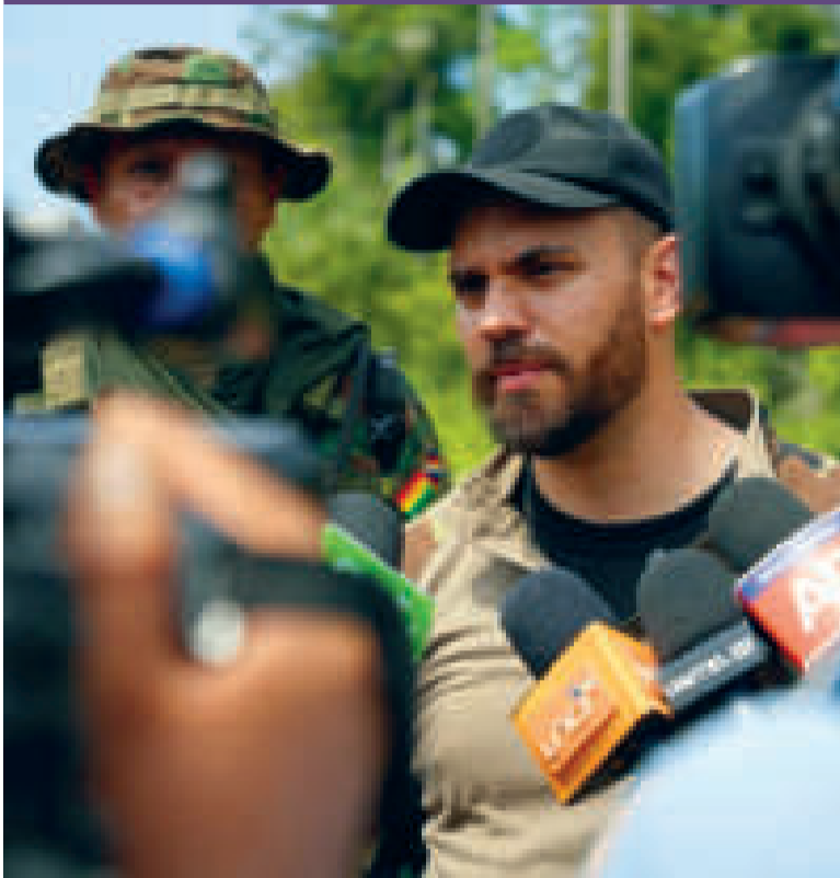
El ministro de Gobierno, Eduardo Del Castillo.