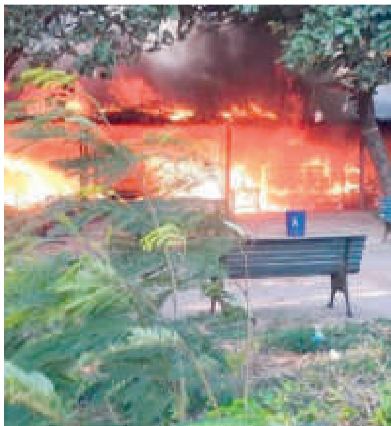
Arden los puestos de venta.

De acuerdo con algunos testigos presenciales del lugar de los hechos, no es la única vez que ocurre este tipo de siniestros, porque la mayoría de las casetas presenta instalaciones de electricidad precarias que provocan cortes circuitos.