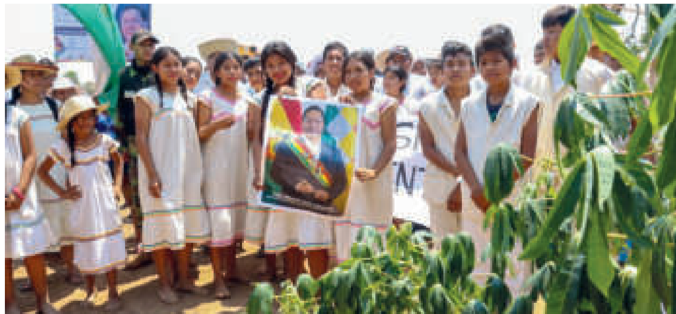
Niños de San Miguel de Velasco en el acto del inicio de construcción de la Planta Procesadora de Yuca.