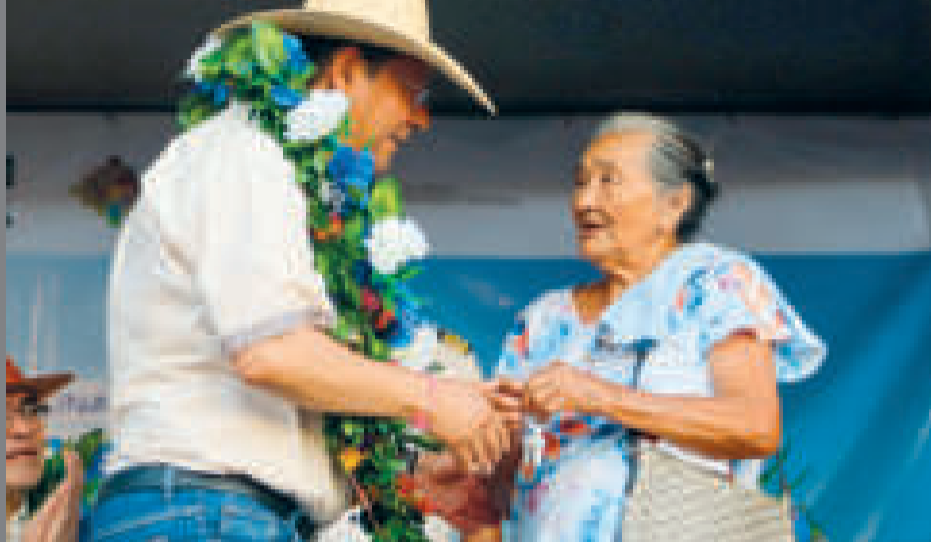
El presidente Luis Arce entrega las llaves de una vivienda a una beneficiaria de San Matías.

Explicó que instruyó llegar a todos los municipios con problemas de déficit habitacional para proporcionar una “vivienda digna”.