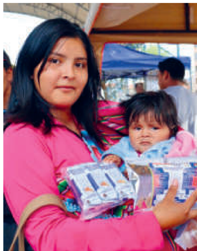
Una madre beneficiada con el subsidio entregado por el Sedem.

La madre en las etapas mencionadas presenta un elevado requerimiento de energía y nutrientes, como proteínas de alto valor biológico, ácidos grasos esenciales, fibra dietética, vitaminas liposolubles e hidrosolubles, minerales críticos, particularmente calcio, hierro y fitonutrientes, explicó.