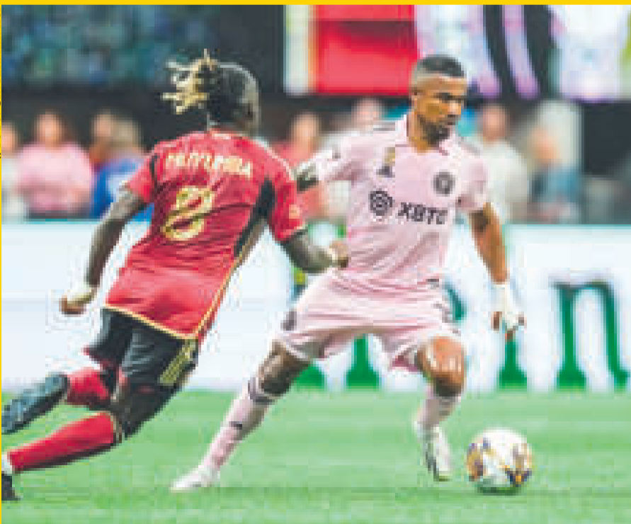
Una escena del encuentro entre el Inter Miami y el Atlanta United.