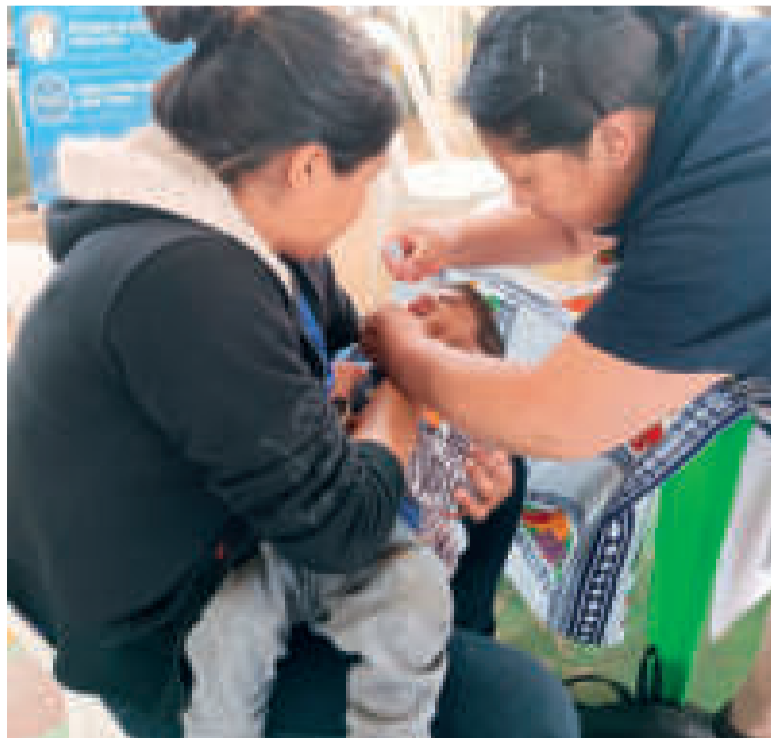
Niños y adultos reciben atenciones médicas.