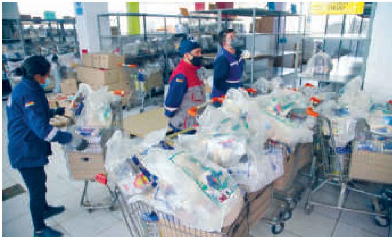
Los productos del paquete alimenticio para el subsidio de Lactancia y el Prenatal, equivalentes a Bs 2.000.

El Subsidio de Lactancia es la entrega a la madre, que tiene seguro social a corto plazo, de productos alimenticios con alto valor nutritivo, nacionales, equivalente a Bs 2.000, acorde a la normativa vigente, por cada hija o hijo nacido vivo, desde la afiliación del menor al ente