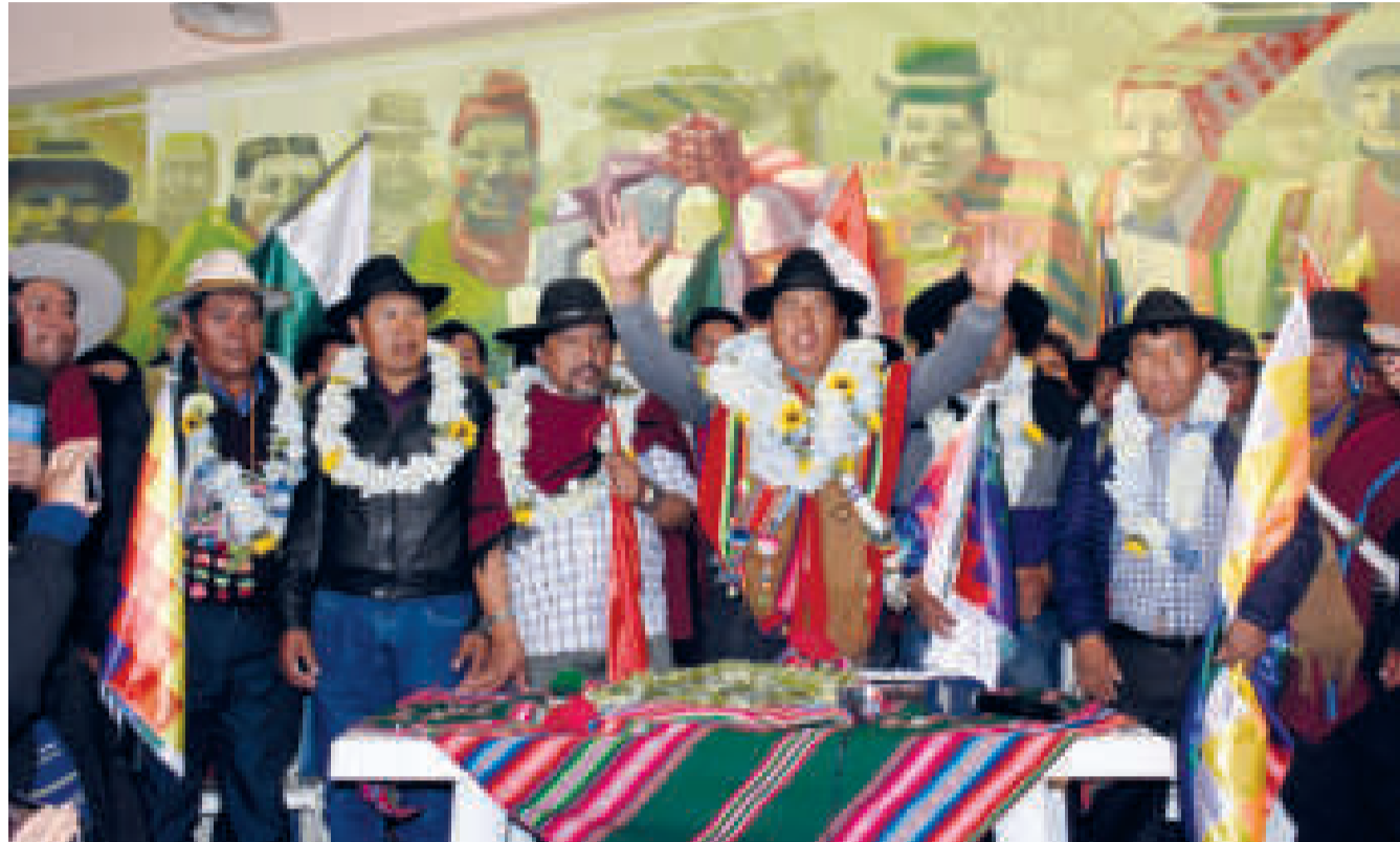
La dirigencia ejecutiva de la Confederación Sindical Única de Trabajadores Campesinos de Bolivia.

Los que confirmaron su declinación por considerarlo ilegal y discriminatorio al congre-