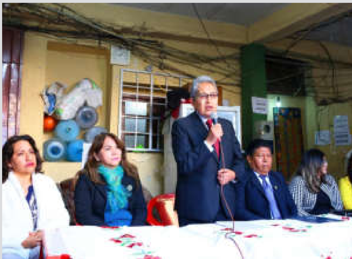
El magistrado por Cochabamba y decano del Tribunal Supremo de Justicia, Esteban Miranda.

La actividad fue encabezada por el magistrado electo por Cochabamba, Esteban Miranda, quien destacó el trabajo coordinado con los operadores de justicia, que permite posibilitar el descongestionamiento carcelario en ese departamento.