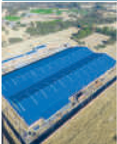
La planta NPK en Santiváñez.