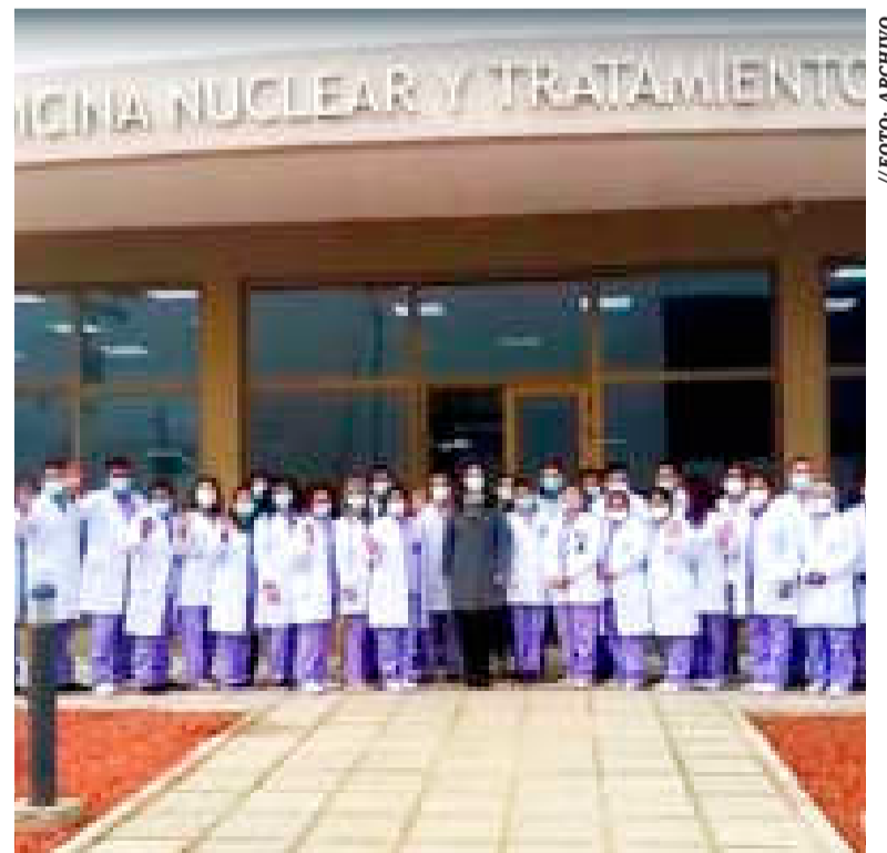
El Centro de Medicina Nuclear y Radioterapia de la ciudad de El Alto.

Para 2023, el Sistema Nacional de Residencia Médica lanzó en una primera convocatoria 968 plazas y para esta convocatoria extraordinaria asigna 68 plazas, haciendo un total de 1.036 espacios.