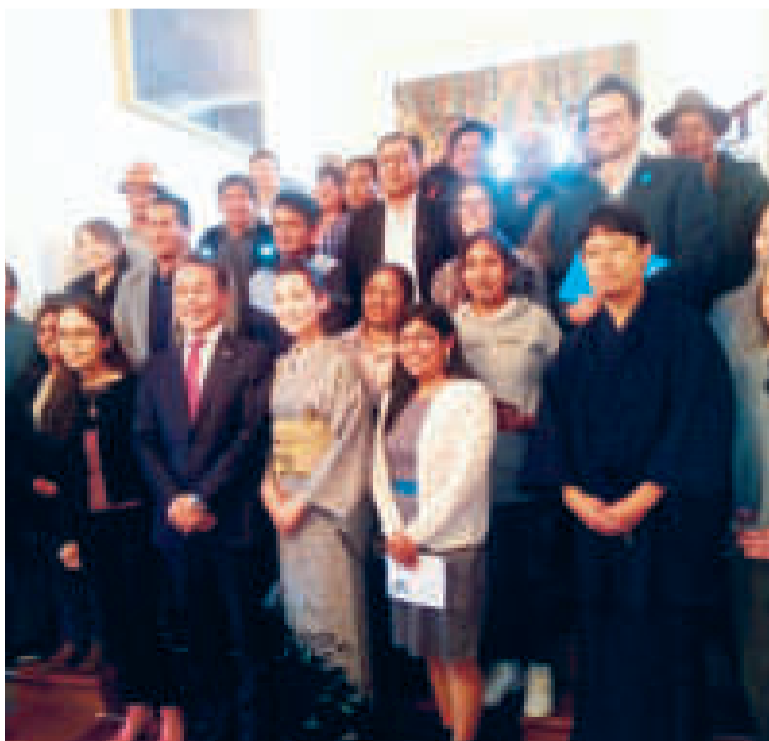
El embajador de Japón Hiroshi Onomura en un evento oficial.