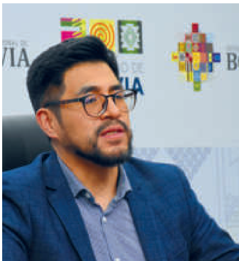
El viceministro de Pensiones y Servicios Financieros, Franz Apaza.