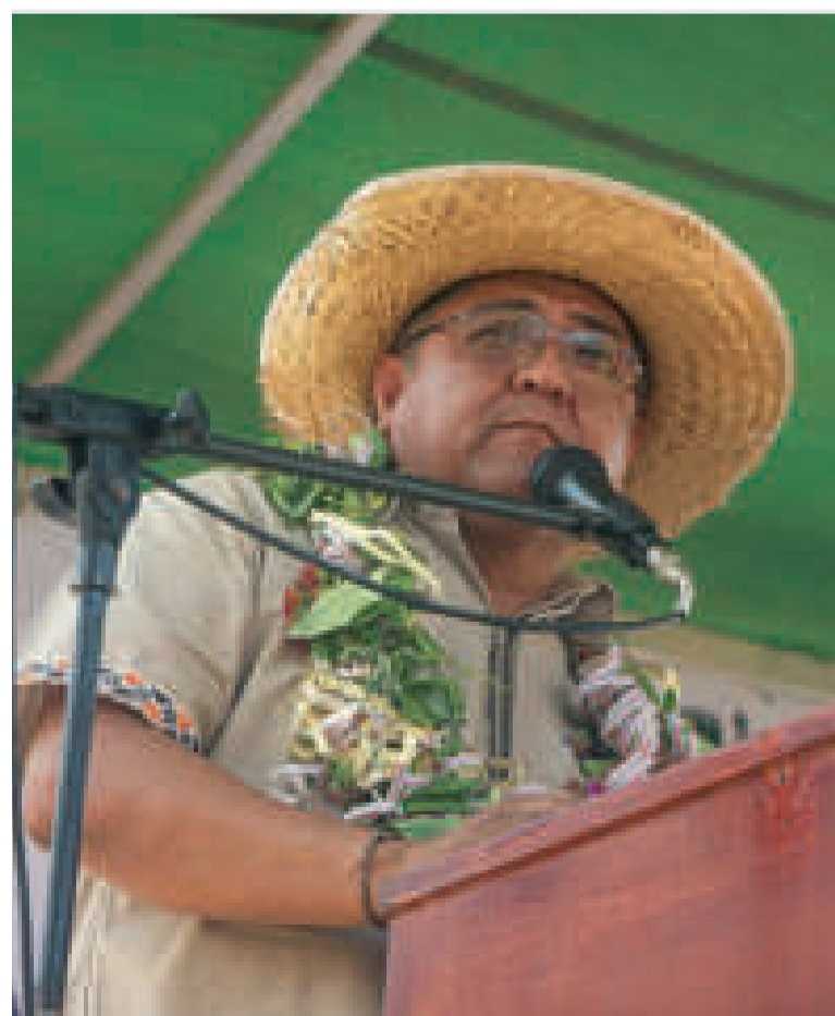
El ministro de Desarrollo Rural y Tierras, Remmy Gonzales, durante una entrega.