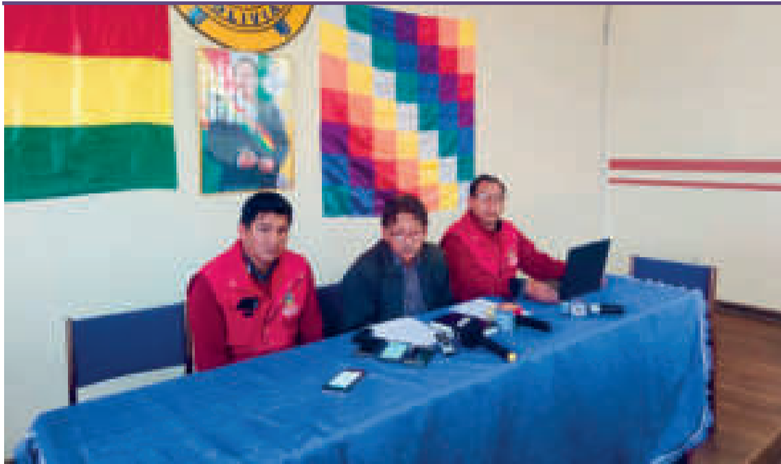
El ministro de Minería y Metalurgia, Marcelino Quispe, en conferencia de prensa.