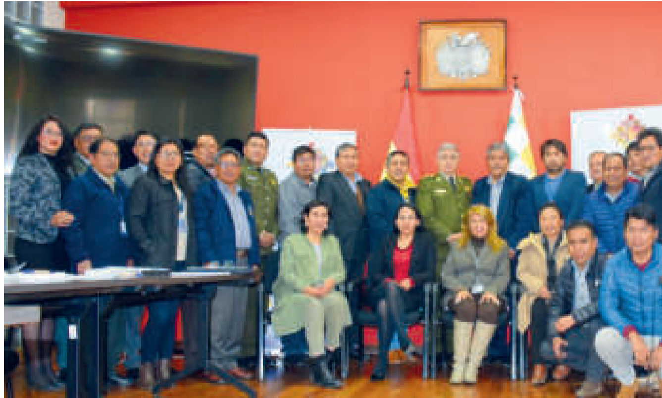
Las autoridades y expertos que asistieron a una de las reuniones del programa de acreditación universitaria.

Otra de las puertas que se abren, gracias a esta iniciativa, es la participación de estudiantes, docentes y otros participantes de la comuni-