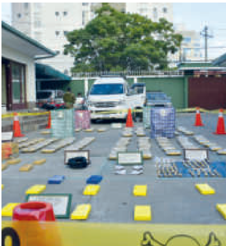
Droga decomisada expuesta en la FELCN.