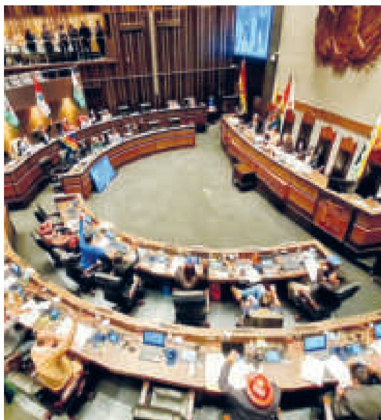
Plenario de la Cámara de Senadores.

En ese marco, destacó el trabajo que realizaron las misiones diplomáticas del país para lograr que Bolivia reciba este año la invitación del presidente sudafricano, Cyril Ramaphosa, quien preside el Grupo de los BRICS, para que el presidente Luis Arce participe en la reunión ampliada de la 15° Cumbre del Grupo. “En términos estratégicos es un importante espacio para el despliegue de la política exterior de Bolivia”.