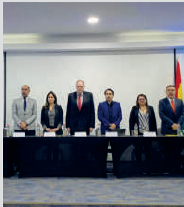
La reunión se desarrolló en la ciudad de Arica, Chile.

“Hay muy buenos avances, consideramos que muy pronto vamos a tener abierto este punto fronterizo. Migración de Bolivia ya está allá, y Chile nos va a dar información de cuándo volverá a tener su migración en ese punto”, dijo.