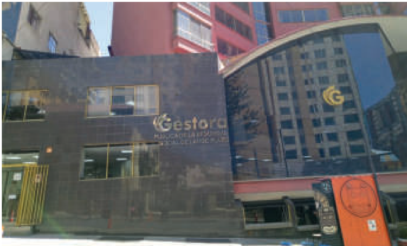
Muchos asegurados evitan ir a la Gestora por la comodidad de la aplicación.

Además en la aplicación se puede encontrar el estado de ahorros previsionales para que uno pueda saber cuánto aportó a lo largo de los años.