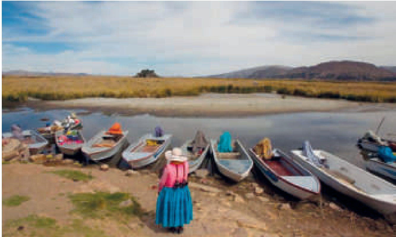
Los niveles del lago Titicaca sobrepasaron su mínimo histórico.

Según la autoridad, el Plan Jóvenes en Acción por el Lago Titicaca pretende fortalecer el liderazgo de los actores locales a través de la implementación de procesos de capacitación en las siguientes temáticas: uso eficiente del agua, saneamiento básico, pago de tarifas para operación y mantenimiento, manejo de residuos en los hogares, preservación y mitigación del cuidado del medio ambiente,