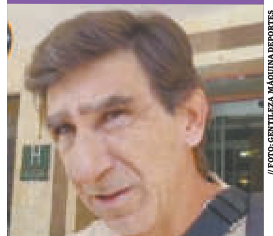
Gustavo Costas, técnico de la Selección.