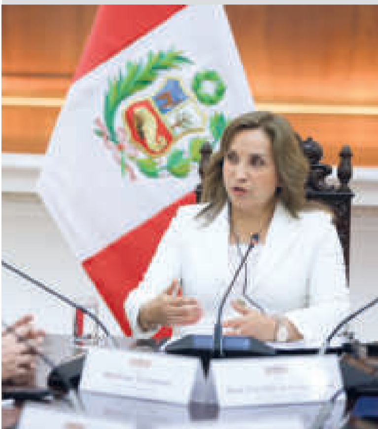
Se denunciaron violaciones de los derechos humanos durante la represión.