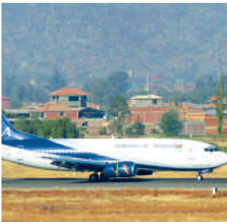
Se amplían los servicios de Boliviana de Aviación.