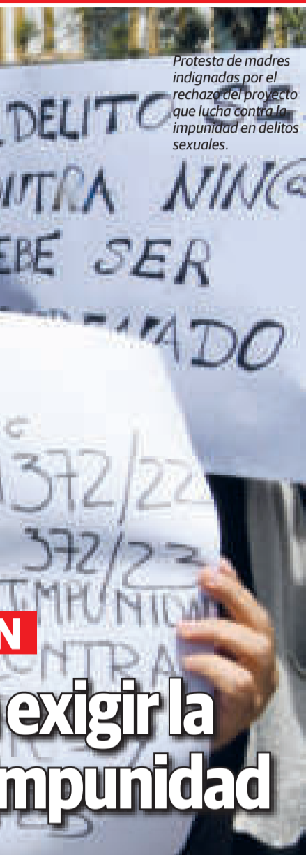
Protesta de madres indignadas por el rechazo del proyecto que lucha contra la impunidad en delitos sexuales.