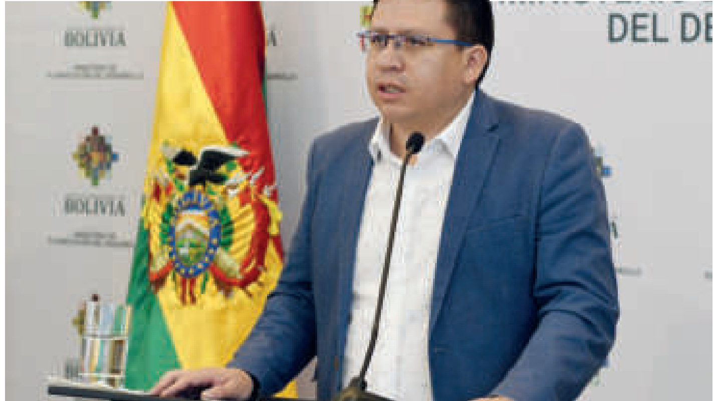
El Ministro de Planificación del Desarrollo en conferencia de prensa.

También se puede destacar el proyecto de ley de aprobación de contrato de préstamo suscrito con la CAF para el financiamiento del Programa