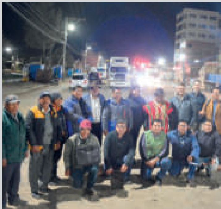
Representantes del PNUMA y del proyecto RTIE.

ción física y financiera de la gestión 2023.