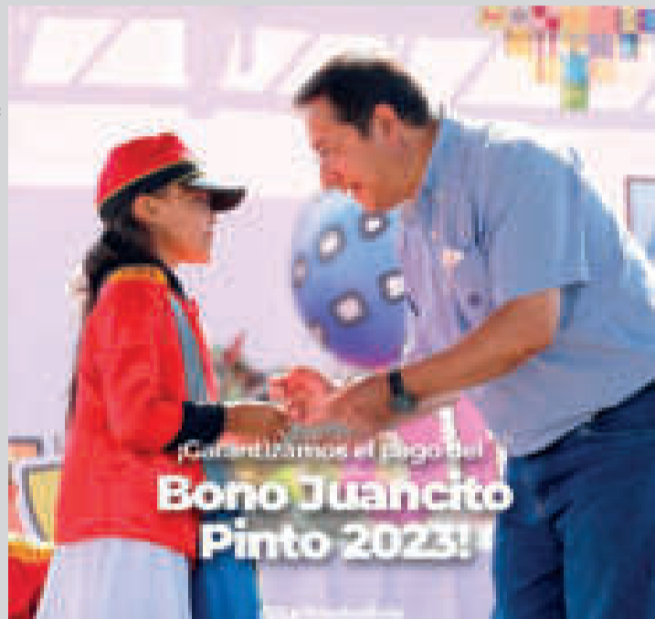
El Jefe de Estado dio a conocer la promulgación del decreto que encamina el pago.

y Finanzas Públicas transferir al Ministerio de Educación el monto total de Bs477.000.000.- (CUATRO CIENTOS SETENTA Y SIETE MILLONES 00/100 BOLIVIANOS), previa solicitud del Ministerio de Educación”.