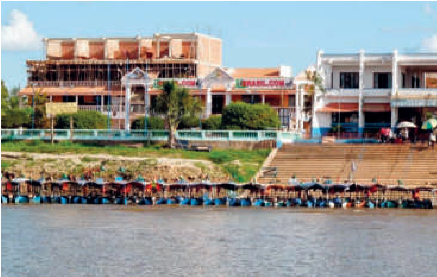
Guayaramerín se encuentra en la frontera con Brasil, a orillas del río amazónico Mamoré.