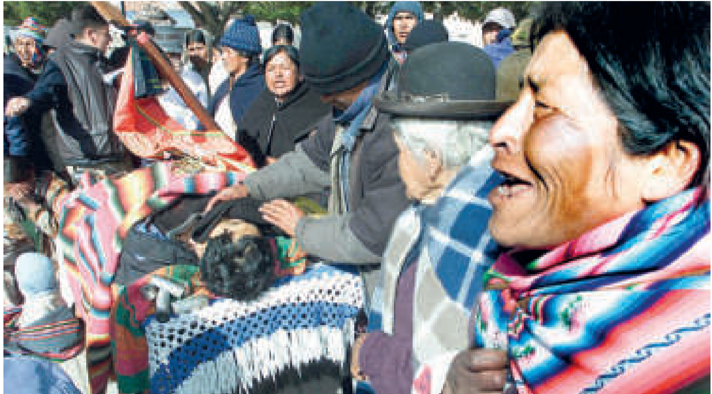
Hechos luctuosos registrados en octubre de 2003, en defensa del gas boliviano.

Becker, emocionado hasta las lágrimas, afirmó que lo ocurrido es un hecho sin precedentes. “Ahora se manda el