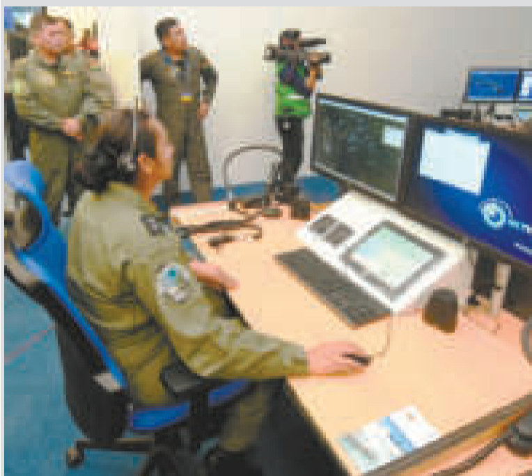
Centro de Mando y Control de la Defensa Aérea de Bolivia.