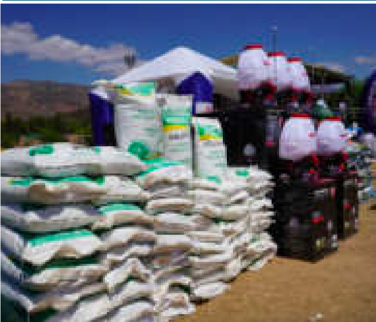
Productos agrícolas para potenciar la producción.