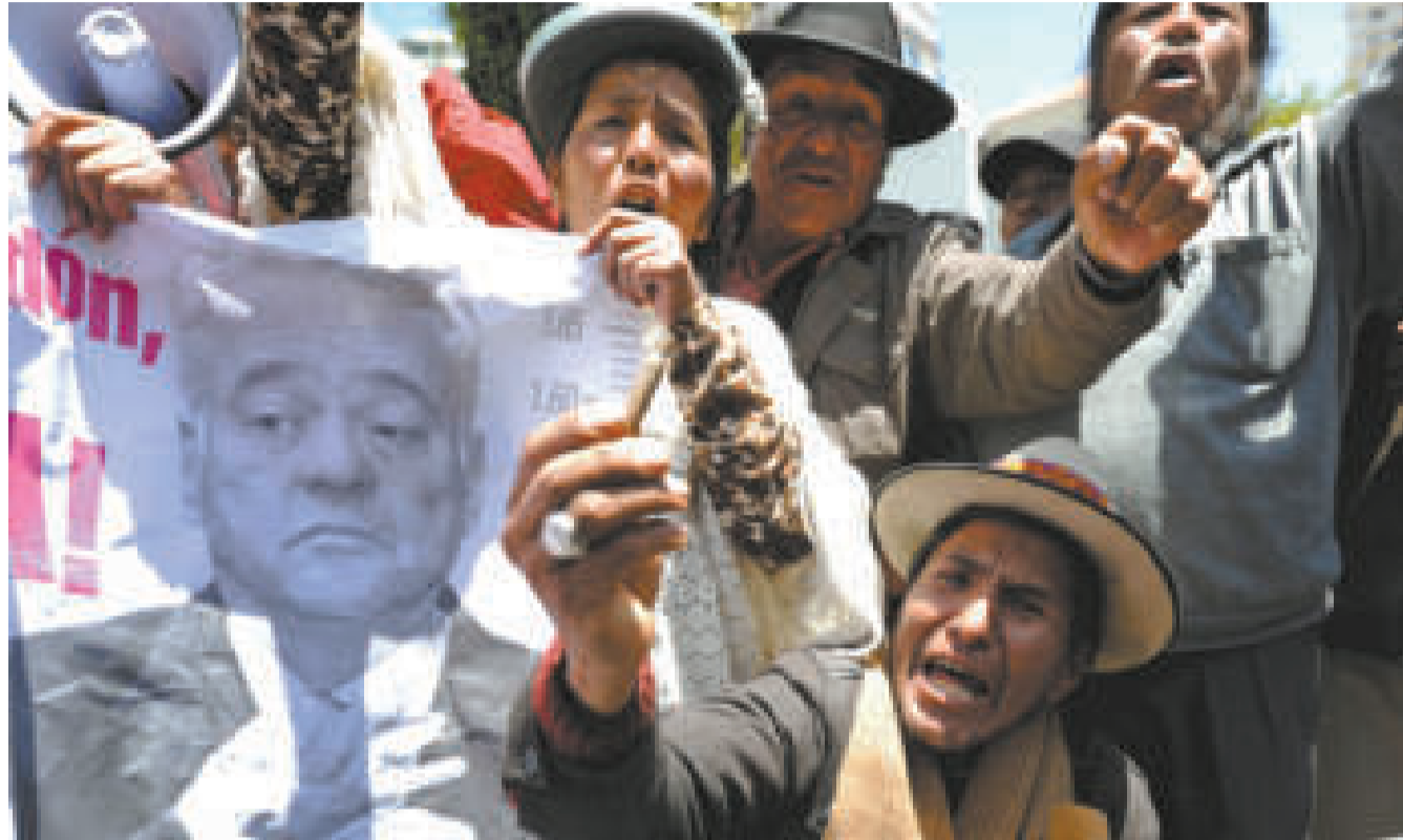
Familiares de las víctimas de Octubre Negro o la denominada Guerra del Gas hoy piden que Goni sea extraditado.