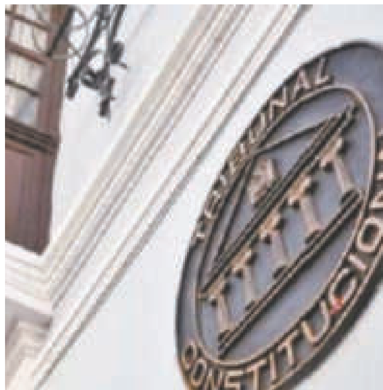
Logo del TCP en su edificio en Sucre.

DÍAS ES EL PLAZO QUE SE TOMARÁ EL TCP para una determinación.