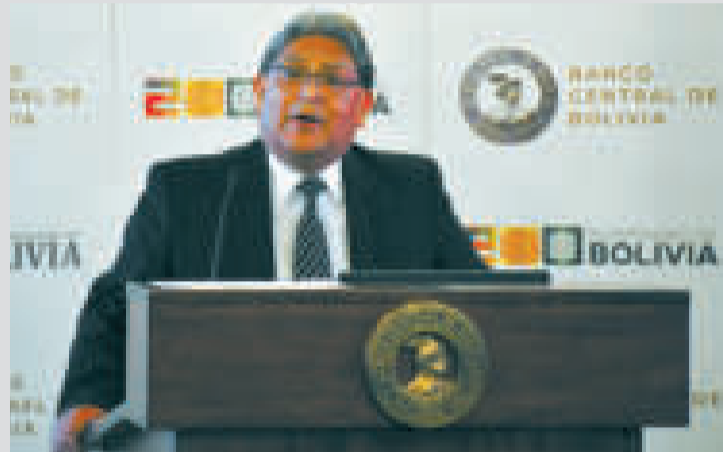
Presidente del BCB, Edwin Rojas.

El Banco Central de Bolivia (BCB) informó que, producto de una exitosa gestión realizada en Beijing, República Popular China, se propició la llegada del Industrial and Commercial Bank of China (ICBC) y del Bank of China, los dos bancos más grandes de dicho país.