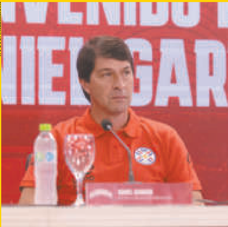
Daniel Garnero, técnico de la selección paraguaya.