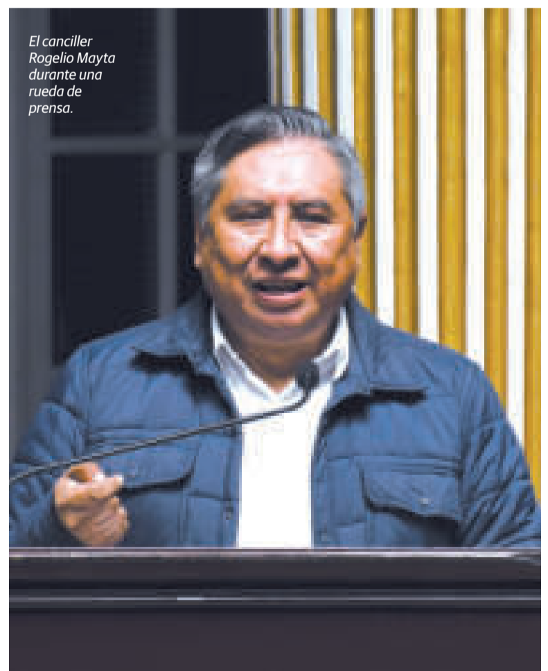
El canciller Rogelio Mayta durante una rueda de prensa.

Sin embargo, hoy ya suman las voces que instan al Gobierno boliviano a iniciar el proceso de extradición del exmandatario Goni y del Zorro Berzaín.