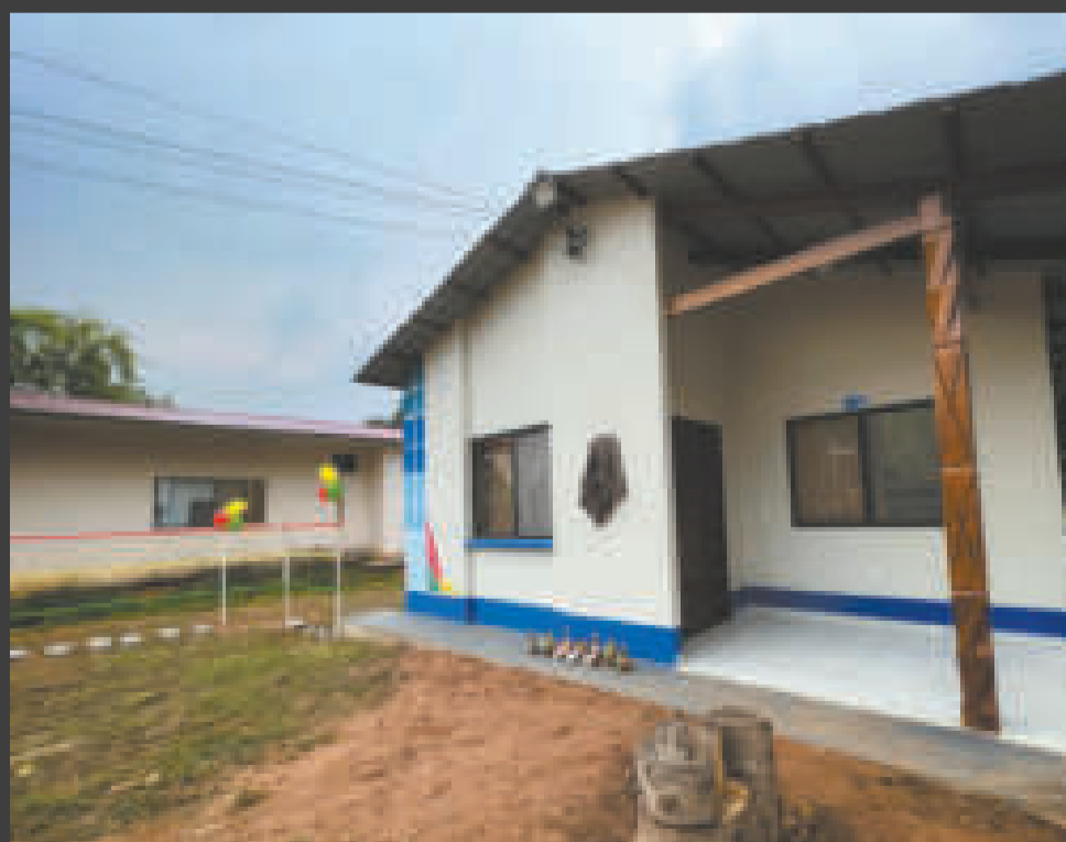
El diseño de las viviendas fue mejorado para el contexto pandino.