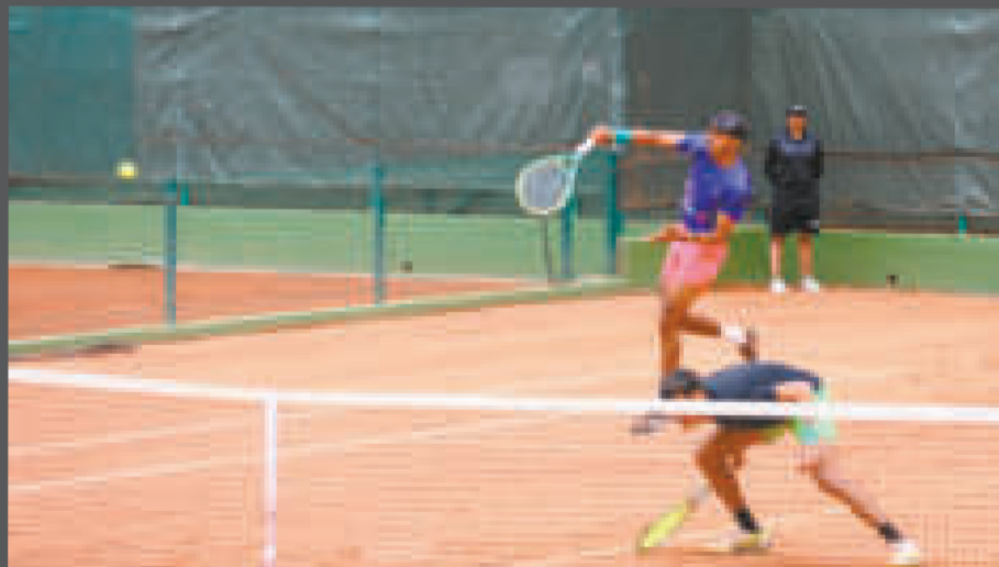
La dupla boliviana quedó fuera de competencia del Challenger Bogotá de tenis.

En la segunda cancha su servicio fue roto en dos oportunidades,