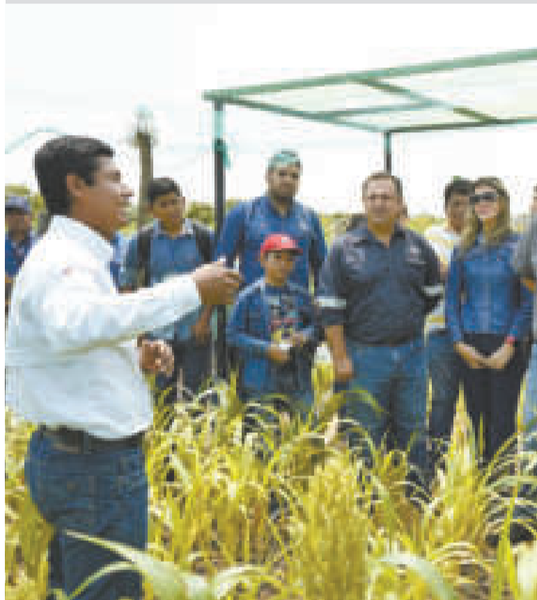
La actividad de la estatal petrolera por el Día de Campo.