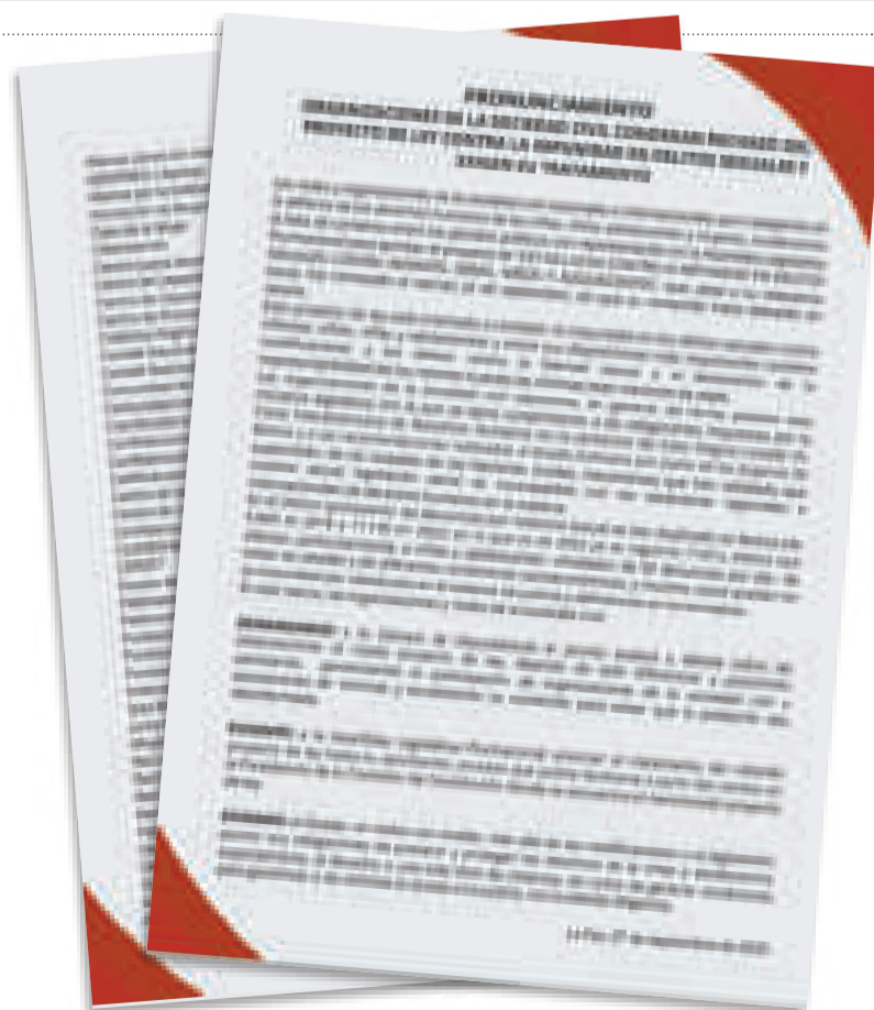
Pronunciamiento de las organizaciones civiles y sociales.

Para el lunes, madres y comités de niños del país marcharán en La Paz para exigir a los legisladores aprobar dicha norma ante la ola de violaciones que se registra en Bolivia y que vulnera el derecho del sector.