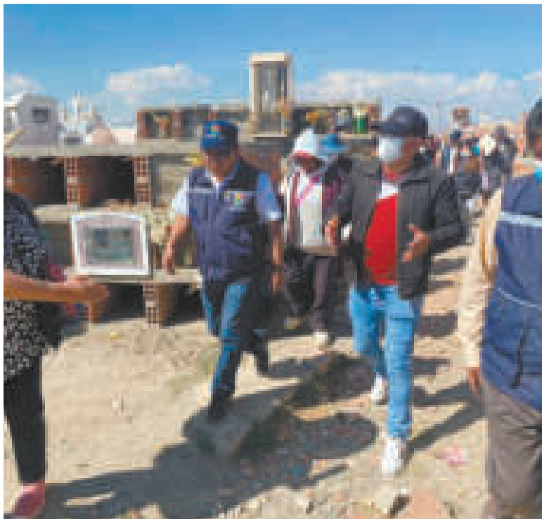
El defensor del pueblo, Pedro Callisaya, durante su visita al cementerio.