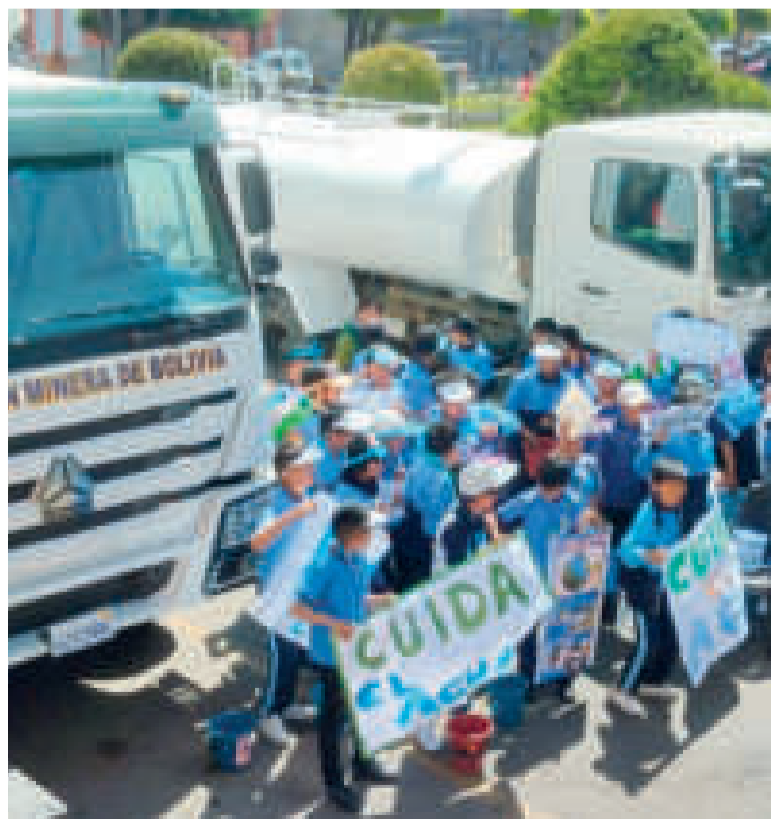
Una de las volquetas entregadas.

Señaló que la Comibol está comprometida con la preservación morfológica del Cerro Rico. Dijo que con fondos y créditos propios la Corporación realiza la entrega de estos tres vehículos nuevos, además de un carro cisterna refaccionado para continuar con el relleno con material seco en los hundimientos identificados en la cúpide.