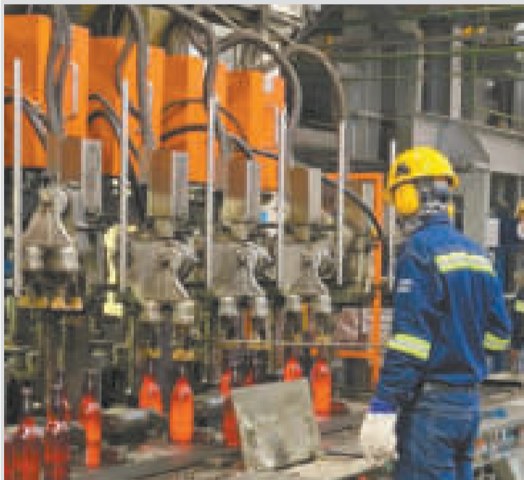
Trabajador de Emvibol.