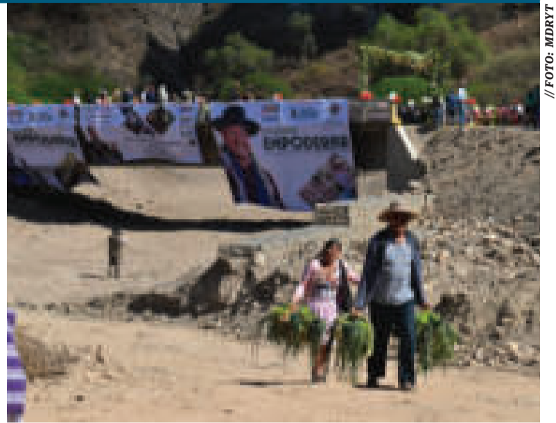
Los puentes integran las comunidades productoras con los mercados.

El encuentro, que apunta a fortalecer los lazos de cooperación institucional, se realizó en el marco del Memorando de Entendimiento entre el Gobierno del Estado Plurinacional de Bolivia y el Gobierno de la República Popular China, referente a la cooperación dentro de la iniciativa de la Franja Económica de la Ruta de la Seda y Ruta Marítima de la Seda del Siglo XXI.