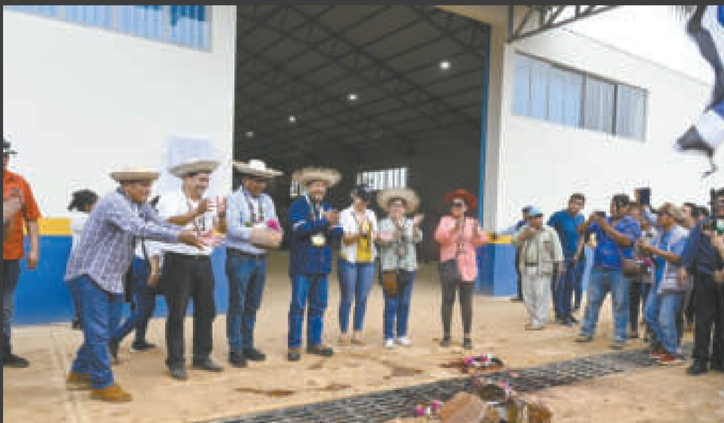
Autoridades en la tradicional ch'alla del nuevo galpón de Zofra Cobija.

Huanca afirmó que se beneficiará a 650 familias recolectoras de frutos silvestres, que podrán vender a precios justos.