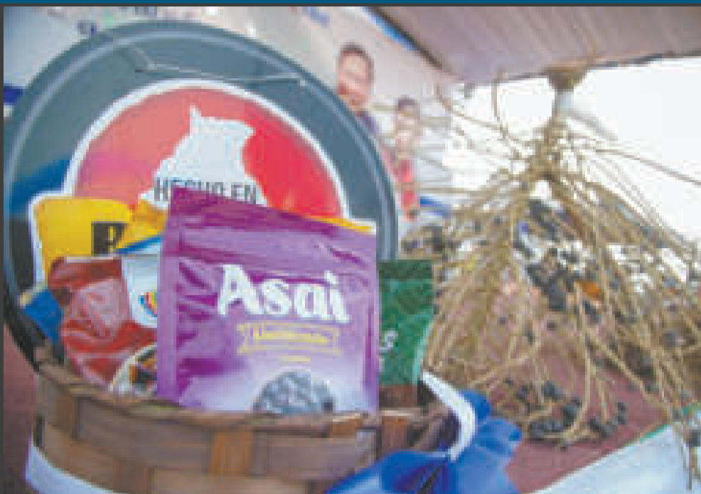
Los frutos amazónicos tendrán un valor agregado con la nueva planta.

“Podemos decir mucho, pero no hacer nada. Nosotros decimos poco y hacemos obras”.