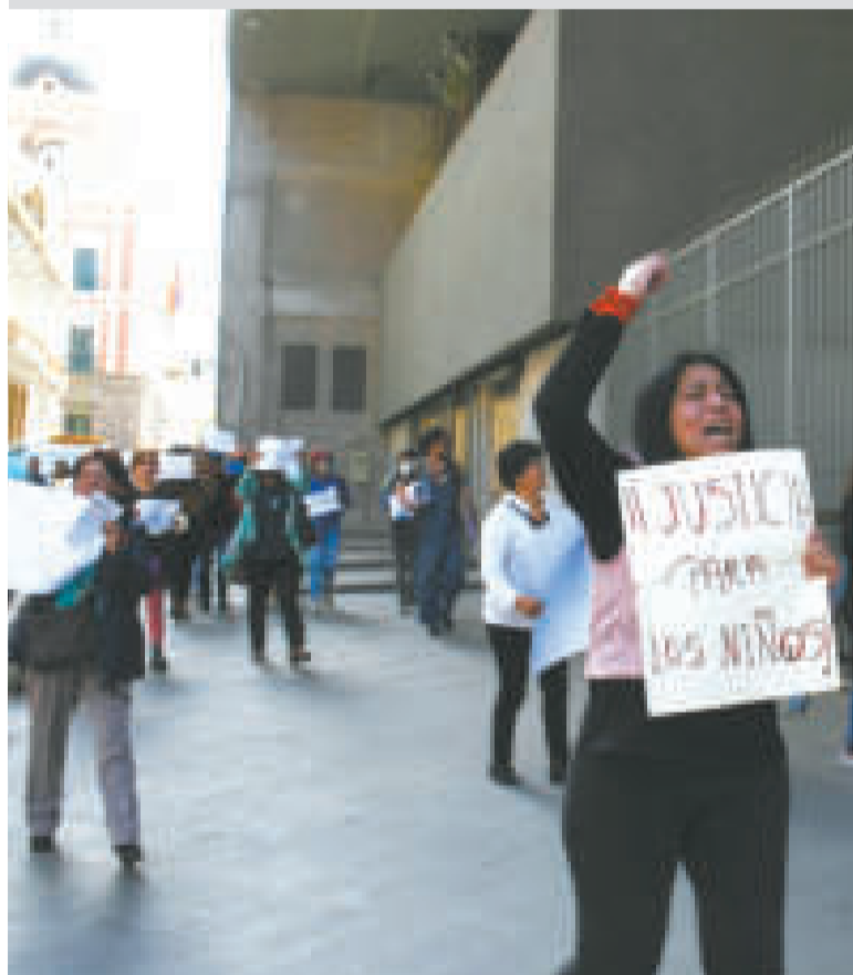
Marcha de padres en repudio al rechazo del proyecto de lucha contra la impunidad.