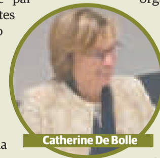
Catherine De Bolle

N, Sjoerd Top. “Conversamos e intercambiamos experiencias sobre la cooperación y el trabajo mancomunado en la lucha contra el crimen organizado”, posteo la autoridad.