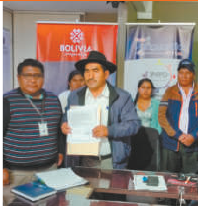
Autoridades y representantes, durante la rúbrica.

“Vamos a analizar en un ampliado, no pueden hablar de todo El Alto, están provocando a todo El Alto, están equivocados. Ellos no tienen pues federación, es como una gallina sin guato que están andando; entonces, no conocen el tema sindical, lo orgánico. En el ampliado vamos a analizar para defender nuestra área de trabajo”, sostuvo Luna en un contacto con Unitel.