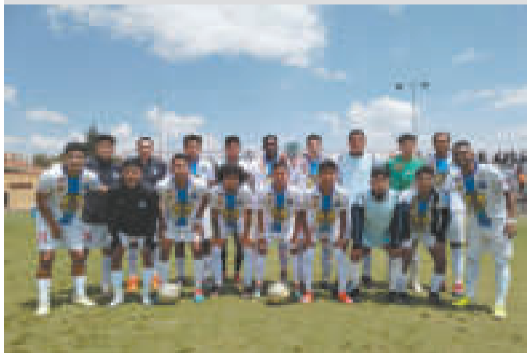
Equipo de Hiska Nacional, club que aspira llegar a la División Profesional.

Hoy se reanuda la Copa Simón Bolívar con la disputa de ocho partidos: 24 de Septiembre vs. Real Majapo; CD Real Oruro vs. Deportivo Municipalidad; Hiska Nacional vs. Nacional Sucre; Real Mizque vs. Stormers; Torre Fuerte vs. Pasión Celeste; Fatic vs. Sur Car; Atlético Bermejo vs. San Lorenzo, y CD Alemán vs. ABB.