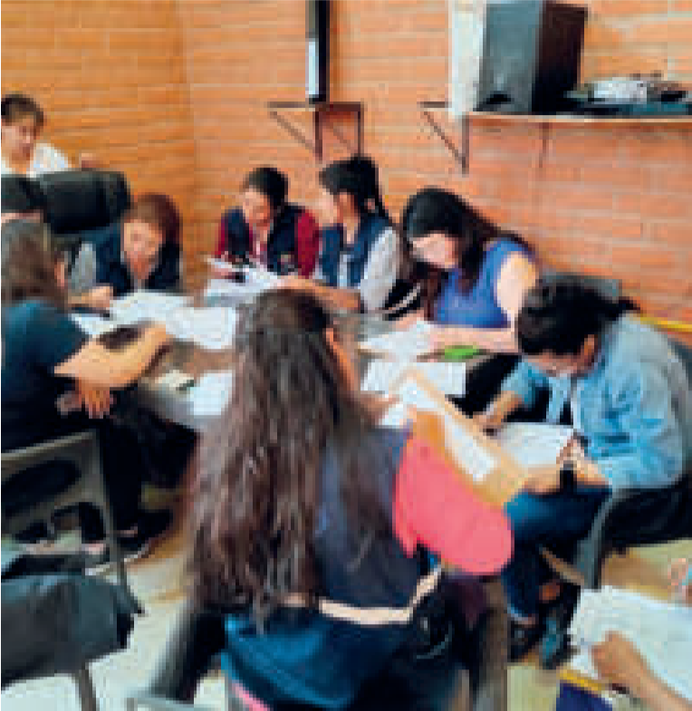
Equipo técnico hace relevamiento de casos.