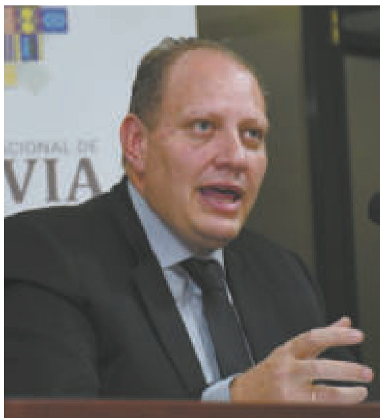
El viceministro de Comercio Exterior, Benjamín Blanco.

Este proyecto se impulsa en el marco del Tratado de Petrópolis de 1903, que garantiza a Bolivia la “libre navegabilidad en toda la frontera común”, la cual, a su vez, permitirá a Bolivia la facilitación del comercio y se constituirá en una alternativa de salida de Bolivia hacia el océano Atlántico, vía Porto Velho.