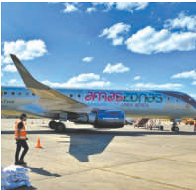
La aerolínea tiene suspendidos sus vuelos por falta de matrículas.