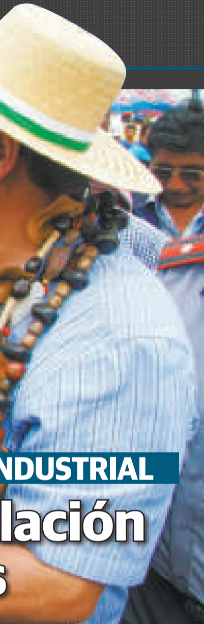
El presidente Luis Arce recibe el cariño de los pandinos.