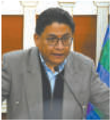
Ministro de Justicia, Iván Lima.