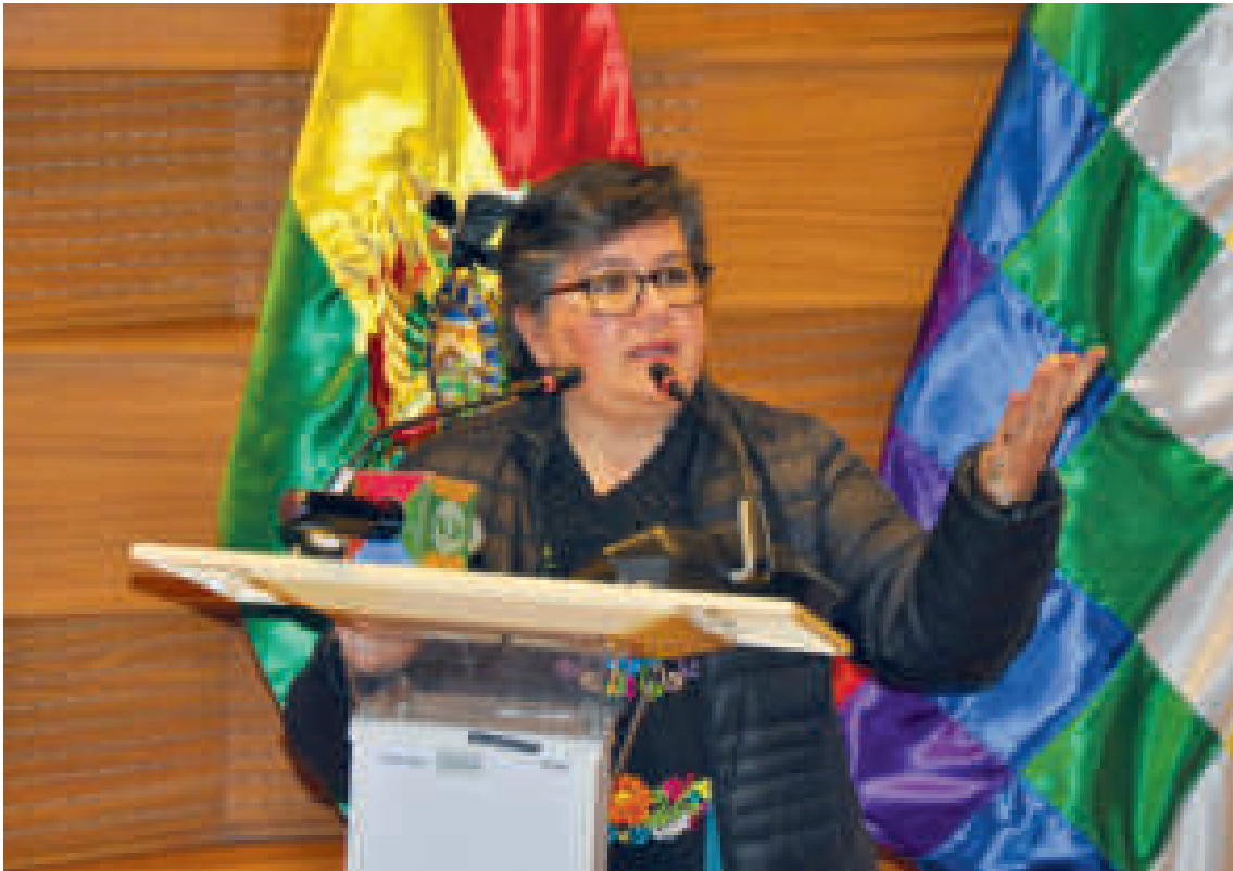
La ministra Verónica Navia durante un acto en La Paz.