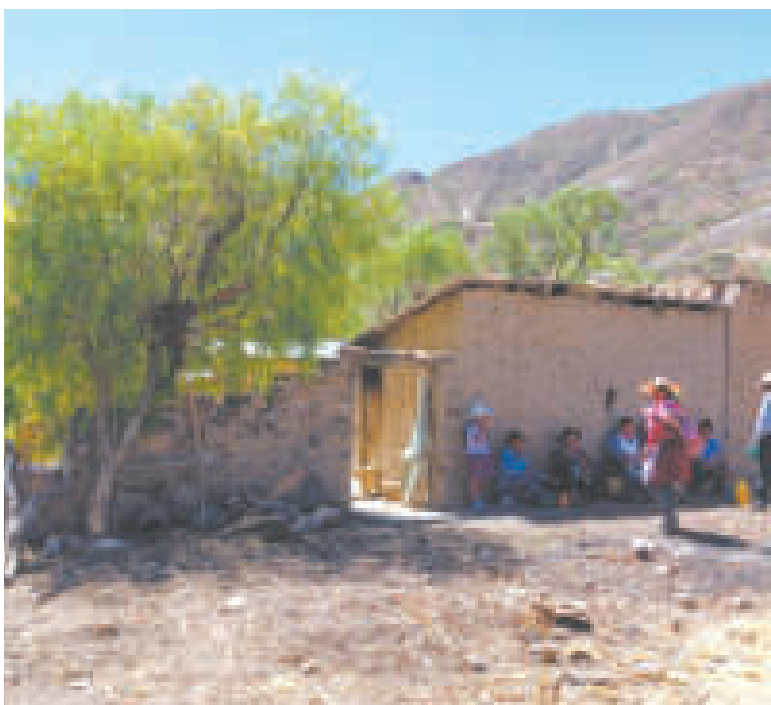
La sequía afecta a varios municipios de Cochabamba.