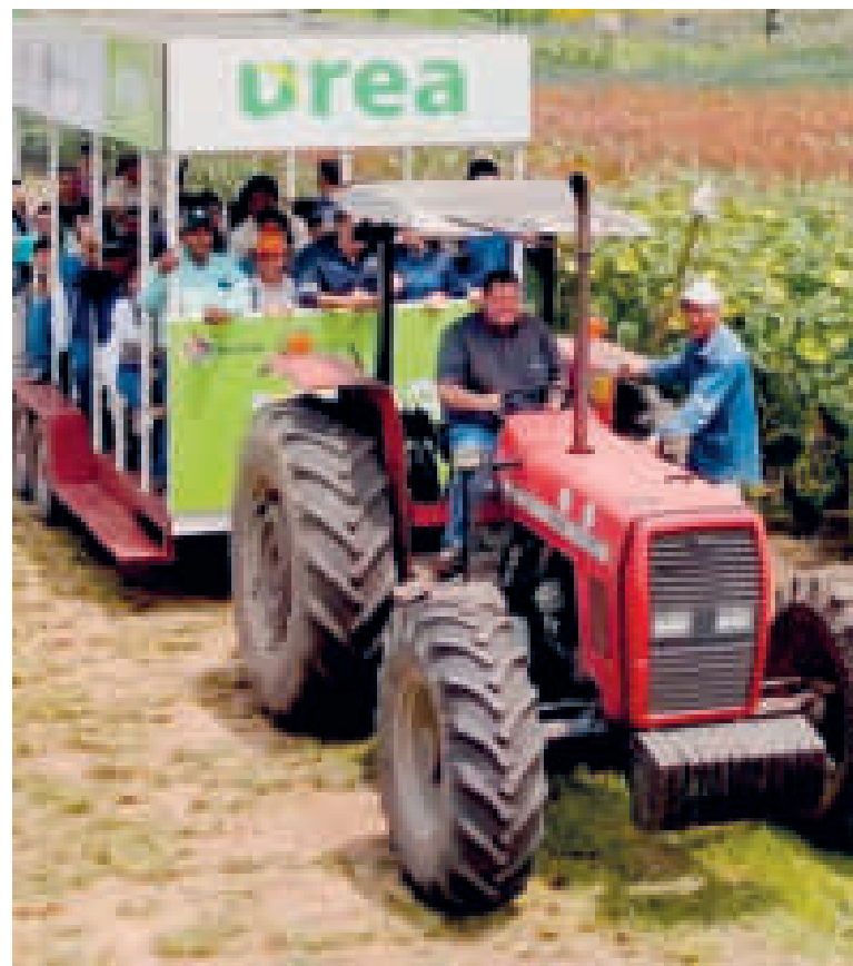
Brasil es el principal mercado para los fertilizantes bolivianos.