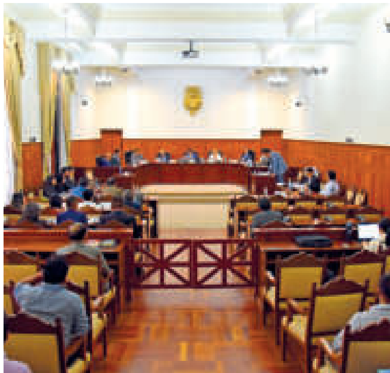
Audiencia donde se decidió aplazar el juicio hasta el 17 de octubre.