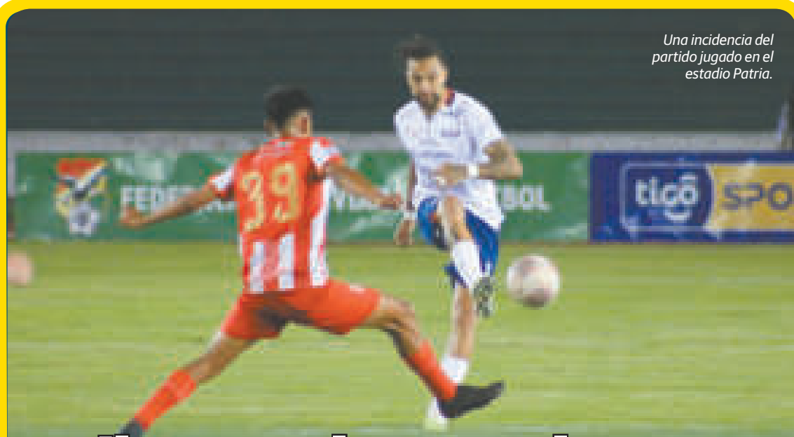
Una incidencia del partido jugado en el estadio Patria.