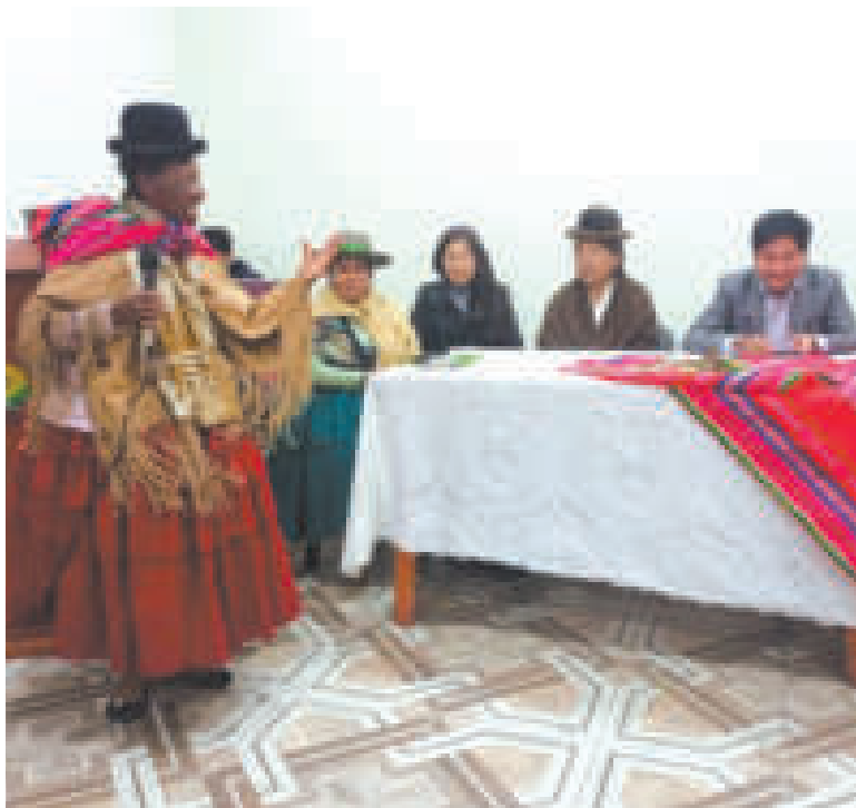
Mujeres aymaras se capacitaron para luchar contra la violencia.

Dentro de las actividades más destacadas está la conformación de Comités de Derecho y Justicia, conformación de la Red Municipal de Lucha contra la Violencia y el desarrollo de Jornadas de Convivencia Familiar Comunitaria.