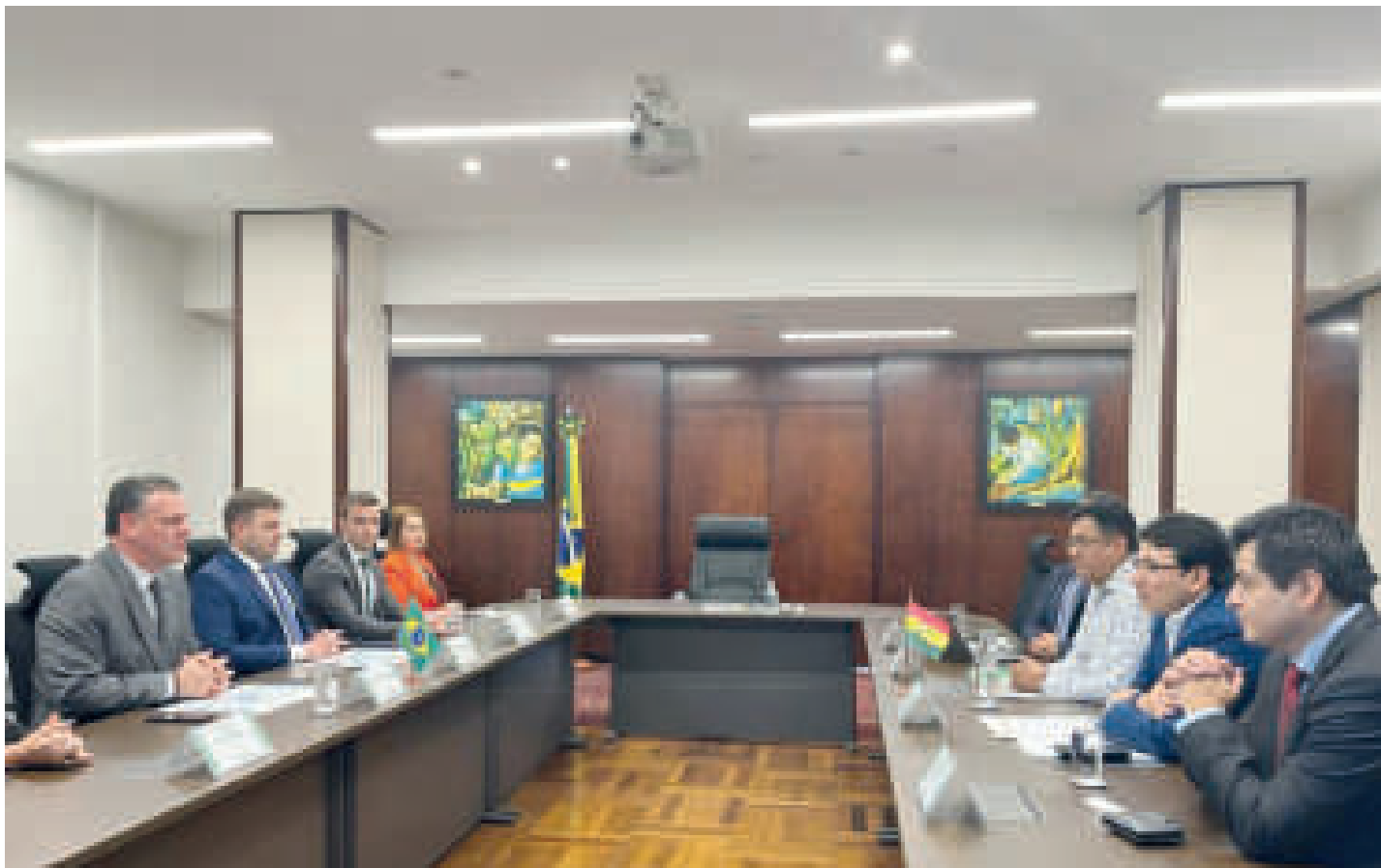
Autoridades bolivianas y brasileñas durante el encuentro en Brasilia.

“ Dimos un paso más en la preparación de un acuerdo bilateral para reanudar las relaciones comerciales, tecnológicas e institucionales entre Brasil y Bolivia”.