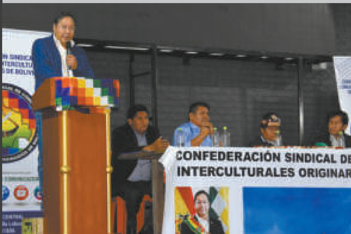
El Primer Mandatario, en el ampliado de los interculturales.

Frente a esta realidad, el Presidente abogó por el "bien común de las mayorías y no el bien individual de algunos grupos".