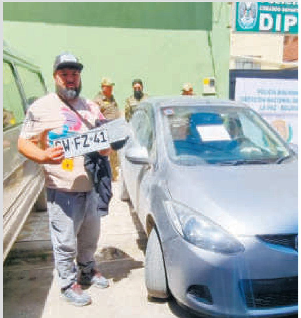
Un ciudadano chileno recuperó su auto, que en su país tenía denuncia de robo.