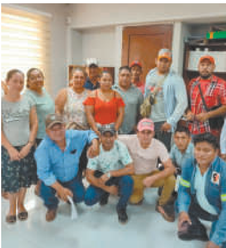
Trabajadores beneficiados con la intervención del Ministerio de Trabajo en Beni.