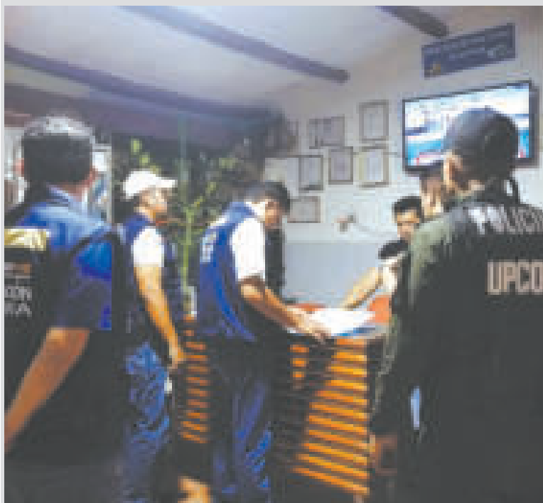
Funcionarios de Migración durante un operativo de control de extranjeros.