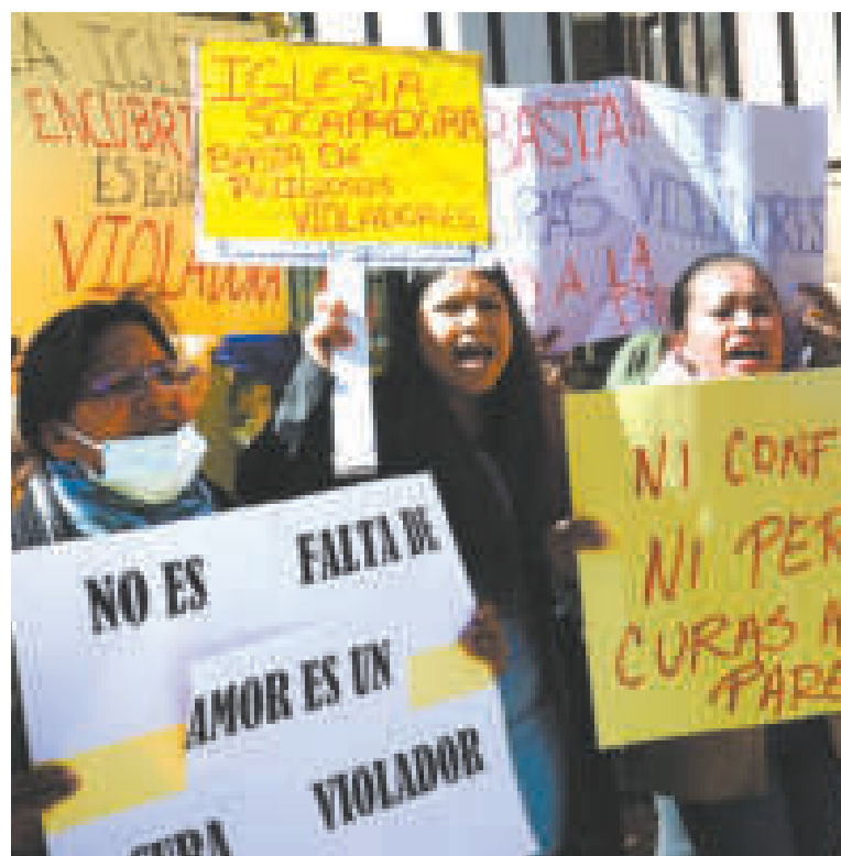
Protestas en La Paz por los casos de abuso sexual de parte de religiosos.

investigados en el país, según informó la Fiscalía en junio.