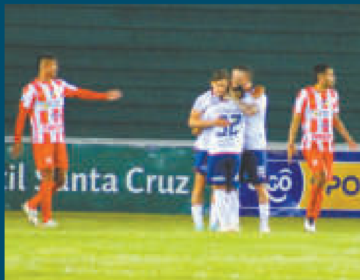
Jugadores de Wilstermann festejan el triunfo ante la desazón de los de Inde.

En la recta final, Independiente intentó reaccionar sin éxito y la derrota provocó preocupación en la dirigencia.