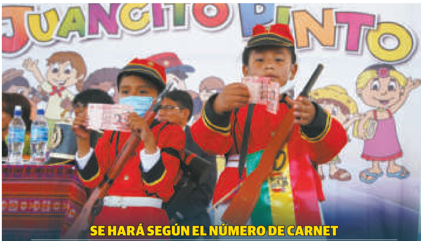
SE HARÁ SEGÚN EL NÚMERO DE CARNET

Hoy se inicia el pago del Juancito Pinto, que llegará a 2,3 MM de estudiantes