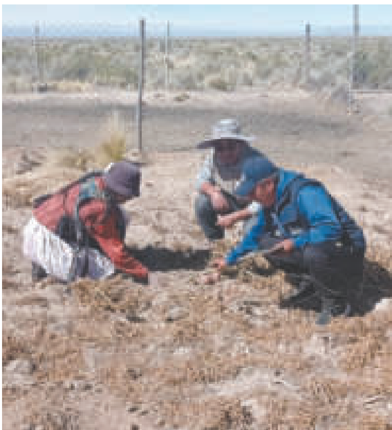
Cultivos afectados por la sequía.