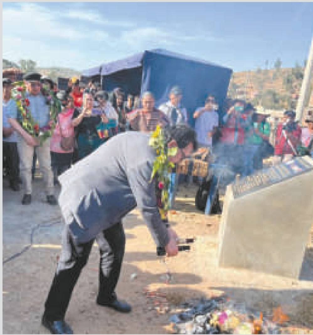
La tradicional ch'alla del inicio del edificio del Archivo y Biblioteca Nacionales de Bolivia.