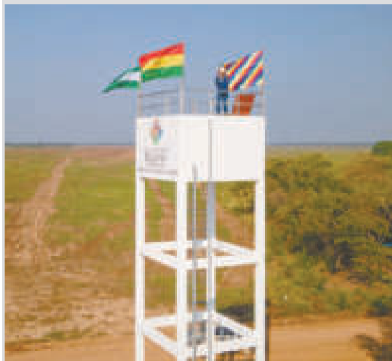
Inauguración de un pozo de agua en San Julián, Santa Cruz.