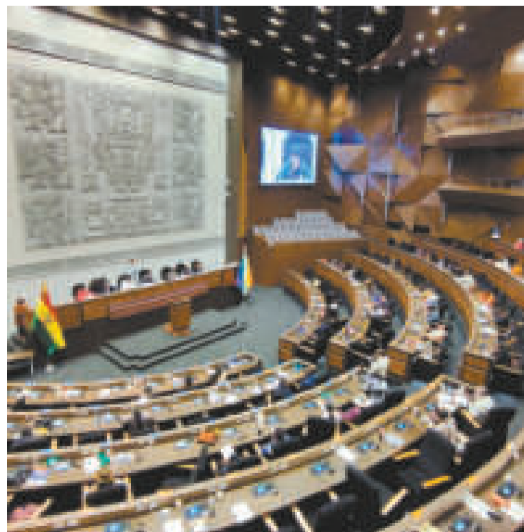
Vista del pleno de la Asamblea Legislativa Plurinacional.

MILLONES DE DÓLARES gestiona el Gobierno para riego tecnificado con financiamiento externo.