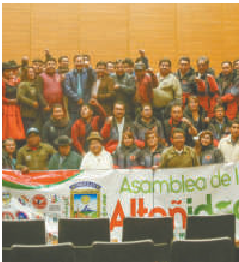
El presidente Luis Arce, en reunión con la Asamblea de la Alteñidad.