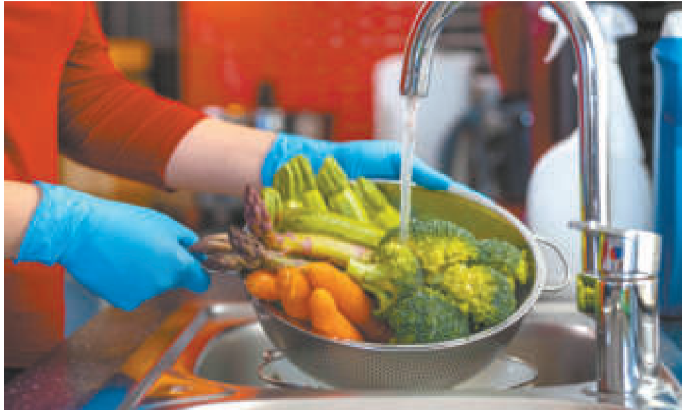
La desinfección de alimentos se hace especialmente importante durante la época de calor.

Sin embargo, un error que se comete frecuentemente es enjuagarlos con agua del grifo, lo que los vuelve a contaminar. Lo mejor es utilizar agua hervi-