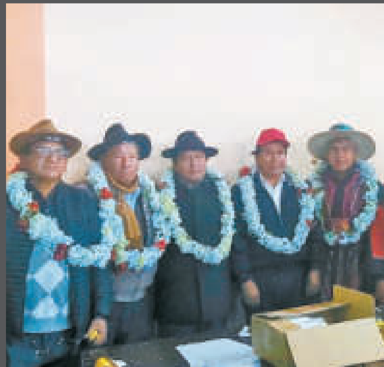
Fundadores del MAS-IPSP.