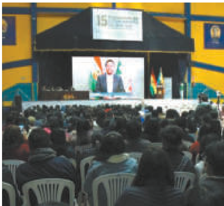
Una de las anteriores versiones del encuentro.