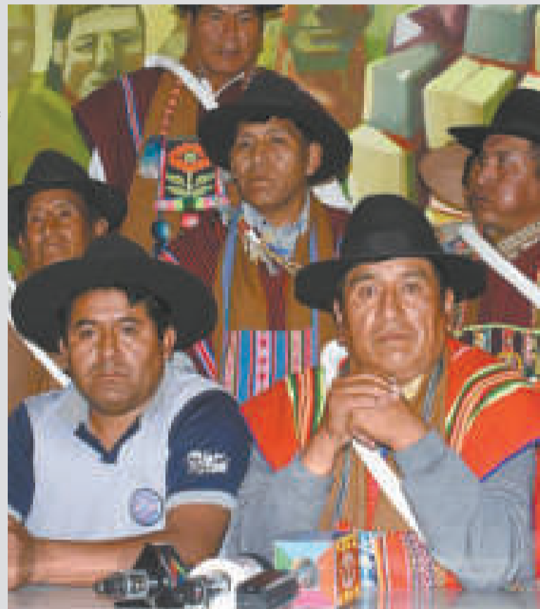
La dirigencia de la CSUTCB, en conferencia de prensa.