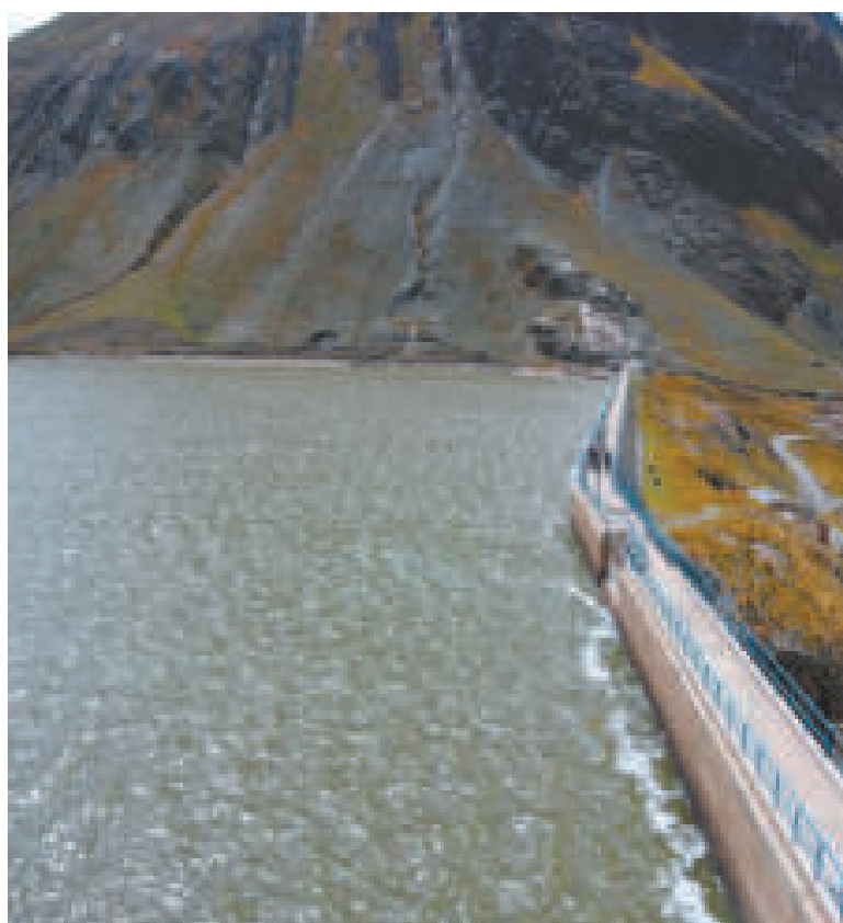
Los embalses de La Paz están al 50%.