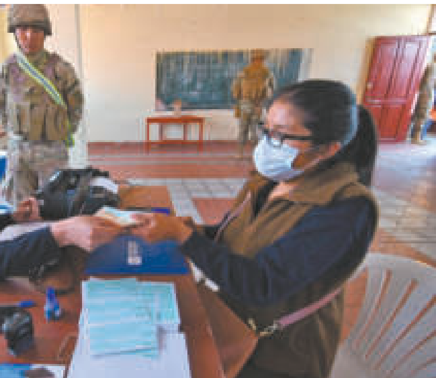
Estudiantes esperan su turno para cobrar el Bono Juancito Pinto.