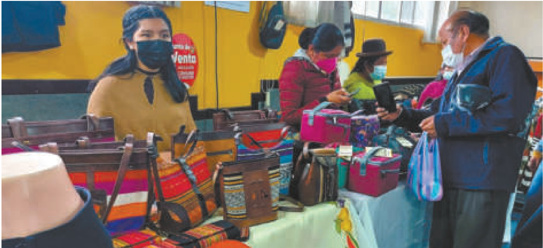
Las ferias comerciales son oportunidades de negocios, y también de promoción para los productores.