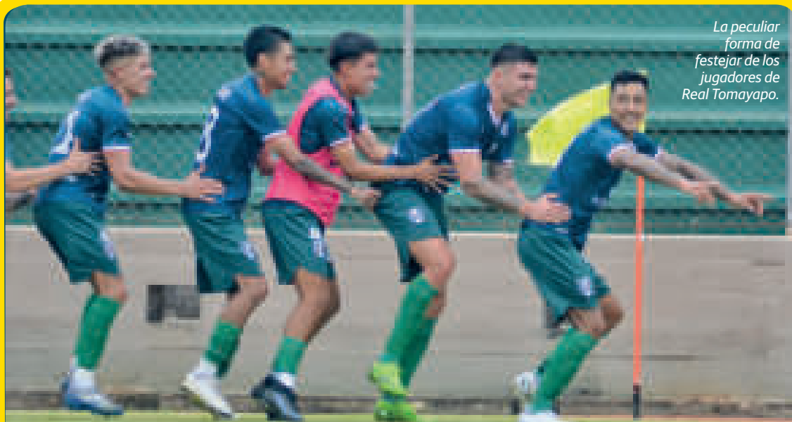
La peculiar forma de festejar de los jugadores de Real Tomayapo.