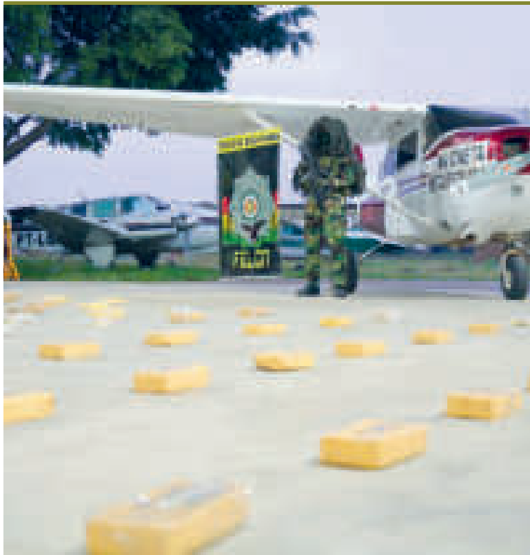
Droga y una avioneta incautada durante los últimos operativos de la FELCN.