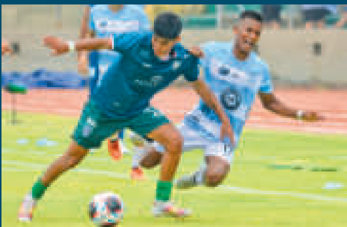
Una escena del compromiso jugado en el estadio Roberto Jordán de Pando.