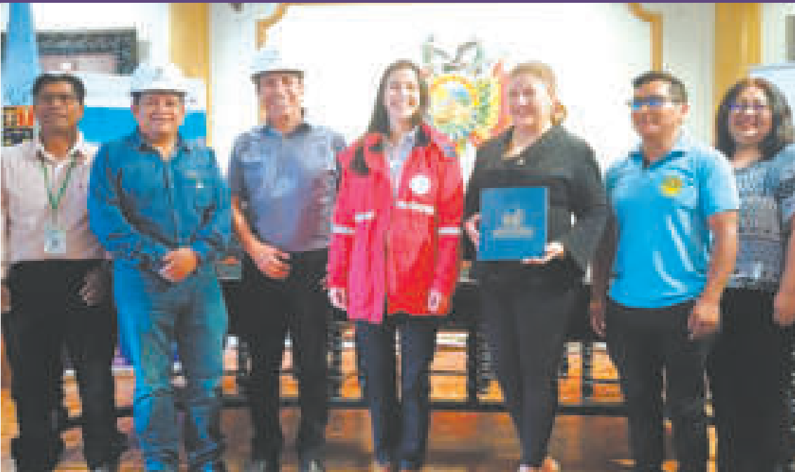
Firma del convenio entre la ABEN y la empresa Misicuni.