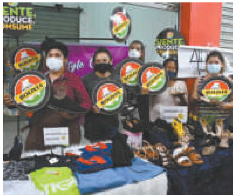
La aplicación Consume lo Nuestro impulsa las ventas de las unidades productivas.

enfocada en la promoción de las unidades productivas del país a través del apoyo integral en la realización de ferias productivas.