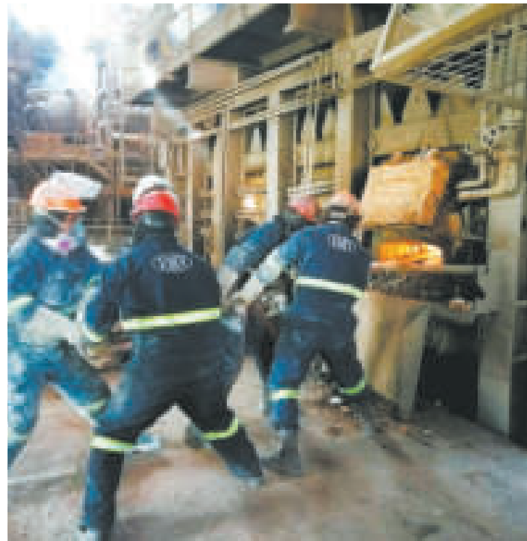
Trabajadores de la metalúrgica Vinto.

La refinería, que estará en predios de la empresa Vinto, tendrá una capacidad de procesamiento de 150 mil toneladas métricas de concentrados de zinc al año, y tomará los concentrados de la Empresa Minera Colquiri, de la Cooperativa Poopó y de otras cooperativas ubicadas alrededor de Oruro y en el norte de Potosí.