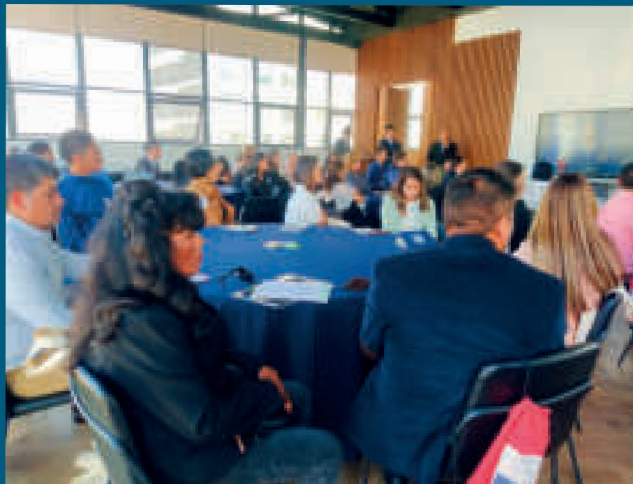
Una muestra del evento organizado por la Agencia Francesa de Desarrollo para mejorar el deporte.

En ese sentido, dijo que esa cartera de Estado trabaja en políticas públicas para