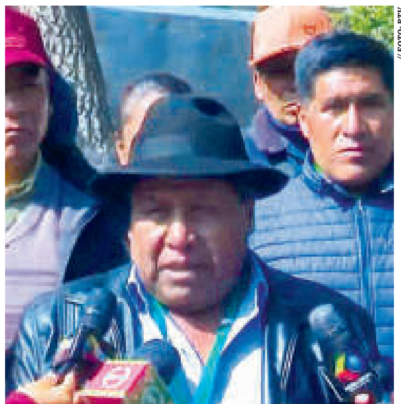
La dirigencia de la Fejuve de El Alto en la plaza Murillo, La Paz.

DE OCTUBRE DE 2023 se conmemoran 20 años de la masacre en defensa del gas y la huida de Goni.