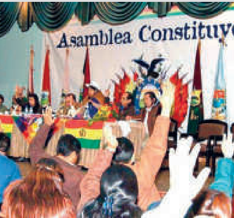
La Asamblea Constituyente, donde se aprobó la CPE de 2009.