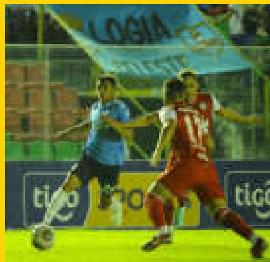
Una acción del encuentro jugado anoche en el 'Tahuichi'.

Blooming y Royal Pari empataron a un gol en el cierre de la fecha 27 del torneo todos contra de la División Profesional del fútbol boliviano, que se disputó anoche en el estadio Ramón 'Tahuichi' Aguilera de Santa Cruz.