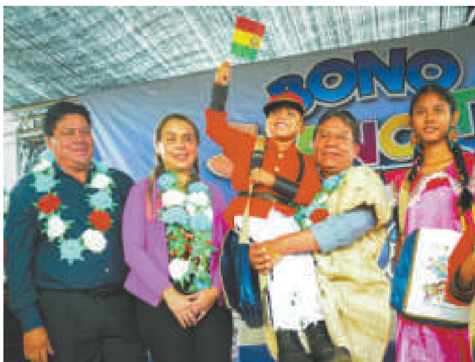
El vicepresidente Choquehuanca comenzó con el pago del Bono en Beni.