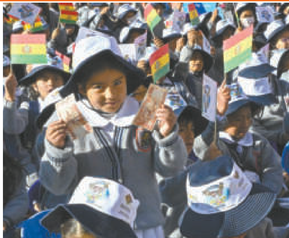
El Presidente inicia la entrega del incentivo a la permanencia escolar, en Potosí.

ustedes, queridas y queridos estudiantes, para que puedan comprar el material educativo que necesitan para continuar estudiando para ser los mejores profesionales. Desde el Gobierno nacional seguiremos trabajando para que ustedes tengan una educación de calidad”, manifestó Pary.