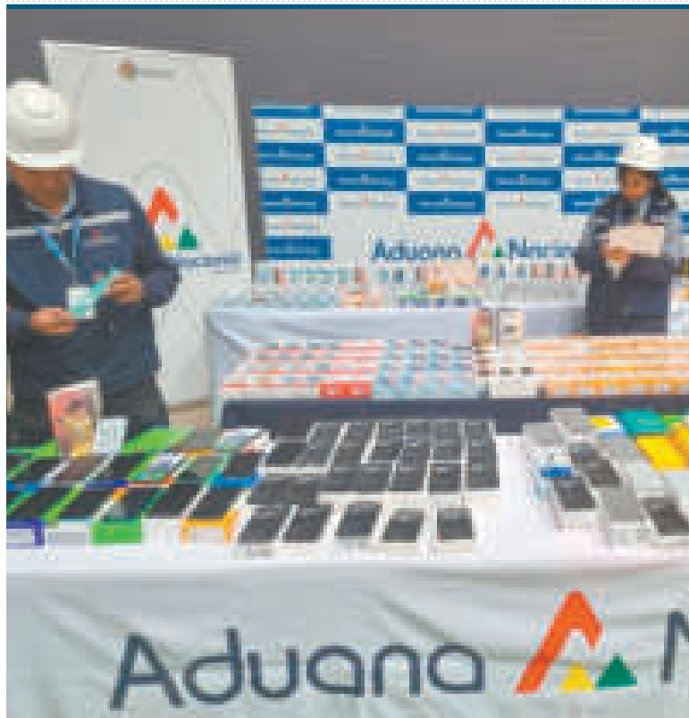
Mercadería decomisada por la Aduana Nacional.