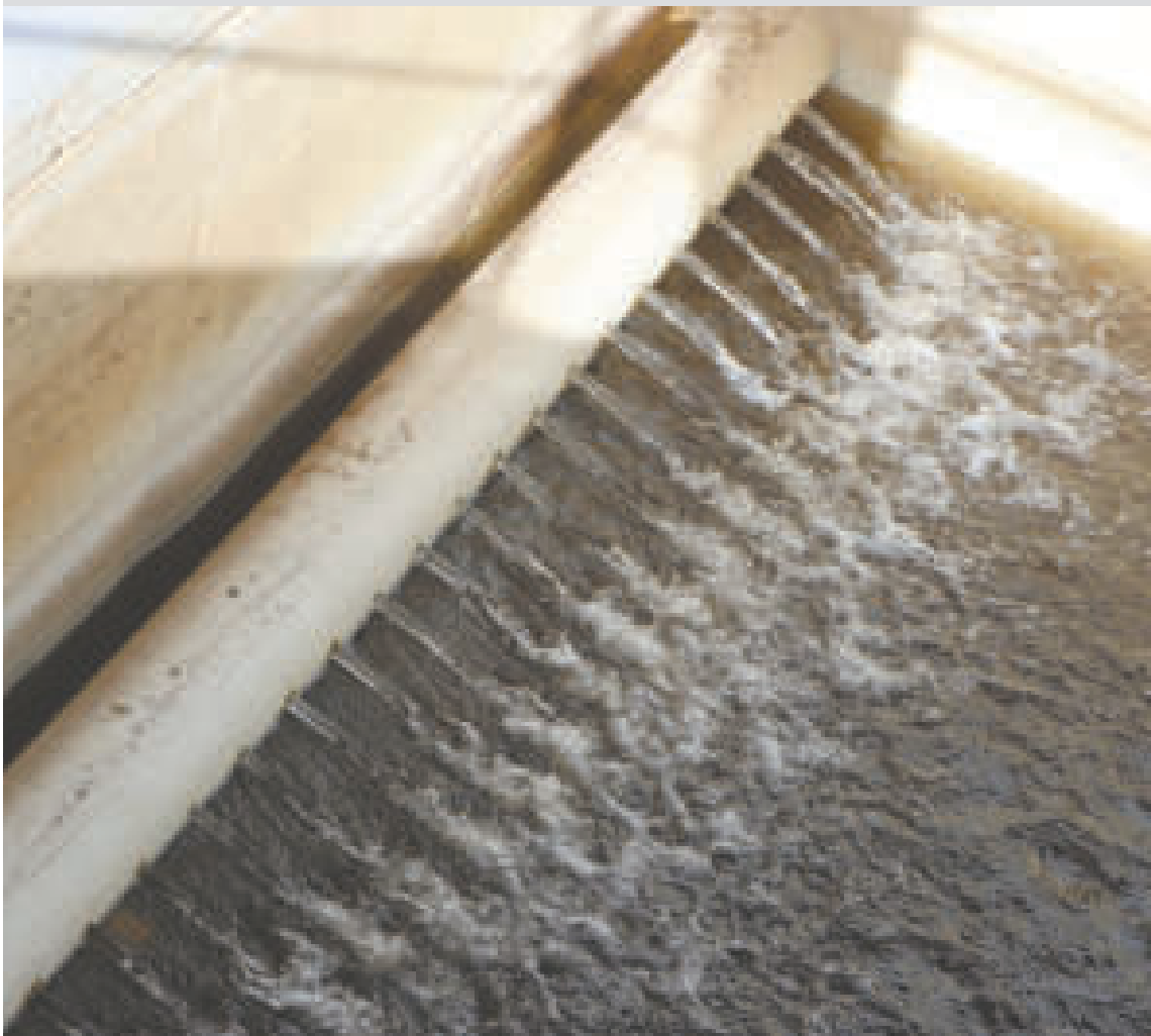
Se trabaja para la dotación de agua para el departamento de Potosí.