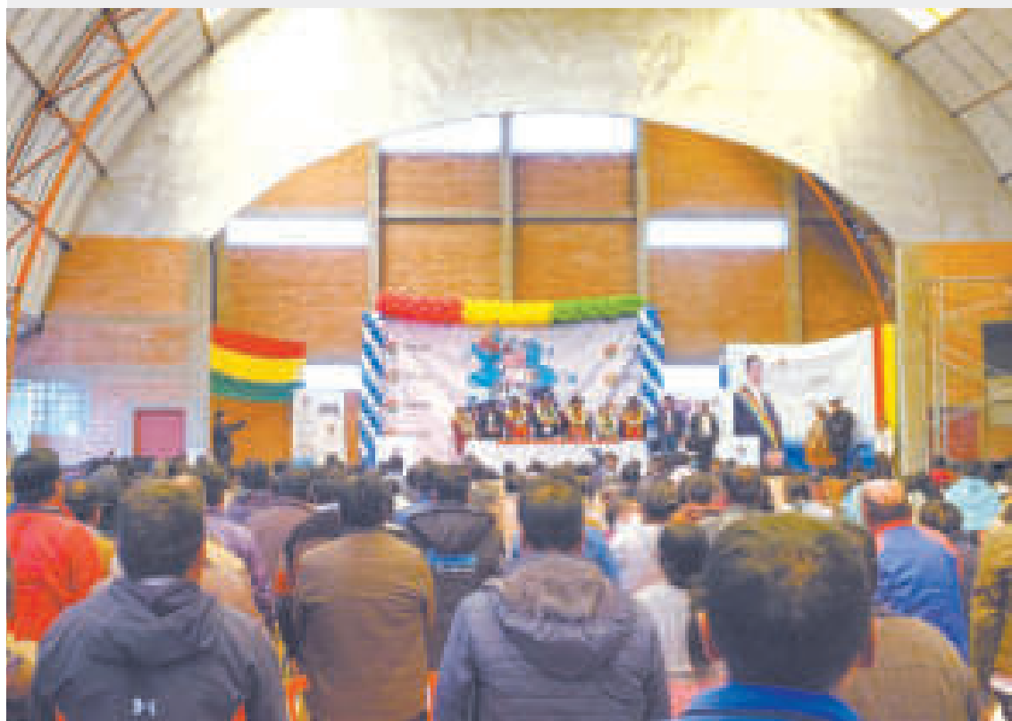
Acto de entrega de certificados de competencia a los productores de leche en Achacachi.