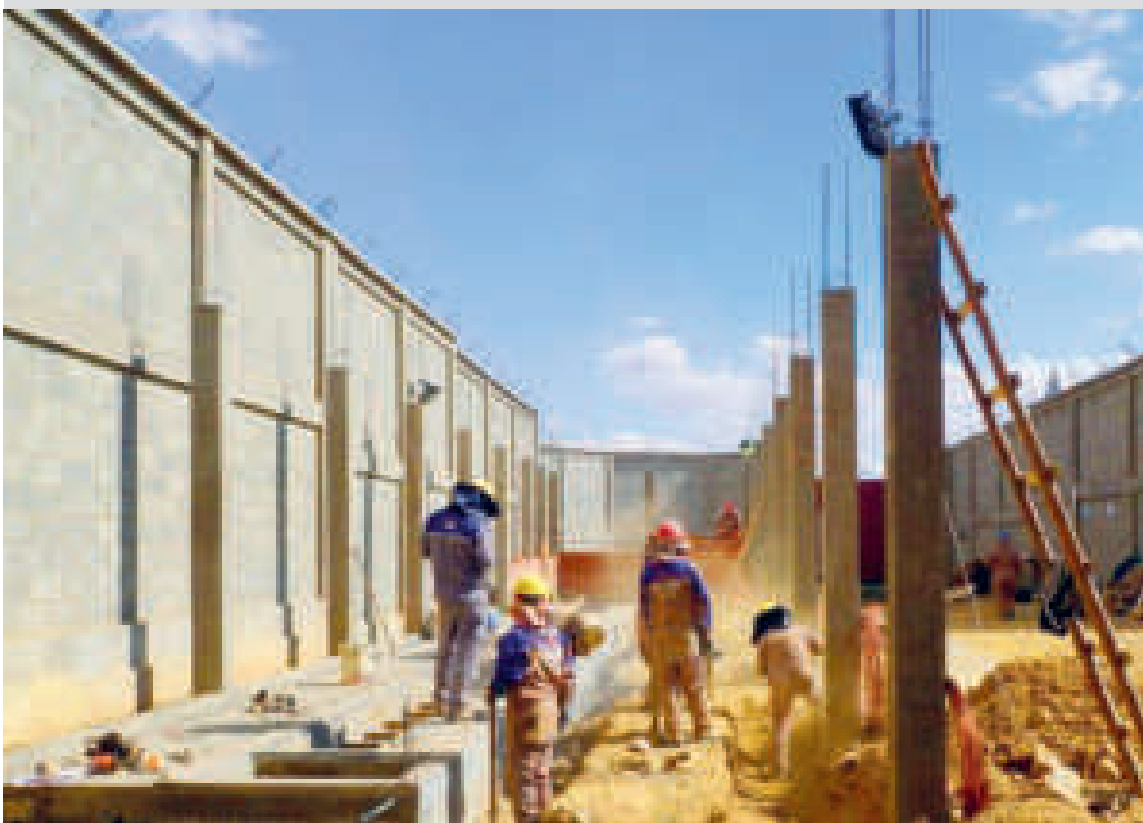
Personal de ENDE en trabajos de construcción.