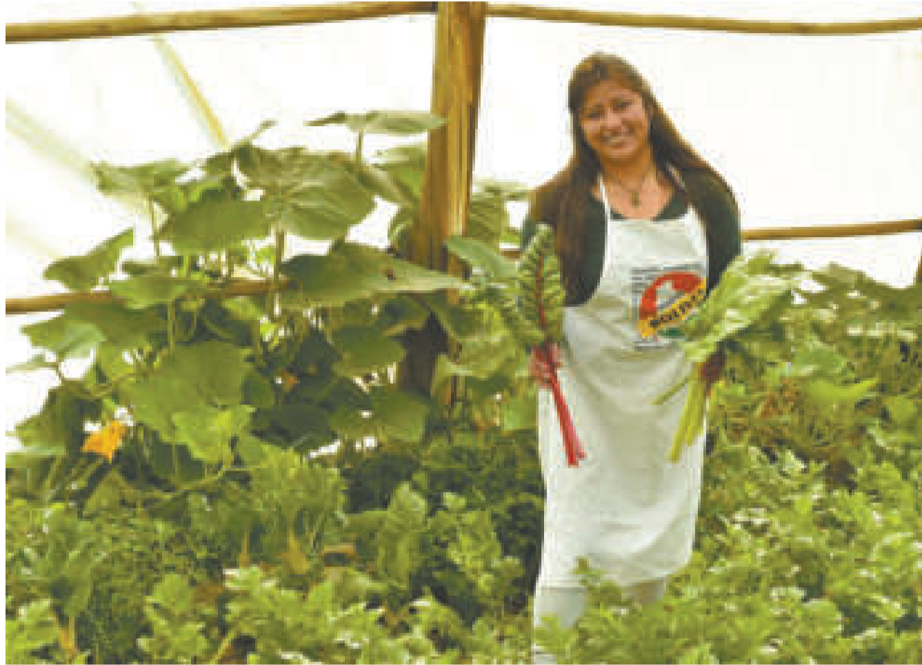
Beneficiaria del programa de fomento a la producción de hortalizas.

Llegó el Programa de Fomento de la Ganadería Bovina para Pequeños Productores. Se busca aumentar la producción y productividad del sector ganadero, considerando la diversidad de las ecorregiones y mejorando los procesos de producción para el mercado interno y exportación de carne bovina. En este sentido, se invirtieron Bs 443,6 millones que ya están dando resultados, lo cual se evidencia en el incremento de exportación de este producto.