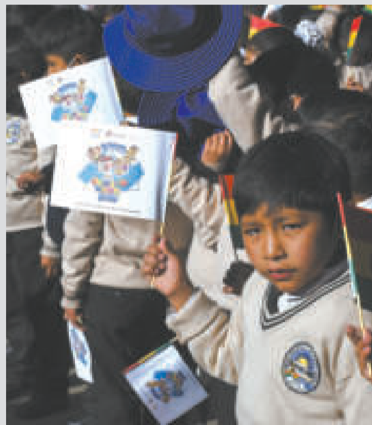
Niños esperan el pago de su Bono Juancito Pinto, durante el acto de inauguración.

La inversión en este incentivo llega a 477 millones de bolivianos provenientes de las utilidades que generan 27 empresas estatales, entre las que se encuentran YPFB, Entel, Editorial del Estado, entre otras.