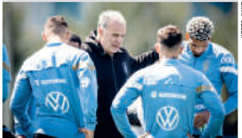
Bielsa dialoga con sus dirigidos en el entrenamiento charrúa.

La otra modificación será en ataque, con la salida de Richarlison, de flojo rendimiento contra Venezuela, quien será reemplazado por Gabriel Jesús.