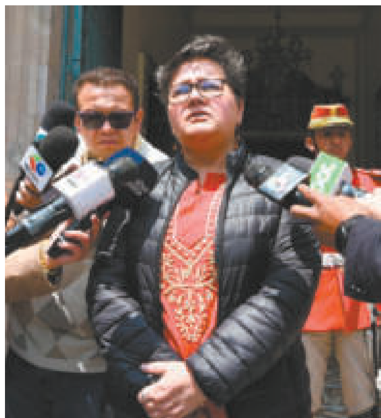
La ministra de Trabajo, Verónica Navia, durante un encuentro con la prensa.

Aclaró también que el Ministerio de Trabajo es la única entidad competente en regular los regímenes laborales.