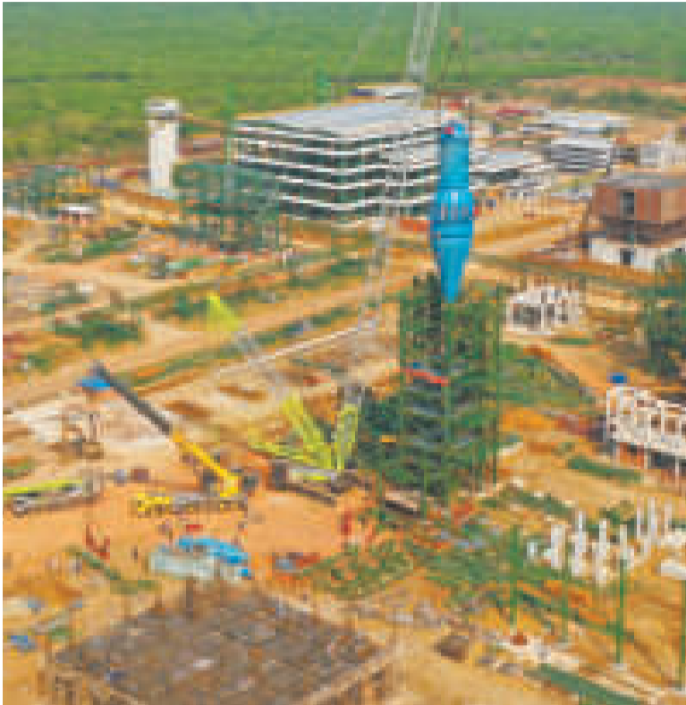
El complejo siderúrgico está emplazado en 42 hectáreas de terreno.