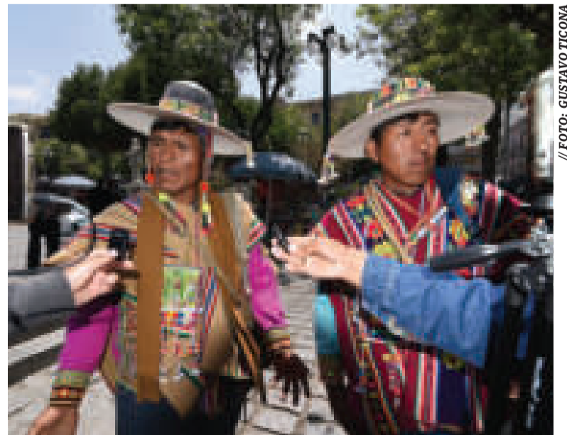
Los jiliri apu mallkus de Cochabamba.

Anunció que entre el 24 y 25 de este mes se desarrollará un ampliado del sector para definir la suerte del ejecutivo.