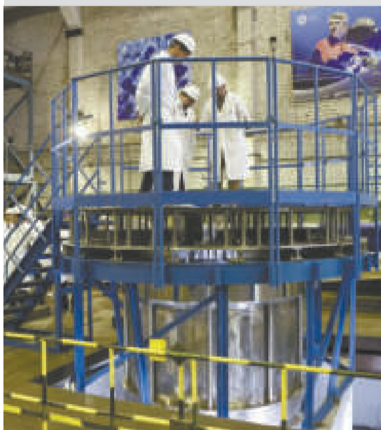
Más de 50 profesionales bolivianos irán a especializarse a Rusia.