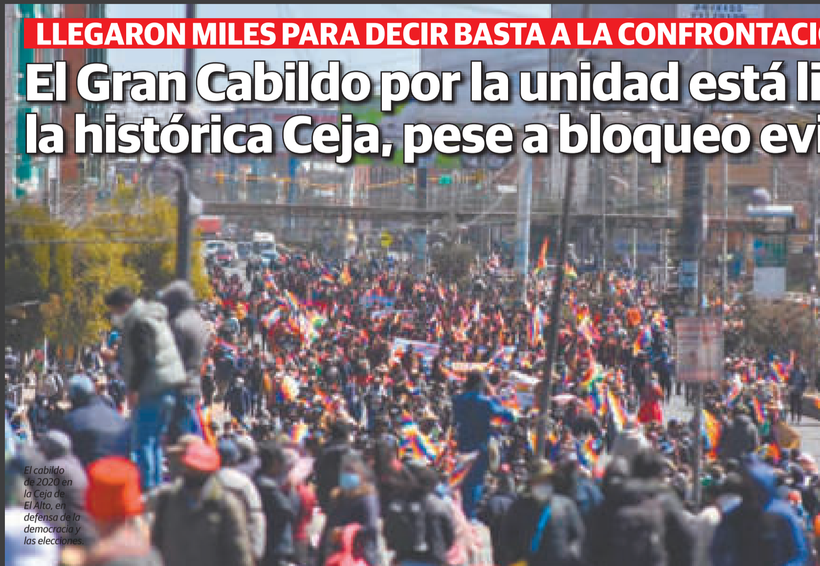
El cabildo de 2020 en la Ceja de El Alto, en defensa de la democracia y las elecciones.