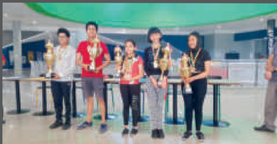
Los ganadores del quinto Grand Prix de ajedrez, que se disputó en Tarija.

Hubo un empate en el primer puesto masculino a 5,5 puntos entre Claire y