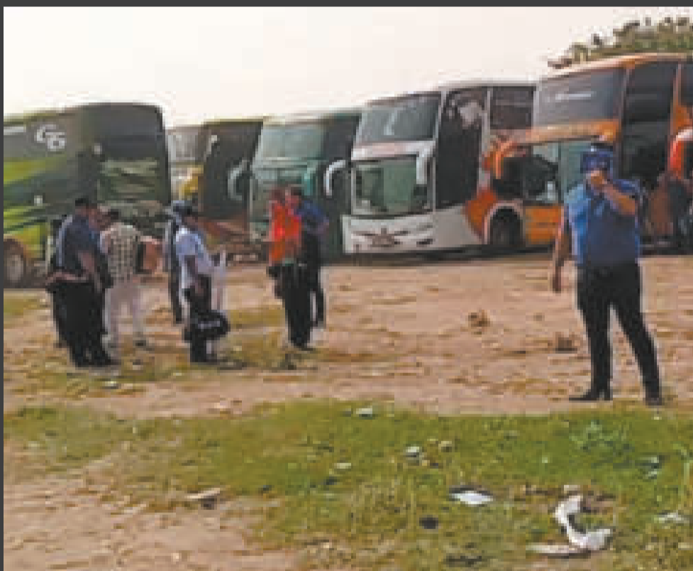
Organizaciones del oriente parten al encuentro en El Alto.

...cómplice ...rupción ...cotráfico ...ños. Es un ...ntiroso y solo ...nfrontar al pueblo, ...nos a demostrarle que ...o está unido”.