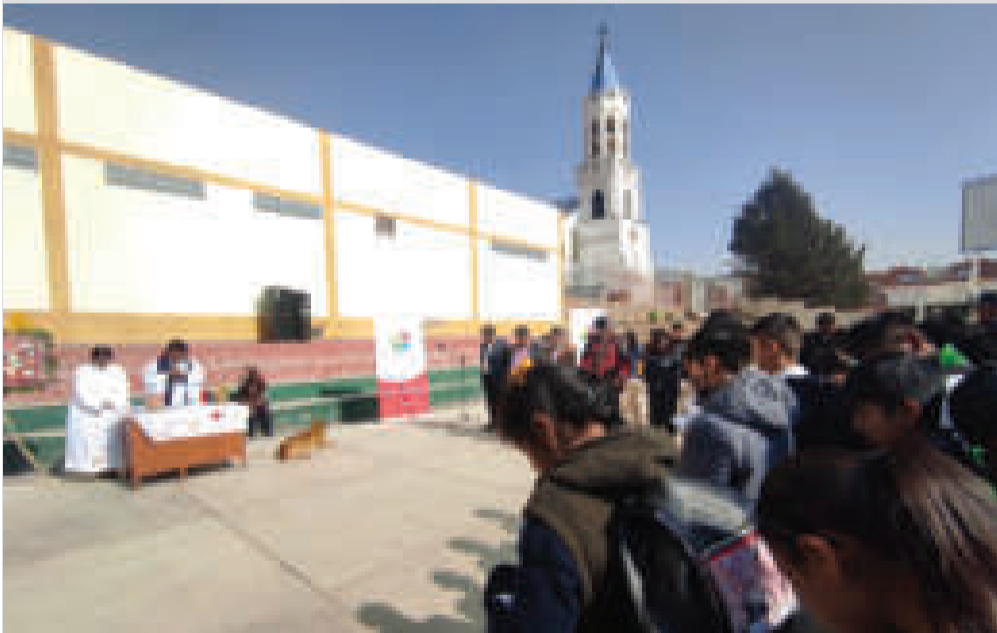
Una misa a los 20 años de la masacre de octubre de 2003, organizada por la Defensoría del Pueblo.

“El luto en nuestros corazones no se borrará. Octubre Negro siempre estará presente hasta