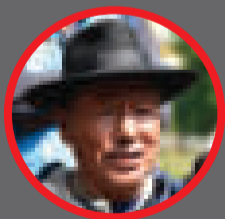
Román Loayza Fundador del MAS-IPSP

...cómplice ...rupción ...cotráfico ...ños. Es un ...ntiroso y solo ...nfrontar al pueblo, ...nos a demostrarle que ...o está unido”.