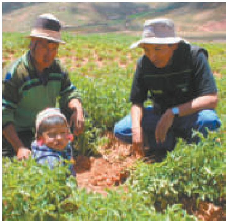
Familias beneficiadas por el seguro Minka.

Pretende contribuir en la protección de la producción agraria y los medios de subsistencia de los productores agropecuarios frente a eventos climáticos adversos, a través del desarrollo de mecanismos de transferencia