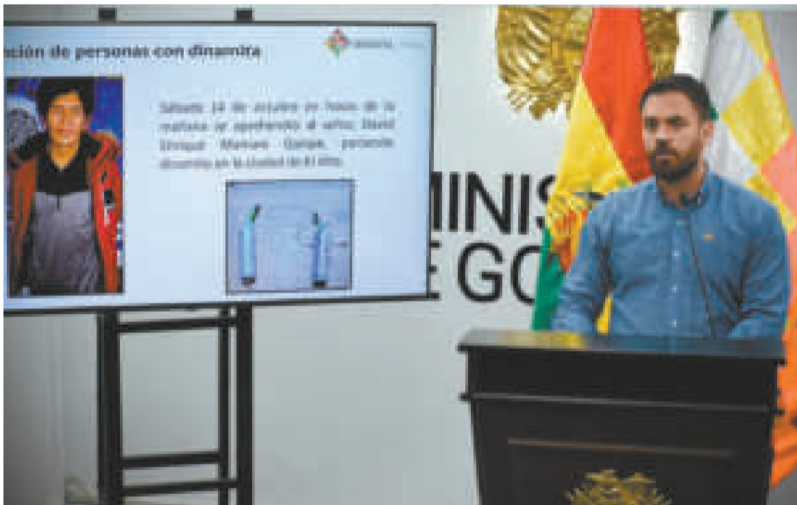
El ministro de Gobierno, Eduardo Del Castillo, en conferencia de prensa sobre el cabildo de hoy.

“Diputados nacionales ya están hablando de enviar a compañeros donde posiblemente haya enfrentamientos y no descartan que existan muertes”, dijo la autoridad durante la conferencia.