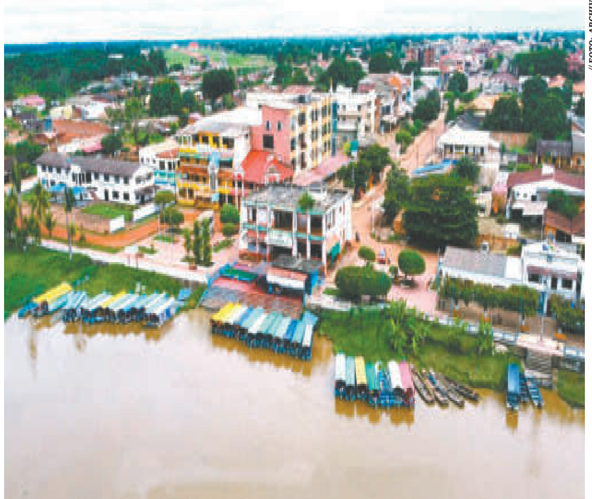
Guayamerín, en Beni, se encuentra en la frontera con Brasil.

“Ya hemos firmado el contrato con la empresa para la supervisión del diseño técnico de preinversión de la hidrovía Ichilo-Mamoré, por eso nosotros defendíamos la propuesta de Bolivia y defendíamos el Tratado de Petrópolis de 1904. Entonces, el puente va definitivamente agarrado de la mano de la hidrovía”, manifestó.