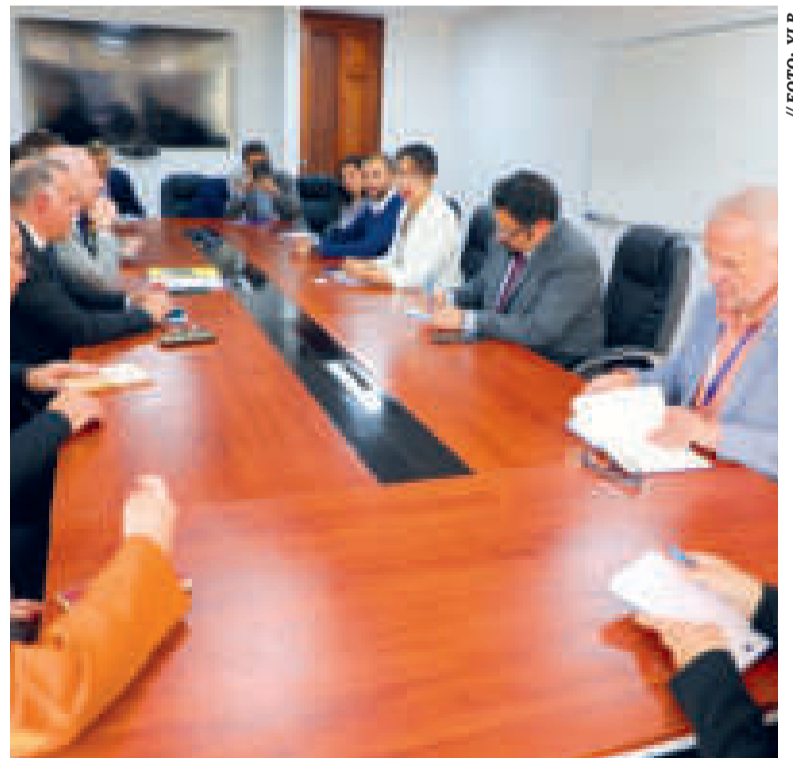
Encuentro con representantes europeos.

Además de esa factoría, Bolivia contará con cuatro plantas industriales de producción de carbonato de litio con tecnología de EDL (extracción directa del litio), cada una con una capacidad de hasta 25.000 toneladas por año en los sala-