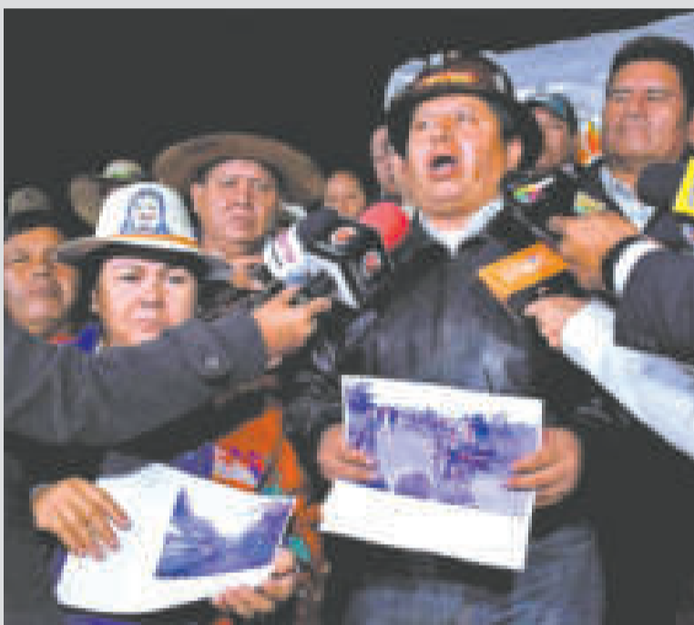
Conferencia de prensa de las organizaciones sociales y la COB en la plaza Murillo.