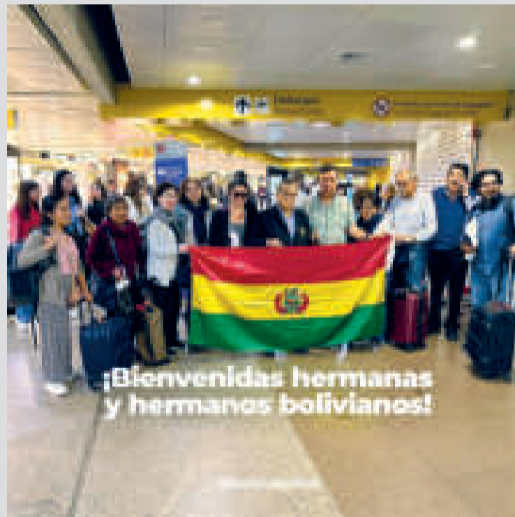
Un grupo de repatriados desde Israel muestra la tricolor boliviana.

La madrugada del martes arribaron al Estado Plurinacional de Bolivia ocho personas del grupo bíblico denominado Caleb Villarroel.