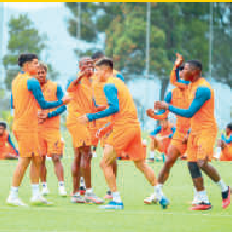
El entusiasmo de los jugadores de Ecuador en las prácticas.