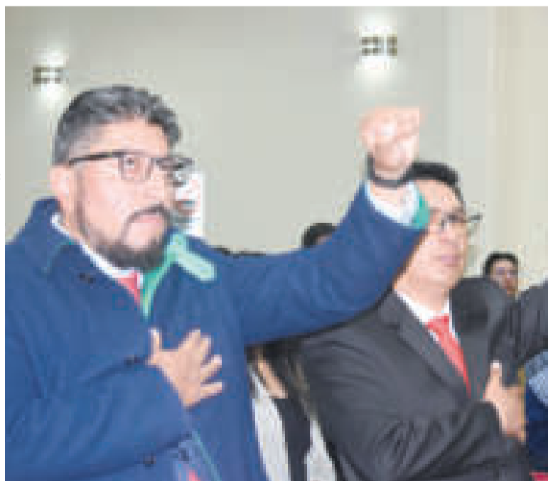
Dos de los tres nuevos subprocuradores durante su juramento.