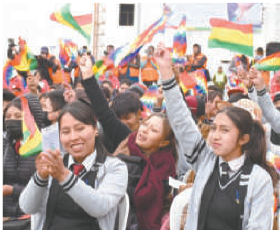
Estudiantes y trabajadores de la ABEN son parte de la inauguración.