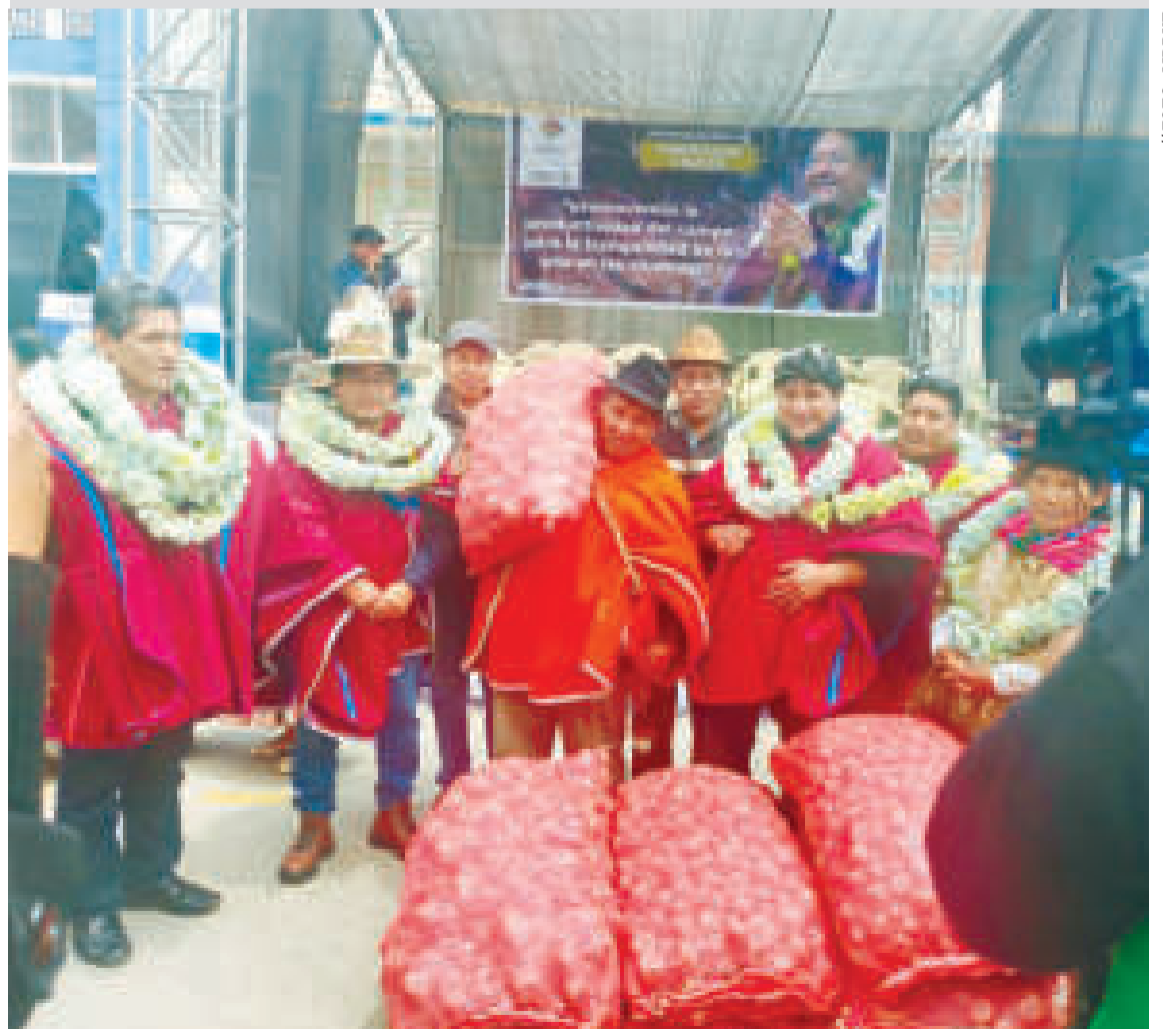
La semilla de papa que fue entregada a productores.

Janco precisó que la semilla e insumos demandaron una inversión de Bs 1.350.107, de los cuales la IPDSA financió el 79% (Bs 1.067.242) y los municipios beneficiarios colocaron una contraparte del 21% (Bs 282.856). Indicó que con esta entrega se beneficia a productores de 72 comunidades.