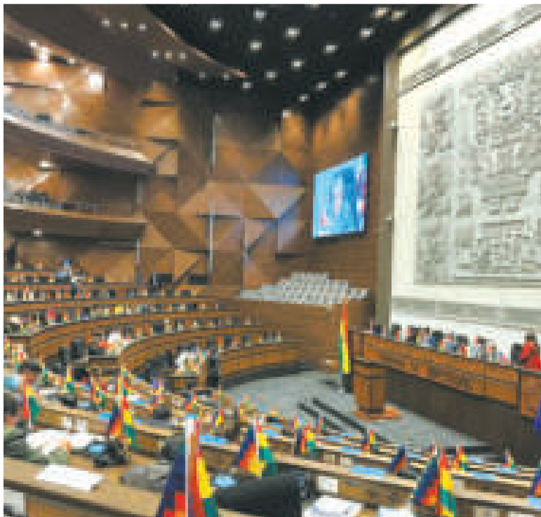
Cámara de Diputados de la Asamblea Legislativa.