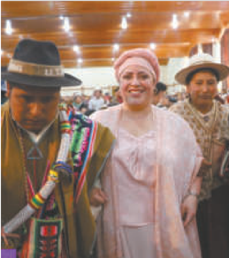
La ministra de la Presidencia, María Nela Prada, en la Cumbre en Cochabamba.