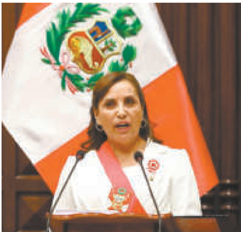
La presidenta del Perú, Dina Boluarte.