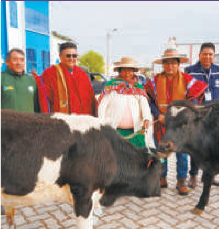
Productores pecuarios de Ayo Ayo reciben ganado.