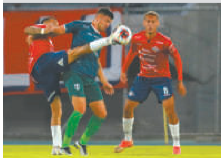
Una incidencia del encuentro que se disputó anoche en el estadio Félix Capriles.

Con la derrota, el Rojo puso en riesgo su pase a la próxima ronda del campeonato.