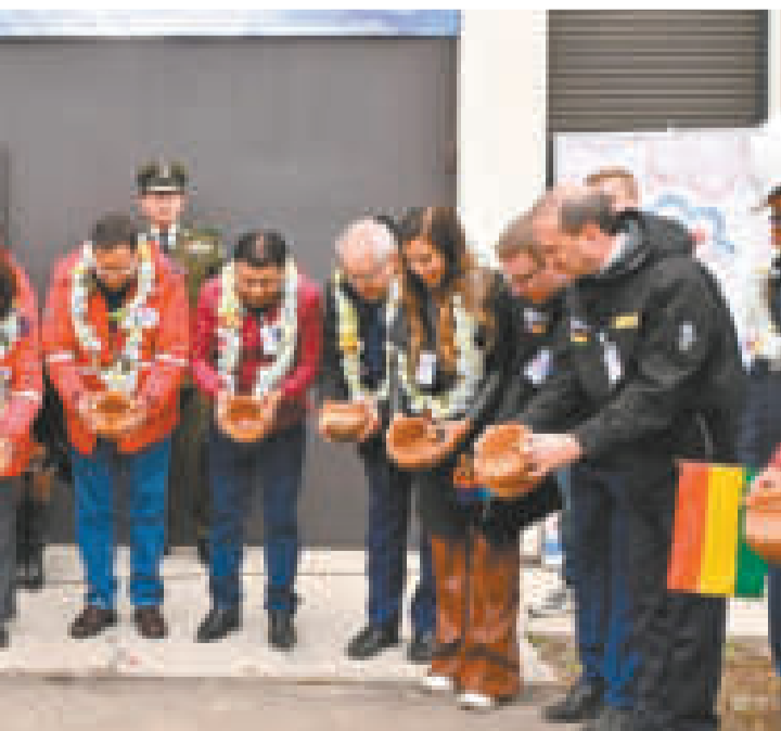
El Presidente, acompañado por líderes sociales y autoridades, durante la ch'alla de las instalaciones.