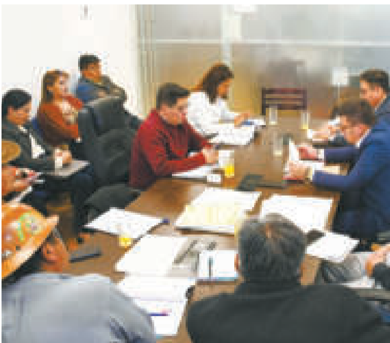
Comisión de Planificación del Senado.