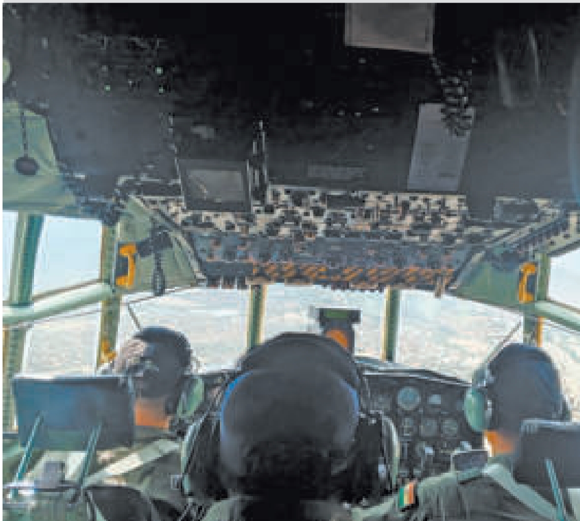
Tripulantes del Hércules durante el bombardeo de nubes.