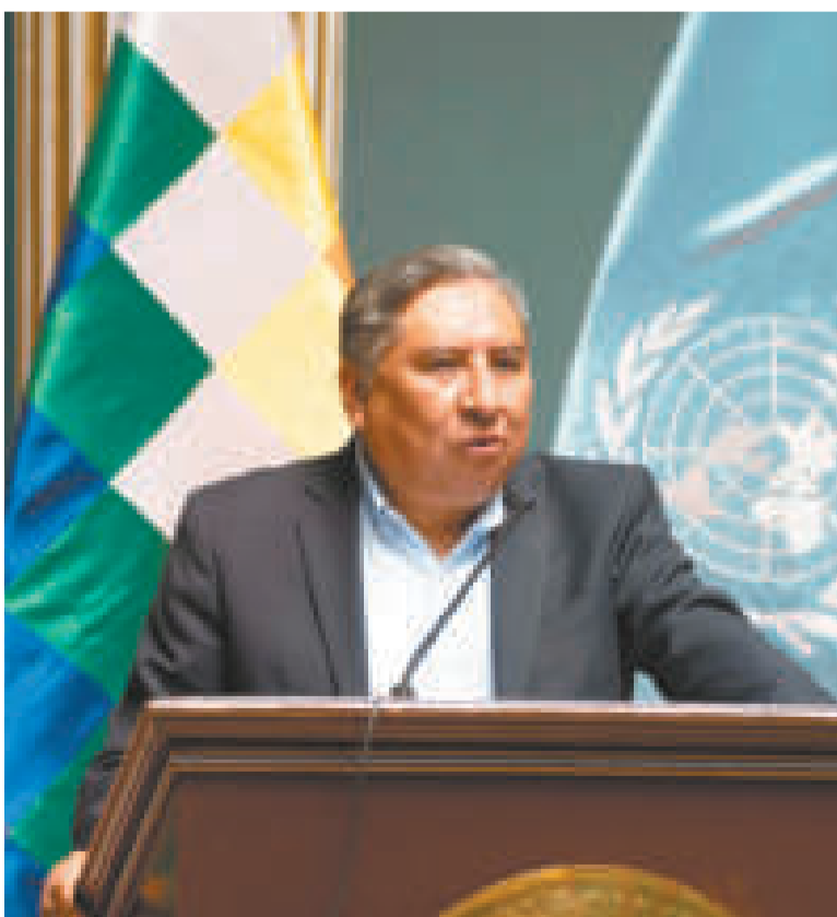
El ministro de Relaciones Exteriores, Rogelio Mayta,