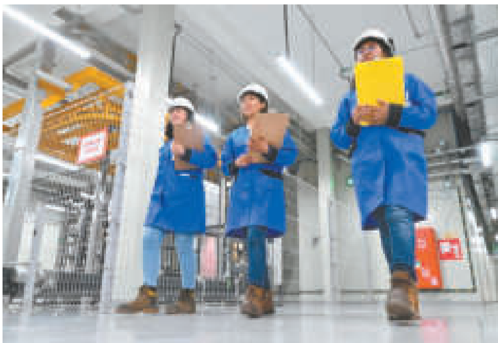
Personal especializado será el encargado de administrar el CMI.

Además del apoyo a la agroindustria, se desarrollará investigación básica y aplicada. De manera inicial se atenderá el mejoramiento genético de especies vegetales de interés para el país. También se trabajará en el mejoramiento de ma-