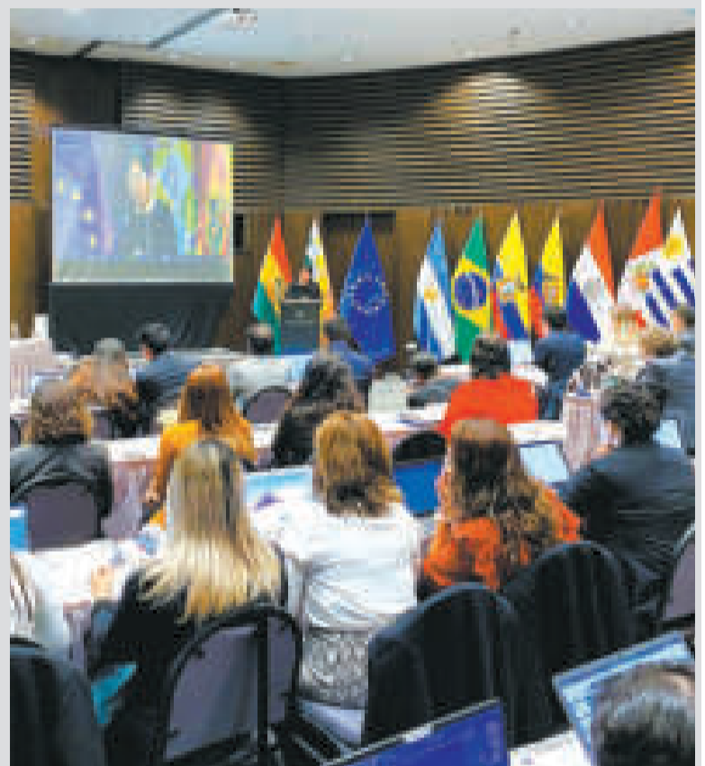
Encuentro regional para una migración regional ágil y segura.

Conversar, compartir y aprender de otras experiencias enriquecerá nuestras políticas migratorias y contribuirá también al posicionamiento regional.