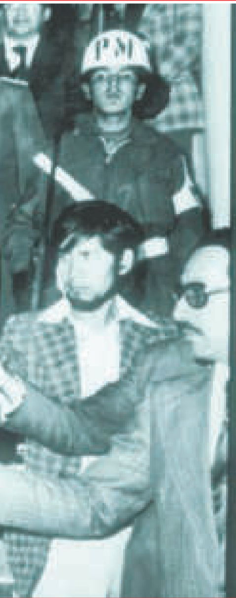
El dictador en las gradas del Palacio con sus colaboradores y la prensa.