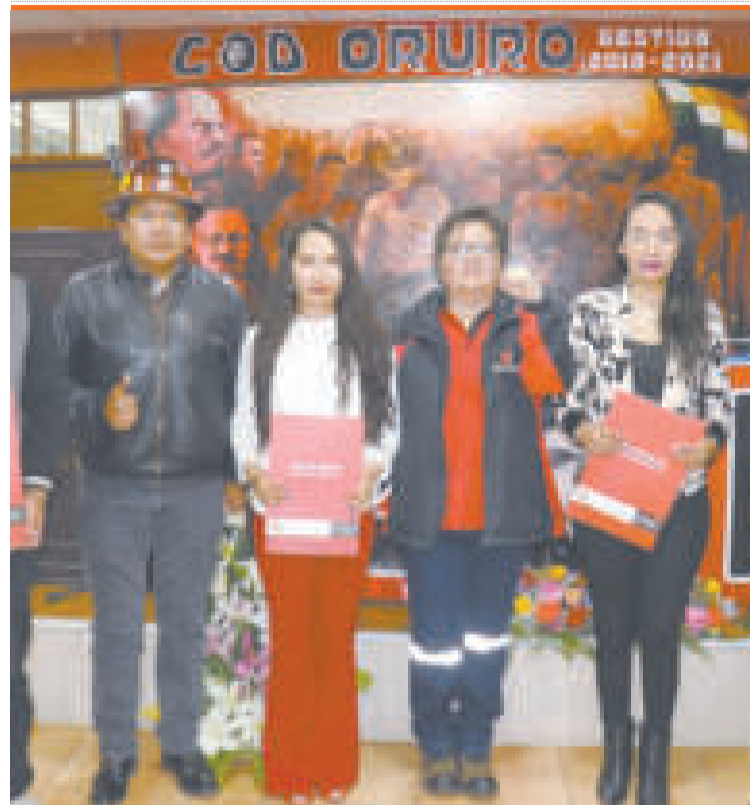
La ministra Verónica Navia con las ganadoras del concurso.