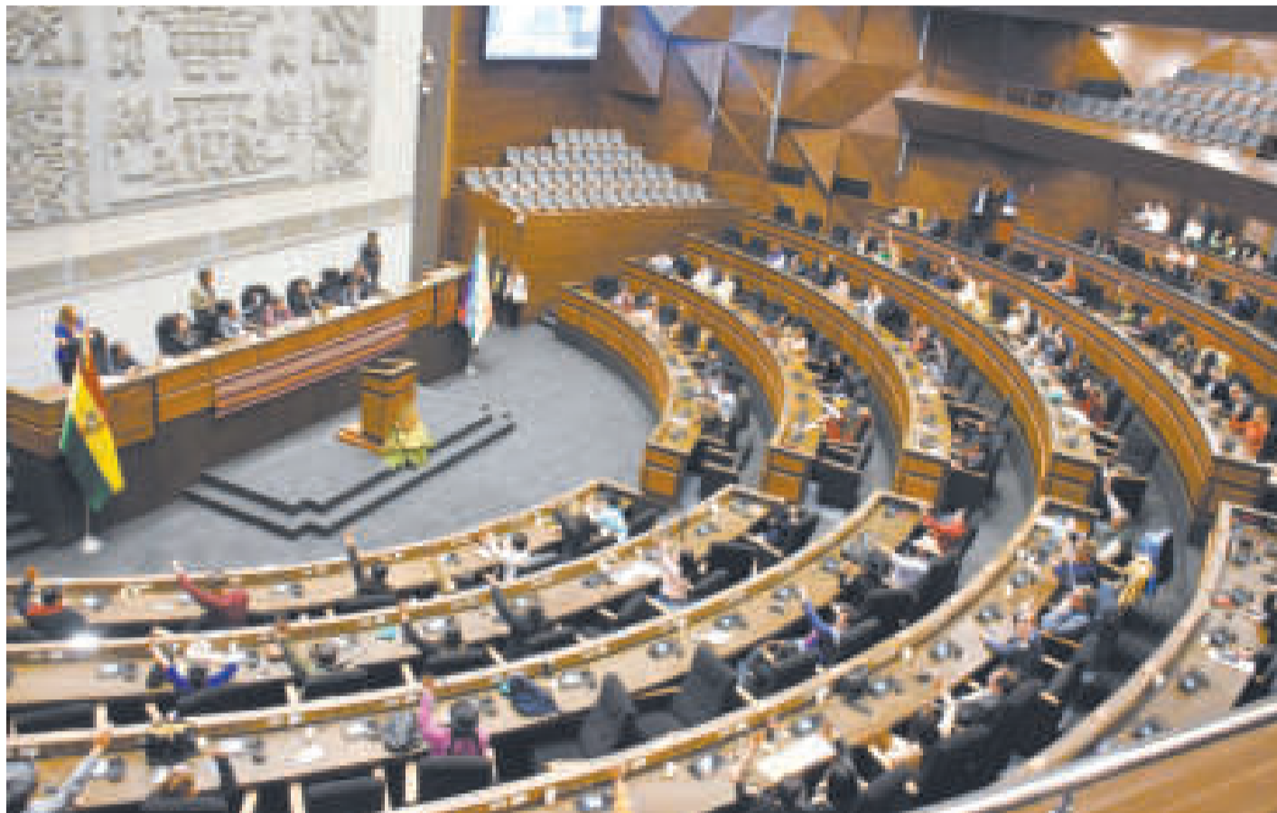
La Asamblea Legislativa Plurinacional (ALP) en la sesión de clausura de la gestión 2022-2023.