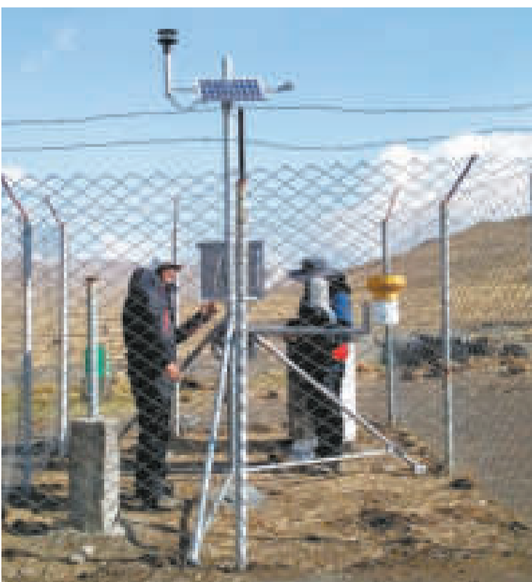
Especialistas manipulan los equipos que son parte del sistema.