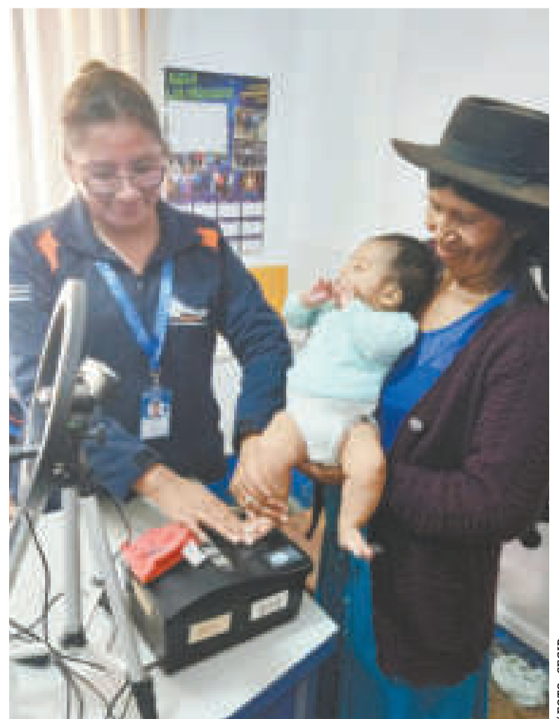
Una funcionaria toma la huella plantar de un niño para la primera cédula de identidad del menor.

Como una medida de seguridad, el nuevo documento contendrá un microtexto con la frase “recuperemos nuestro mar”