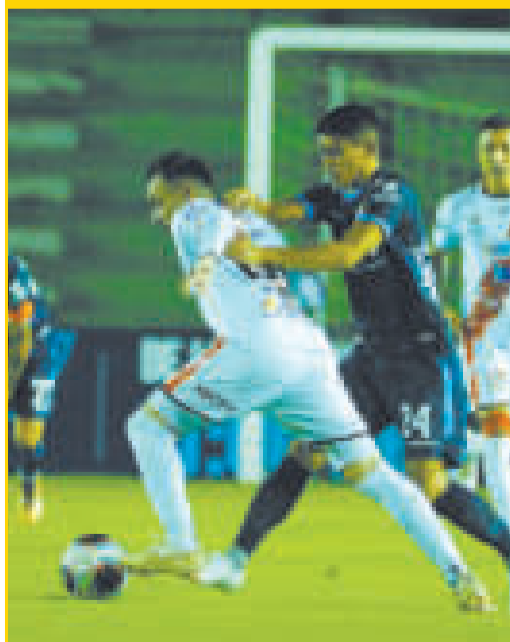
Una escena del cotejo disputado en el estadio 'Tahuichi'.

Blooming derrotó a Nacional Potosí por 2 a 1 y lo dejó fuera de la Copa División Profesional. El partido que cerró la serie C se disputó anoche en el estadio 'Tahuichi' Aguilera de Santa Cruz.