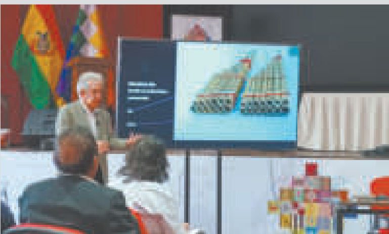
1.900 personas se inscribieron en la modalidad a distancia.