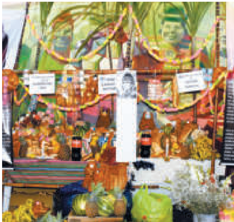
Una mesa tradicional del Día de Todos los Difuntos.