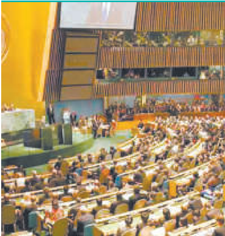
La Asamblea General de la ONU.