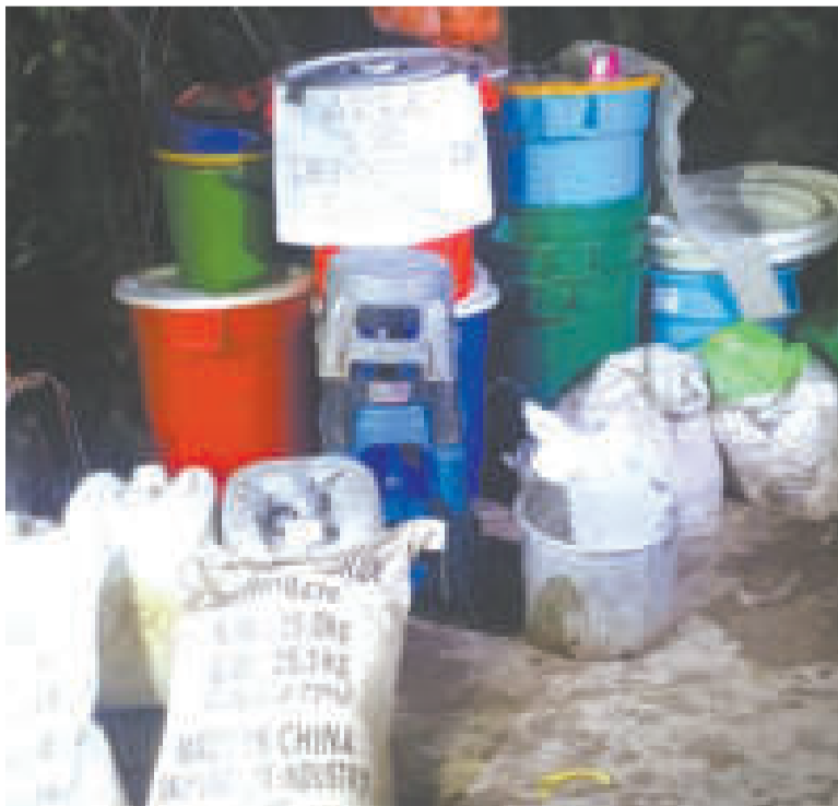
Sustancias químicas halladas en el emplazamiento del laboratorio.