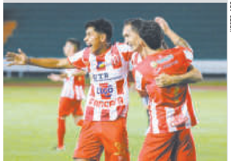
Jugadores de Inde festejan la victoria sobre Vaca Díez, en Sucre.

El elenco chuquisaqueño alcanzó ocho puntos; mientras que Vaca Díez se quedó con las ganas de avanzar más en el torneo, ya que solo sumó 12 puntos y llegó a la última fecha final dependiendo de otros resultados.