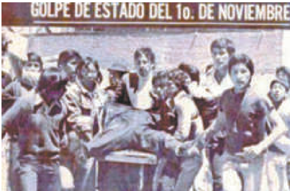
Universitarios transportan a un herido.