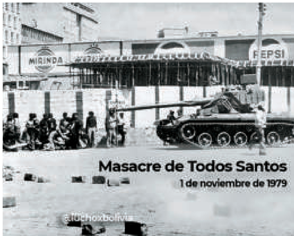
Militares y un tanque de guerra en el centro de La Paz.

En 16 días del golpe, habían sumado poco más de un centenar de muertos y un número similar de heridos.