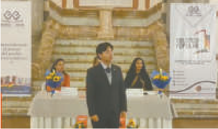
El acto de premiación tuvo lugar en el hall del Palacio Quemado.