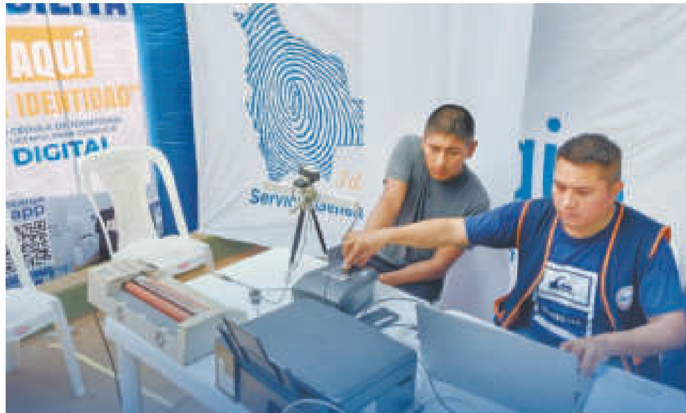
Un funcionario del Segip en pleno proceso de toma de datos para la emisión de una cédula de identidad.

La nueva cédula contará con papel sintético microporoso polímero preimpreso, con