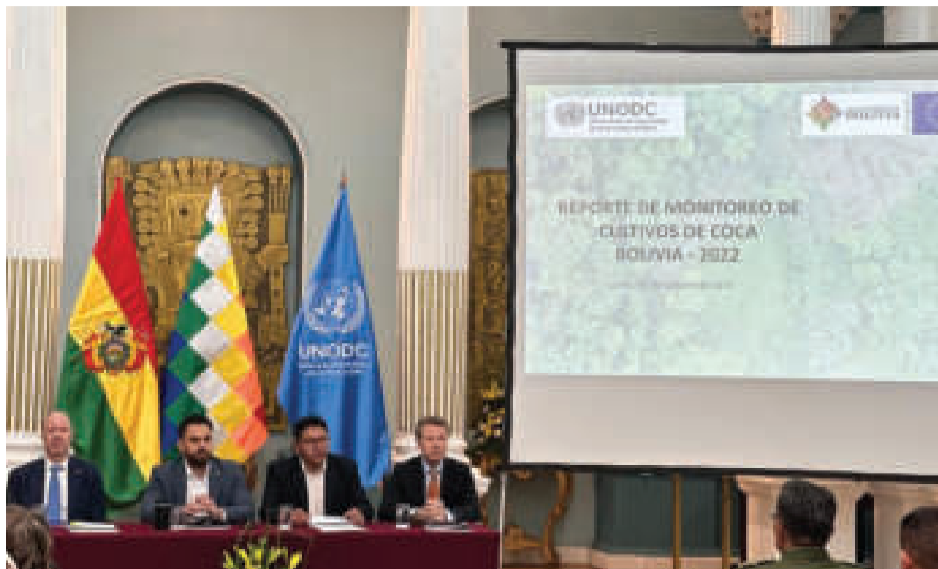
La UNODC y el Gobierno de Bolivia presentan el Informe de Monitoreo de Cultivos de Coca 2022 en la Cancillería.