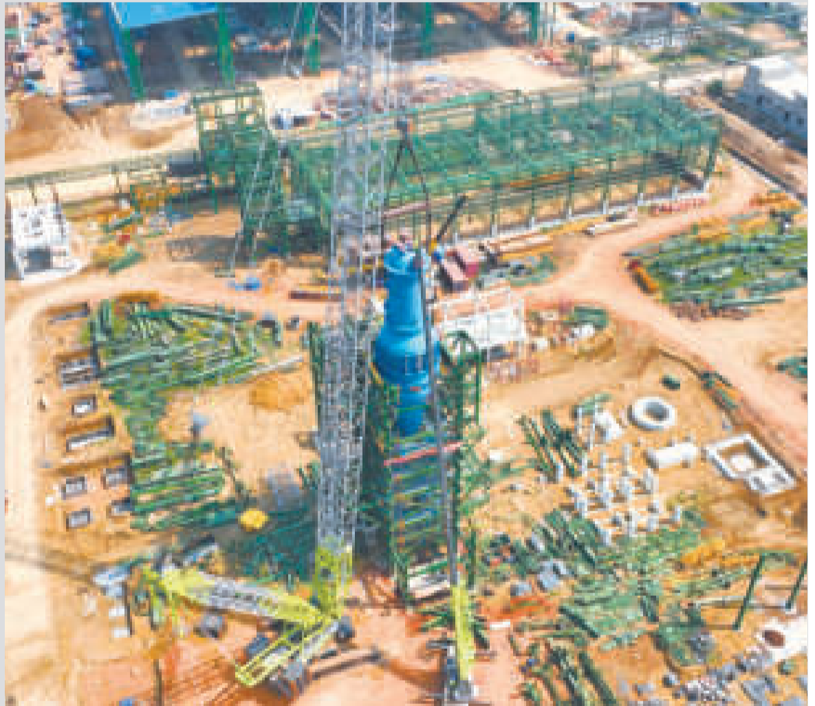
Las siete plantas estarán emplazadas en una superficie de 42 hectáreas.

YPFB realizó una inspección al complejo para garantizar y organizar los temas relacionados con el suministro.