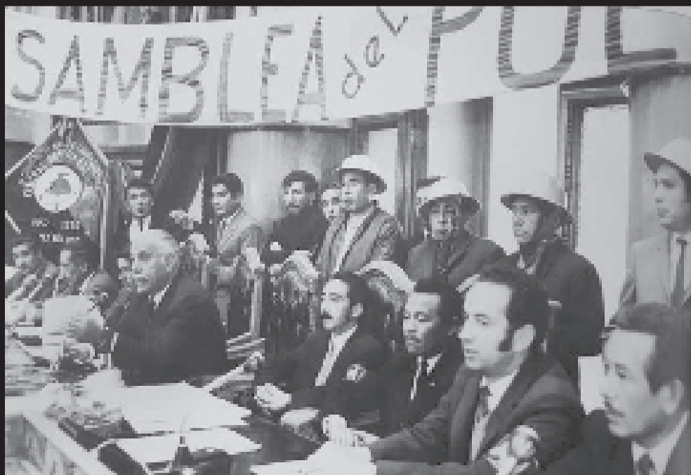
La Asamblea del Pueblo, uno de los hitos de la COB.