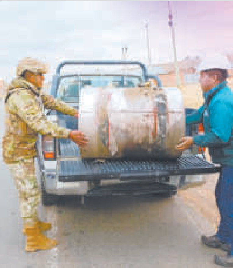
El Plan Soberanía permitió la incautación de 651 litros de combustible.