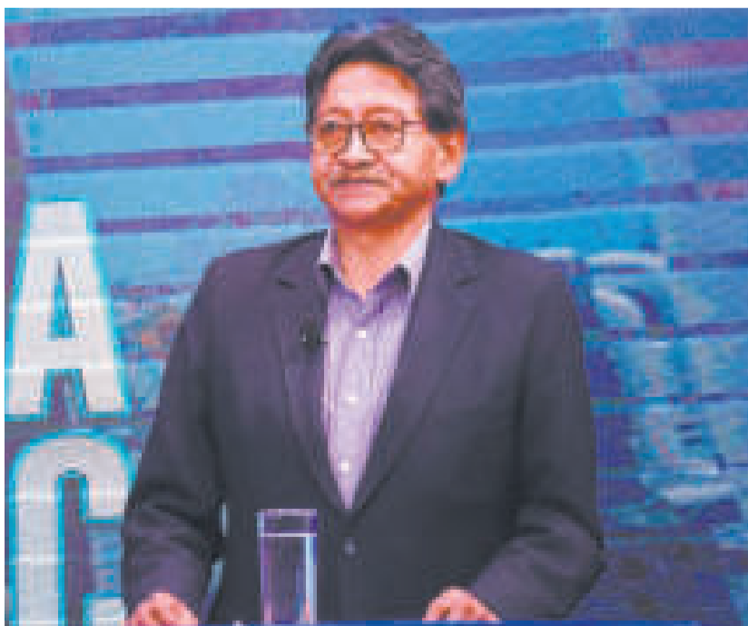
El ministro de Minería y Metalurgia, Marcelino Quispe.

La reunión se llevó a cabo en instalaciones del Ministerio de Minería y Metalurgia, en la ciudad de La Paz.