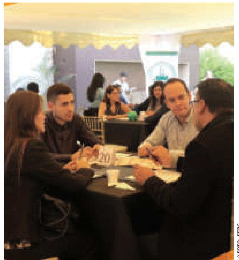
El convenio permitirá crear ruedas de negocios binacionales.

“Será una de nuestras primeras tareas, facilitar el acceso a lo que sea transporte consolidado de las pequeñas empresas, agilizar todos los trámites posibles, pero, sobre todo, acercar la oferta y la demanda con un país que tiene muchas posibilidades para Bolivia”, manifestó. El acuerdo permitirá crear ruedas de negocios binacionales.