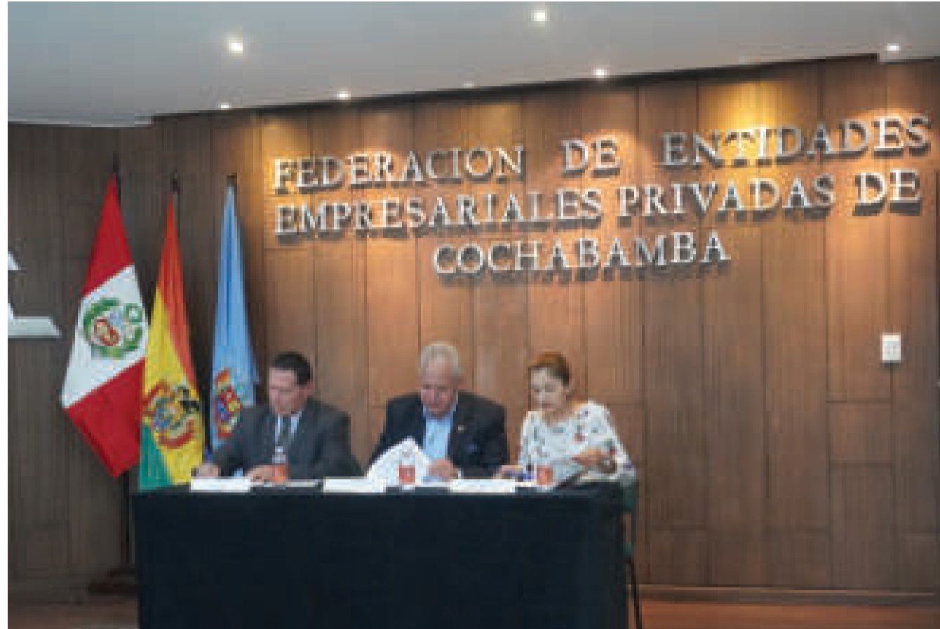
Firma del convenio entre los representantes de la FEPC y la Camcipeb.

En 2022 se registró un récord, logrando exportar un