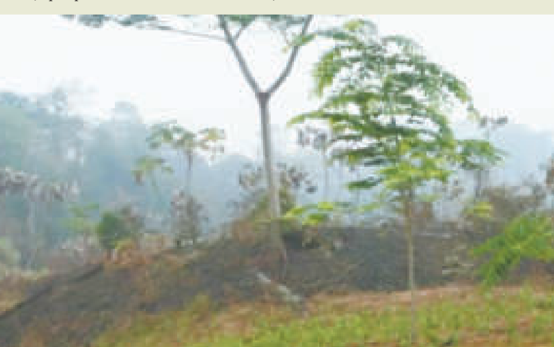
Vista parcial de la Reserva Forestal El Choré, en Santa Cruz.