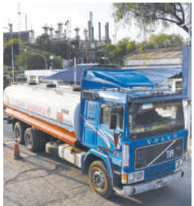
La distribución de combustibles está garantizada para todo el país.

Respecto a la gasolina, especificó que se tienen almacenados 20 millones de litros y en tránsito se cuenta con 9 millones de litros.