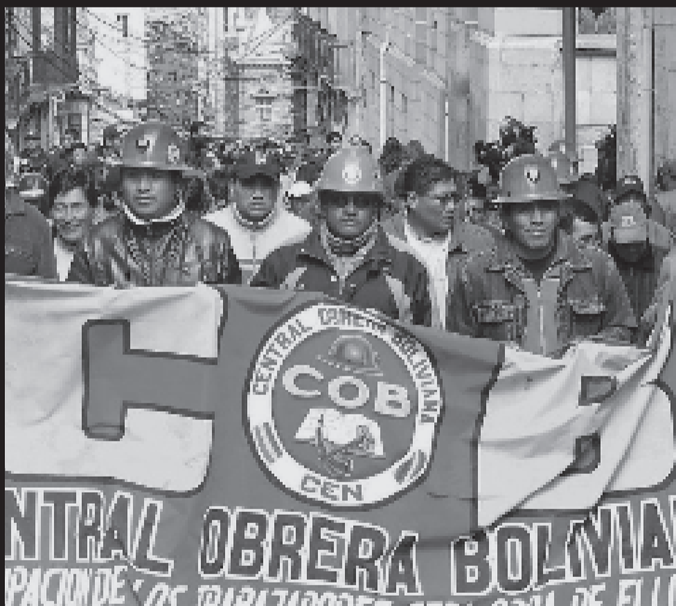
Una movilización de la COB.