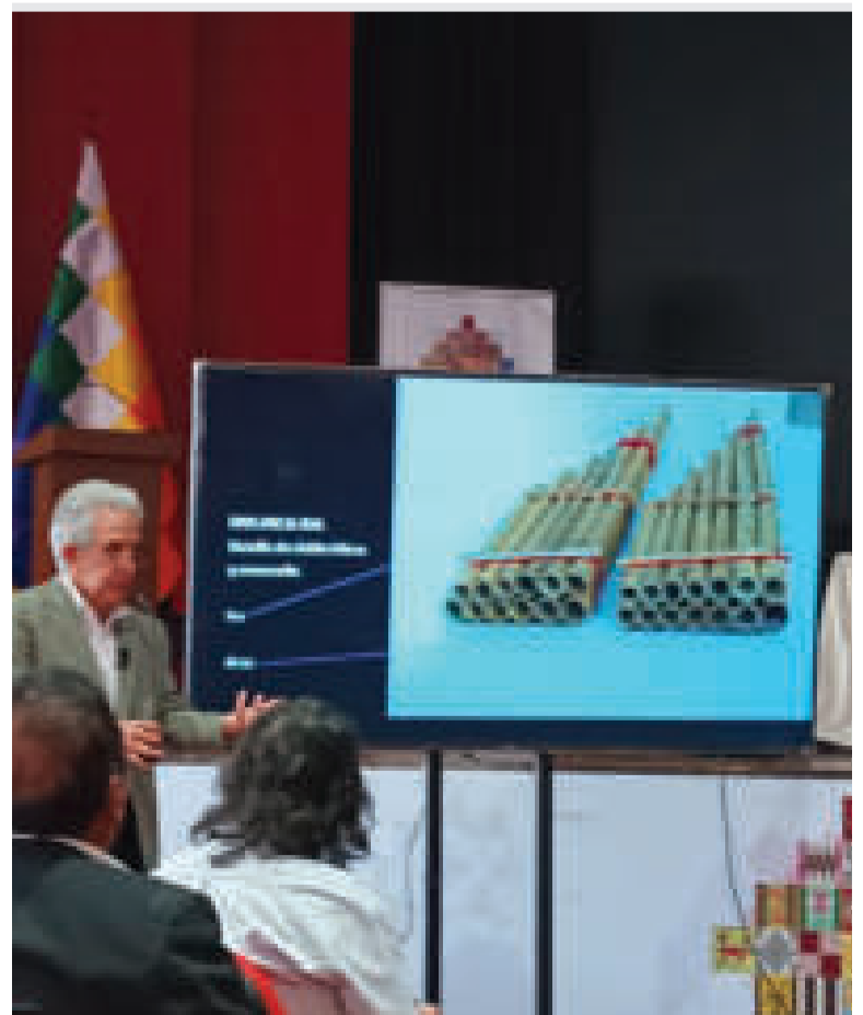
El músico y compositor Cergio Prudencio, durante una de las clases.

Verónica Armaza Especialista en Formación Superior Artística