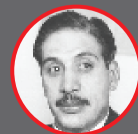
Juan Lechín Oquendo Fundador de la COB

Los trabajadores de las minas, que a través de una época ‘jabonada’ de sangre (...) os dicen por mi intermedio (...) que lucharán sin claudicaciones para consolidar la Revolución Nacional y devolver a Bolivia el control de sus riquezas”.