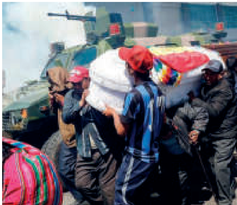
Familiares de las víctimas de la masacre de Senkata.