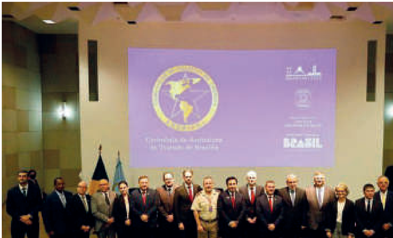
Los representantes de la región en la consolidación jurídica de Ameripol.