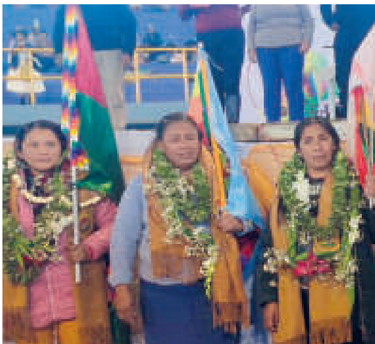
Integrantes del nuevo Comité Ejecutivo Nacional de las Interculturales.