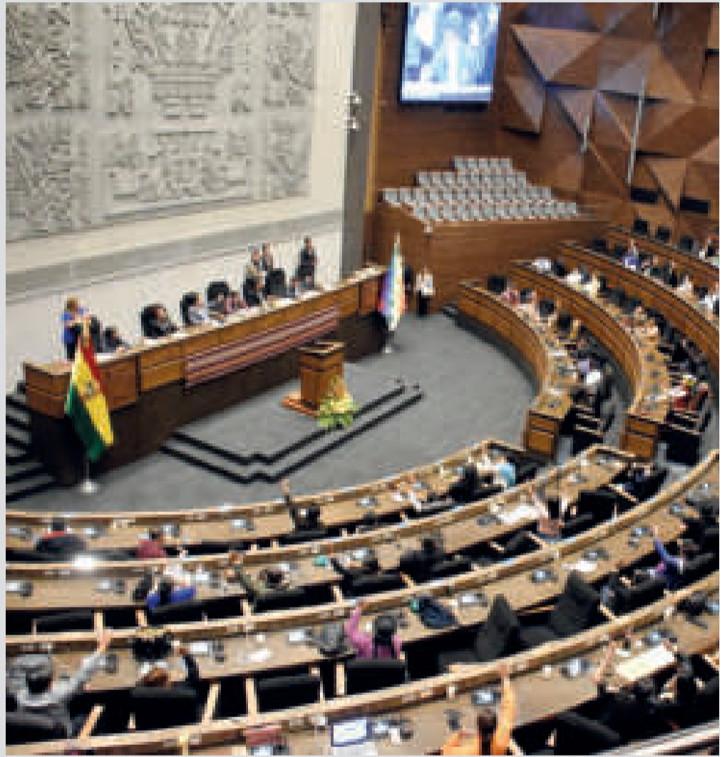
La Asamblea Legislativa sesionará esta tarde desde las 15.00.