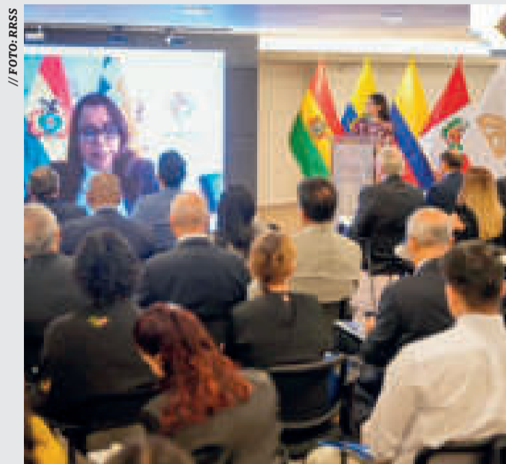
Presentación del programa de formación digital.

El programa Conecta Empleo, dentro de los alcances