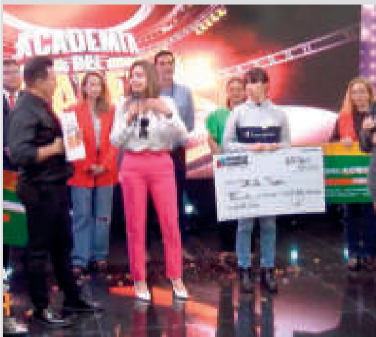
La final de la Academia del Saber, Santa Cruz.