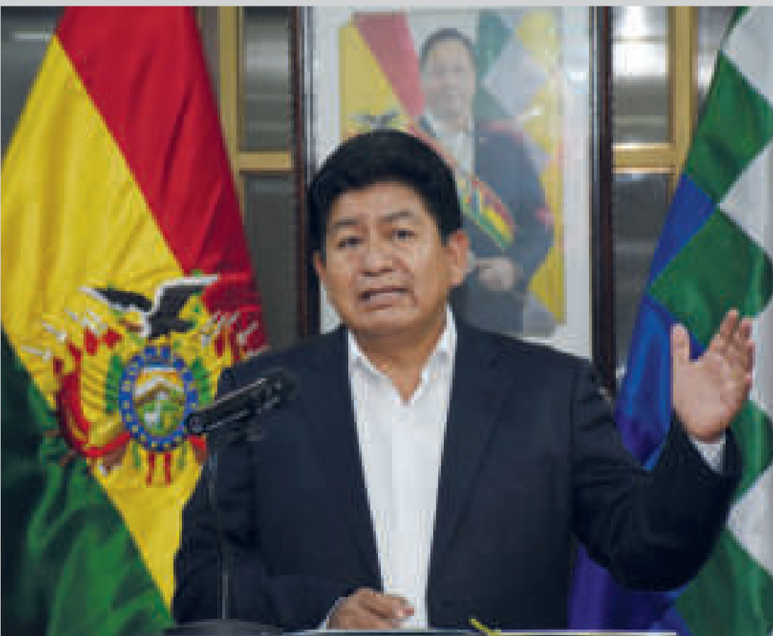
El ministro Édgar Montaño participará en el acto de lanzamiento de la licitación de la obra.

Según la invitación, la ceremonia de lanzamiento de la licitación internacional se celebrará en la Sala Interactiva del Ministerio de Transportes del Brasil.