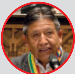
DAVID CHOQUEHUANCA es presidente nato de la Asamblea Legislativa Plurinacional.

La convocatoria fue emitida el viernes, dos días después de que los alcaldes de la Asociación de Municipios de Santa Cruz (Amdecruz) instalaran una vigilia en la puerta principal de la Asamblea Legislativa, en La Paz,