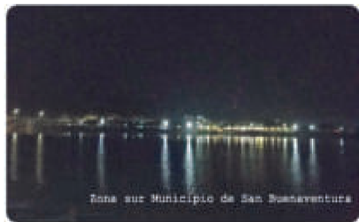
Imagen antigua difundida por medios de comunicación y RRSS