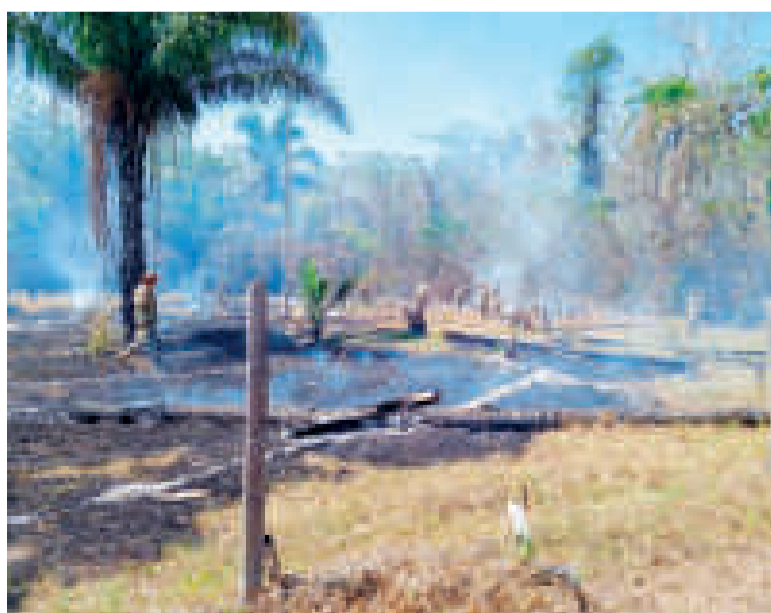
Otro lugar sofocado por la Brigada de Bomberos de las FFAA.

lo afectado, que no se sabe si estaba abandonado.