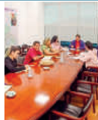
El mandatario boliviano en reunión.

En la oportunidad, el país presentó el plan de trabajo que propone un ejercicio mancomunado en la subregión a través de seis ejes: la reingeniería de la Comunidad Andina, la convergencia con otros bloques de integración, la integración social y cultural, la reactivación de temas medioambientales, la lucha contra el contrabando y la promoción turística y comercial de la región.