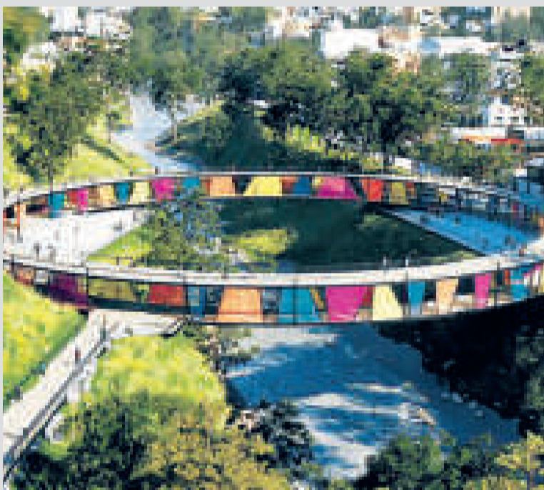
La obra tendrá una extensión de 17,5 kilómetros.