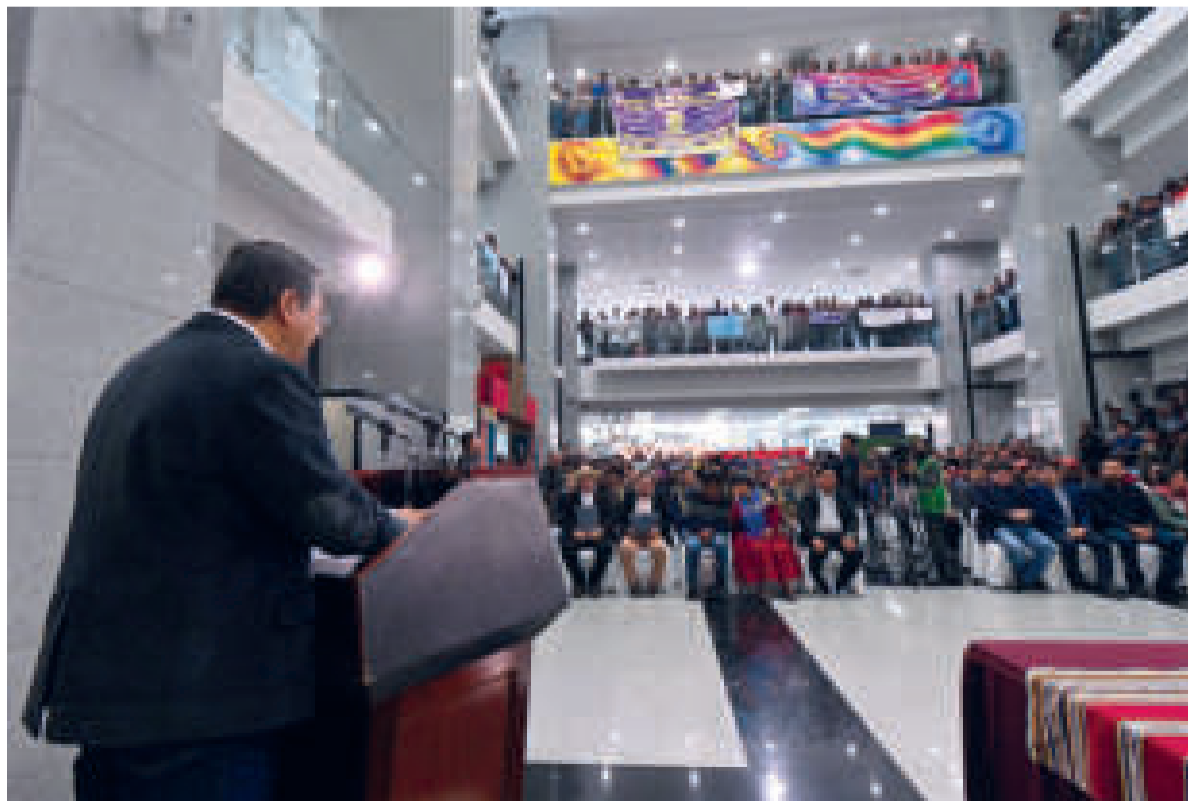
El acto de promulgación del PGE en la Casa Grande del Pueblo.