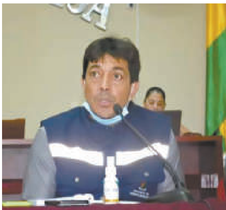
El exministro Víctor Hugo Zamora.

“El Ministerio Público, a instancia del Ministerio de Hidrocarburos y Energías, así como Yacimientos Petrolíferos Fiscales Bolivianos y otros, instauró un proceso penal en contra de Víctor Hugo Zamora y otros por los delitos de incumplimiento de deberes y conducta antieconómica, debido a que paralizaron la Planta de Amoniaco y Urea que se encuentra ubicada en Bulo Bulo, en el departamento de Cochabamba”, explicó.