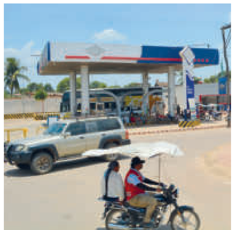
Una estación de servicio en Beni.

MILLONES DE LITROS de diésel oíl se comercializaron en Beni entre enero y octubre de este año.