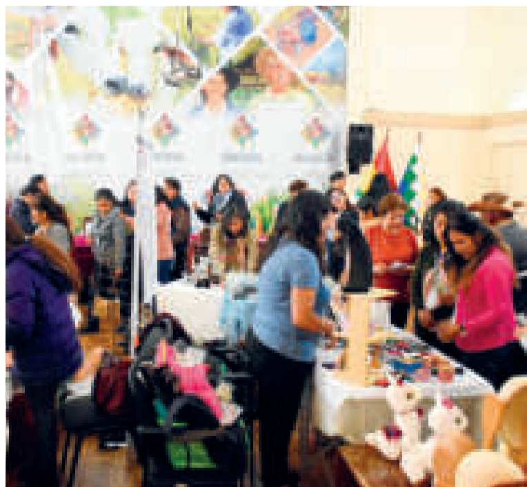
Parte de las productoras que participaron en la feria.

La actividad también permitió promocionar y comercializar la producción de las mujeres productoras.