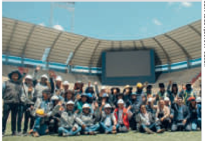
La alcaldesa de El Alto, Eva Copa, junto al personal encargado de la obra.

También se instaló una pantalla LED de 12 metros de ancho por siete de alto con una definición HD y 14 parlantes de última generación.