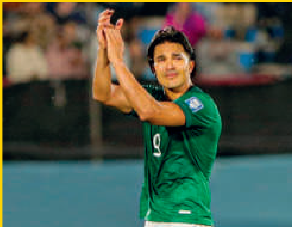
Marcelo Martins en el momento de su despedida de la Selección nacional.