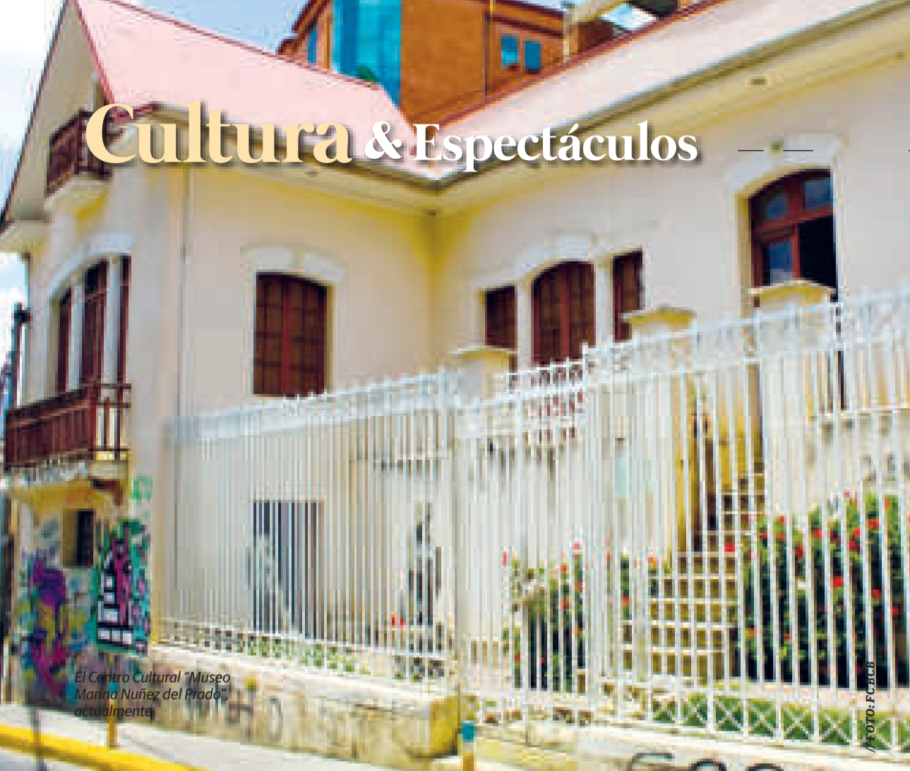
El Centro Cultural "Museo Marina Núñez del Prado", actualmente.