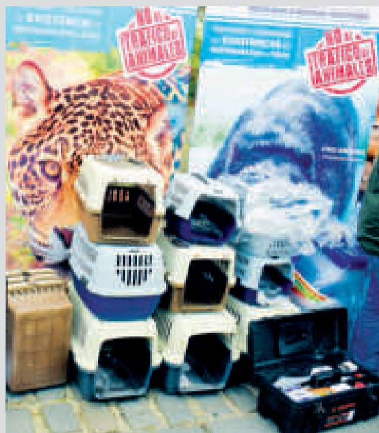
El Gobierno envió material para colaborar con el rescate de animales.