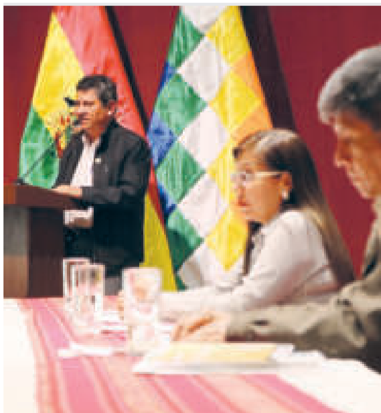
Autoridades ministeriales durante el conversatorio.