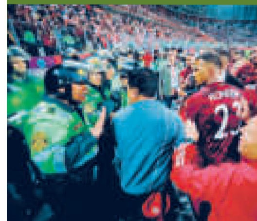
Policías peruanos usan la fuerza contra los venezolanos.

El empate 1-1 entre Perú y Venezuela también registró desmanes una vez finalizado el encuentro, con el accionar de la fuerza policial sobre algunos futbolistas de la Vinotinto en su intento de saludar a los hinchas.