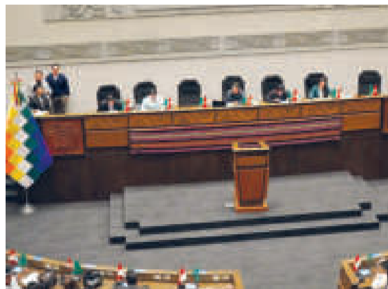
El pleno de la Asamblea.

y la conminatoria a la Asamblea —en especial, a quienes tratan de paralizar proyectos— se mantiene.