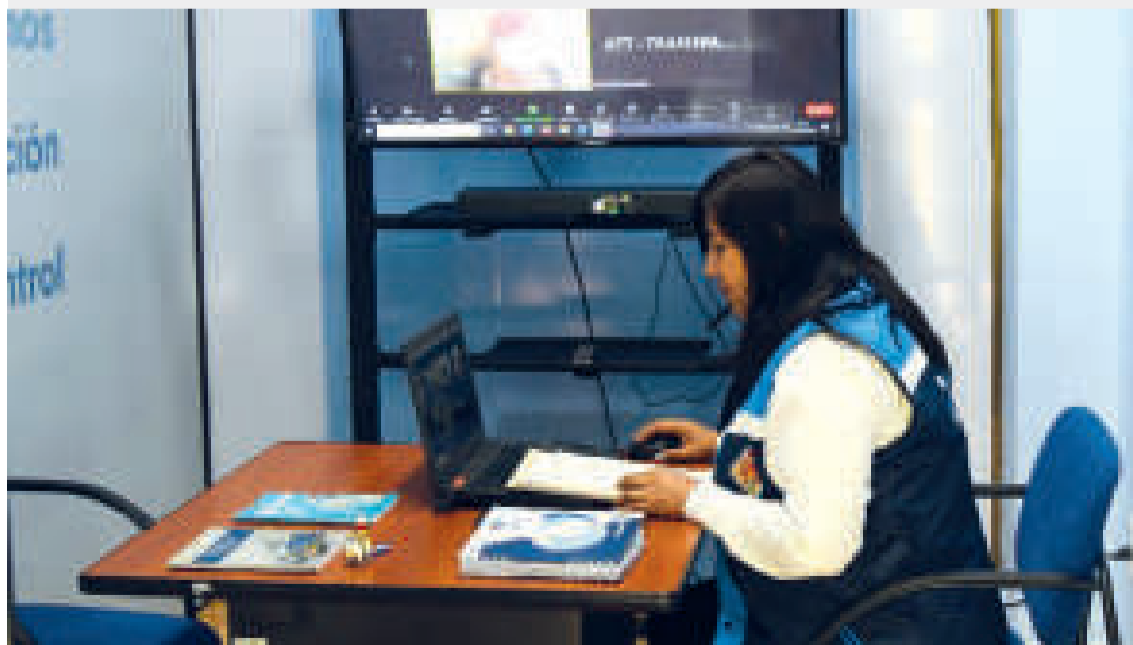
Las salas virtuales de ConciliaNET funcionan en oficinas de la ATT.

“ConciliaNET logra grandes beneficios económicos para el Estado y mejora de la relación entre el usuario y el operador, dando celeridad al proceso y el cierre pronto y efectivo de los procesos”, recalcó.