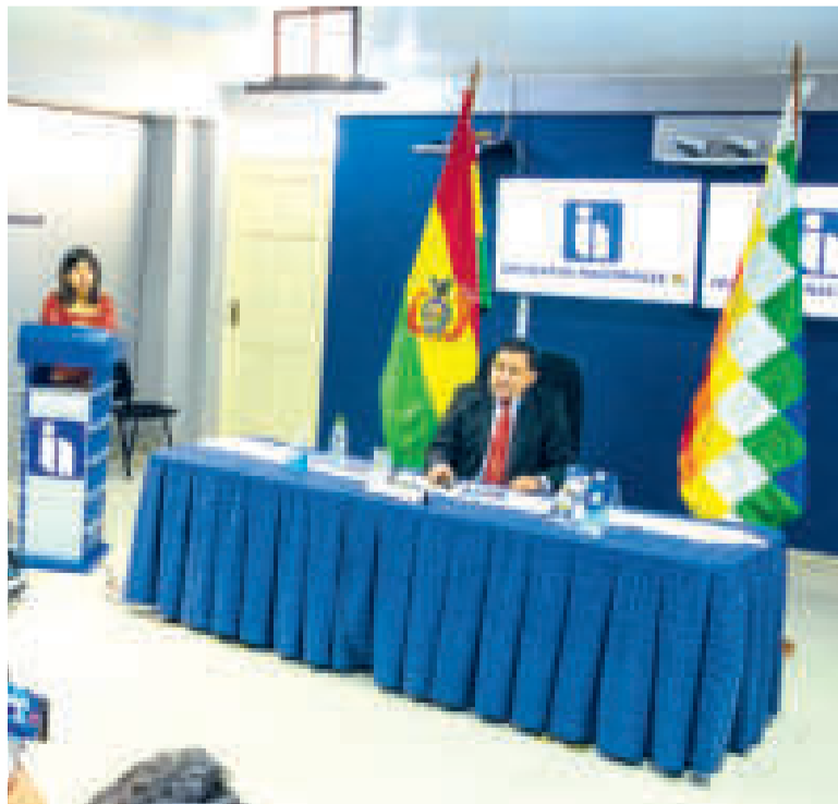
El presidente del SIN, Mario Cazón, en conferencia de prensa.

Con el lanzamiento de Mensajes, Avisos y Notificaciones, el SIN cumple además compromisos asumidos con sectores como el transporte para fortalecer la comunicación hacia los contribuyentes.