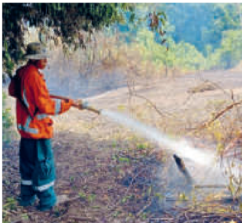
Un bombero forestal en tareas de mitigación.