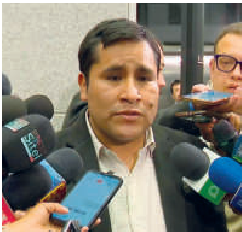
El presidente de la Cámara de Diputados, Israel Huaytari.