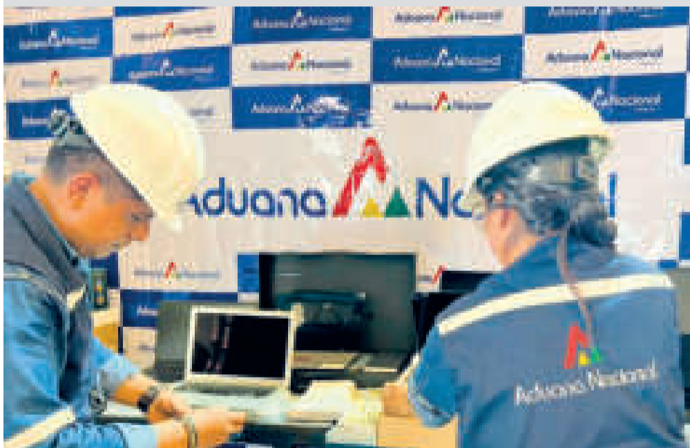
El personal de la Aduana expone los productos decomisados.

A TRAVÉS DEL CONTRABANDO se busca evadir el cumplimiento del pago de impuestos aduaneros al internar mercadería al país.