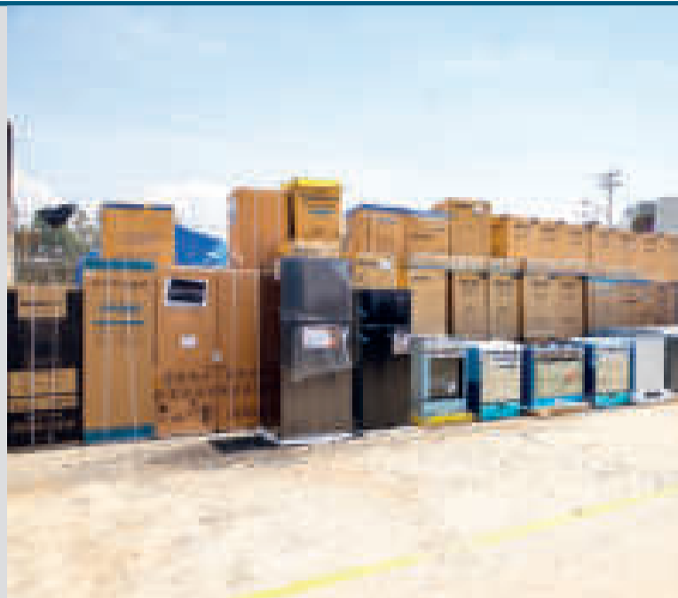
Decomiso de electrodomésticos de contrabando.

naves y sus partes; Bs 17 millones, de máquinas, aparatos y artefactos mecánicos; Bs 14 millones, de ropa usada; Bs 13 millones, de aceites esenciales y resinosos; Bs 13 millones, bebidas y líquidos alcohólicos; Bs 12 millones, productos de molinería; Bs 11 millones, de prendas y accesorios de vestir; Bs 8 millones, instrumentos y aparatos de óptica; Bs 117 millones, otras mercancías.