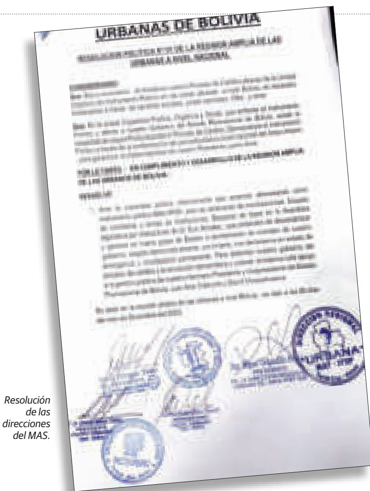
Resolución de las direcciones del MAS.

Las direcciones urbanas también determinaron el respaldo y compromiso con la administración del Jefe de Estado y el vicepresidente Choquehuanca, así como con el proceso de industrialización.