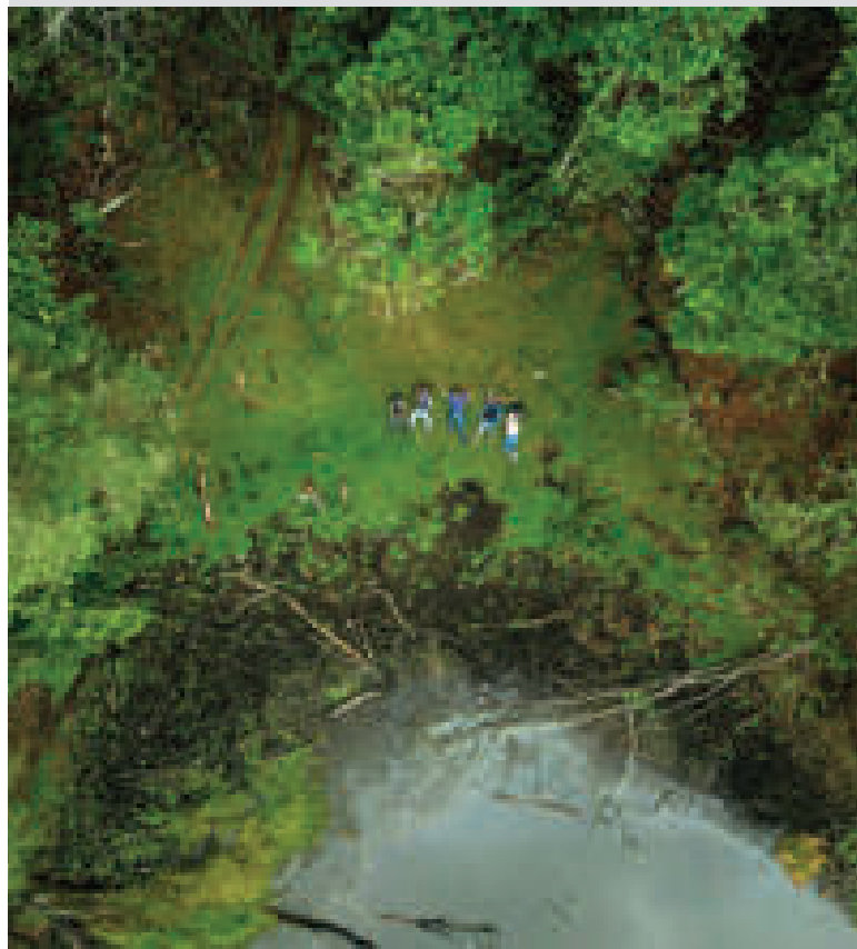
Un destino turístico en el municipio de Cajuata, La Paz.

NINGÚN VEHÍCULO PUEDE CIRCULAR SIN EL SEGURO