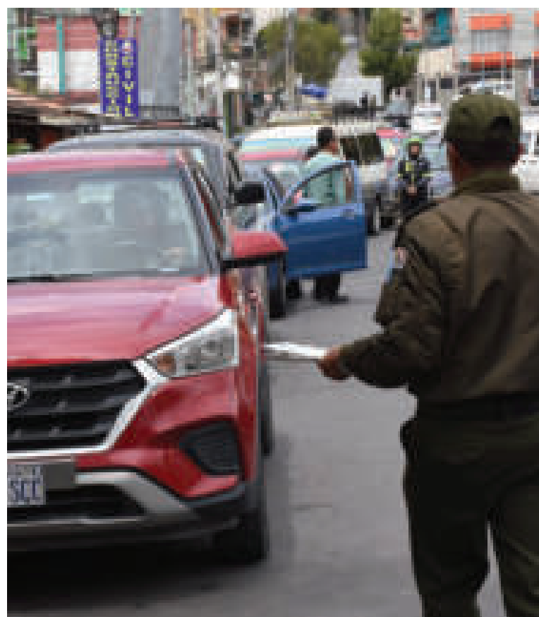
Inspección del SOAT.

En 2023 se registraron más de 15 mil accidentes. “Nadie está libre de un accidente, así que seamos más cuidadosos y responsables. Compremos el SOAT por responsabilidad”, exhortó.