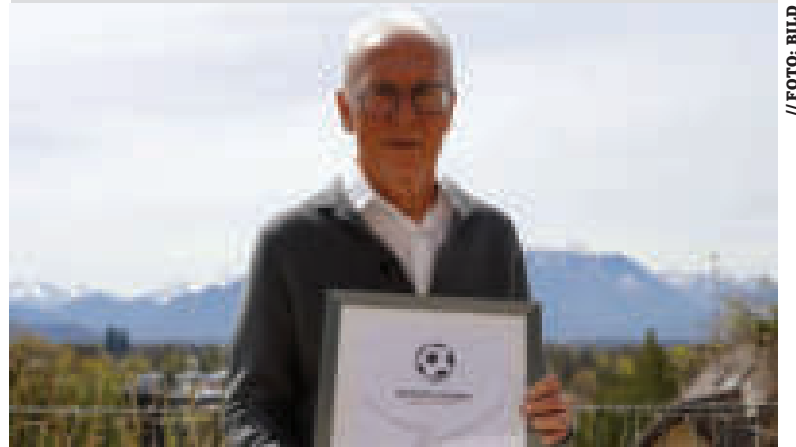
Franz Beckenbauer, leyenda del fútbol alemán.

"Si dijera ahora que está bien, estaría mintiendo, y no me gusta mentir. No le va bien, es un sube y baja constante", reveló su hermano.