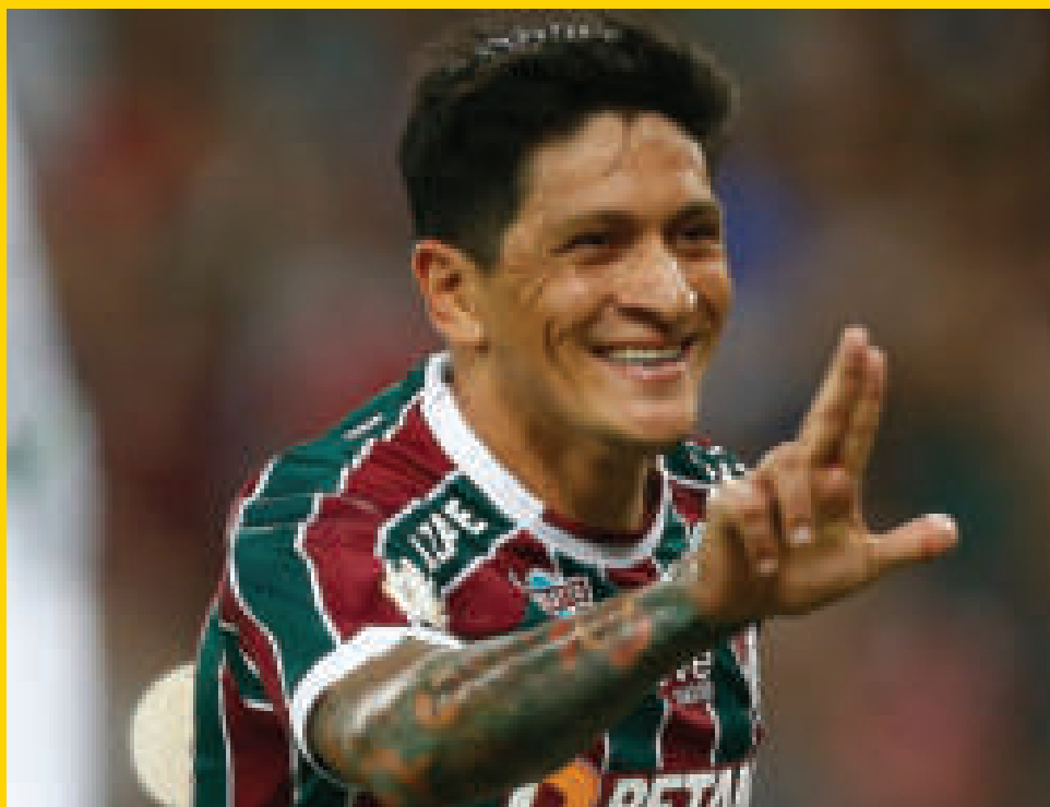
El delantero argentino Germán Cano, del Fluminense, es el mejor futbolista de América.