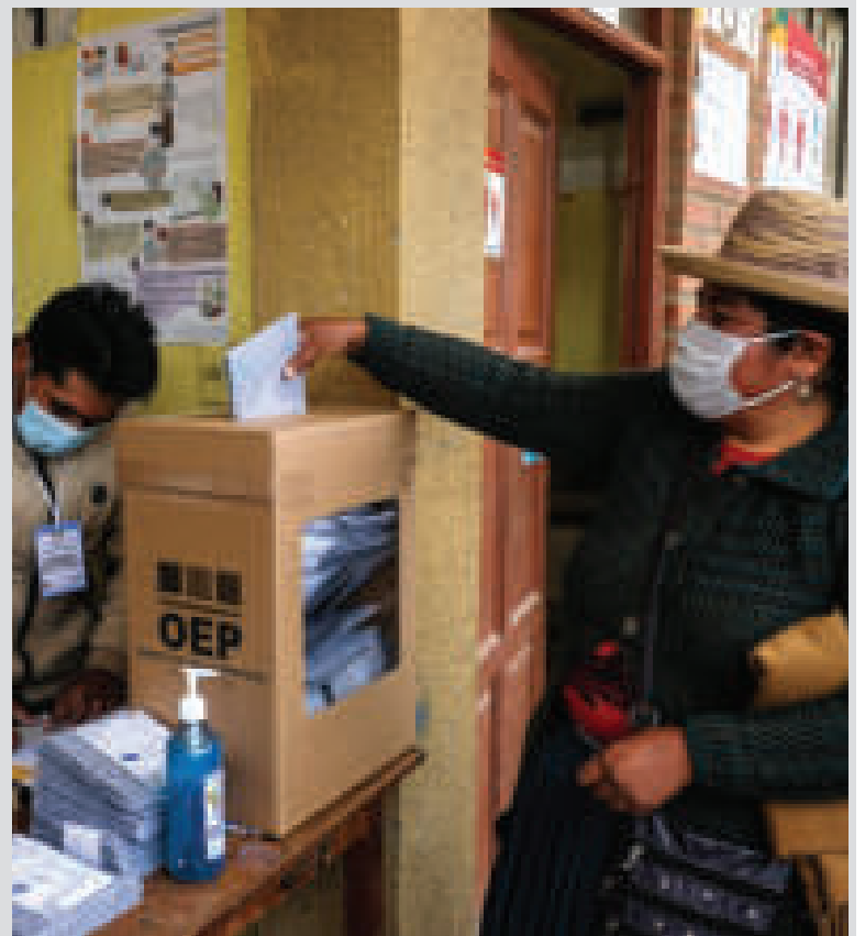
Bolivianos en las elecciones generales de 2020.

“Desde el criterio teleológico, tampoco se puede arribar a que de manera discontinua se puede ser elegido nuevamente, puesto que el fin del Constituyente es evitar de cualquier modo, la permanencia de un mandatario por más de diez años, porque esto equivaldría a que se apodere del aparato estatal de manera exclusiva, acudiendo a una serie de artilugios, generándose así dictadura de un solo partido político en el poder(...)”, según reportó ABI.