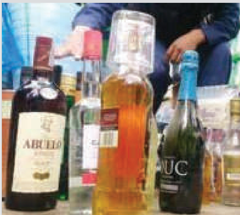
Controles en la venta de bebidas alcohólicas.