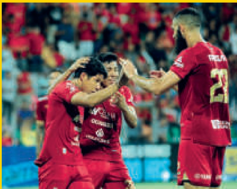
Futbolistas de Guabirá celebran el triunfo que los sacó de la comprometida zona del descenso.