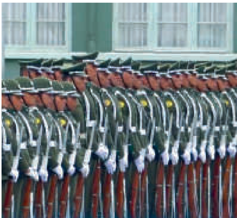
Cadetes de la Policía Boliviana.

Especificó que esas 100 postulaciones están dirigidas a los bachilleres que estén entre los “tres primeros lugares de su promoción”, que tengan una estatura mínima de 1,75 los varones y de 1,65 las mujeres.