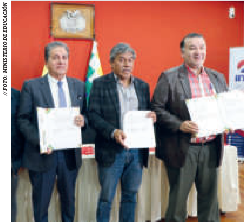
Autoridades, durante la firma del convenio.