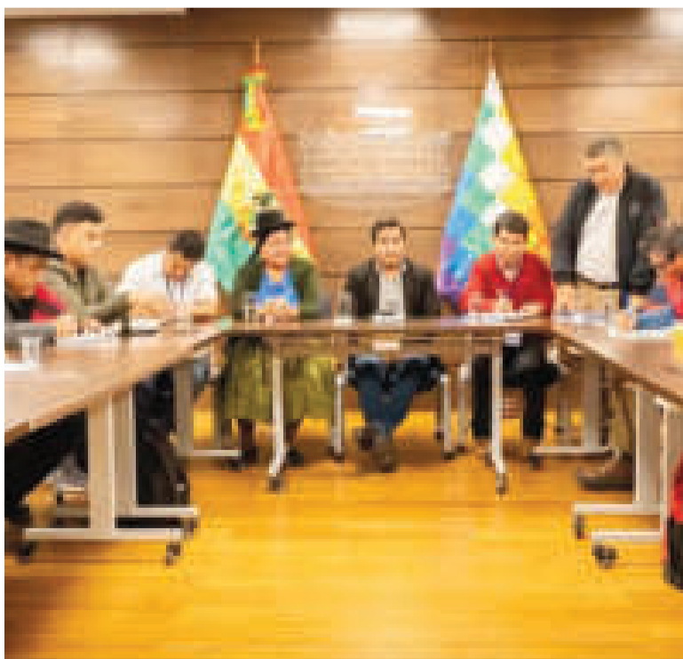
Reunión con autoridades departamentales y municipales de Potosí y Chuquisaca.