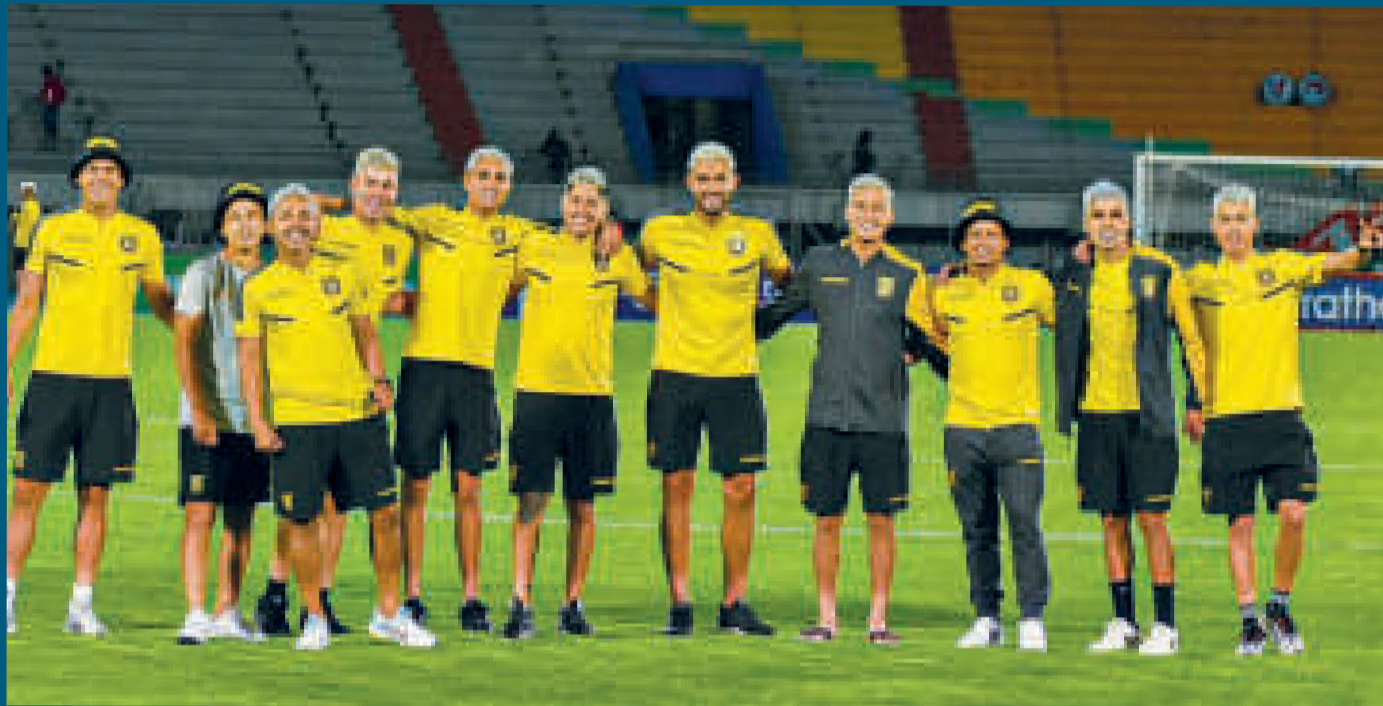
La confianza de los jugadores del Tigre por cerrar la temporada con una victoria ante Nacional.