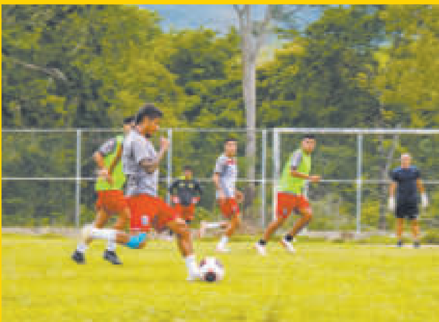
Futbolistas de San Antonio en el cierre de entrenamientos para el duelo de hoy ante Libertad GM.