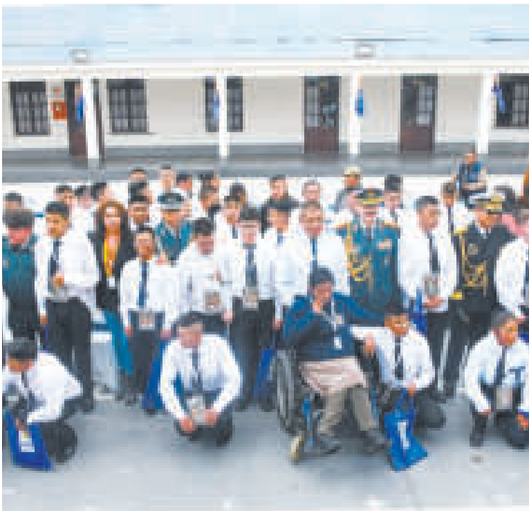
Acto de entrega de libretas de Servicio Militar.