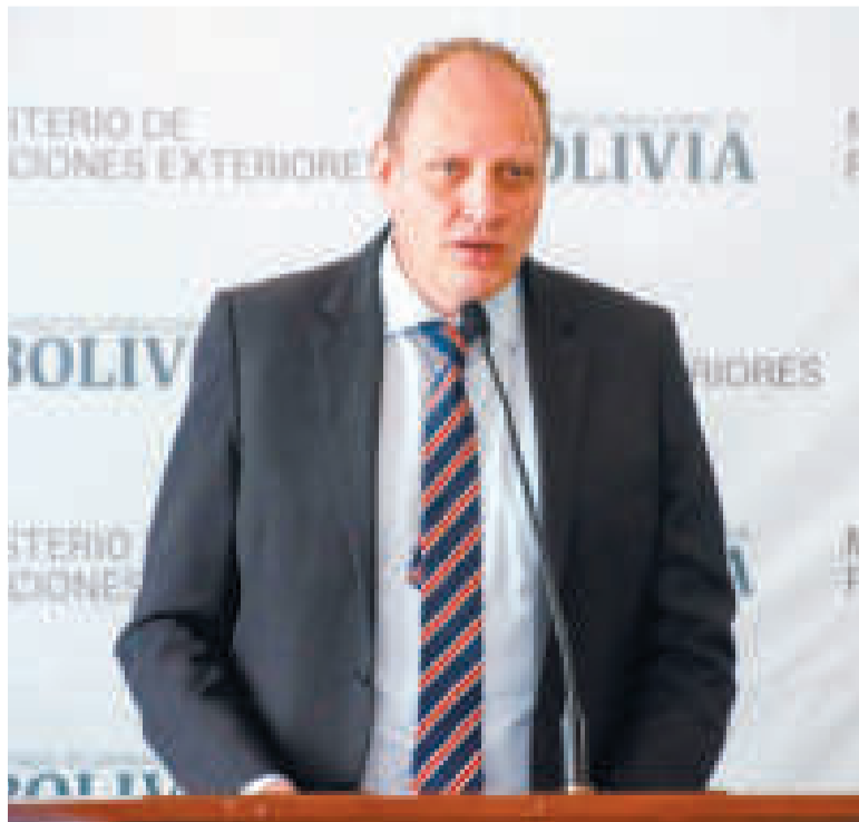
El viceministro de Comercio Exterior, Benjamín Blanco.