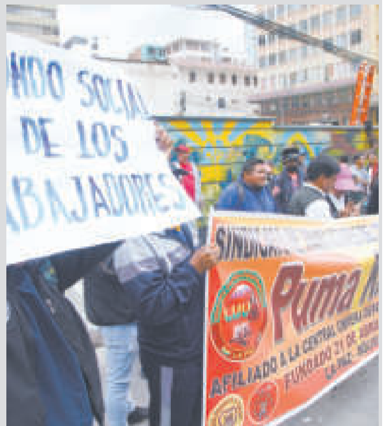
Los trabajadores durante la protesta.

Otro elemento que tendría que haberse tratado ayer, en una sesión extraordinaria, fue el reformulado del POA 2023 y también se iban a tratar elementos del presupuesto de 2024. Sin embargo, después de los pedidos expresos del burgomaestre los concejales de su partido no se hicieron presentes, como tampoco lo hicieron otras dos concejalas opositoras, quienes solicitaron licencia por todo el día.