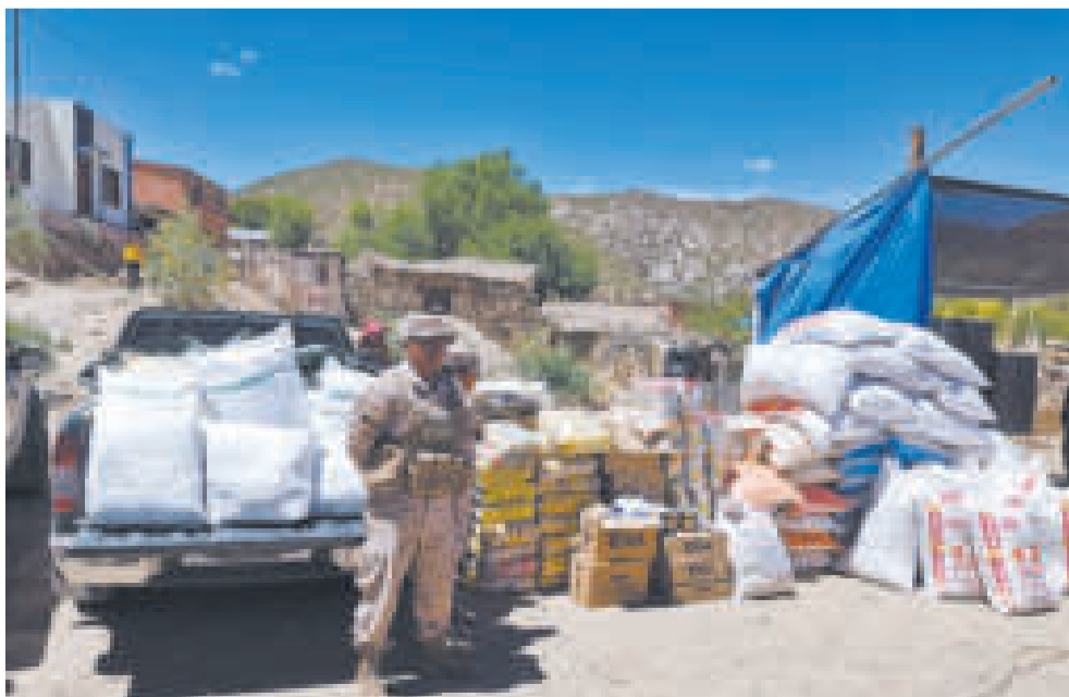
Ayuda humanitaria para las familias damnificadas por la riada en Cotagaita.

Arce dijo que el Gobierno nacional, a través de sus ministerios, permanecerá en Cotagaita para colaborar a las familias damnificadas “hasta que tengamos esa sostenibili-