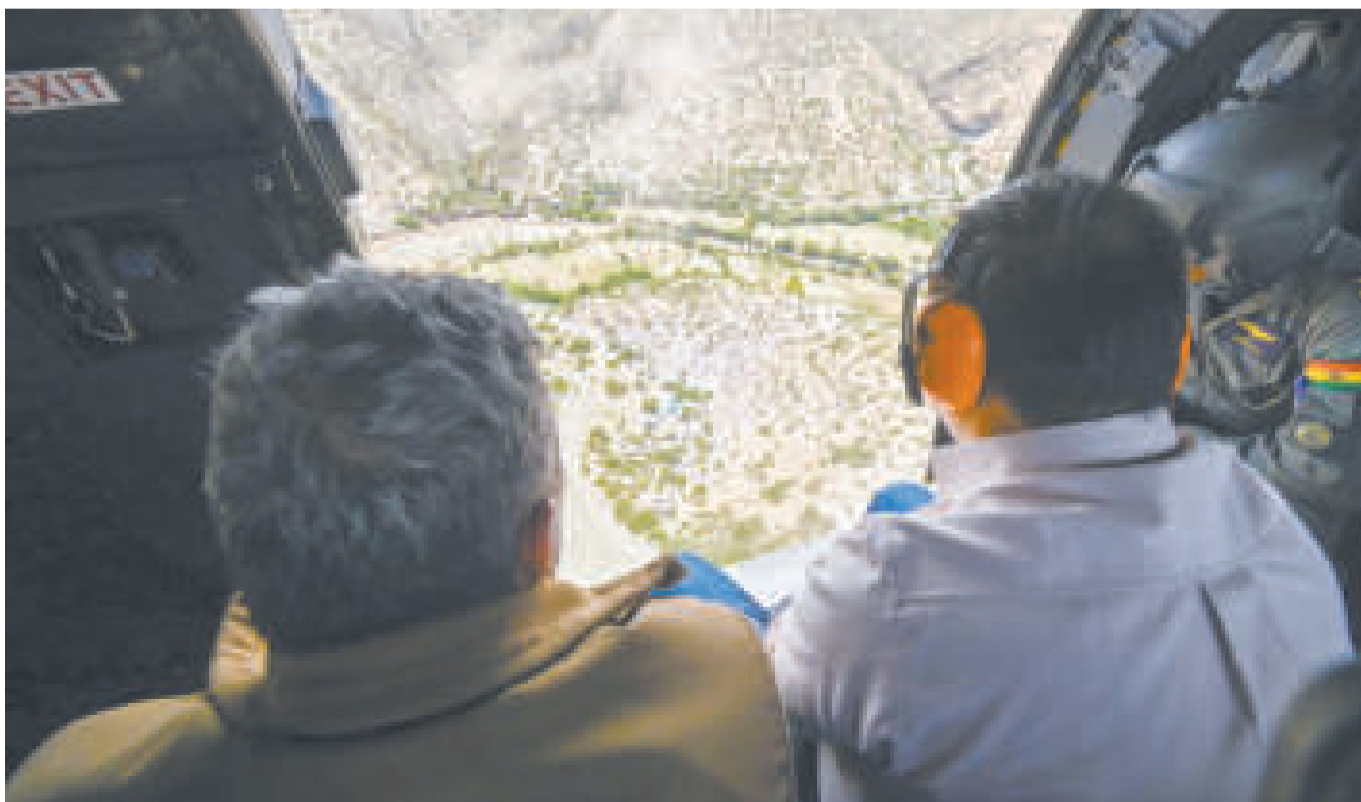
El Primer Mandatario sobrevoló la zona afectada en Cotagaita por una riada. Se estima que el 100% de los cultivos terminaron dañados.

Para esta semana el Servicio Nacional de Meteorología e Hidrología (Senamhi) activó alertas naranja y roja por posibles desbordes de ríos.