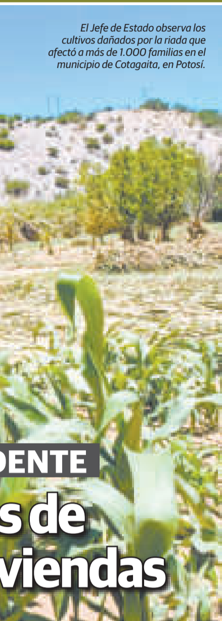
El Jefe de Estado observa los cultivos dañados por la riada que afectó a más de 1.000 familias en el municipio de Cotagaita, en Potosí.