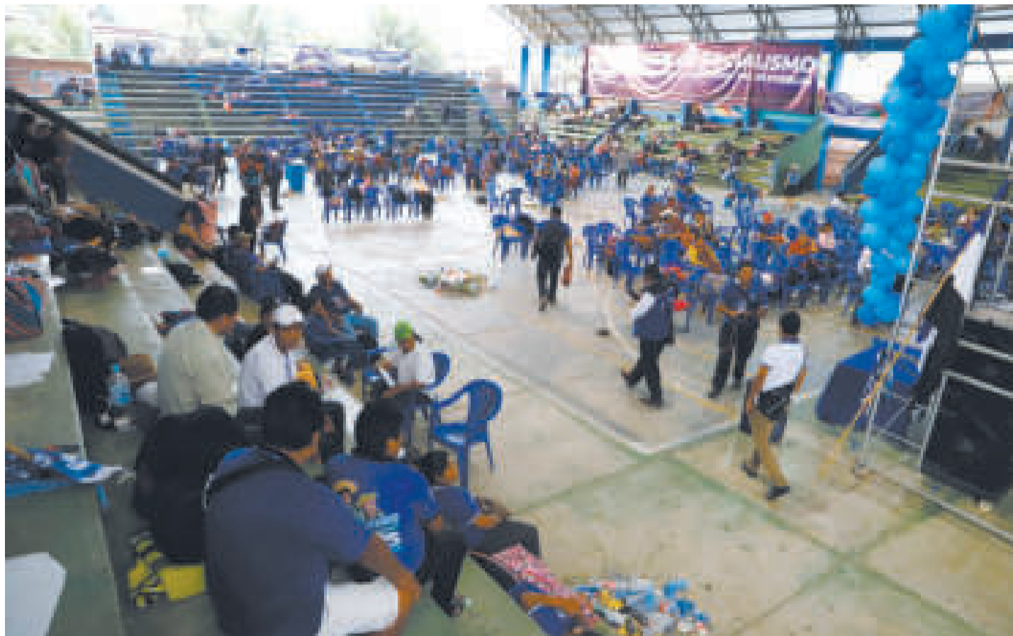
El congreso "evista", en Lauca Ñ, fue calificado de ilegal e ilegítimo.