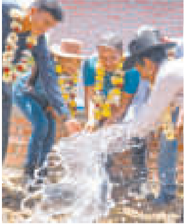
Uno de los sistemas de agua.