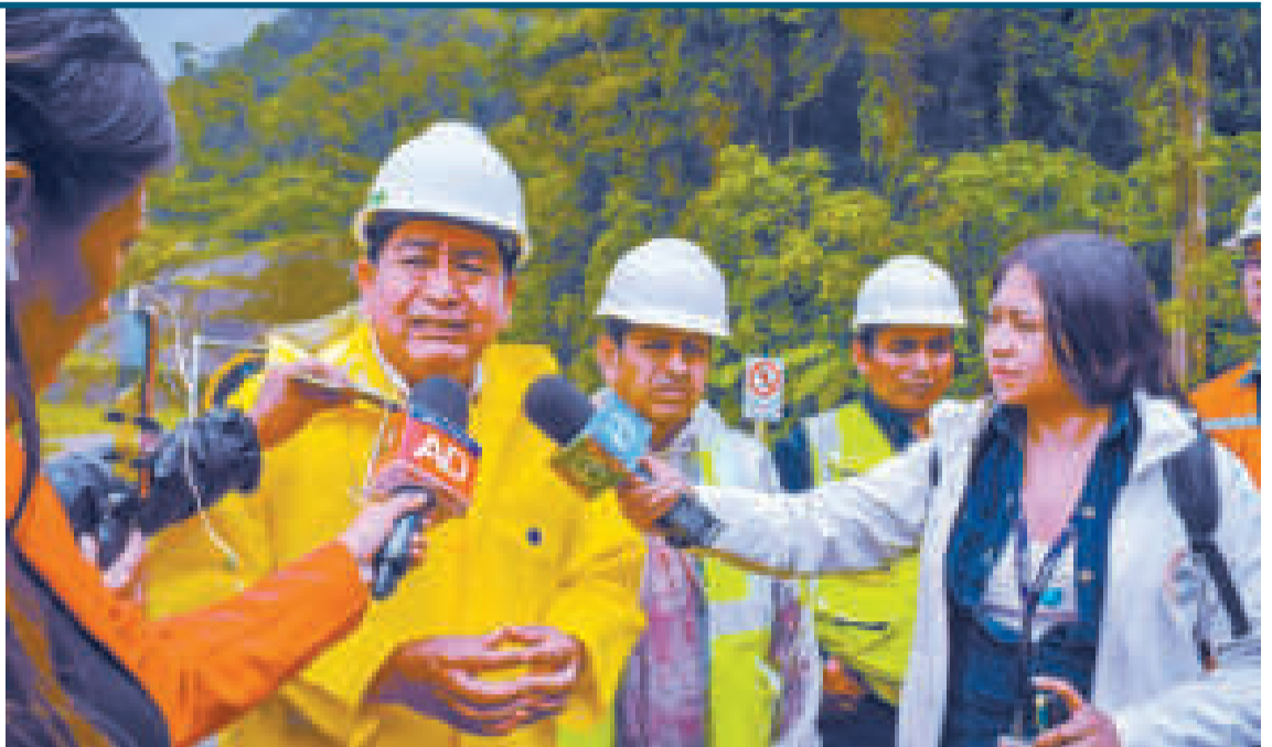
El ministro de Obras Públicas, Édgar Montaña, en rueda de prensa.

El municipio de Camargo, ubicado en el departamento de Chuquisaca, es conocido como la tierra del sol, del vino y del buen singani.