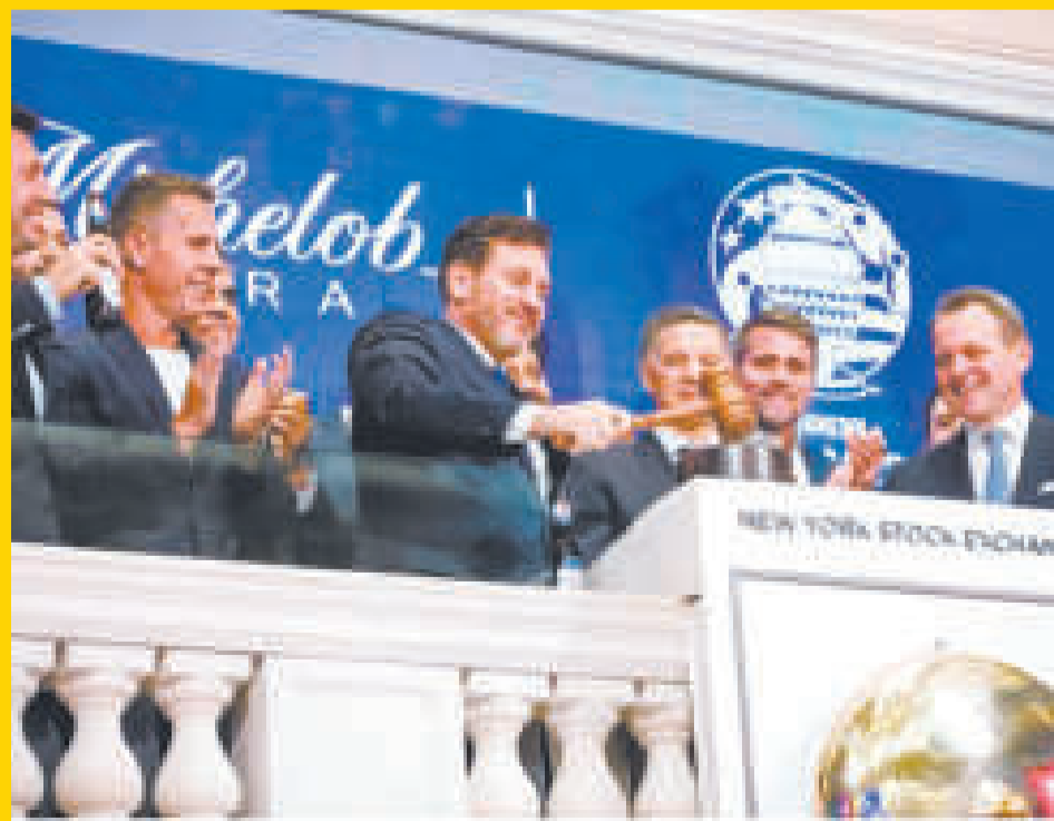
Alejandro Domínguez, titular de la Conmebol, durante la presentación de la Copa América.