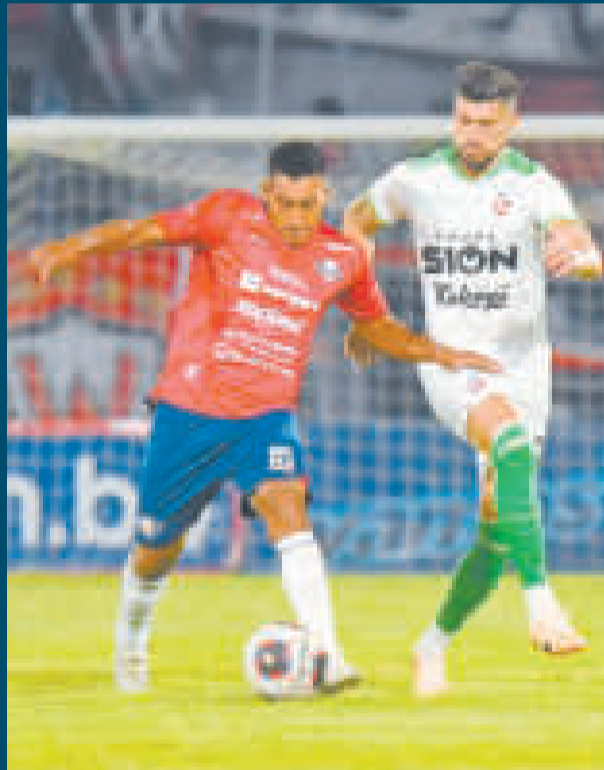
Machado (15) y Amoroso luchan por la posesión del balón.

El cotejo de vuelta se disputará mañana en el estadio 'Tahuichi' Aguilera de Santa Cruz. El Rojo con un empate será finalista del torneo.