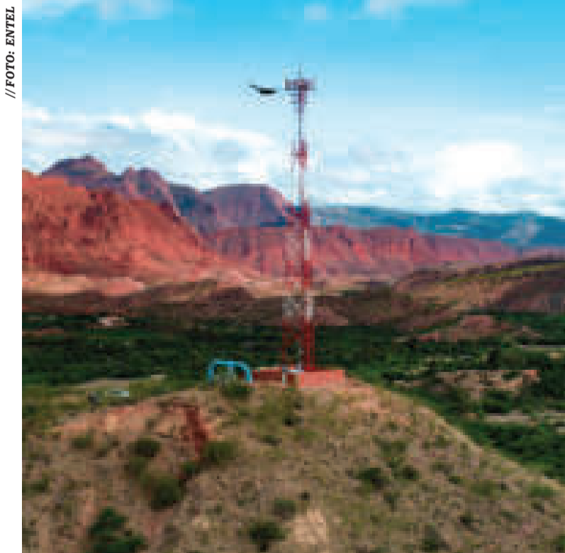
La radiobase emplazada por Entel en la comunidad Vivicha.

La obra está “en periodo de prueba” y la boleta de cumplimiento de contrato alcanza a los $us 29 millones.