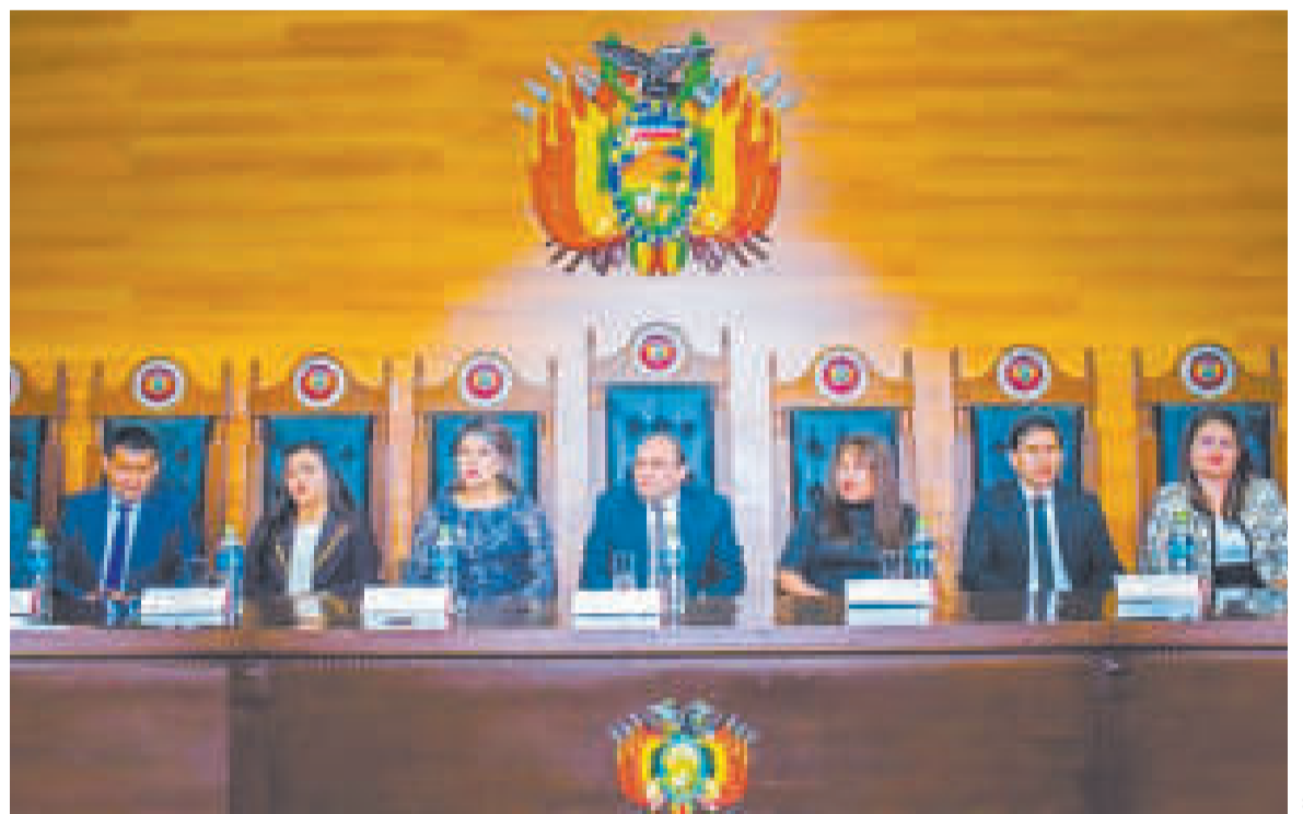
Magistrados del TCP.

“Si revisamos en los 410 artículos de la Constitución Política del Estado, en ninguno