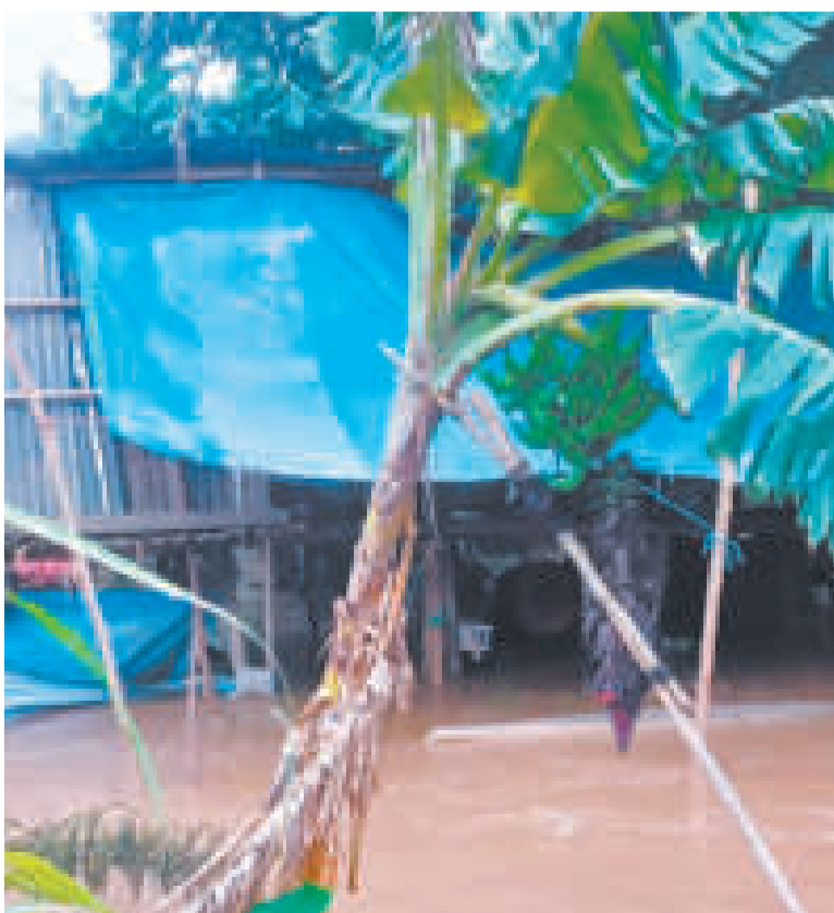
Cuatro departamentos podrían sufrir desbordes de ríos.

En el norte y Yungas de La Paz se prevén “potenciales” desbordes en los ríos Cotacajes, Boopi, Tamampaya, Solacama, Unduavi, Taquesi, Zongo, Yara, Alto Beni y Suches.