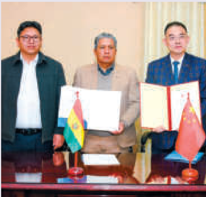
Autoridades nacionales y de China.

esta cooperación servirá para los trabajos posteriores a los incendios”, explicó, según cita un reporte del Ministerio de Relaciones Exteriores.