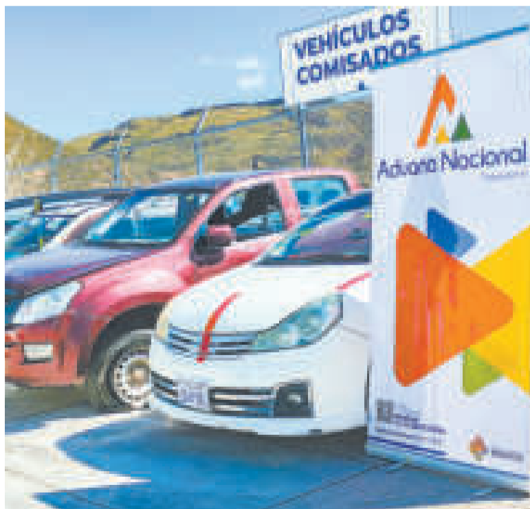
Parte de los vehículos incautados.