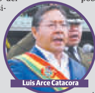
Luis Arce Catacora

“El país necesita más y mejores policías. Se debe exigir disciplina, ética y formación de excelencia en la Academia”, demandó el Primer Mandatario del Estado.