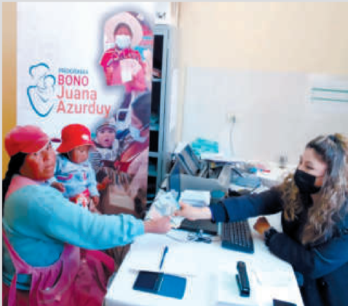
La redistribución de los ingresos, uno de los ejes del modelo económico.

PRINCIPIOS fundamentales tiene el Modelo Económico Social Comunitario Productivo.