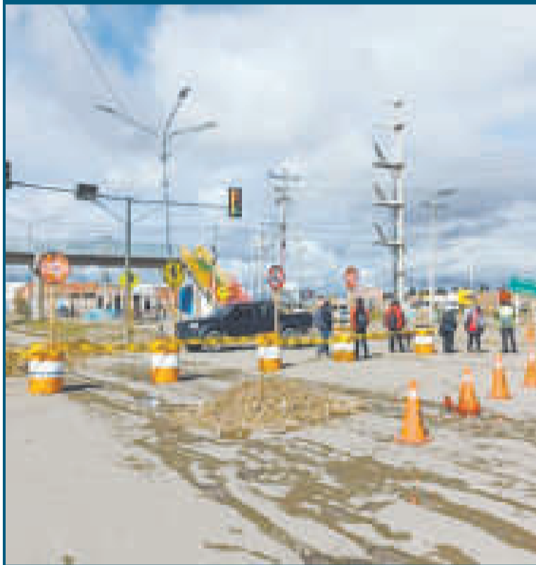
El pavimento de las carreteras es importante para el desarrollo económico.

El titular de Planificación afirmó que el Gobierno espera que la Asamblea Legislativa Plurinacional trate estos proyectos en los siguientes días.