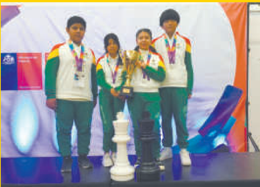
Integrantes del equipo nacional de ajedrez que consiguieron el subtítulo en los Juegos Estudiantiles.