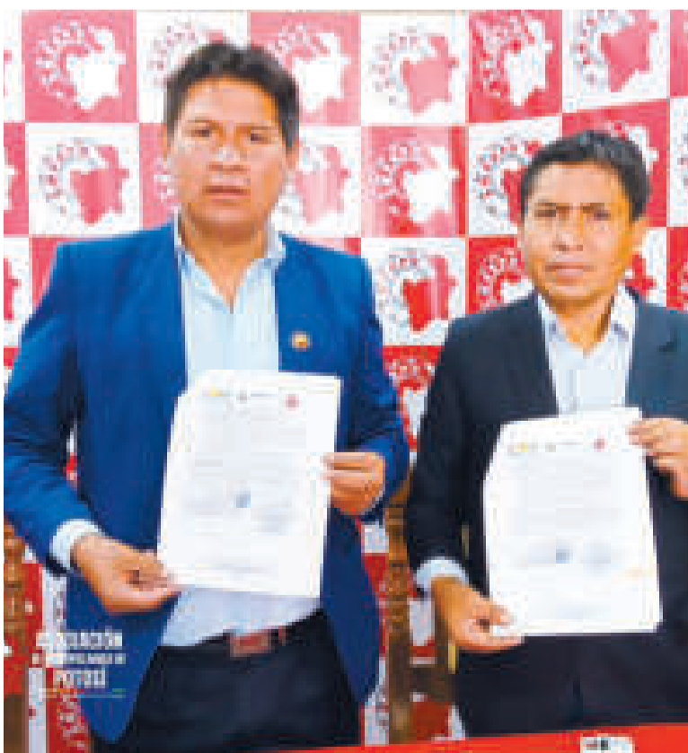
Autoridades muestran el convenio suscrito.

“Este convenio representa un hito significativo en la colaboración entre instituciones