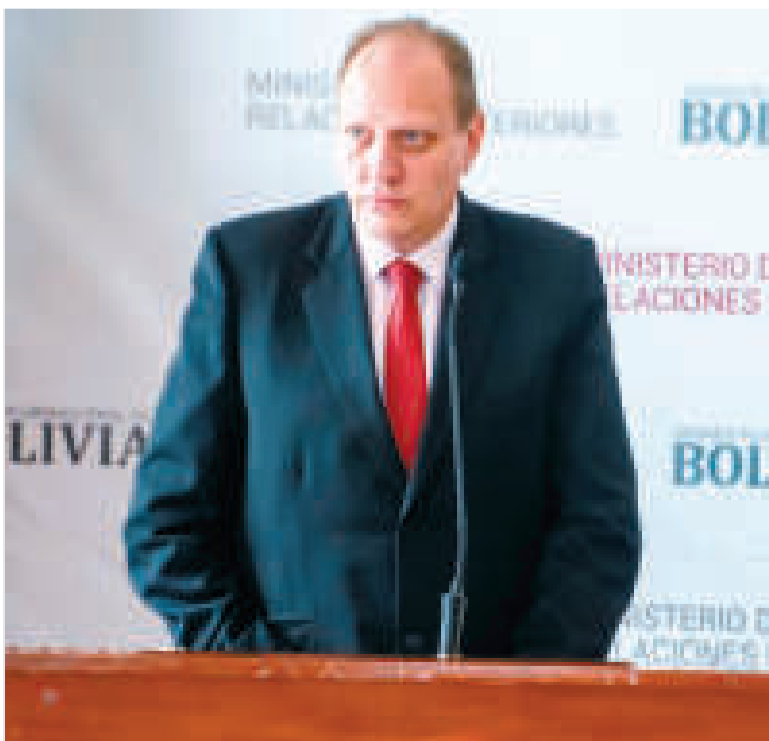
El viceministro de Comercio Exterior e Integración, Benjamín Blanco.