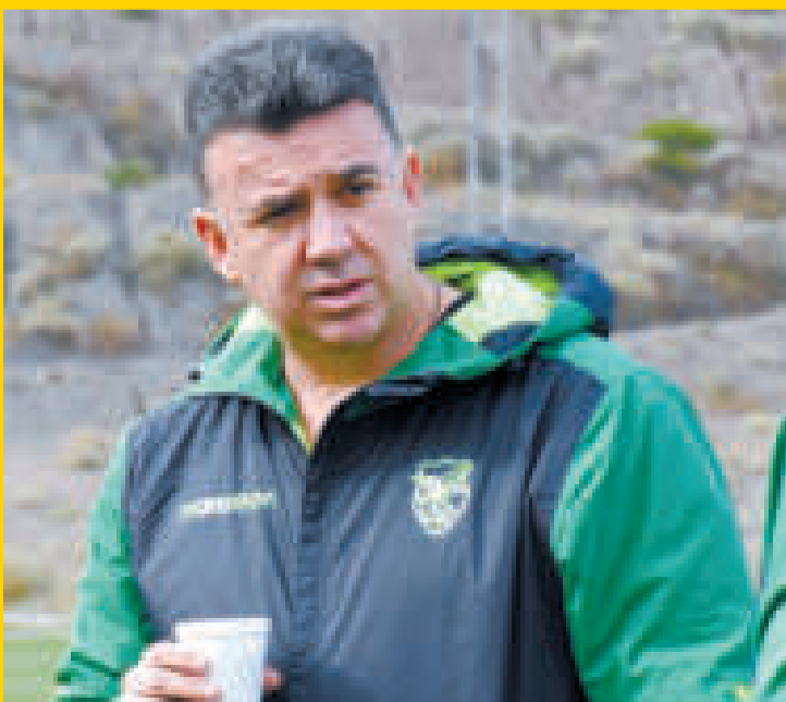
Julio César Baldivieso, gerente de selecciones de la Federación Boliviana de Fútbol.