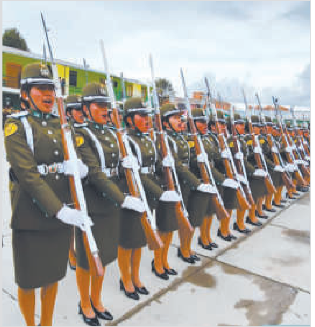
Integrantes de la Promoción Bodas de Oro, de la Facultad Técnica Superior en Ciencias Policiales.