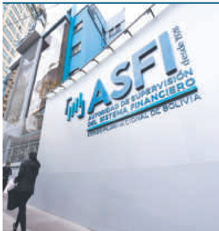
Frontis de la ASFI en La Paz.