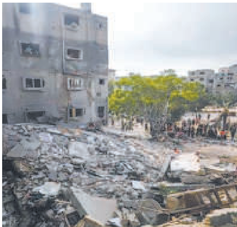
Imagen captada v a satelital.