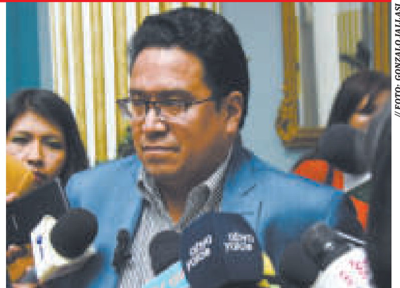
El procurador general del Estado, César Siles.