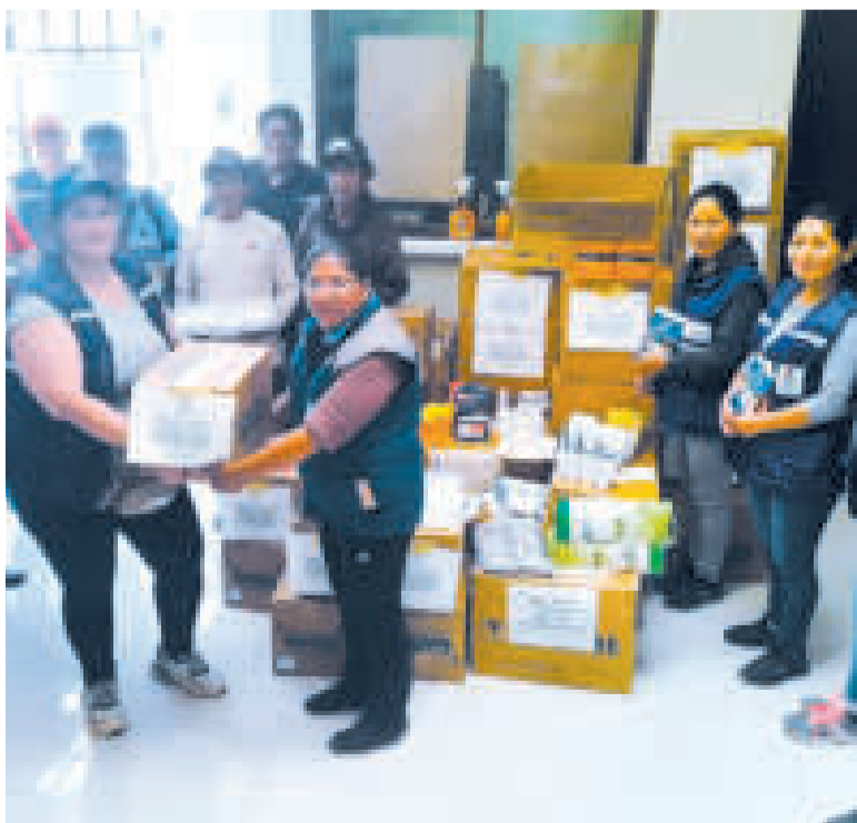
Personal del Ministerio de Salud entrega los fármacos.

“En el sector tenemos trabajando médicos especializados,