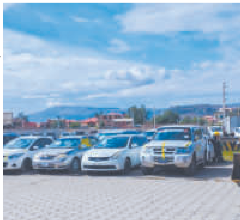
Parte de los motorizados ilegales.