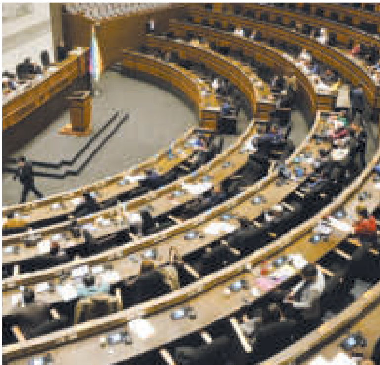
La Asamblea Legislativa.