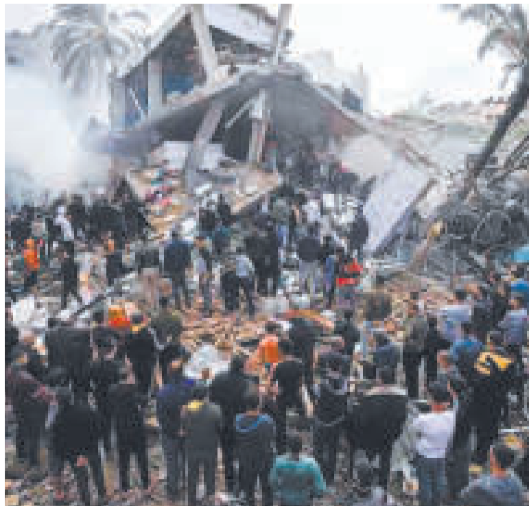
Una ciudad de Gaza devastada por los ataques israelíes.