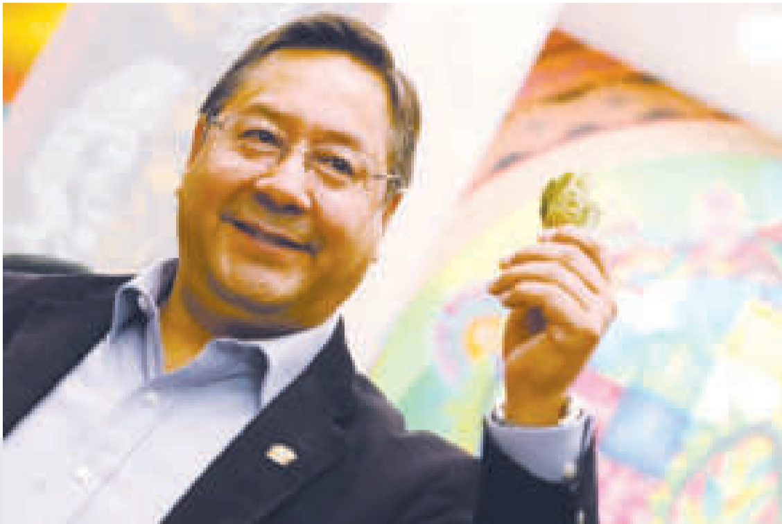
El presidente Luis Arce impulsa el proceso de industrialización de las materias primas del país.