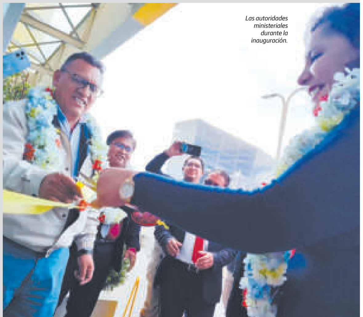
Las autoridades ministeriales durante la inauguración.

La viceministra Hidalgo destacó las gestiones para el fortalecimiento de las diferentes áreas del hospital de referencia en El Alto, donde miles de pacientes acceden a servicios pagados mediante el Sistema Único de Salud.