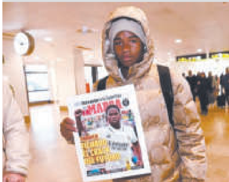
El joven delantero brasileño Endrick a su arribo a Madrid.

El contrato de Endrick con el Real Madrid, según cifras oficiales, se cerró por 72 millones de euros, el jugador tendrá un salario de tres millones anuales más variables y otros, hasta 2027, aunque renovable por tres años más.