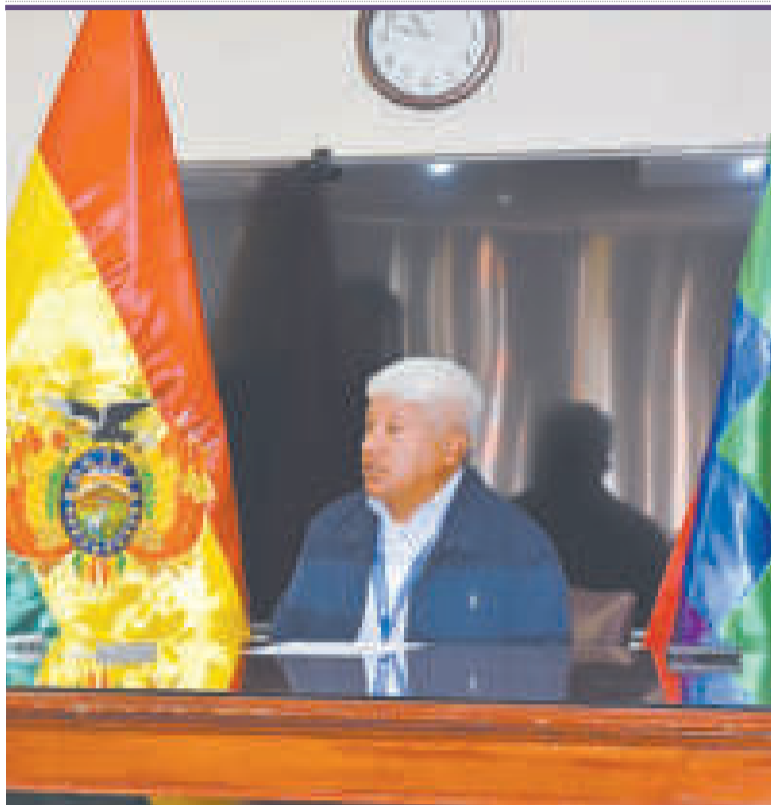
Reynaldo Pardo, presidente ejecutivo de Comibol.