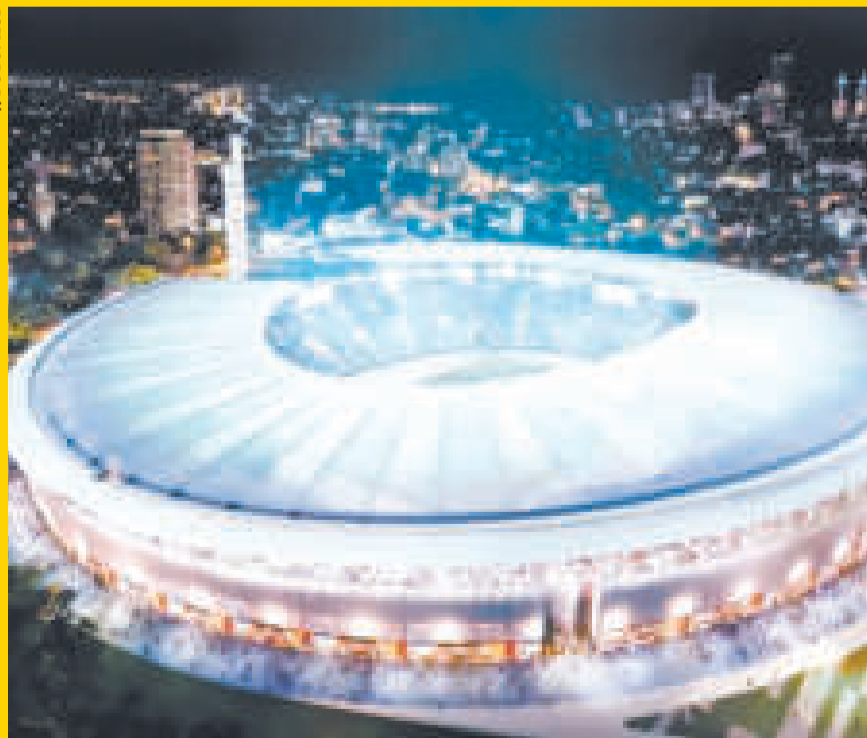
Así lucirá el estadio Centenario cuando reciba partidos del Mundial 2030.