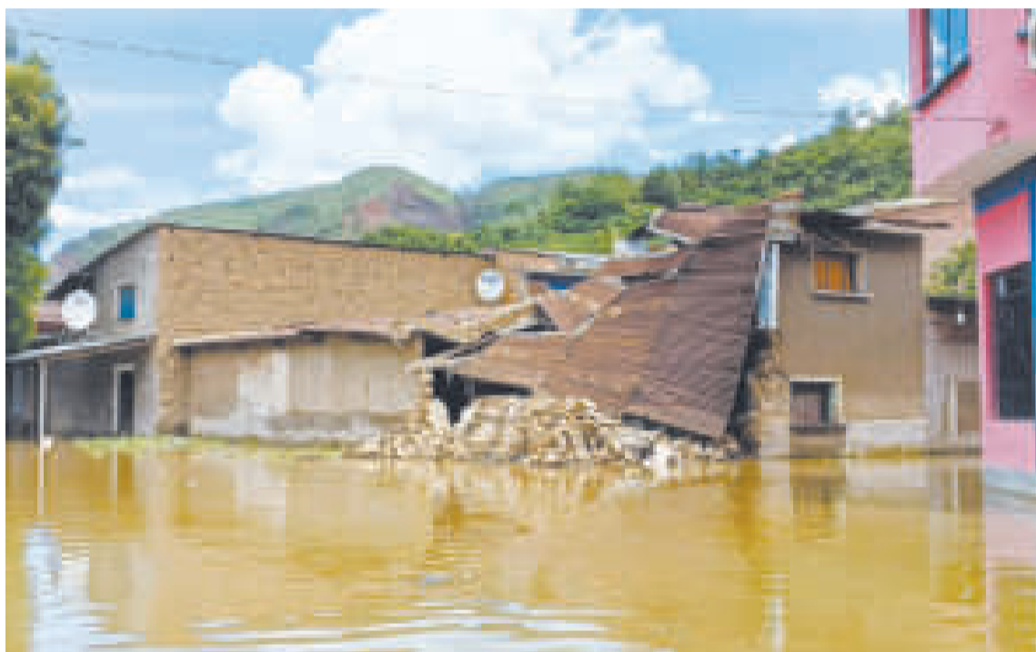
Una vivienda en Tipuani no soportó la fuerza del agua y se desplomó.