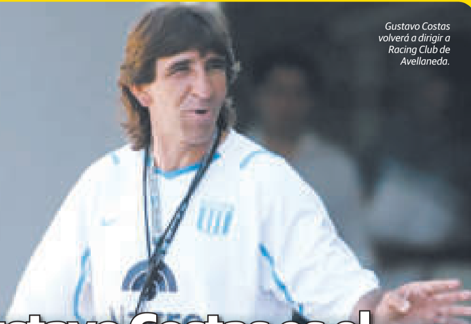
Gustavo Costas volverá a dirigir a Racing Club de Avellaneda.