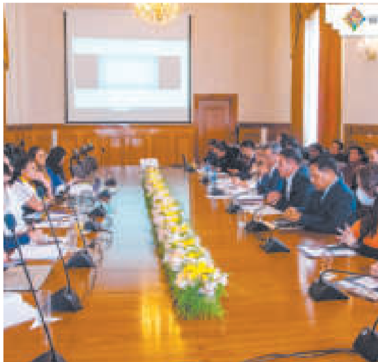
La VII Reunión de la Comisión Mixta de Cooperación entre Bolivia y Colombia.