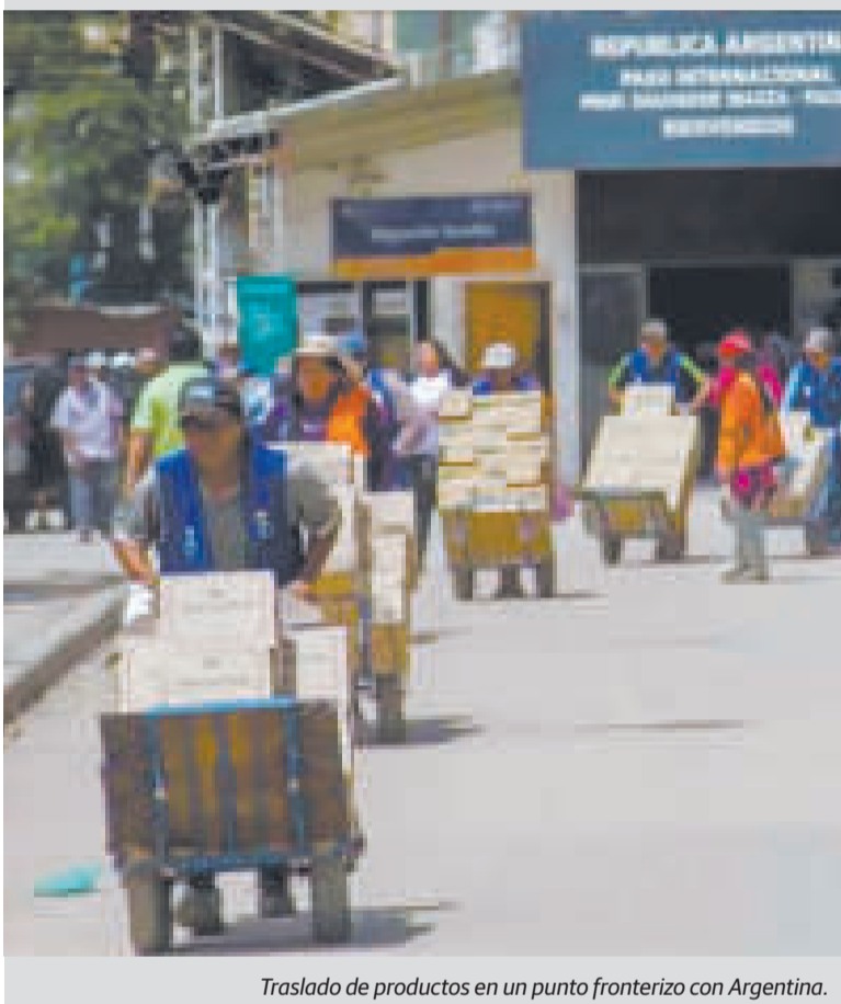
Traslado de productos en un punto fronterizo con Argentina.