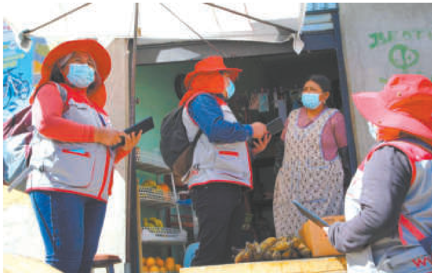
Los censistas voluntarios son los encargados de efectuar la encuesta de población y vivienda.

Arandia añadió que son varios los municipios que ya alcanzaron el 100% del registro de censistas voluntarios y que en el transcurso de las siguientes se-