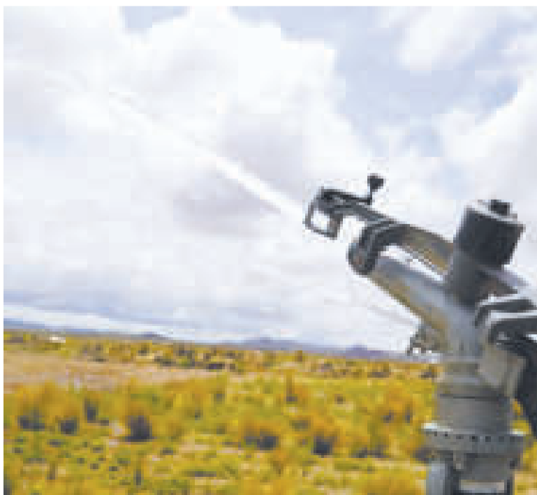
Los sistemas de agua entregados en La Paz.