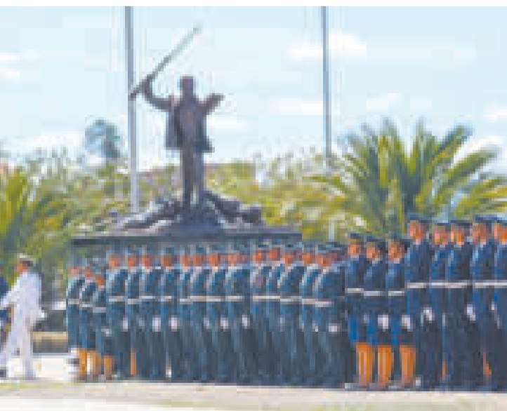
El Jefe de Estado pasa revista a las nuevas promociones.