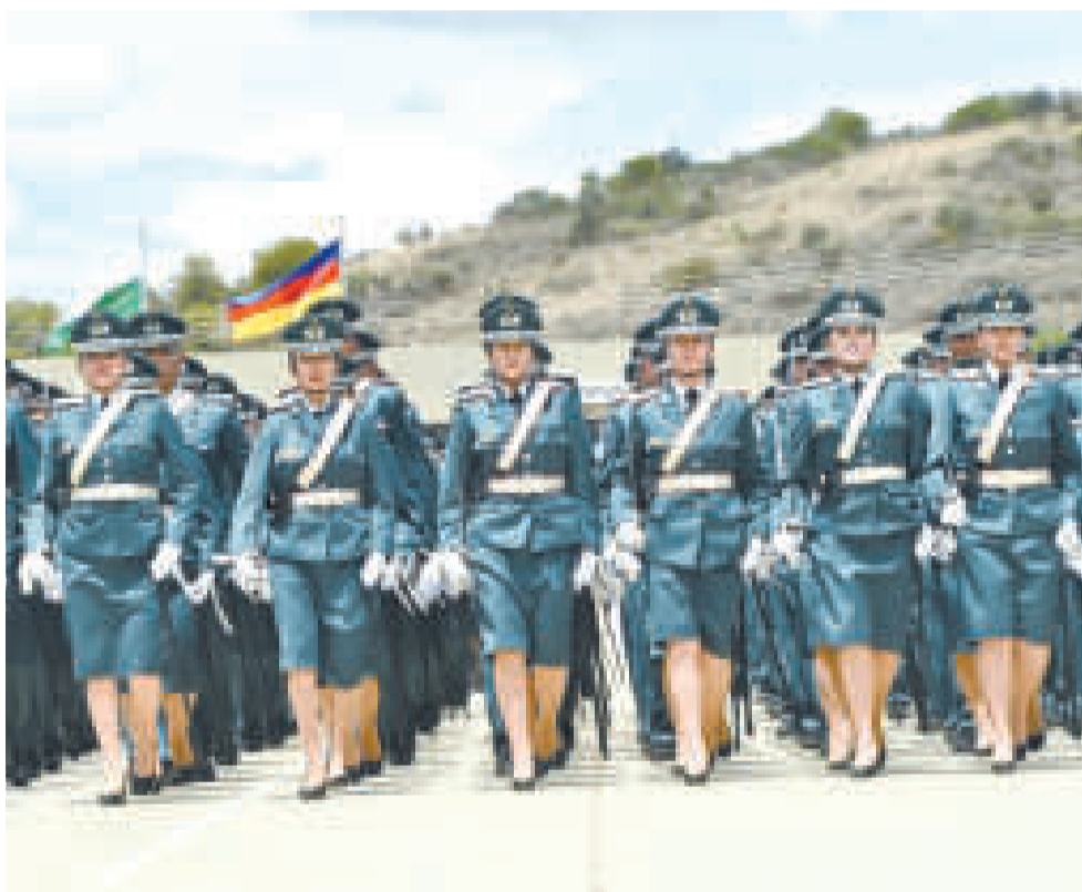
Subtenientes del Ejército, durante su paso por el paco oficial en el acto de graduación.

nía nacional. No podemos subordinarnos a geopolíticas de ningún país, ni los intereses de las oligarquías, tampoco debemos ceder a intereses imperiales del control del litio o de realizar corredores de exportación que favorezcan el Plan Capricornio para aislarnos como Estado”, remarcó Arce.