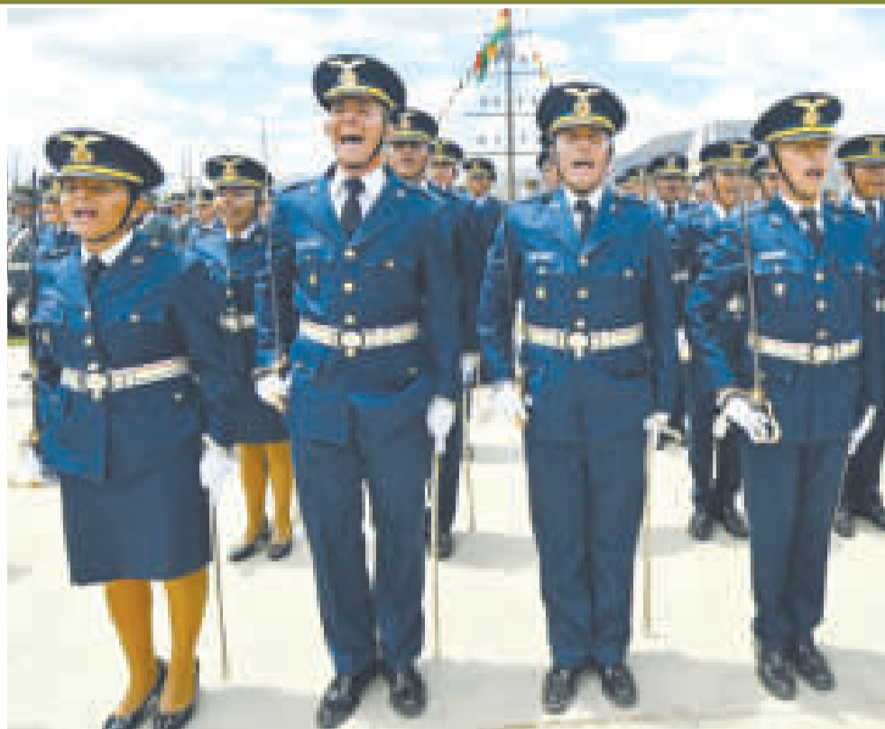
Nuevos subtenientes de la Fuerza Aérea Boliviana.

Luis Arce Catacora Presidente del Estado