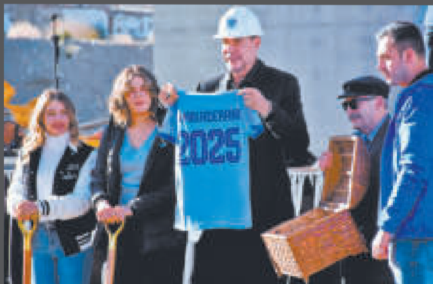
Claire prometió entregar el estadio de Tembladerani en 2025, con su salida esto se pone en duda.

El empresario no explicó las razones de su alejamiento, aunque en anteriores mensajes en sus redes sociales dijo que el fútbol boliviano no tenía credibilidad después de las denuncias sobre supuestos amaños y actos de corrupción, pidió una reestructuración total y urgente.