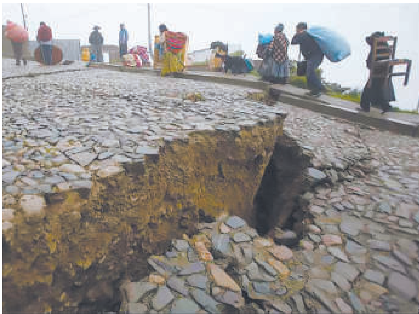
El gran deslizamiento que ocurrió en febrero de 2011 en la zona de Callapa, ubicada en el Macrodistrato San Antonio de La Paz.

Según la vicepresidenta del Concejo, hay ocho zonas en peligro, más de 8.800 personas que podrían ser afectadas y no existe prevención.