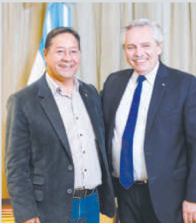
El presidente Luis Arce y el mandatario argentino, Alberto Fernández.