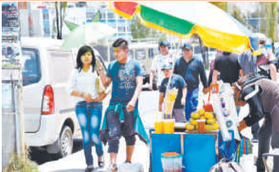
Las temperaturas altas están rompiendo récords históricos.

La Unidad de Alimentación y Nutrición, dependiente del Ministerio de Salud y Deportes, hizo inspecciones a plantas de sal, harina de trigo y aceite vegetal de Santa Cruz, La Paz, Cochabamba, Tarija, Potosí, Chuquisaca y Oruro, mientras que Beni y Pando no tienen plantas de esa índole.