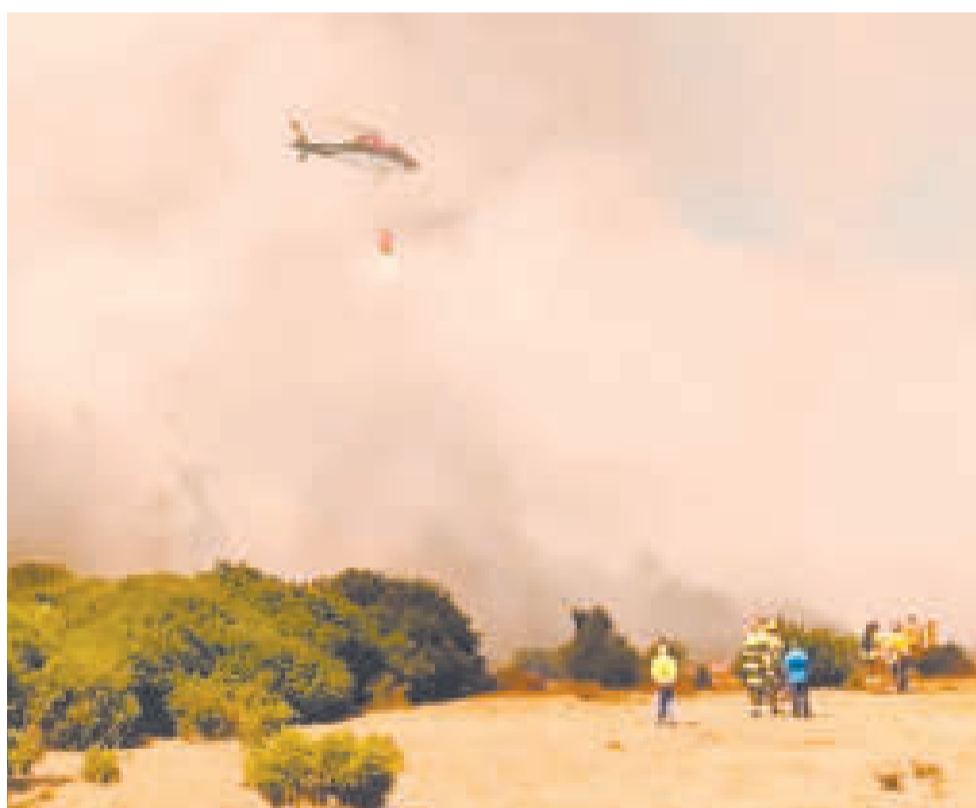
Operaciones aéreas para sofocar incendios en el municipio de San Buenaventura.