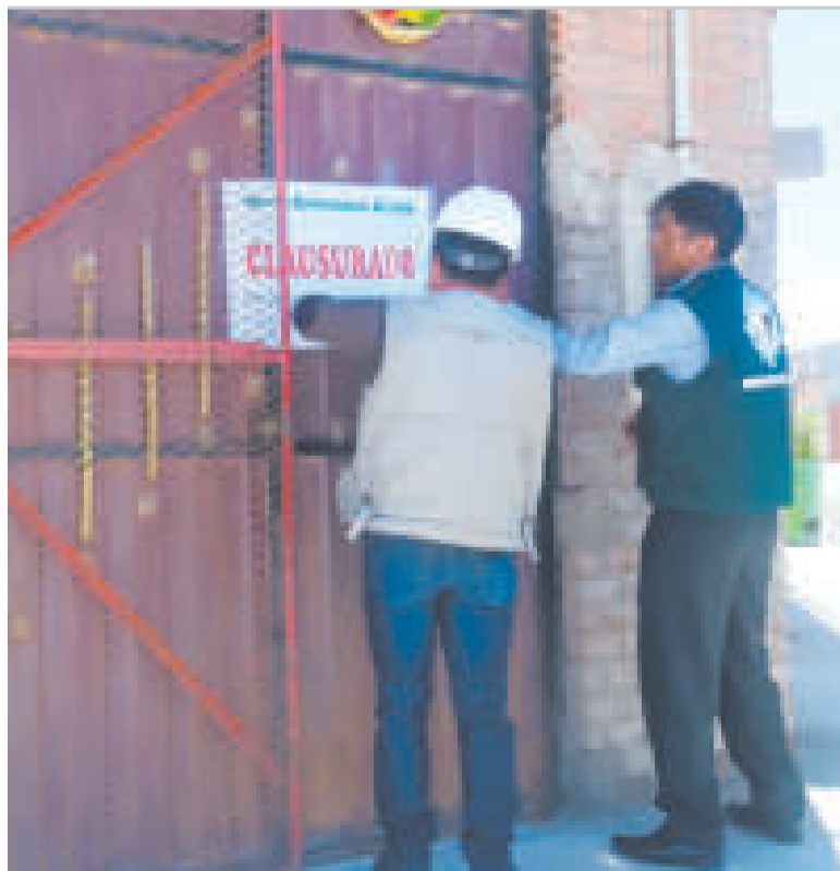
Funcionarios estatales clausuran una fábrica de sal en Oruro.