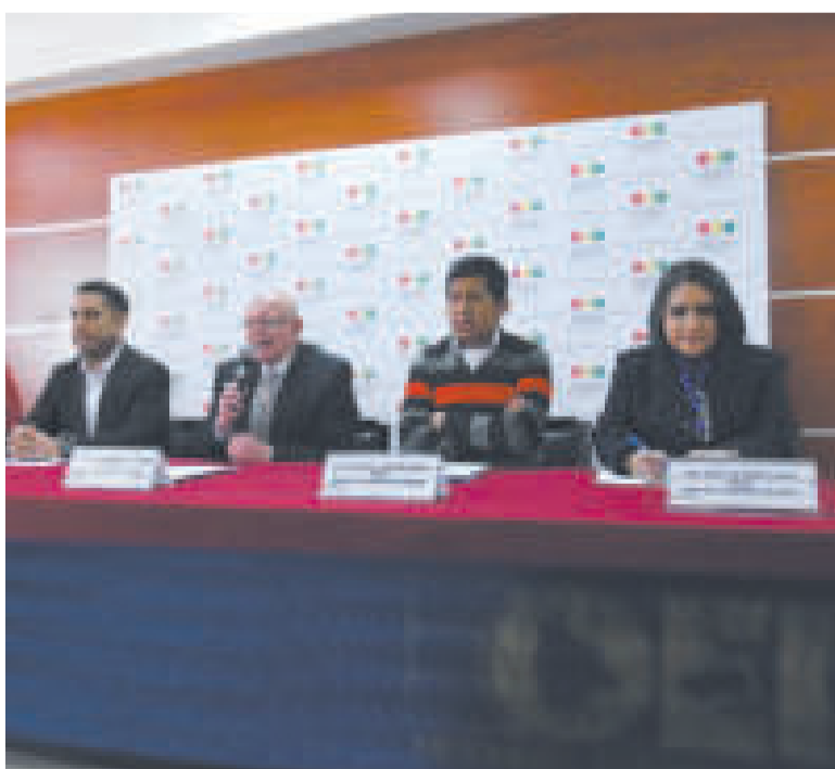
Vocales del TSE.