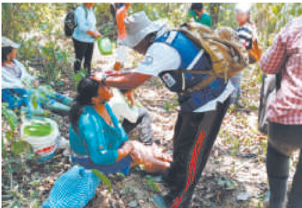
Brigadas médicas atienden a las personas afectadas por los efectos de los incendios.

Calvimontes detalló que desde junio 59 incendios fueron sofocados en el departamento de La Paz con la movilización de 2.049 bomberos forestales; 31 incendios en el Beni con 1.080 bomberos forestales; 25 quemas en el departamento de Santa Cruz y se movilizó a 1.067 bomberos forestales; y 22 incendios en Cochabam- ▶