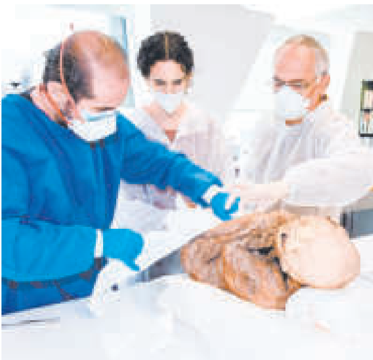
Una de las tres momias de la época precolombina.