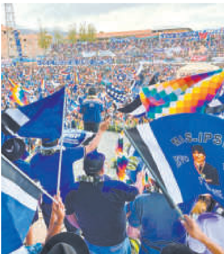
Militantes del MAS en una actividad.