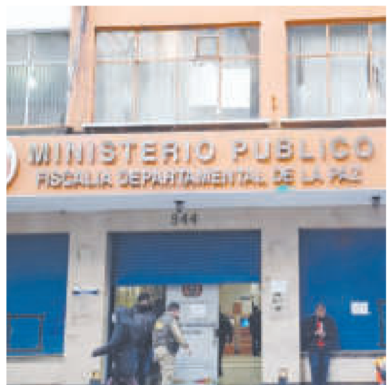
Vista del acceso principal de la Fiscalía en La Paz, sobre la calle Potosí.

DE OCTUBRE FUE PLANTEADA la denuncia del expresidente en contra del hijo del Jefe de Estado.